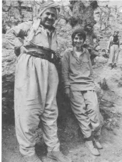
له گه ل هيروخان - ناوزهنگ ۱۹۷۹