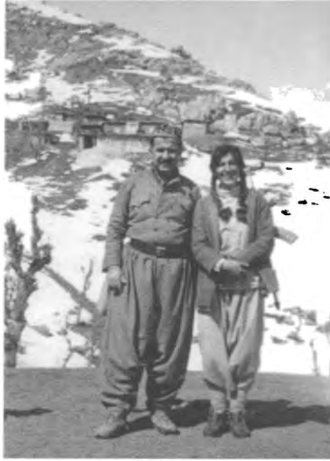
له گه ل هيروخان ۱۹۸۲ - ناوزهنگ