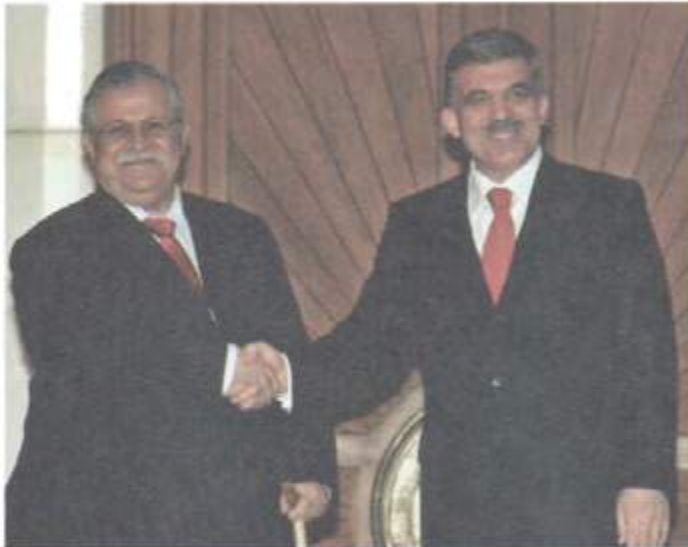
لەگەن سەرۆك كۆمارى پێشوی توركیا، عەبدوئەللا گول