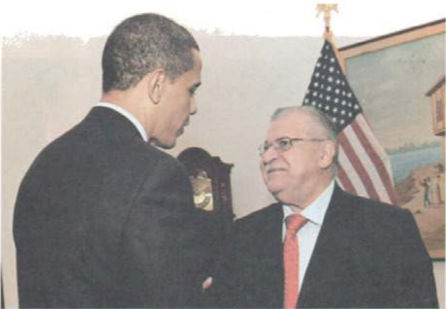
له گهڻ سهرۆك پيشوى ولاته به كگرتوه كانى نه مريكاي. بارهك ئوباما