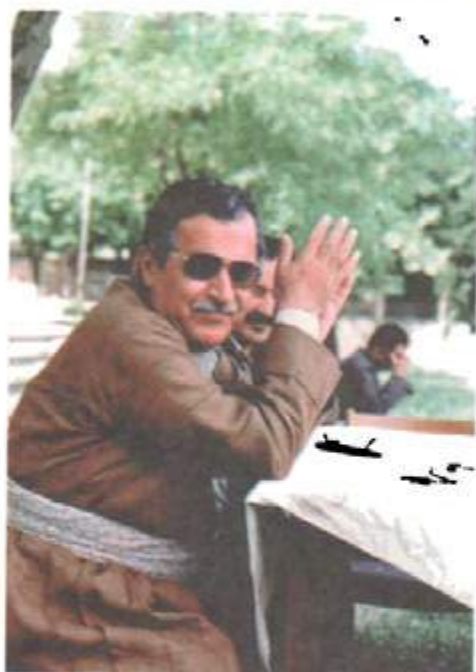
لەگەل جەسەن كۆستانى