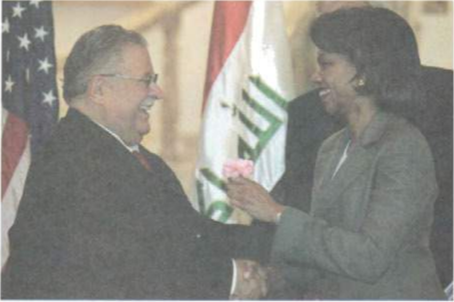
لهگه‌ل راوێژکاری ئاسایشی پێشوی ولاته به‌کگرتوه‌کانی ئەمریکا، کۆئەلیزا رایس