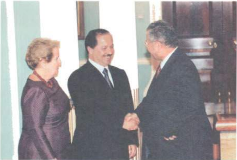
لەگەڵ مەسعود بارزانی و مادام ئۆلبرايد لە کاتی مۆرکردنی رێککەوتنامەى واشنتۆن ۱۹۹۸/۹/۱۷