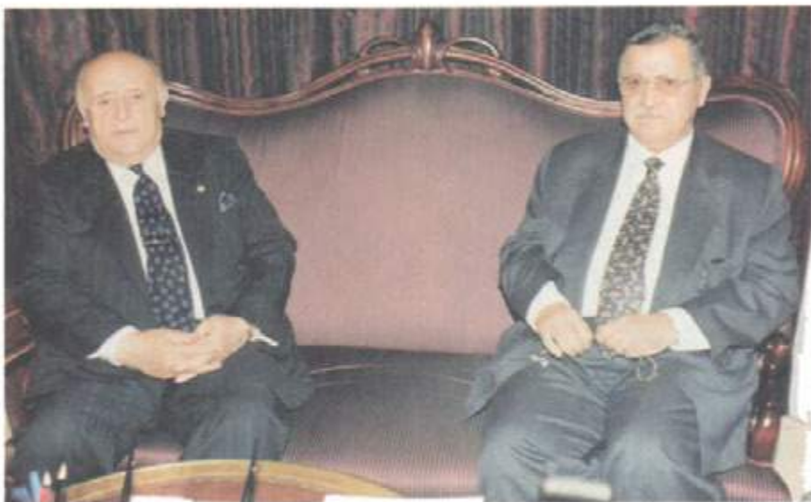
لەگەل سەرۆك كۆمارى پىشوى ئوركيا سلىمان دىمىرئىل