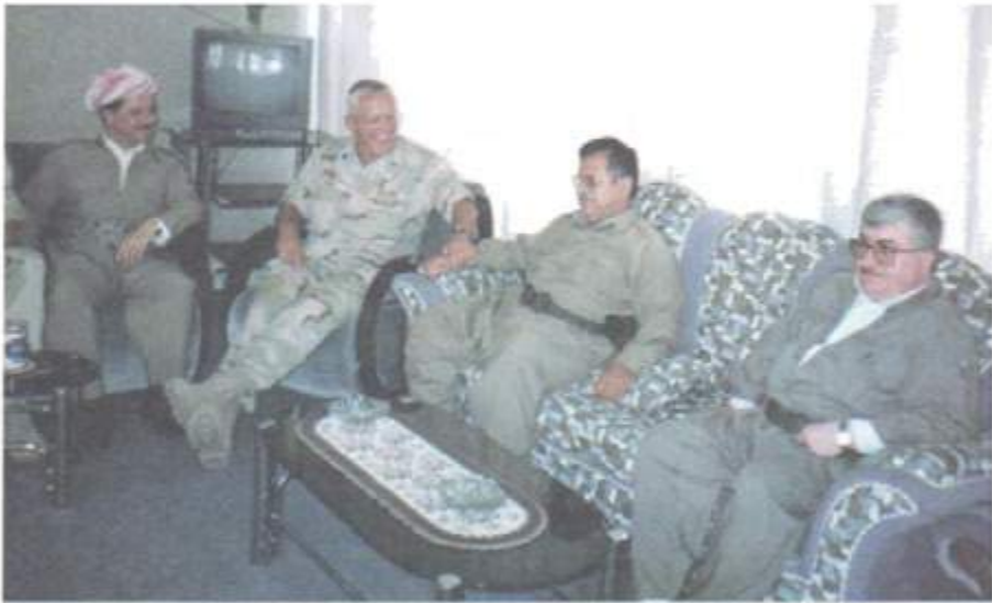
له راستهوه؛ د فواد مه عسوم، مام جهلال، کۆلۆتئیلی ئەمریکی ریشارد ناب و مه سعود بارزانی. سهرهتای رابه رین