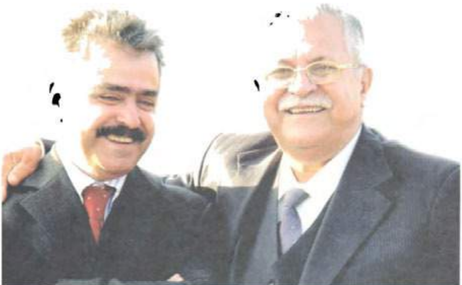
له گەل ئامادەکاری ئەم دیدارە