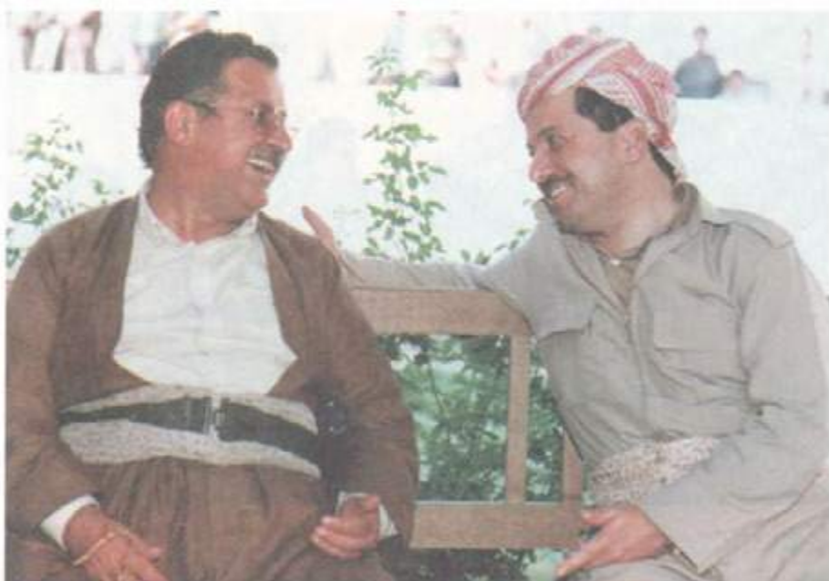
باس و خواسی هاوبهش ۱۹۹۲