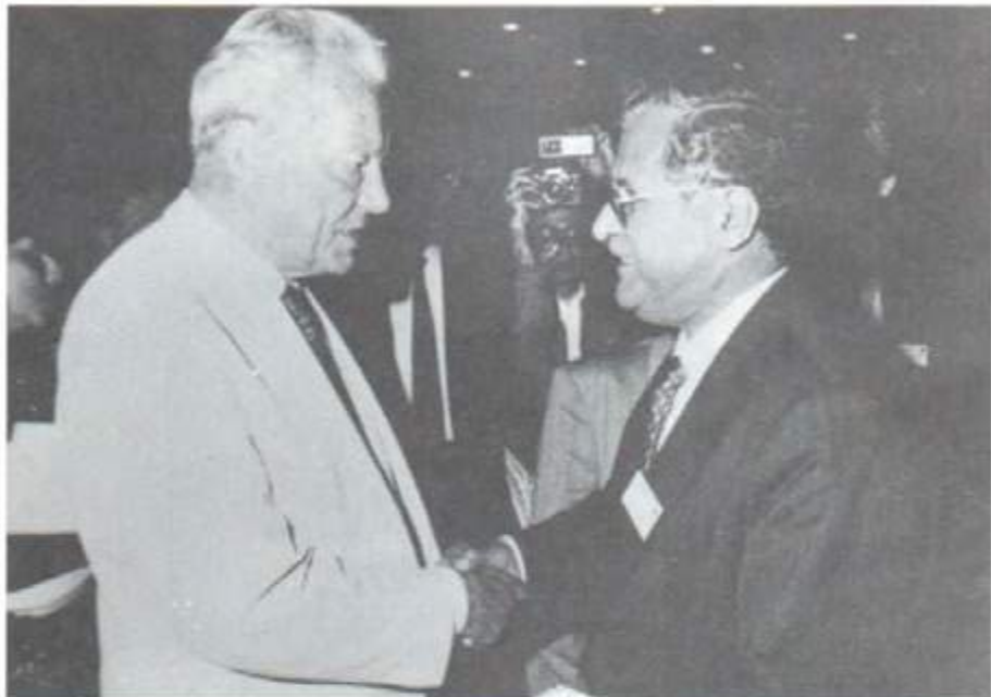
له گه‌ل سه‌رۆک حکومه‌تی (موسته‌شار) پتشیوی ئە‌لمانیا فیلی براند