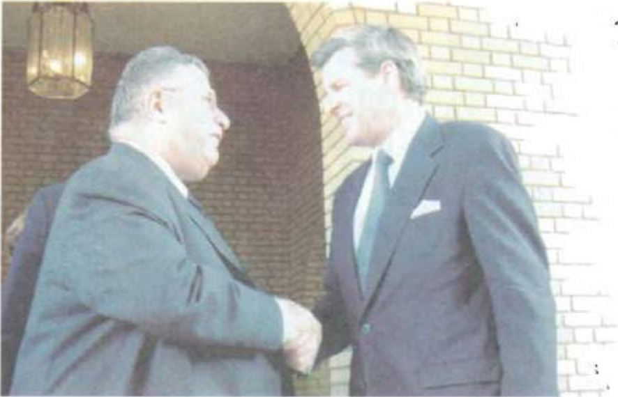
لهگه‌ل حاگمی پێشوی کاتی عێراق، بۆل بریمەر