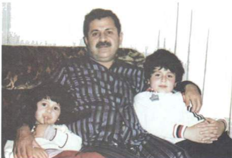
له گه ل قوباد و بافل