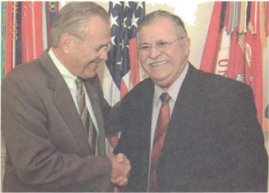
لهگه‌ل وه‌زیری به‌رگری پتشیوی ولاته به‌کگرتوه‌کانی ئەمریکا، دۆنالد رامسفیلد