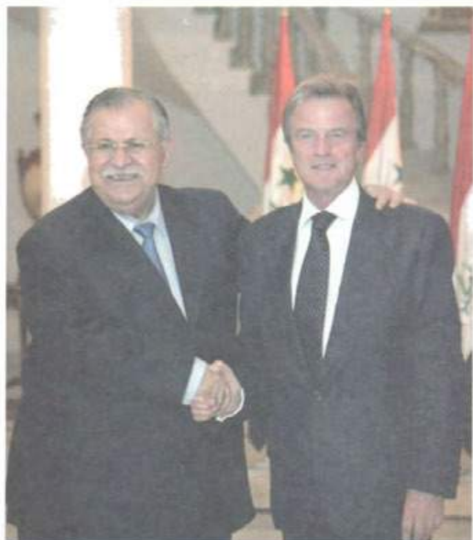
لهگهژ وهزیری دهره وهی پنشوی فرهه نسا و دوستی دتیرینی کورد بئرنارد کوشهر