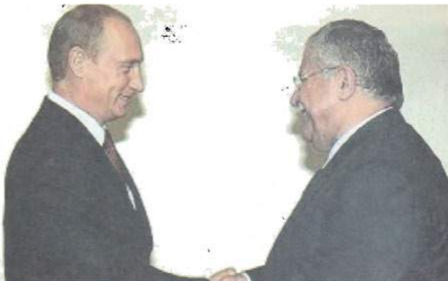
لەگەژ سەرۆکی روسیا. فلادیمیر پوتین