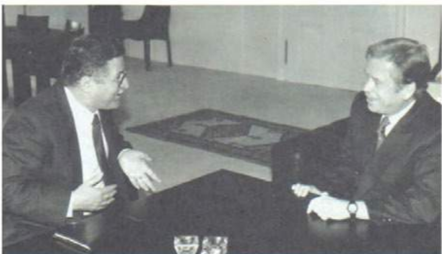
لەگەڵ سەرۆک کۆماری یتشوی چیک، براتسلاڤ ھاڤل