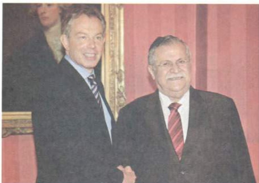
له گهڻ سهرۆك وهزيرانى پيشوى ئينگلته را. تونى بليز