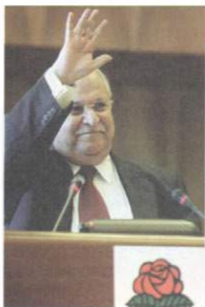
لە كۆنگرەى سۆسيالىستى جيهانى