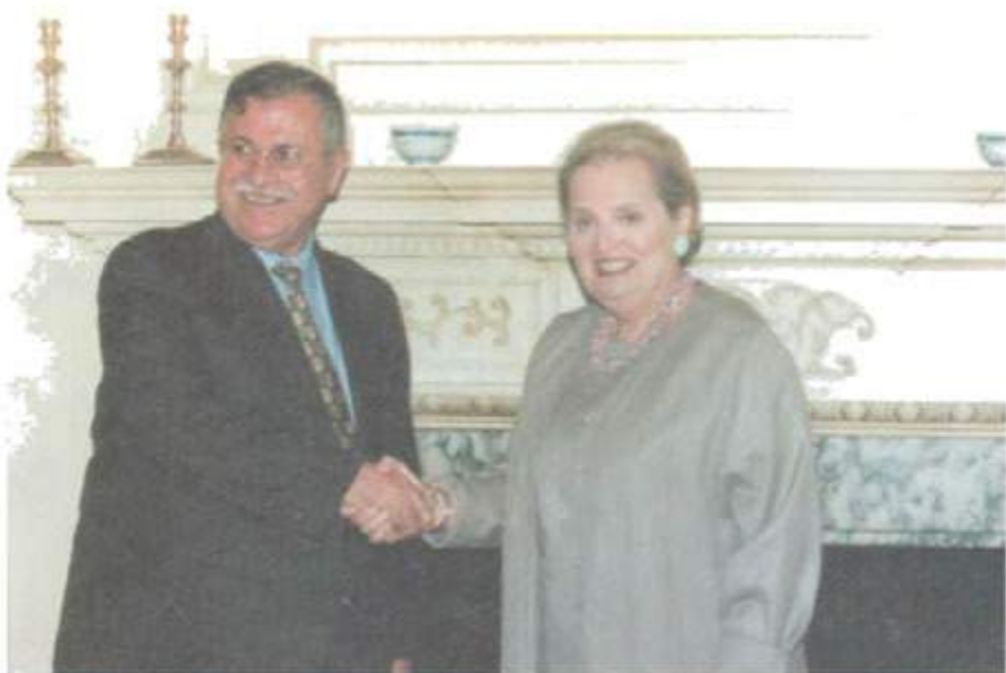
لہگہل وزیر دہرہوہی یتشوی ولاتہ بہ کگرتوہکانی ئەمریکا، مادلین ٹولبراید