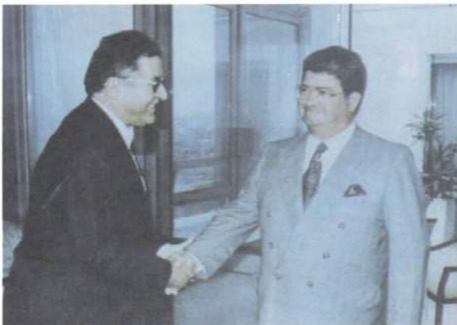
لەگەل سەرۆك كۆمارى پىشوى ئوركيا، ئورگوت ئۇزال