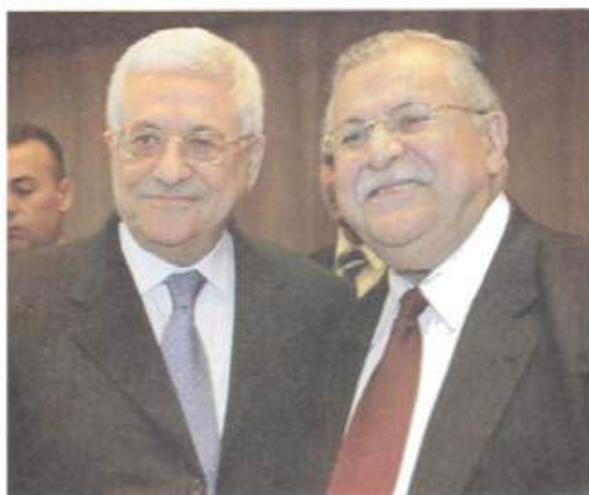
لەگەل سەرۆکی فەلەستین، مەحمود عەباس