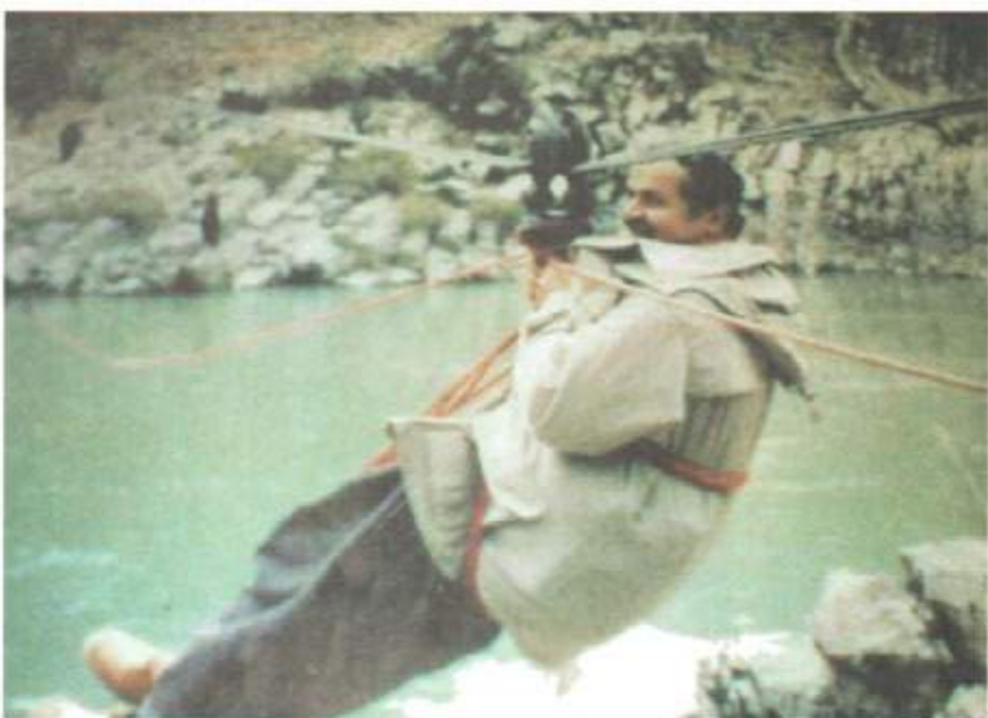
مام جلال له سالی ۱۹۸۶ به سیم له سنوری ماوت- نیوان گونده‌کالی بهرگورد و کاکي ده‌په‌رینه‌وه