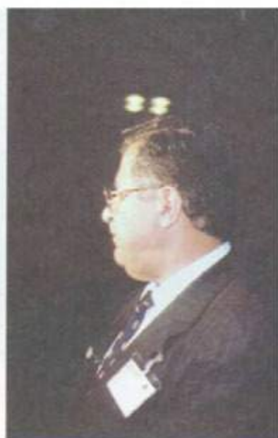
لە كۆنگرەى سۆسيال ديموكراتى جيهانى بەريين 1992/9/12