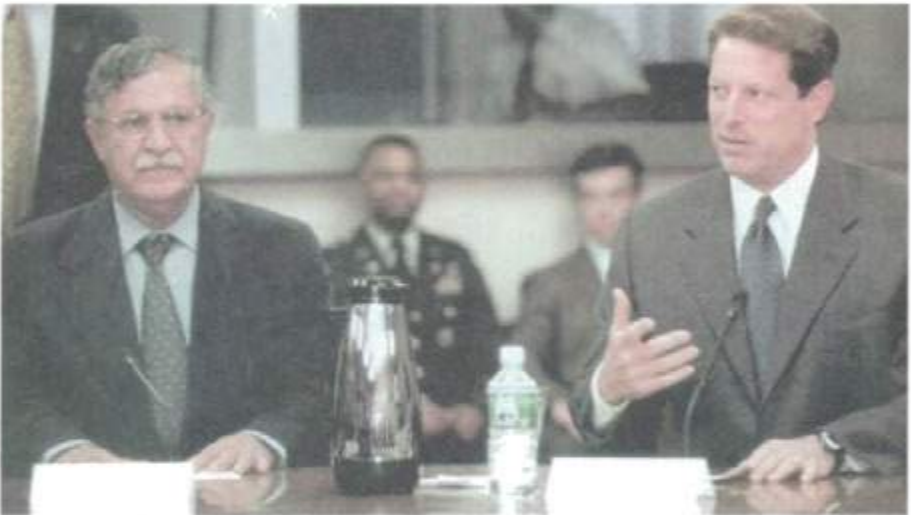
لەگەڵ جیگری پێشوی سەرۆکی ولانە بە کگرتوہکانی ئەمریکا - ئەل گۆر