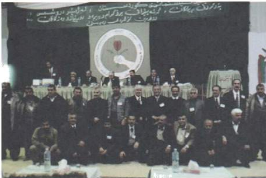
پيشمەرگە سەرەتاييەكانى ۱۹۷۶ى يەكيتى لە كۆنگرى دوھەمدا - كانونى يەكەمى ۲۰۰۱