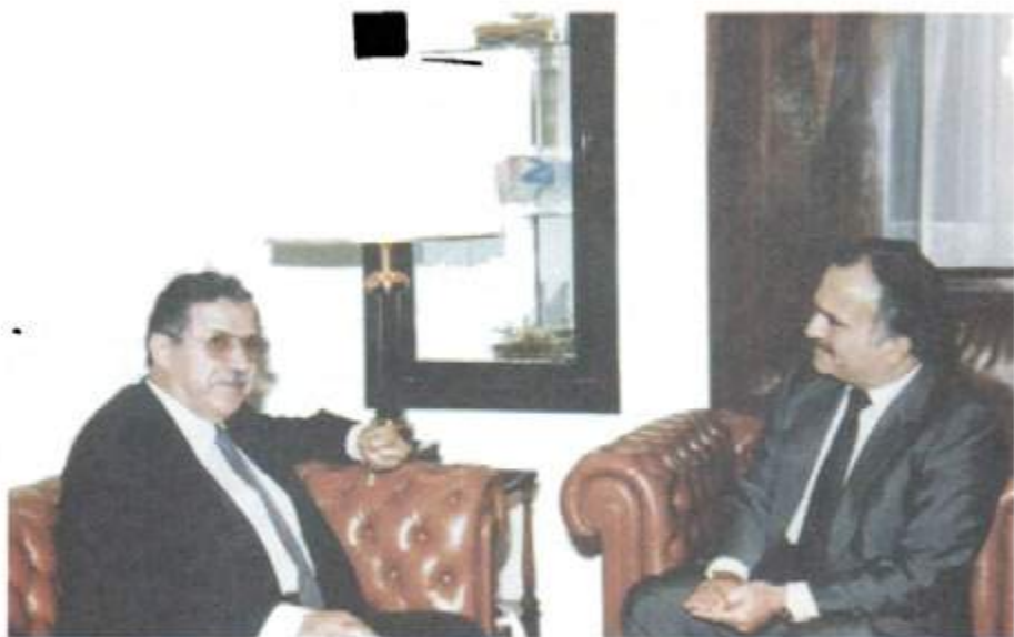
له گه‌ل جینشینی پښوی مه‌لیکی نوردن، حه‌سه‌نی برای مه‌لیک حسین