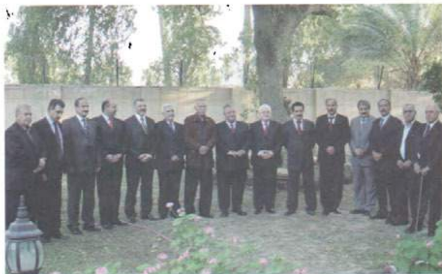
به شینگی زۆری پێشوی مه کته بی سیاسی به کیتی