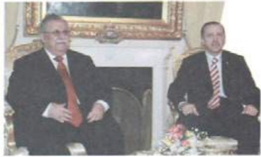
لەگەن سەرۆك كۆمارى توركیا، رەجەب تەيب نۇردوگان