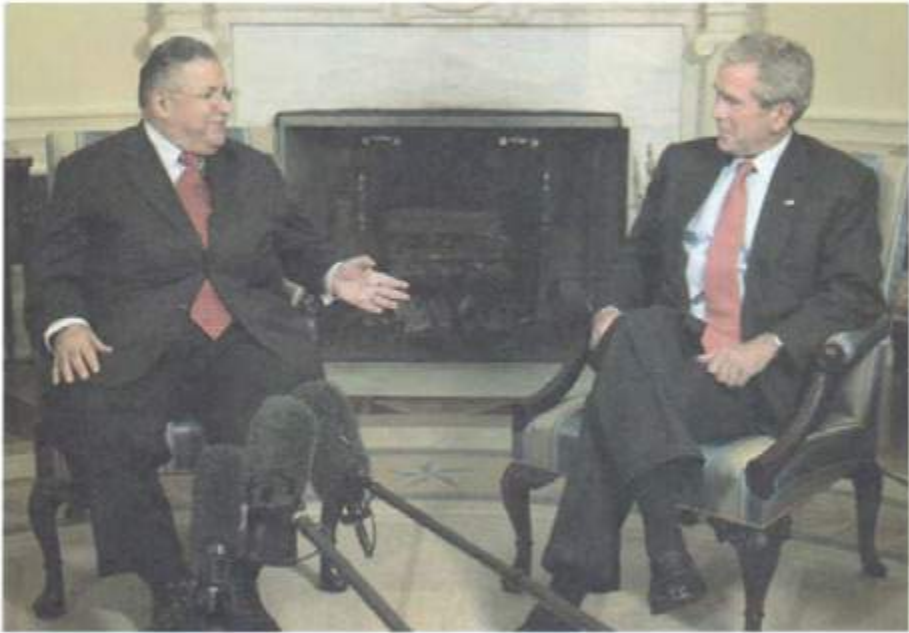
له گهڻ سهرۆكى پيشوى ولاته به كگرتوه كانى نه مريكاي. جورج بوش