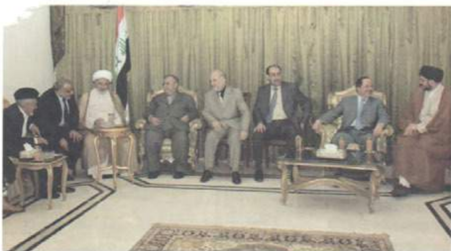
لهگه‌ل کۆمه‌نیک سه‌رکرده‌ی کورد و عێراقی