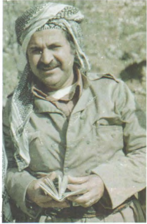
له سردھمی شاخ