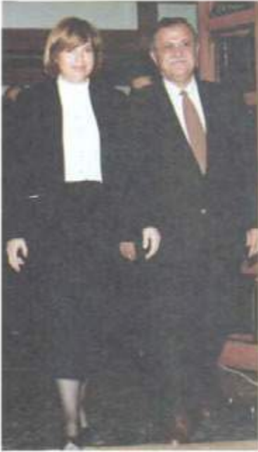
لەگەن سەرۆك وەزیرانی پێشوی توركیا، تانسۆ چیلەر