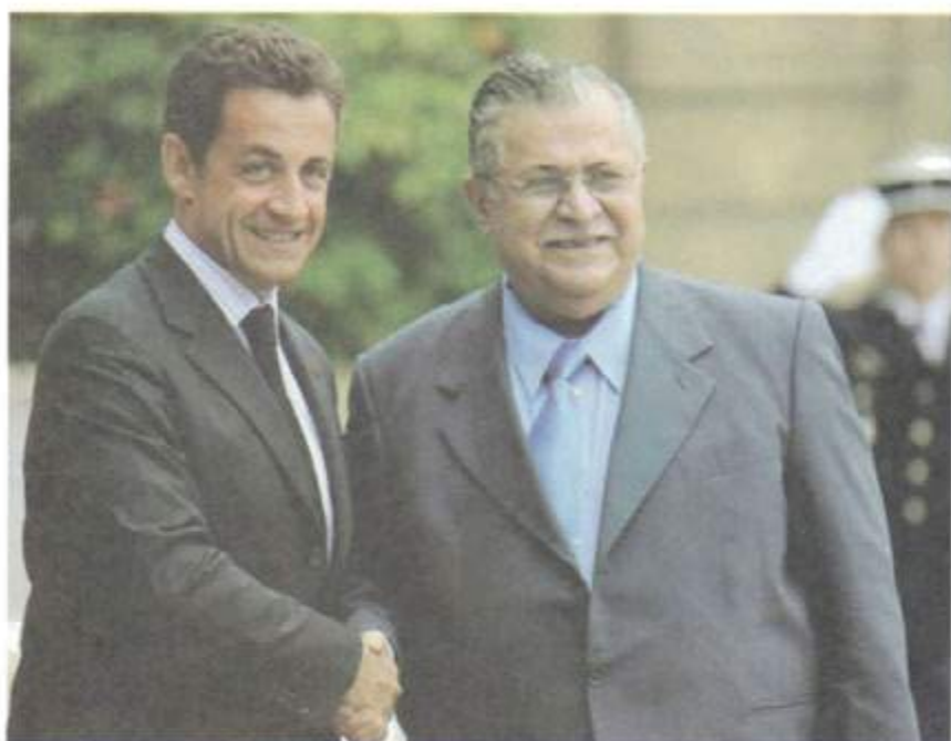
لەگەل سەرۆك كۆمارى فەرەنساى ینشو نیکۆلاس ساركۆزى