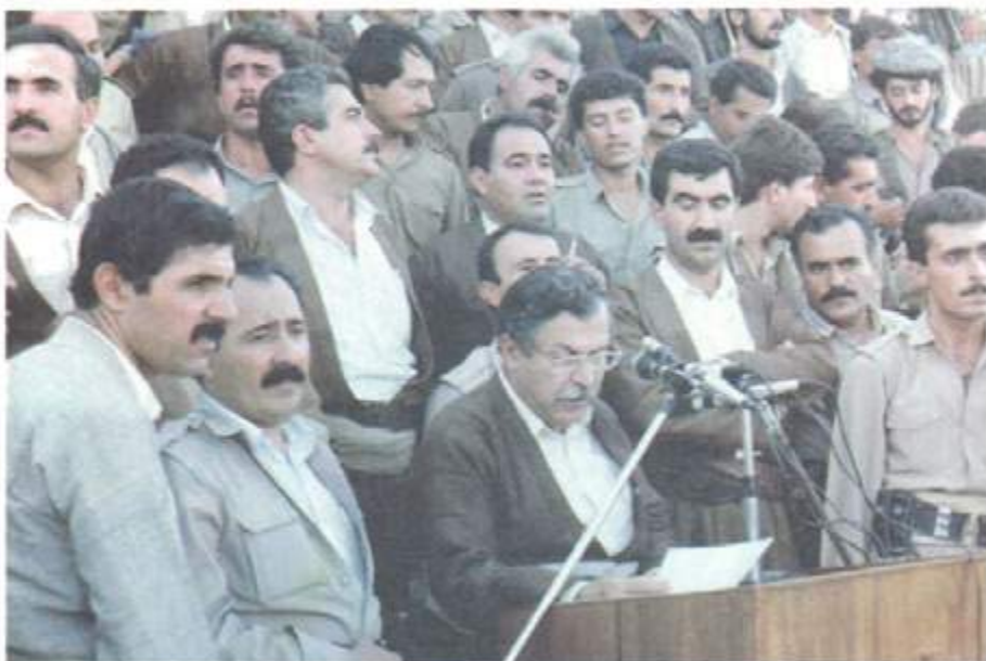
۱۹۹۱/۹/۲۹ کۆبهنه وه به کی جه ساوه ری له ههولیر