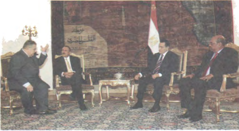
لای راسته‌وه؛ سه‌روکی سودان، عومەر حه‌سه‌ن به‌شیر، سه‌روکی میسری یتشو حوسنی موباره‌ک، سه‌روکی یه‌مه‌نی یتشو، عه‌لی عه‌بدوئلا سالح له‌گه‌ل مام جه‌لال