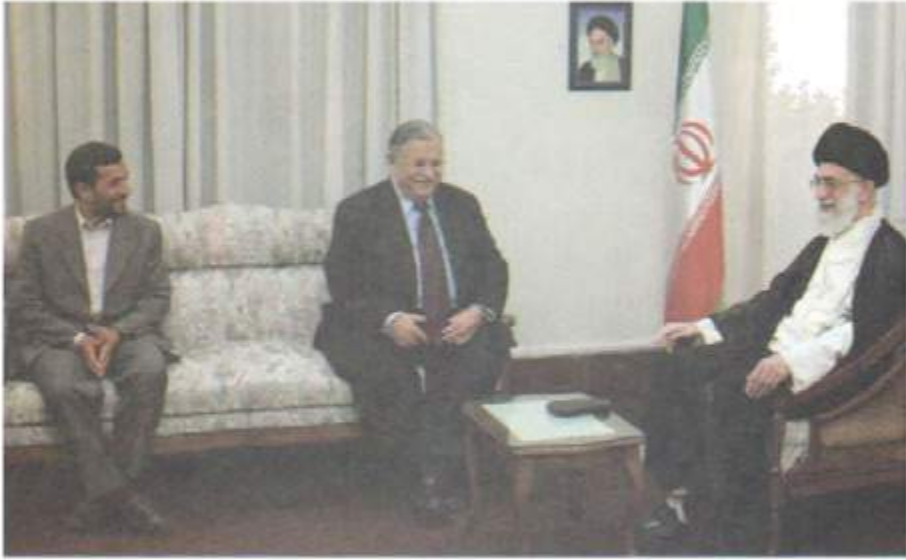
لاي راسته‌وه؛ عهلى خامنه‌ئى، رابه‌رى كۆمارى ئىسلامى، مام جەلال و سەرۆك كۆمارى ئىرانى پىشوو ئەحمەدى نەجات