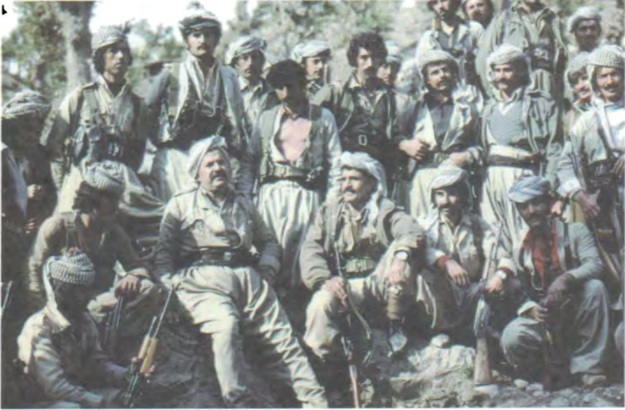
له گه ل پۆلنك پنشمه رگه - توژه له ١٩٧٩