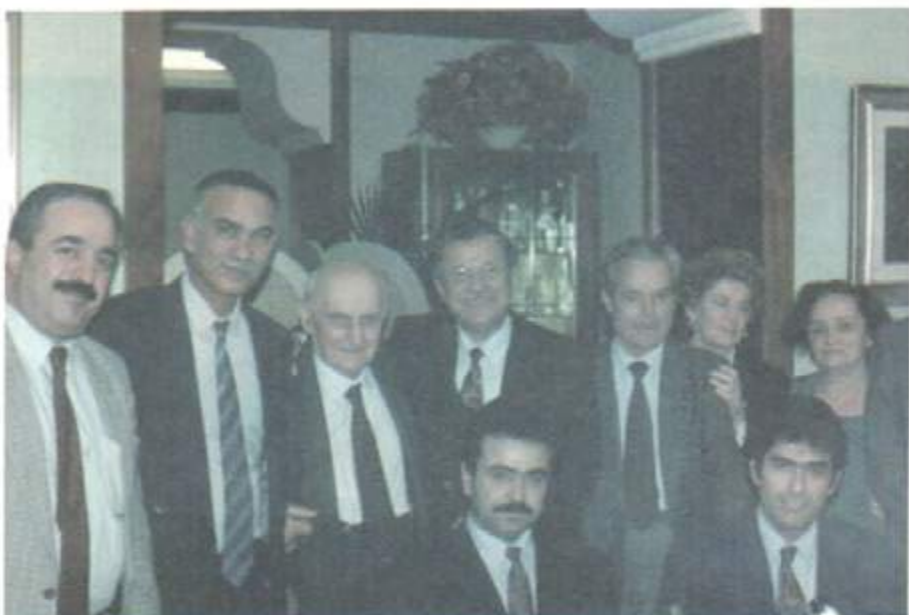
۱۹۹۶/۴/۲۳ - ئیتالیا، له گه ل نوته رانی پارتیزانانی دێرینی ئیتالیا