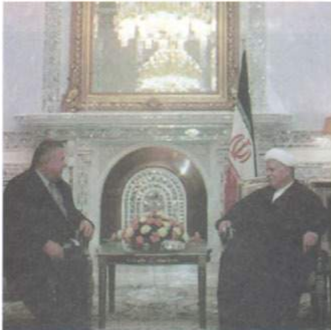
له‌گه‌ل سەرۆك كۆمارى پىشوو ئىران نه‌كبه‌ر هاشمى ره‌فسه‌نجانى