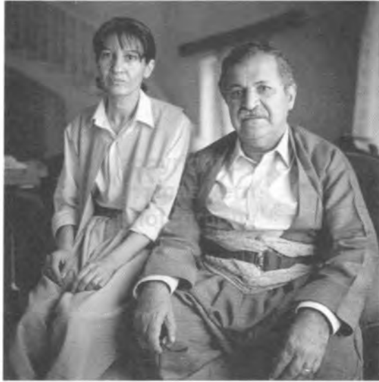
له گه ل هيرؤخان، هاورتي و هاوسهر