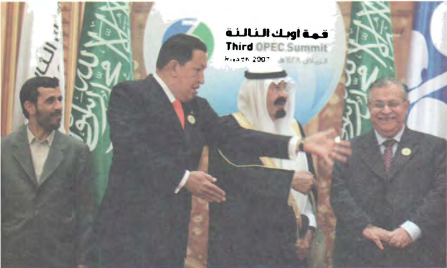
لای راسته‌وه؛ مام جه‌لال، مه‌لیکی سه‌ودییه‌ی یتشو، عه‌بدوئلا‌ی کوری عه‌بدو‌لعه‌زیز و سه‌روکی یتشوی فه‌نزویلا، هوگو چاقیز و سه‌روکی یتشوی کۆماری ئیران نه‌حمه‌دی نه‌جات