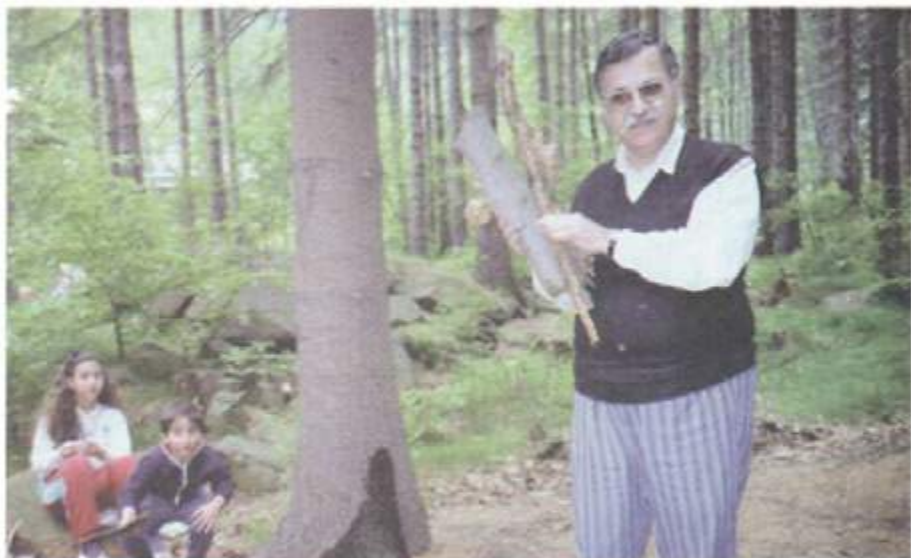
سه يرانتيكى خومانى له كۆمارى چيگ - ۱۹۹۰/۵/۱۱