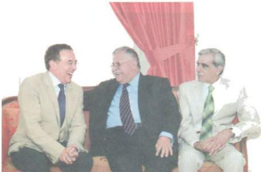
لای راست؛ ئه ندام په ره مانێ تورکیا و که سایه تی کوردی ناسراو ئه حمه د تورک، مام جهلال. سکرتهیری گشتی سۆسیال دیموکراتی جیهانی. لويس نایالا