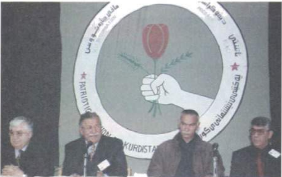
به‌شێ له ده‌سته‌ی دامه‌زرینه‌ری به‌کیتی له کۆنگره‌ی دوهم- کانونی یه‌که‌می ۲۰۰۱