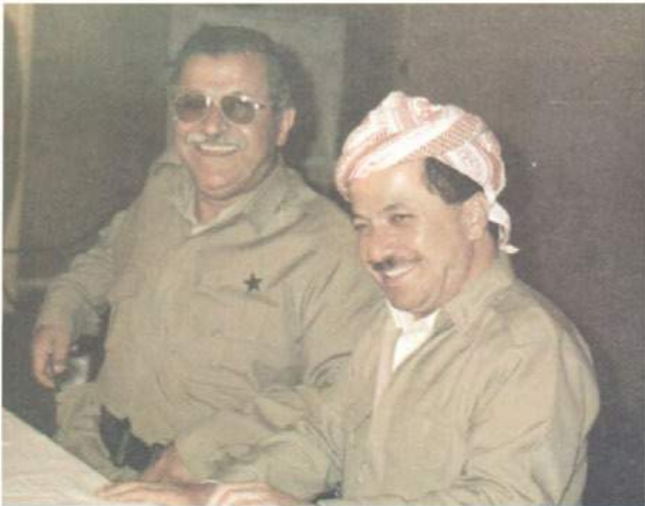
سهرهتای رابه رین