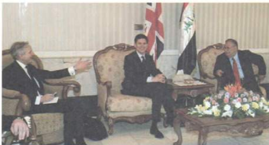
له گه‌ل بائیۆزی پتشیوی ئینگلته‌را کریستۆف به‌رنس له عێراق و وه‌زیری ده‌ره‌وه‌ی پتشیوی هه‌مان وڵات دێقید میلبه‌ند