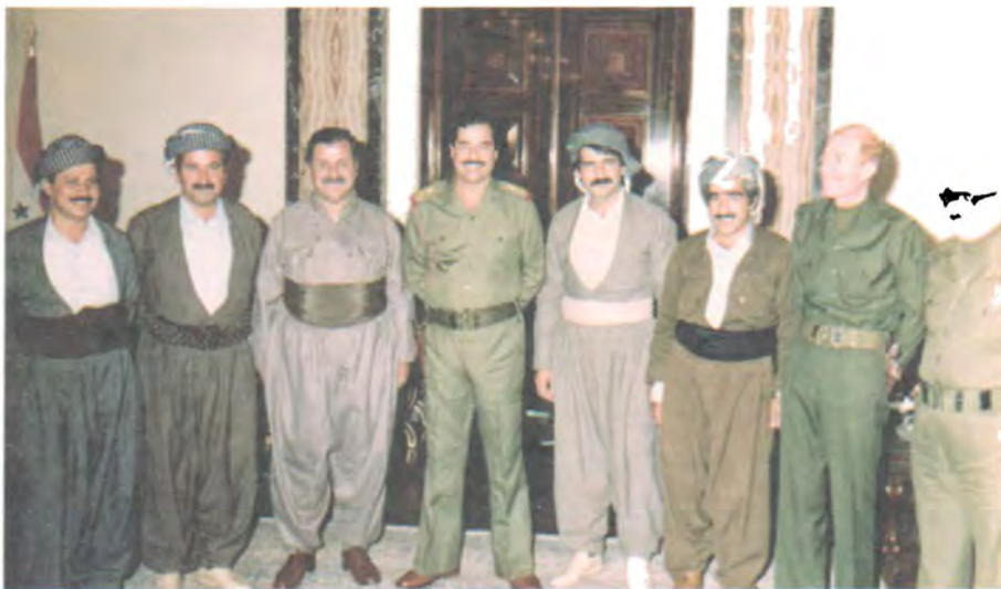
وهفدی به کیتی له بهغدا، کانونی به کهمی ۱۹۸۳ له راستهوه: تاریق عهزیز، عیزهت دوری، د.خدر مهعسوم، مهلا بهختیار، سهدام حسین، مام جهلال، مولازم عومهر، فهردیون عهبدولقادر