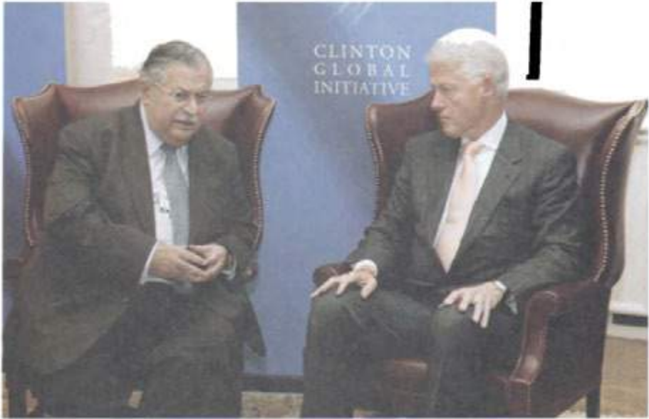
لەگەڵ سەرۆکی پێشوی ولانە بە کگرتوہکانی ئەمریکا، بیل کلنتون