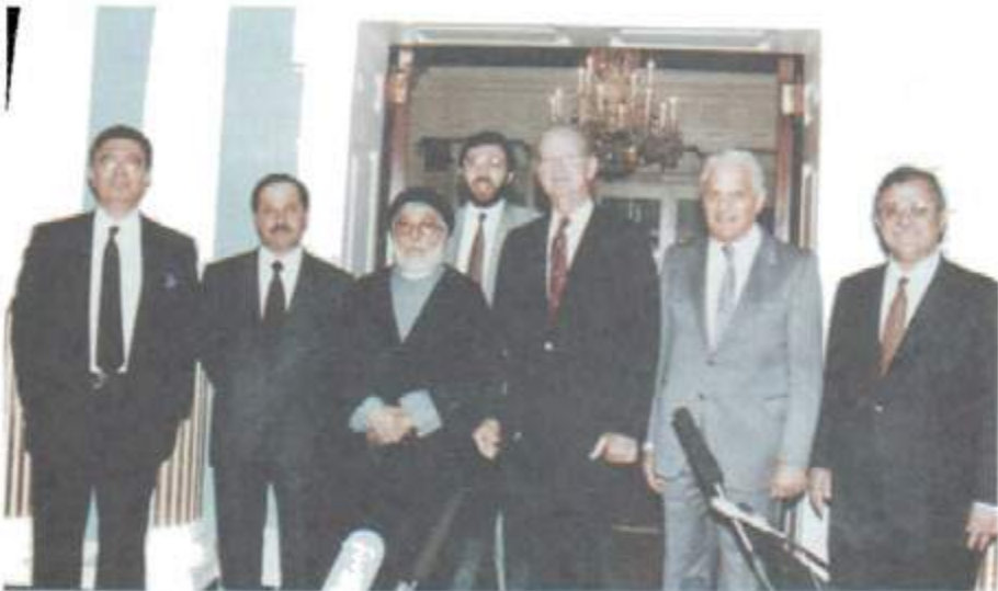
لەگەل وەزىرى دەرەوھى پىتھوى ئەمىرىكا. جىمس بىكەر لەگەل وەفدى ئۆبوزىسۇنى عىراقى