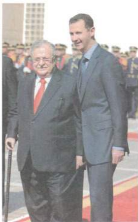
لەگەل سەرۆک کۆماری سوریا، بەشار ئەسەد