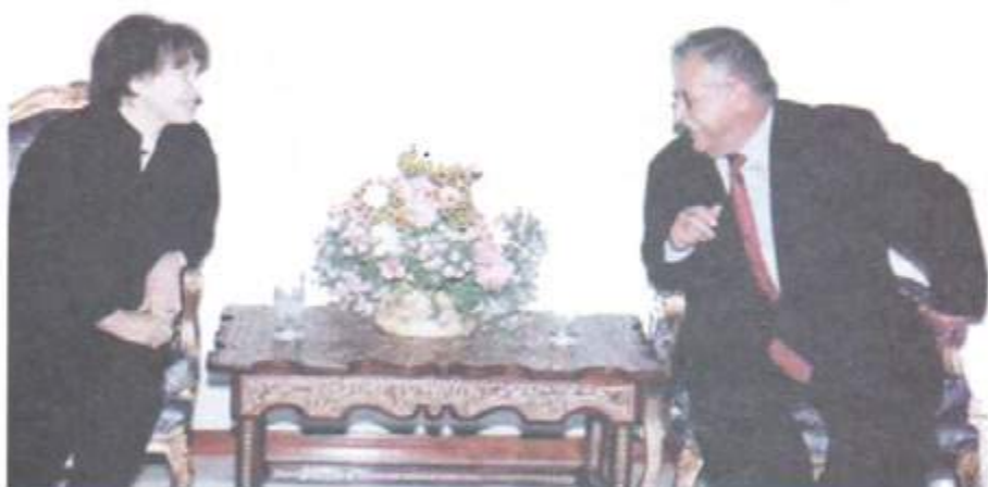
لهگهژ خانمی پهگه می جارانی فرهه نسا. مادام میتهراند