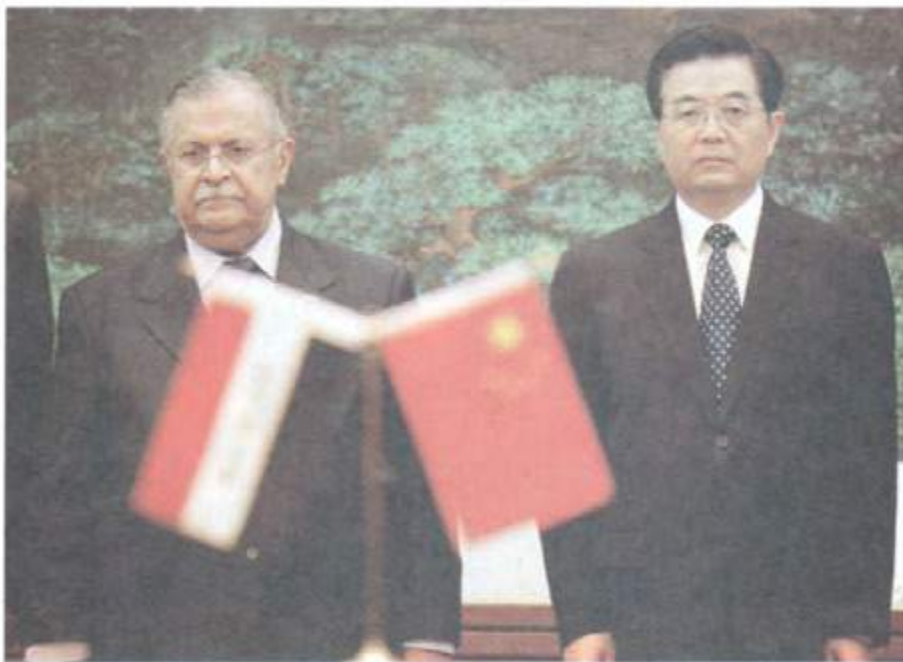
لەگەژ سەرۆک کۆماری چینی پێشو. ھو جینتاو