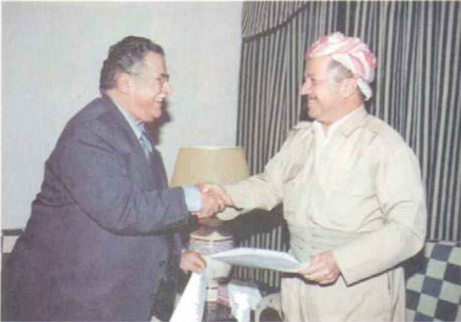
کاتی مۆرکردنی رېځهوتنی لستراتیجی نیوان به کیتی و پارتی ۲۰۰۷/۷/۲۷