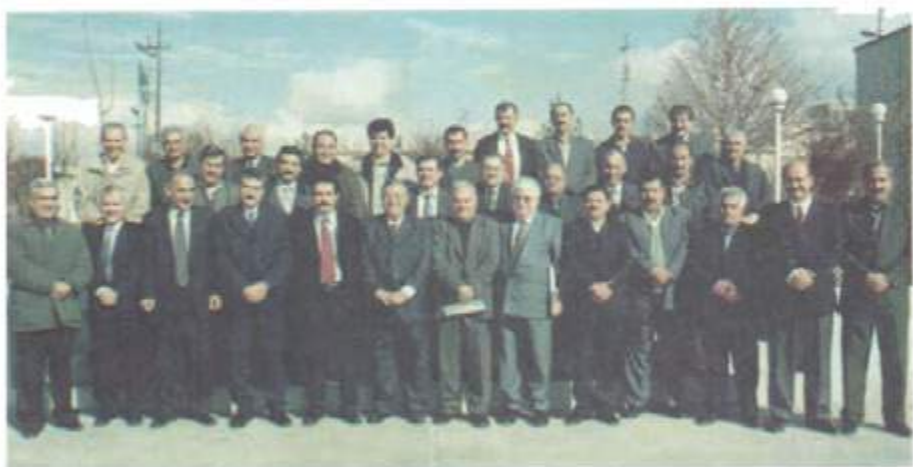
۱۹۹۸/۶/۱۸. به شۆ له سەرکردایه تی پێشوی به کیتی نیشتمانی کوردستان