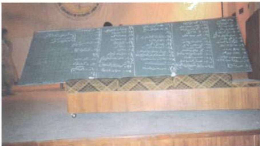
نەوانەى خۇيان بۇ سەرکردايەتى يەكيتى لە كۆنگرەى يەكەمدا ھەلبۇزارد. ۱۹۹۲/۲/۹ - ھەولير