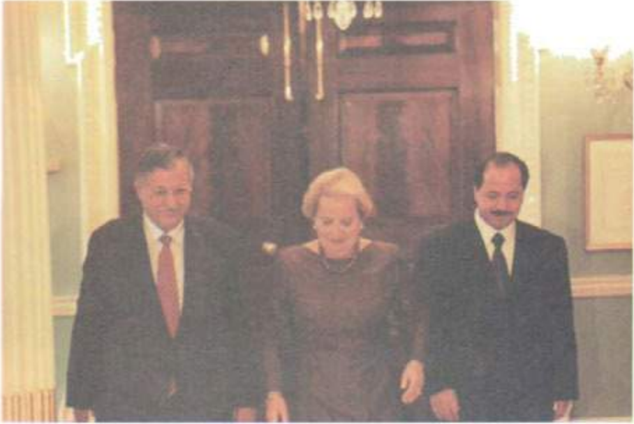
رېځهوتنامه ی واشنتون - ۱۹۹۸/۹/۱۷