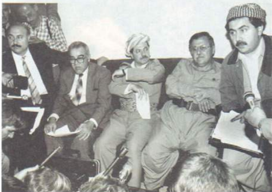
کاتی راگه یاندنی نه نجامه کانی هه لیزاردنی ۱۹۹۲