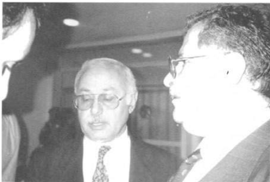
لەگەڵ شەرەفکەندی لە کۆنگرەى سۆسیال دیموکراتى جیهانى ۱۹۹۲/۹/۱۳