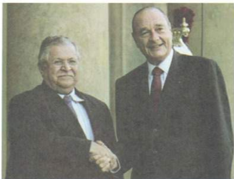
لەگەل سەرۆك كۆمارى فەرەنساى ینشو. جاك شیراک