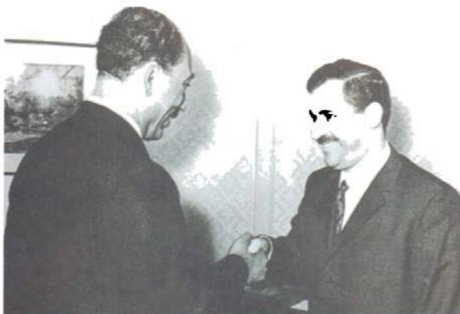
له گهڻ سەرۆك كۆمارى پيشوى ميسر، نه نوهر سادات