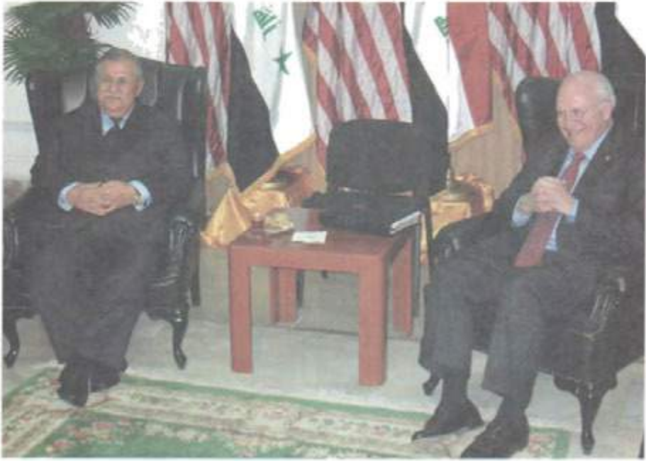
لەگەل جىنگرى سەرۆكى ولاتە يەكگرتوھكانى ئەمىرىكا. دىك چىنى