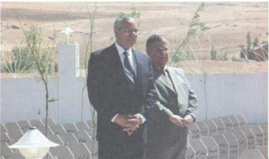
لهگه‌ل وه‌زیری دهره‌وه‌ی پتشیوی ولاته به‌کگرتوه‌کانی ئەمریکا کۆن پاول