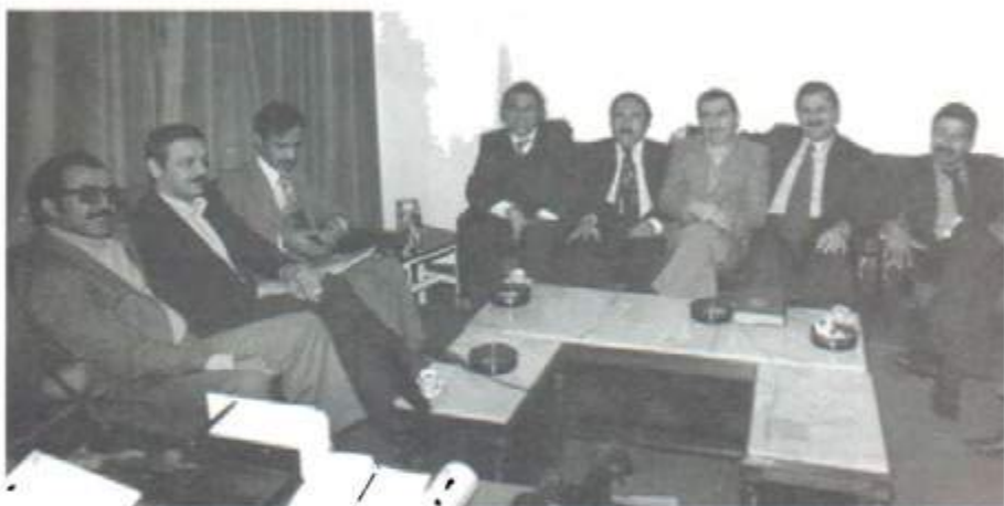
له گهڻ نايف جهواتما و چند سەرکرده به کى فهلهستينى