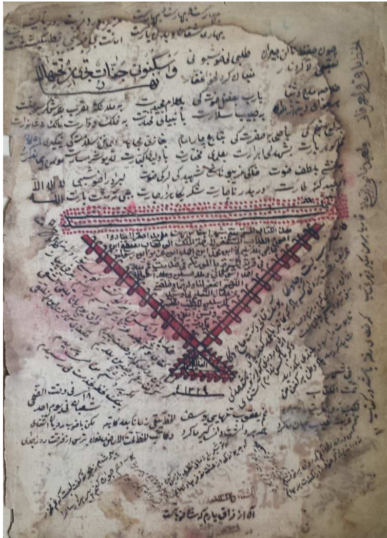
وینہی لاپہرہی کۆتایی نوسخہی مہلا مستہفای گہردی