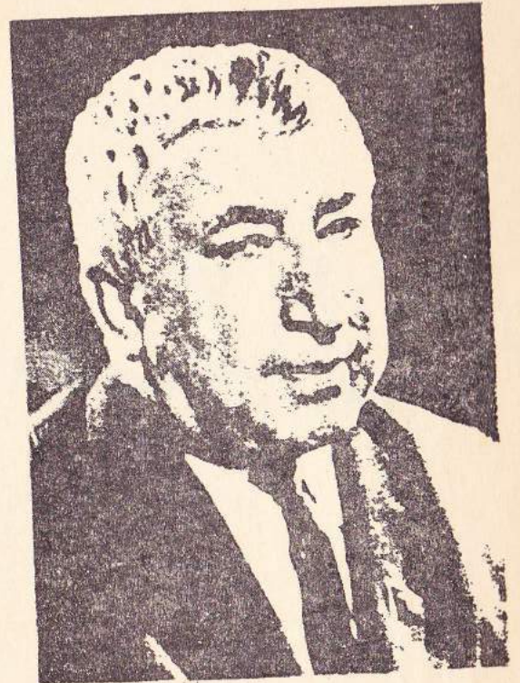
وینهی دانهر ره سوول هه مزه توف

باو کم ده یگوت : « ده شی کللی بچووک سندووقی گه وره بکانه وه • دایکیشم چیرۆکی کورتی ده گیرایه وه : « ئایا ده ریا گه وره یه؟ به ئی زور گه وره یه • باشه له کوپوه هاتوه ؟ ته یرینکی بچووک ده نوو کی بچووک له زهوی داو کانه کی لی ده ربوو ، کانه که هر هه لقولاو هه لقولا تا بوو بهو ده ریا گه وره یه » •