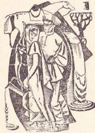
باۋكو دايك ئاگرو ئاۋ

بەردىك بە بەردىك دادە ، پىروشكە ئاگرى لى دە بېتەوۋە • گاشە يەك بە گاشە يەك دادە ، پىروشكە ئاگرى لى دە بېتەوۋە • ئاۋلەپ لە ئاۋلەپ بىخىئە ، پىروشكە ئاگرى لى دە بېتەوۋە • ووشە بە ووشە دادە ، پىروشكە ئاگرى لى دە بېتەوۋە • بەنجە بە ئى تەنبوور دايئە ، پىروشكە ئاگرى لى دە بېتەوۋە • تەماشى چاۋى زوپناژەن و گۇرانىبىز بىكە ، پىروشكە ئاگرى تىدا دە بېنى •