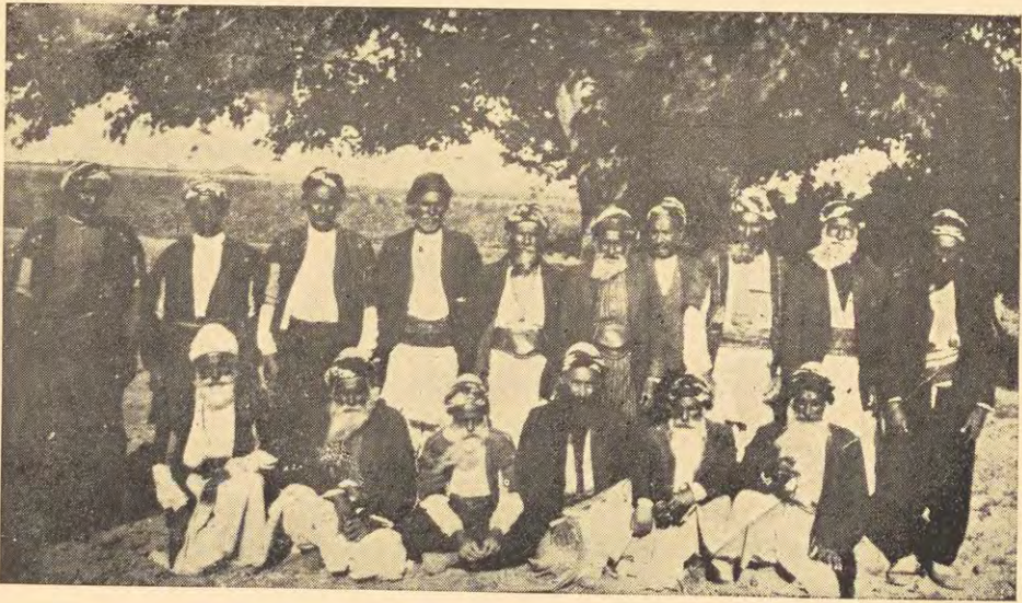
بعض شيوخ وروّساء اليزيدية في منطقة حلب