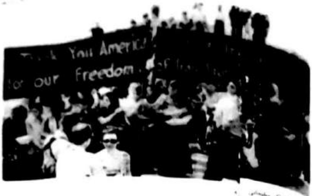
بۇ يەردە ئامېرىكىغا قارشى تۇرغان كىشىلەر بار.