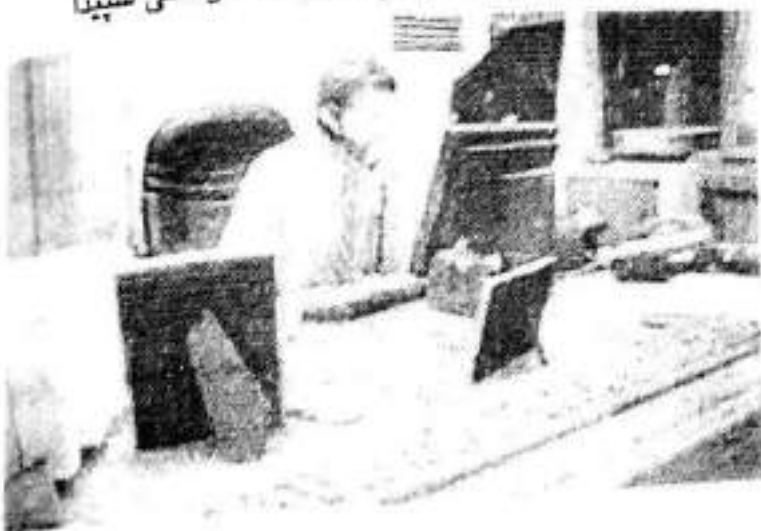
بریمه ر له پشت نو سینگه که یه وه