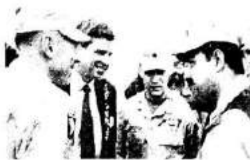
پهروژنایکردن له بیوانی پاسهوانی نیشتمانی له کاتی مهشکردنشا.