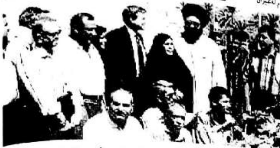
لای مۆنۆمېنتی قوربانیانی سەدام لەحیلە لەگەڵ شینخی قەزوینی و رزگار بووەکاندا ٢٧ حوزەبەران / بۆنیۆ