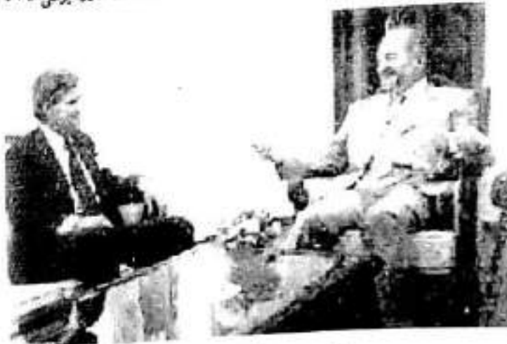
كۆبونىۋە لەگەن جەمەتەرىس / ۲۰۰۴