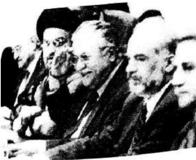
ئەندامانی ئەنجومەنی حوکم (لەشەپەوه بۆ راست) عەدنان پاجەچی، عەبدولعەزیز حەکیم، جەلال تالەبانی، شێراهمیم جەعفەری، یونسادەم کنا