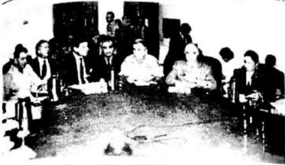
کۆبونووهی نهنجومهنی حوکم (له چه په وه بۆ راست): ژهنوال ریکاردو سانشییز، بریهمه، ژهنرال جۆن شعی زهید، له محمد چهلهسی، عهقوله نهلهاشمیسی