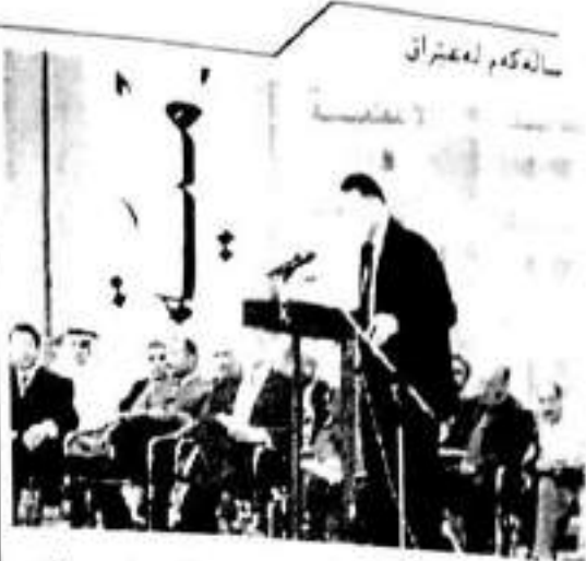
بالبۆز ههیک جۆنزا، جیگری به رۆژبهیری دهسه لانی هاوێه یمانان له مردوم ته نهمهانی شاری به عقوبه دا و نه پێشکەش دهکات.