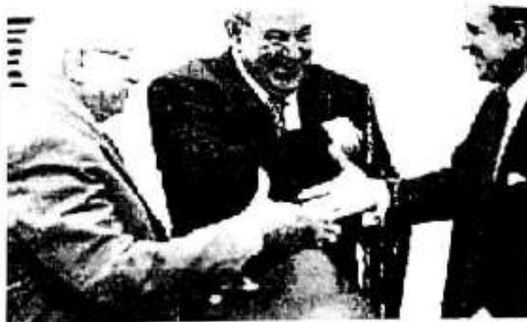
گواستنەوەی سەرۆکی بۆ سەرۆکی ئەنجومەنی دۆزەکی مەسحەت مەحمود و ئەبەد عەلاوی سەرۆک وەزیر ١٠:٢٦ ی بەیان، ٢٨ حوزەبەران / بۆنیۆ ٢٠٠٤