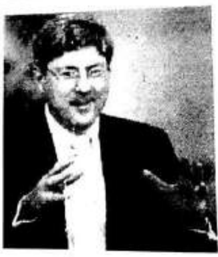
دوگلاس فیس بریکاری وه زیری به رگری

کوبونه له گه ل پۆل وژلینزی جینگری وه زیری یارگری وژه نوال نه بی زهید له نوسینگه که ی بریمه ر