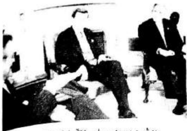
بوش و بریمه رو رامسفیلد له کۆشکی سپیدا