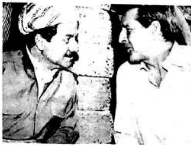
(مهسعود بارزانی و

دوای تیه ریبوونی چهند رۆژنك به سهر ئیمزا كردنی فرمانه كهدا سهارهت به ده زگا ئهمیه كانی پشوو، سهر دانی مهسعود بارزانییم كرد له ماله شاخویه كه ی له نزیك صهلاحه دین له كوردستان كه خارهن فرمانه روهوا یه تیه كی خویه.