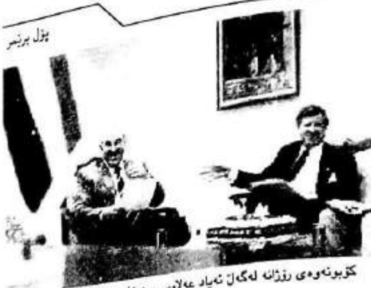
بۆل بېرىشى كۆبونىۋەى رۇزائە لەگەن ئەياد ئەلاۋىسى سەزۇك ۋەزىران خوزەبىرانى ۲۰۰۴