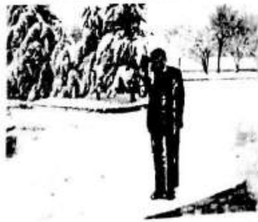
قسه له گان کۆندۆلیزا پاییسی راوزکاری ناسایی نیشتمانییدا ده گم له کوردستان