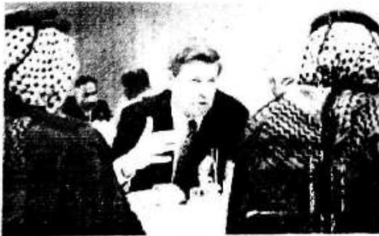
پلانداغان بۆ ئاره دانگرینه وه له گان سه رگودهی هۆزه گان له ناوه پاستی عیراق