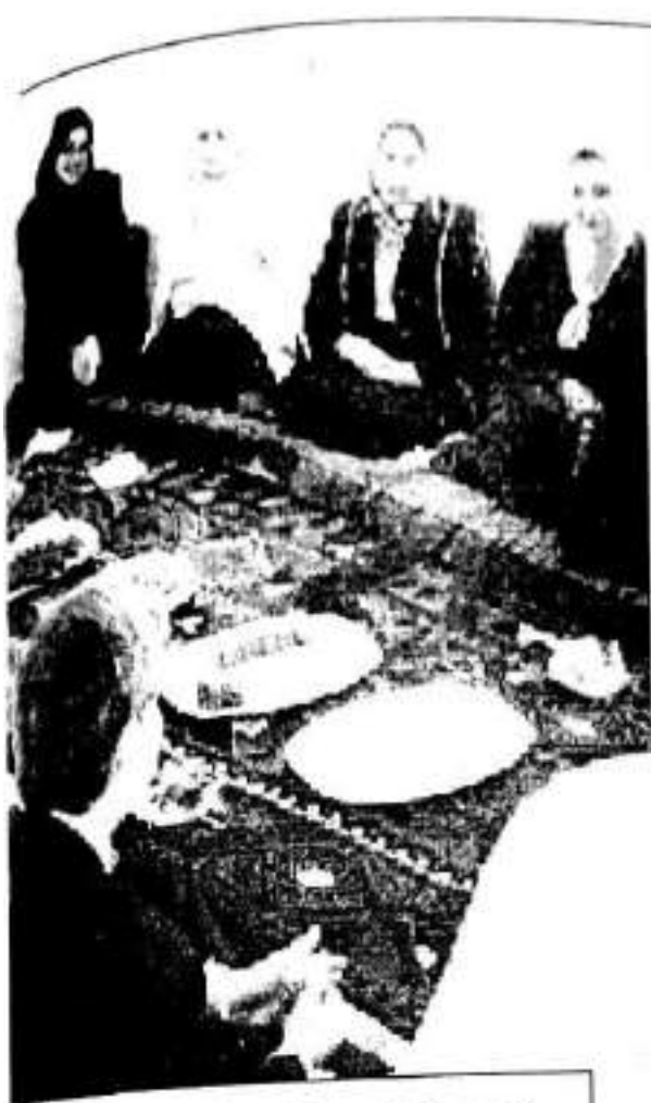
له کاتی کردنه وهی ناوه ننیکی نافرستان له به غذا له رۆژی جیهانی ژنان / ۲۰۰۴