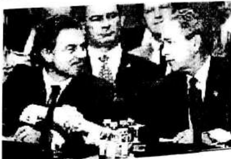
سەرۆک بوش و تۆنی بلیئری سەرۆک وەزیری بەریتانیای نوێ ئەوەی مەرفی گواستنەوەی سەرۆکەبەران پێترگەبەنرا لەکاتی لوتکەی پەیمان باکووری ئەنلەسی ئە ئەنقرە، تورکیا.