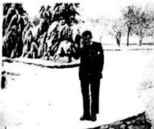
باکوری به غدا، وه ستانیک بۆ په کردنه وهی سوتنه مینی