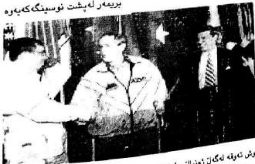
سەزگ بوش ته وقه له گەن زەنرال سانشیتز ده کات له کاتی سەردانه کتوپرکه یه دا بۆ به عدا له ۲۷ تشرین دووه/م/۲۰۰۳