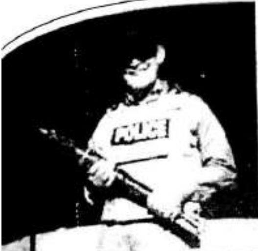
هێزوم هۆران، لەگەوردە راویزکارانی دەسه‌لاشی کاتیسی هاریه‌یمانان لەبه‌غدا