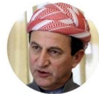
نه دههم بارزانی - نه ندما ی سه رگه دایه تی پارتي