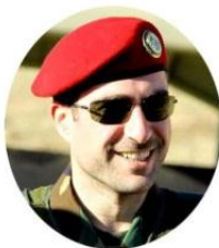
رهوان بارزانی - لپی سرراوی هیزی تاییه تی نیچیرقان بارزانی