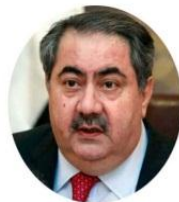
هوشیار زبیری - خالی مهسعود بارزانی و وهزیری دارایی پینشوی عیراق