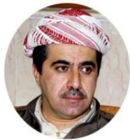
سیداد بارزانی - به رپرسی مه کته بی سهروکی هه ریم