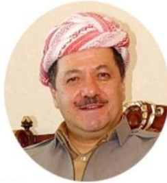
مهسعود بارزانی - سهروکی پارتي ديموکراتي کوردستان