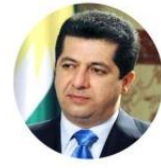
مه سرور بارزانی - سهروکی نه نجومه نی ناساییش