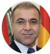
دیشاد بارزانی - نوینه ری حکومتی هه ریم له نه لمانیا