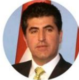
نیچیرقان بارزانی - سهروکی حکومتی هه ریم