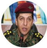
مه نصور بارزانی - فه رمانده ی هیزی گولان