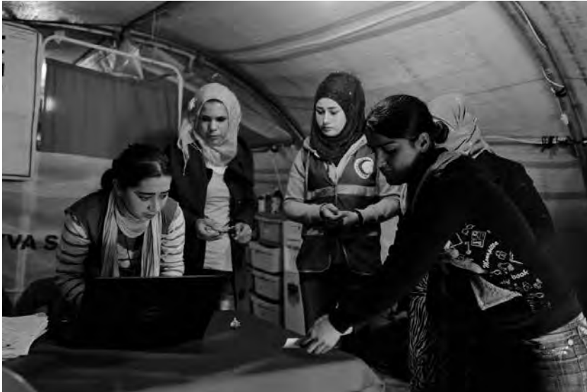
Μια ομάδα της Κουρδικής Ερυθράς Ημισελήνου αντιμετωπίζει τις ελλείψεις

Ένα δεύτερο σοβαρό πρόβλημα είναι η ανεπάρκεια φαρμάκων, ειδικά εκείνων για την αντιμετώπιση του διαβήτη, της υπέρτασης και ηπατικών προβλημάτων. Αρκετές επεμβάσεις γίνονται σχεδόν χωρίς αναισθησία. Στο Καμισλό υπάρχει ένα φαρμακείο που διαθέτει συνταγογραφούμενα φάρμακα σε τιμές χονδρικής. Είναι ίσως το πιο οικονομικό φαρμακείο σ' ολόκληρη τη Συρία. Πολλά φάρμακα όμως φτάνουν με καθυστέρηση ή και καθόλου. Οι τιμές των φαρμάκων που πωλούνται στη μαύρη αγορά είναι απαγορευτικές. Αν και τα συμβούλια κάνουν ελέγχουν στις τιμές, δεν επηρεάζουν τη μαύρη αγορά φαρμάκων.