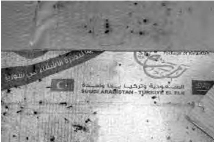
Ανακάλυψη σε πρώην στρατόπεδο του ΙΚ Η επιγραφή λέει: «Σαουδική Αραβία και Τουρκία χέρι με χέρι»

πόλεμο εναντίον του Ισλαμικού Κράτους, όπως στο Κομπάνι, η Τουρκία είναι η ενδοχώρα της επιμελητείας 54 .