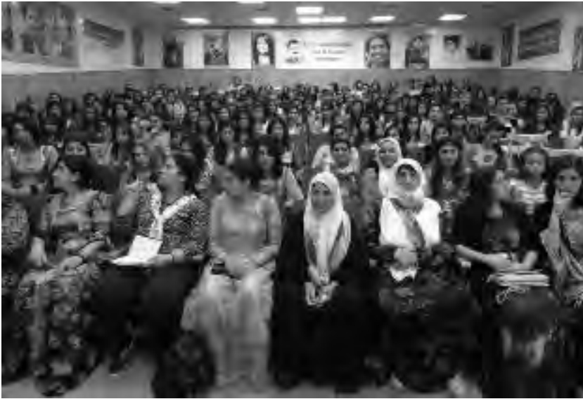
Συνέδριο των Νέων Επαναστατριών στη Ριμελάν, Μάιος 2014

σπάθειες των οικογενειών ν' αποτρέψουν τις νέες γυναίκες από την πολιτική συμμετοχή. Οι συμμετέχουσες αποφάσισαν να κάνουν περισσότερη δουλειά μέσα στις οικογένειες. Εκτιμούσαν πολύ τη μορφωτική δουλειά. Μερικές ανέφεραν τους γάμους ανηλίκων στους οποίους εξακολουθούν πολλά κορίτσια να εξαναγκάζονται. Οι συζητήσεις ήταν ειλικρινείς και ζωηρές. Οι νέες γυναίκες εξέλεξαν ένα 15μελές συμβούλιο κι αποφάσισαν να ενισχύσουν την ιδεολογική και πολιτική πάλη τους για την απελευθέρωση των γυναικών.