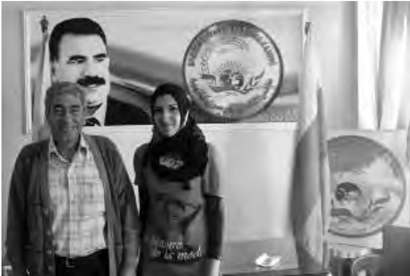
Διπλή ηγεσία: οι συνδμήμαχοι της Σερεκανιγιέ

«Είμαστε μακριά ακόμα απ' τους στόχους μας», λέει η Ασιά Αμπντουλάχ, συμπρόεδρος του PYD. «Έχουμε μάθει απ' τις αποτυχημένες επαναστάσεις του παρελθόντος. Πάντοτε έλεγαν "ας κάνουμε πρώτα μια επιτυχημένη επανάσταση και μετά δίνουμε δικαιώματα στις γυναίκες". Αλλά βέβαια, μετά την επανάσταση αυτό δε γινόταν. Δεν επαναλαμβάνουμε την παλιά ιστορία στη δική μας περίπτωση» 21 .