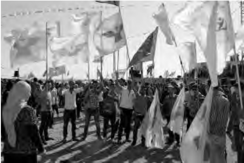
Συροϊακωβίτες σε συγκέντρωση κατά της τάφρου του KDP για την ενίσχυση του εμπάργκο

YPG κάλεσαν όλους τους Κούρδους, ασχέτως κομματικής τοποθέτησης, να ενωθούν στον αγώνα ενάντια στον κοινό εχθρό 37 .