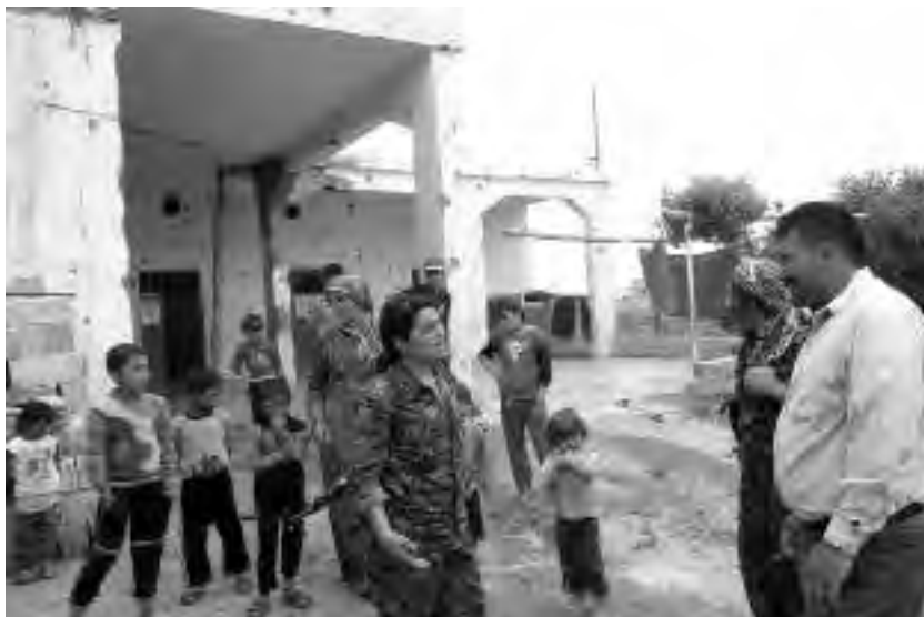
Το κατεστραμμένο χωριό Κεστέ, κοντά στην Τιλ Σελέφ, Μάιος 2014. Οι κάτοικοι επιστρέφουν είκοσι μέρες αφού οι YPG/YPJ απελευθέρωσαν το χωριό