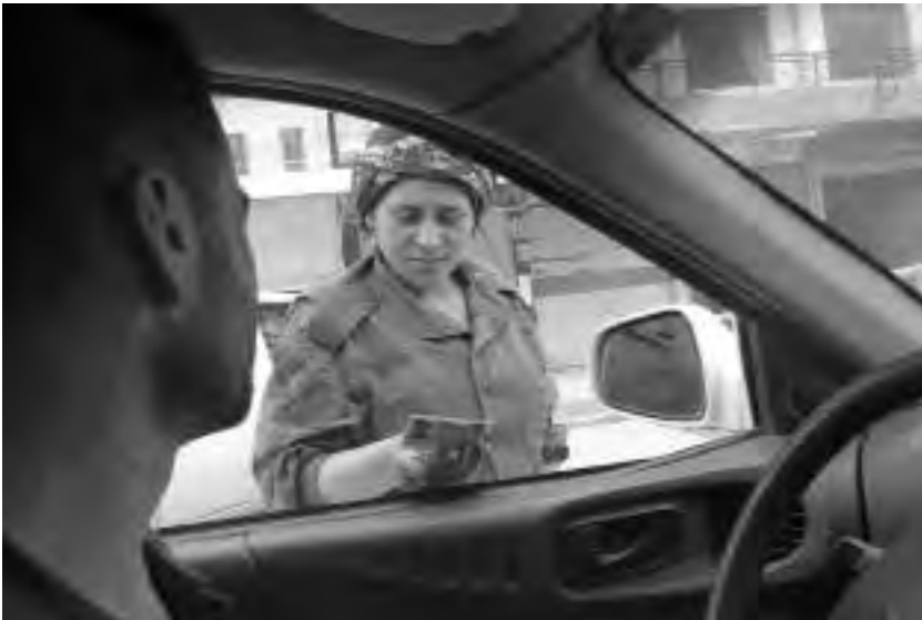
Μέλος των γυναικείων δυνάμεων ασφαλείας σε σημείο ελέγχου στο Τιρμπεσπί

Σημαντικό καθήκον των Asayίς είναι η «εσωτερική ασφάλεια». Αυτό σημαίνει ότι επεμβαίνουν σε διαμάχες που αδυνατούν να λύσουν οι Επιτροπές Ειρήνης και Συναίνεσης και που συχνά περιλαμβάνουν επιθέσεις, βιαιοπραγίες αλλά και διακίνηση ναρκωτικών. Οι Asayίς, οι οποίοι συνδέονται με τα λαϊκά συμβούλια και λογοδοτούν σ' αυτά, δεν μπορούν να θέσουν κάποιον ύποπτο υπό κράτηση για πάνω από 24 ώρες χωρίς δικαστική απόφαση. Το δικαιοσύνη σύστημα της Ροζάβα, όπως είδαμε, δεν επιζητά την τιμωρία, αλλά την επανακοινωνικοποίηση και δίνει έμφαση στην εκπαίδευση των φυλακισμένων. Στην Αμιουντέ γνωρίσαμε ένα μέλος των Asayίς που προηγουμένως ήταν ο ίδιος στη φυλακή: κατά την παραμονή του εκεί τον κέρδισαν σε τέτοιο βαθμό οι αρχές των Asayίς, που έγινε μέλος τους. Η περίπτωση του δεν είναι η μοναδική.