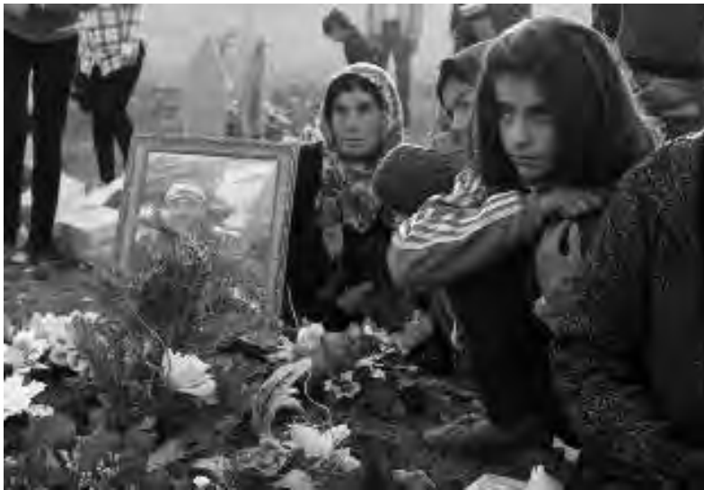
Ημέρα μνήμης για τους μάρτυρες

Είδαμε το προσωπικό της SMS να επισκέπτεται οικογένειες όχι μόνο για να τους εκφράσει συλλυπητήρια, αλλά και για να διαπιστώσει τι ανάγκες έχουν και να τις εντάξει σε κοινωνικές δραστηριότητες. Η SMS είναι και πολιτικά ενεργή, οπότε συμμετέχει δυναμικά στις διαμαρτυρίες κατά του εμπάργκο.