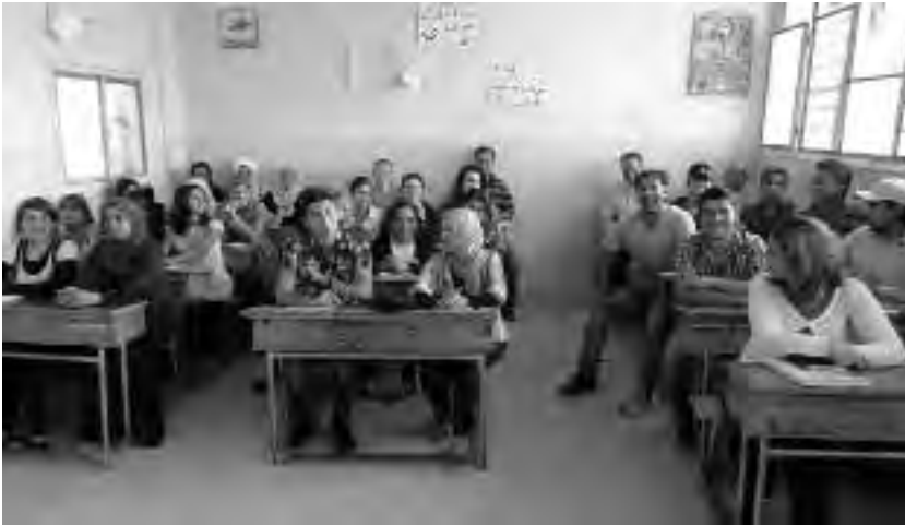
Διδασκαλία της κουρδικής γλώσσας στη Σερεκανίγιε

από το Βόρειο Κουρδιστάν, άρχισε να διδάσκεται η Κουρμαντζί, η διάλεκτος που μιλιέται στη Ροζάβα. Για πρώτη φορά, το κουρδικό απελευθερωτικό κίνημα είχε την ευκαιρία να πάρει δυναμικές πρωτοβουλίες για την ανάπτυξη ενός χειραφετητικού κινήματος εντός του εκπαιδευτικού συστήματος, σε ευρεία κλίμακα. Μετά το Μάρτιο του 2011, κατέστη δυνατή η ελεύθερη διδασκαλία των Κουρδικών στη Ροζάβα, και έντεκα δάσκαλοι απ' τον καταυλισμό του Μαχμούρ ασχολήθηκαν για ένα χρόνο μ' αυτό.