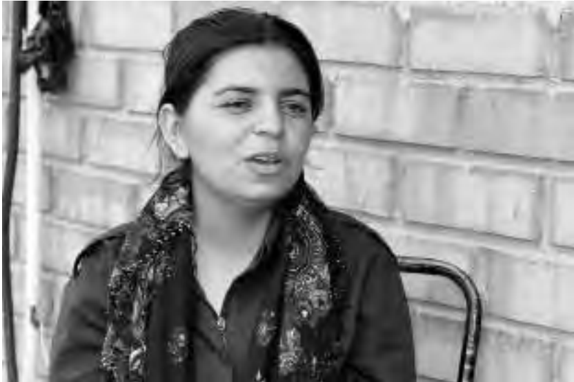
Αράβισσα μαχήτρια των YPJ που εκπαιδεύεται ως αξιωματικός στην Ακαδημία «Σεχίντ Ζιντά»

το κίνημα, τις αρχές και την ιδεολογία του, αλλά δε συμμετέχουν σε στρατιωτικές ενέργειες.