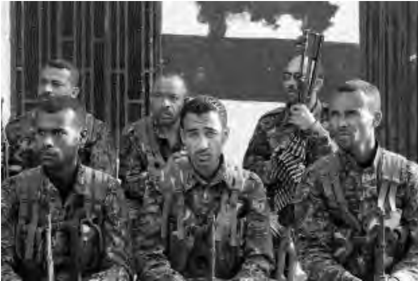
Μέλη μιας αραβικής μονάδας στην Τιλ Κοτσέρ

Ανάμεσα σε συγκεκριμένες αραβικές και κουρδικές φυλές υπάρχει κλίμα αμοιβαίας καχυποψίας και η εξάλειψη των μεταξύ τους εντάσεων θα χρειαστεί επίμονες διπλωματικές προσπάθειες από πλευράς TEV-DEM. Ορισμένες φορές επίσης ξεσπούν συγκρούσεις και μεταξύ κάποιων αραβικών φυλών, καθώς ορισμένοι παίρνουν το μέρος των τζιχαντιστών και άλλοι των Κούρδων. Απ' τη Σαραμπία και τη Ζουμπάγιντ, δύο απ' τις πολυπληθέστερες αραβικές φυλές, πολλά άτομα είναι πλέον μέλη των YPG και μία απ' τις σημαντικότερες φυλές, η Σάμαρ, στηρίζει τους Κούρδους 15 .