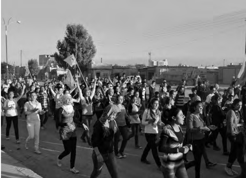
Διαδήλωση γυναικών στο Καμισλό

τους ενάντια στα τρομερά εγκλήματα που διαπράττουν οι Ισλαμιστές και για να παλέψουν για την επίτευξη ενός νέου ρόλου για τις γυναίκες 36 .