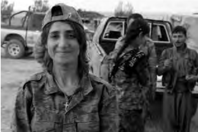
Συροϊακωβίτισσα μαχήτρια των ΥΡΓ στη Σερεκανίγιε

Αράβισσες και Συροϊακωβίτισσες στις γραμμές μας. Οι Αράβισσες έχουν πολλά προβλήματα με τη γλώσσα και συχνά είναι απόμακρες – πολύ περισσότερο από τις Κούρδισσες. Είναι πολύ πιο επηρεασμένες απ’ τους πατριαρχικούς θεσμούς. Τους παίρνει πολύ καιρό μέχρι να προσαρμοστούν».