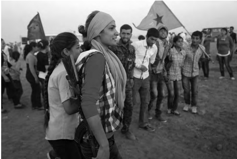
Γιορτή YPG/YPJ στο Κομπάνι, Οκτώβριος 2015

βοήθεια, επέτρεψε δύο φορές να περάσουν από την Τουρκία 140 πεσμεργκά του KDP με λίγα βαρέα όπλα για την άμυνα του Κομπάνι. Έφτασαν τον Οκτώβριο και το Δεκέμβριο του 2014, και μαζί με τις YPG/YPJ και το Μπουρκάν Αλ-Φιράτ υπερασπίστηκαν το Κομπάνι.