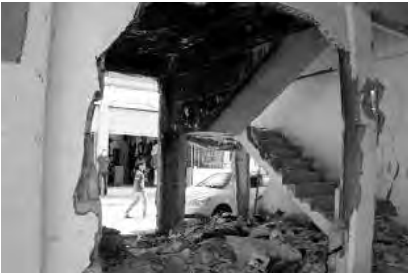
Βομβαρδισμένη κατοικία στο Τέρμπεσπι

Παρά το βομβαρδισμένο σπίτι, η πρώτη μας εντύπωση απ' τη Ροζάβα είναι πως πρόκειται για ένα μέρος ειρηνικό και όμορφο. Τα χωριά, με σπίτια από άργιλο και πηλό, συγχρωτίζονται αρμονικά με το τοπίο και πρόβατα βοσκούν γαλήνια γύρω απ' τους δρόμους. Τι αντίθεση με τα απειλητικά τοπία της ιρακινής πλευράς, τις προχειροφτιαγμένες τσιμεντένιες πόλεις! Καλωσήρθατε στην Επανάσταση της Ροζάβα!