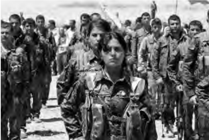
Συγκέντρωση των YPJ και YPG

Αλ-Νούσρα, το Ισλαμικό Κράτος και μονάδες του Ελεύθερου Συριακού Στρατού (FSA) επιτέθηκαν στη Σερεκανίγιε [βλ. 8.4], ενώ σύντομα ακολούθησαν κι άλλες επιθέσεις στο Αφρίν, το Κομπάνι και τη Χόσικε 6 .