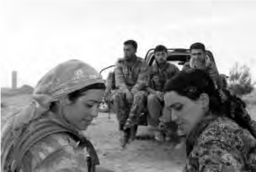
Μαχήτριες των YPJ και μαχητές των YPG στη Σερεκανίγιε

τηση ήταν μακρά, μέχρι που έγινε κατανοητό ότι η απελευθέρωση της κοινωνίας θα επιτευχθεί μόνο μέσω της απελευθέρωσης των γυναικών».