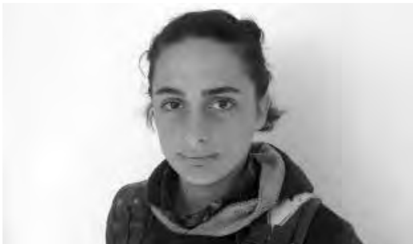
Σπουδάστρια της Ακαδημίας «Σεχίντ Σιλάν»