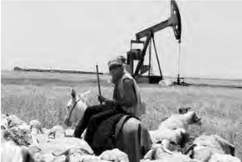
Πετρέλαιο, στάρι και κτηνοτροφία στο Τζεζιρέ

ρους για τις οικογένειές τους, οι οποίες είχαν μείνει πίσω. Η μεγαλύτερη κοινότητα εσωτερικών μεταναστών – πάνω από μισό εκατομμύριο – ήταν στο Χαλέπι.