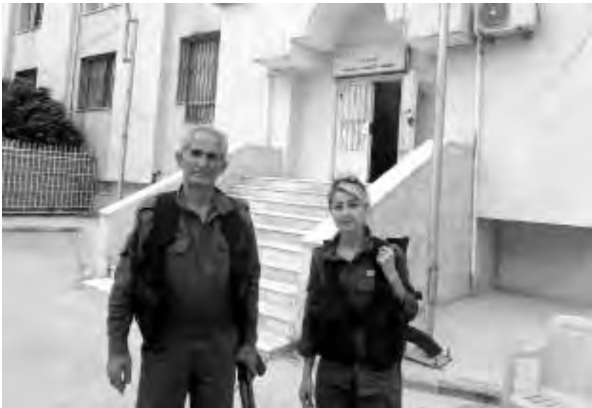
Φρουροί στο δικαστήριο της Ντερίκ

Σε επίπεδο κομμούνας και συνοικίας, οι επιτροπές έχουν διπλή διάρθρωση: οι μικτές είναι υπεύθυνες για την επίλυση των διενέξεων και το χειρισμό των εγκλημάτων, ενώ οι επιτροπές γυναικών είναι υπεύθυνες για υποθέσεις πατριαρχικής βίας, εξαναγκαστικών γάμων, πολυγαμίας κ.ο.κ.· οι τελευταίες συνδέονται άμεσα με την Ένωση Γυναικών «Αστέρι» [βλ. 5.3].