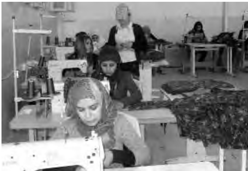
Κοοπερατίβα ραπτικής στη Ριμελάν

ενδύματα τη βδομάδα. Μια από τις μηχανές ράβει τα διακριτικά για τις στολές των Δυνάμεων Ασφαλείας ( Asayis ).