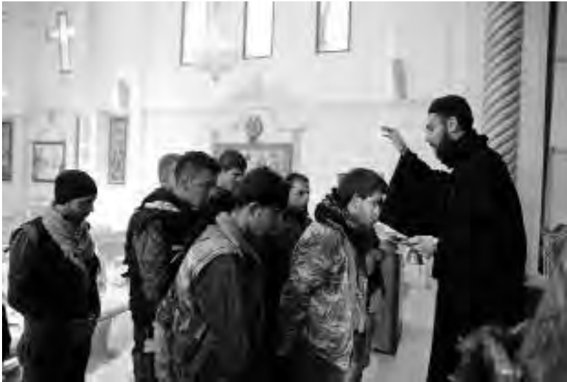
Συροϊακωβίτης ιερέας ευλογεί μαχητές του MFS τα Χριστούγεννα του 2014 στη Ντερίκ

όπου κατοικούν Συροϊακωβίτες, και ιδίως στην περιφέρεια της Χόσικε. Από την πρώτη στιγμή το MFS ένωσε τις δυνάμεις του με τις YPG στο μέτωπο κατά του Ισλαμικού Κράτους.