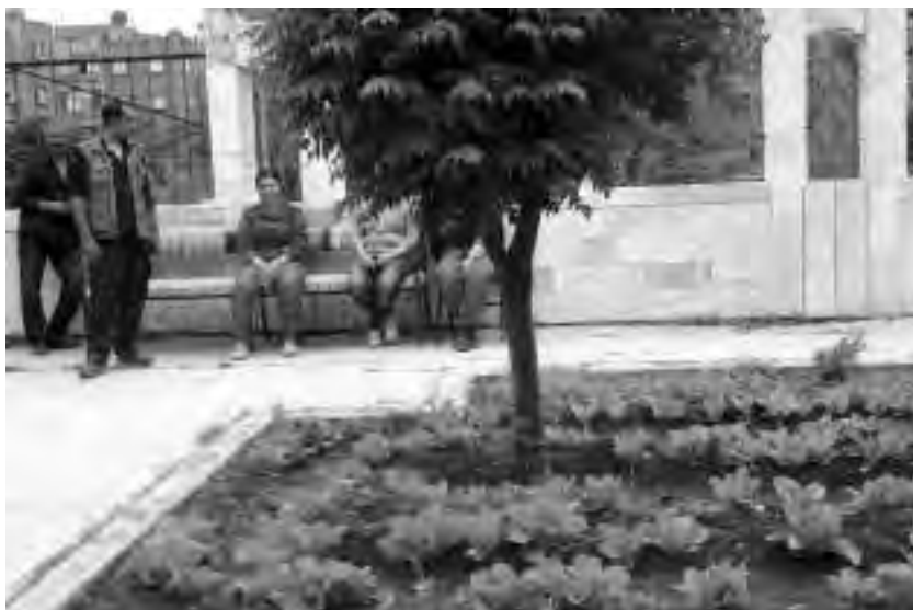
Αστικός λαχανόκηπος στο υπουργείο οικονομικών της Ντερίκ

Οι σημερινές συζητήσεις ξεκινούν απ' τη σκέψη ότι η γεωργία της Ροζάβα πρέπει να αποκτήσει ποικιλία για λόγους αυτάρκειας. Η ποικιλία των καλλιεργειών θα βελτιώσει το έδαφος και θα κάνει καλό στα φυτά και στα ζώα γενικά. Συζητούνται προτάσεις για τη διαμόρφωση ενός δικτύου μικρών δασών, ή μη αγροτικών γαιών, σε ένα συνδυασμένο περιβάλλον, ή έστω η φύτευση δέντρων ανάμεσα στα αγροκτήματα. Δυστυχώς τέτοιες προτάσεις δεν έχουν προχωρήσει. Ούτε όσοι λαμβάνουν τις πολιτικές αποφάσεις, ούτε οι χωρικοί έχουν οικολογική συνείδηση· η ιστορική μνήμη των δέντρων έχει εξαφανιστεί και ο συνεχιζόμενος πόλεμος έχει δημιουργήσει άλλες έννοιες. Για τη μακροπρόθεσμη βελτίωση της βιοποικιλότητας, οι πολιτικοί οργανισμοί θα πρέπει να συμπεριλάβουν στην ατζέντα τη φύτευση δέντρων και δασών, αφού οι αγρότες δεν θα το κάνουν από μόνοι τους γρήγορα. Προς τιμήν του, την άνοιξη του 2015, το νέο πολιτικό σύστημα φύτεψε τον πρώτο του «εθνικό δρυμό» με διάφορα δέντρα, κοντά στην πόλη Ντερίκ.