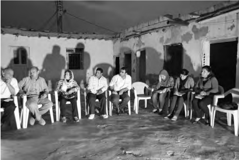
Συνάντηση σε μια γειτονιά