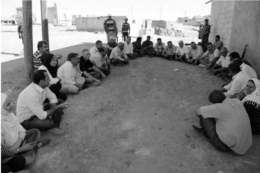
Συνάντηση του TEV-DEM στο Κομπάνι το 2015

τη Ροζάβα. Το γεγονός ότι ιδρύθηκε ένα κυβερνητικό σώμα υψηλότερου βαθμού χωρίς να εξαντληθούν οι προηγούμενες συζητήσεις, μετέφερε τα εν λόγω προβλήματα και αντιφάσεις σ' ένα εντελώς διαφορετικό επίπεδο. Με την πάροδο του χρόνου, τα τελευταία έγιναν όλο και πιο αισθητά.