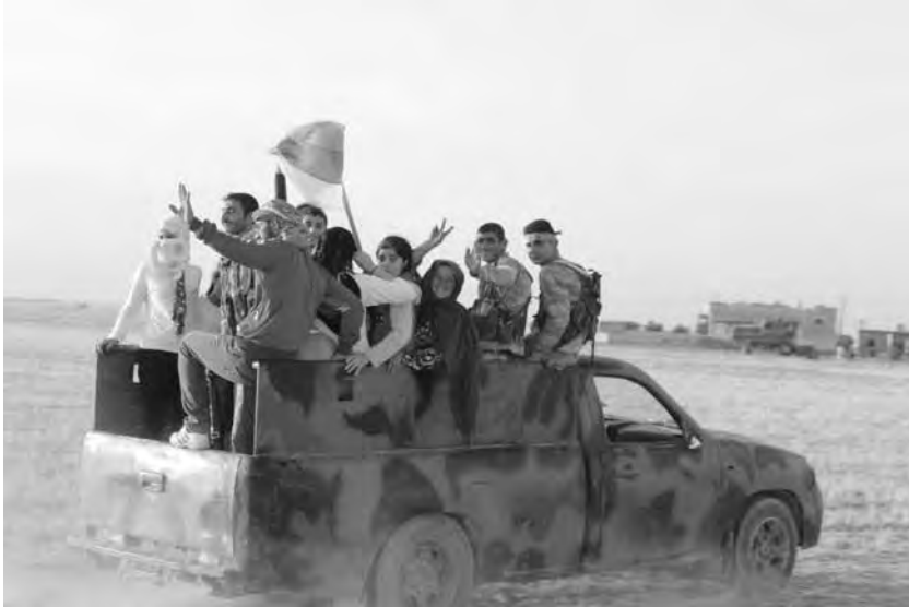
Πολίτες μαζί με μαχητές των YPG/YPJ μετά από διαδήλωση

χώρα πλέον παντού, παράλληλα με την κριτική προς τις υπάρχουσες οικονομικές σχέσεις.