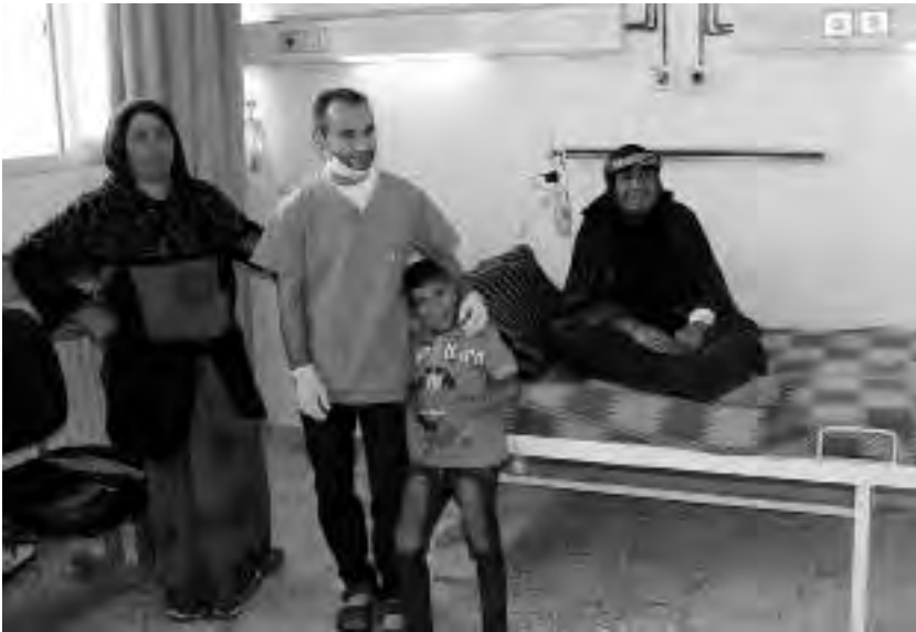
Σ' ένα νοσοκομείο της Ντερίκ

Η επανάσταση του 2012 έβαλε τέλος στην κρατική εξουσία στη Ροζάβα. Παρά ταύτα τα νοσοκομεία, καθώς και άλλες δομές δημόσιας υγείας, συνέχισαν να λειτουργούν και οι γιατροί δεν τράπηκαν σε φυγή – αυτό συνέβη εν μέρει τα επόμενα δύο χρόνια. Ενώ το MGRK έθεσε υπό τον έλεγχό του άλλα δημόσια ιδρύματα και υπηρεσίες, δεν έκανε το ίδιο και με τις δομές υγείας. Αντ' αυτού, οι αντίστοιχες επιτροπές δούλεψαν στην κατεύθυνση του συντονισμού των πολιτικών υγείας, σε συνεργασία με το MGRK και το TEV-DEM.