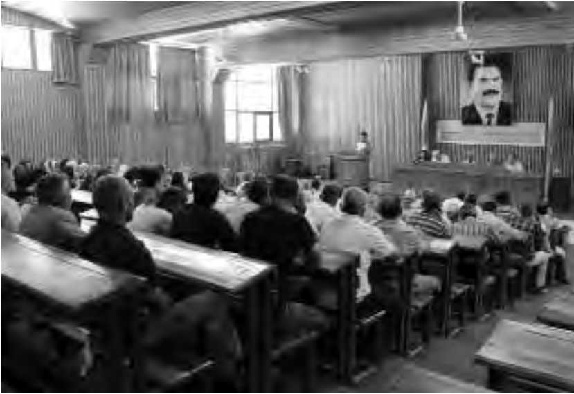
Συνάντηση του λαϊκού περιφερειακού συμβουλίου του Καμισλό

Κομπάνι και Αφρίν παρέμεινε εφικτή μέχρι τον Ιούνιο του 2014. Από 'κει και πέρα, τα τρία καντόνια και το Χαλέπι απομονώθηκαν. Από τότε το MGRK, το TEV-DEM και οι οκτώ επιτροπές υπάρχουν ξεχωριστά σε επίπεδο καντονιού.