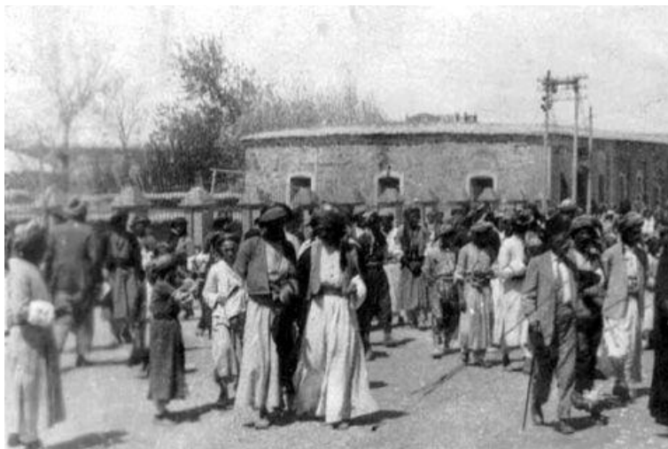
جلو بهرگی پیاوان له سلیمانی بهر "ده‌رکی سه‌را" سالی ۱۹۳۰ زاینی 39

جیاوازی جلو بهرگی پیاوان و ژنان له دوو شتدا بوون. کراسی ژنه‌کان شوڤر بوو هه‌تا سه‌ر پینان هه‌ر وه‌ک کراسه کوردیه‌کانی ئه‌مه‌رو به‌لام کراسی پیاوه‌کان کورت بوو. بیجگه له‌مه‌ره‌نگی جلو بهرگی پیاوان ره‌ش و بوڤر بوون به‌لام هی ژنه‌کان ره‌نگاو ره‌نگ بوون.