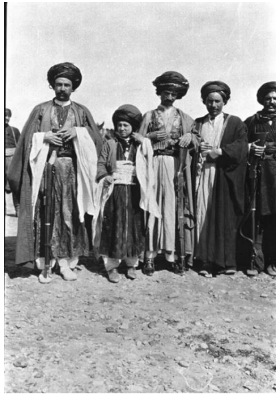
جلوبہرگی کوردانی رۆژہ لآت ناوچہی نیردہ لآن سالی ۱۹۱۱ زایینی 41