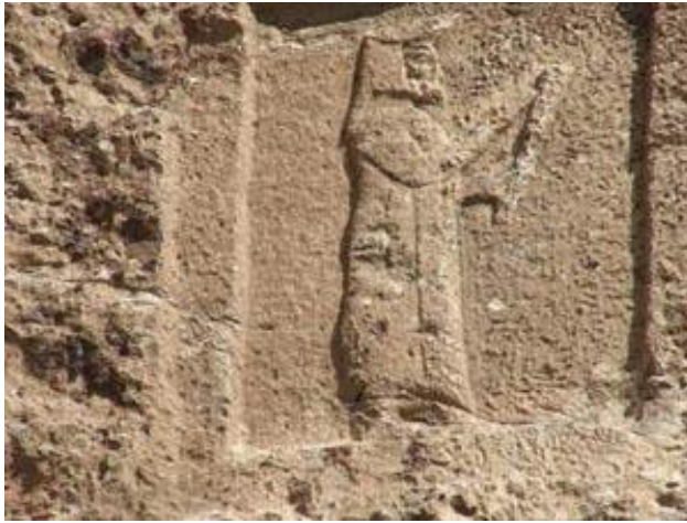
پهیکر گموره پیاویکی مادی له "گزر دهخمی کهل داوود" 43

پینجه م: جلو بهرگی پادشاهه لای چهپ لهو جلو بهر گانه دهچی که له پهیکره بهر دینه کانی سهردهمی هه خامه نشی دیار ده که ون و به پهیکری سهر بازانی مادی ده ناسرن. (سهیری وینه کانی خوار موه بکه) 44 .