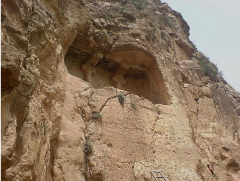
نارامگای کهیخه سروه له چه می ریزان لای سلیمانی 45

لیره دا له وانیه بو بهشیک له خهک نهمه پرسیار بیت که بوچی گوری کهیخه سروهو لهو نه شکوته و لهو شوینه بهرز هدایه؟ بوچی له شوینیک نییه که خهک به ئاسانی بتوانی سهردانی مهزاره کهی بکات! وه لامه کهی ده توانی نهمه بیت که له سهر متاکانی سهر هه آدانی ئائینی زه ردهشتی بهیپی باوه ر مکانیان، ئاو، خاک، ههوا و ئاگر پیرۆز بوون و کهس بوی نه بوو پیسیان بکات. بو نمونه له کوژاندنه وهی ئاگر، له پیسکردنی ئاوهکان و له ناشتنی مردوهکان له خاکدا خوین دهپار است، هه ر بویش بو ئه وهی که خاک پیس نه بی، مردوهکانی خوینان له سهر بهرزایی کیوهکان داده نا