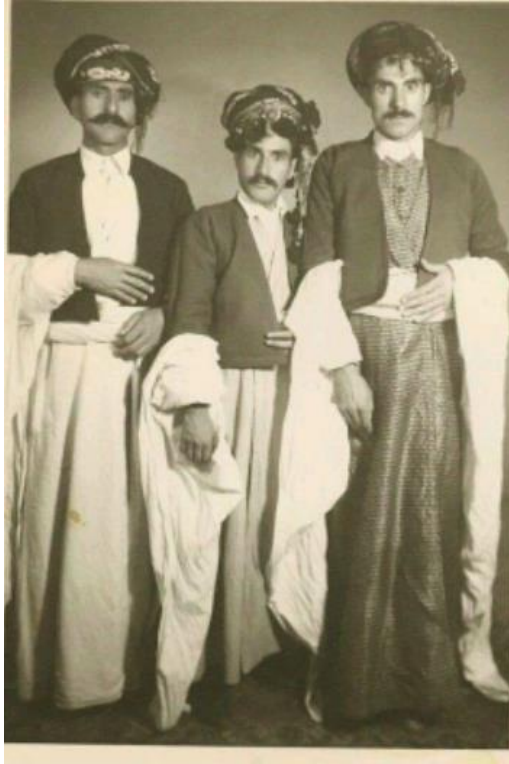
جلوبهرگی کوردانی یارسان لای کرمانشان سمرقانی سدهی ۱۹ی زاینی 42

چاره‌م: جلوبهرگی پادشاهی لای چهپ له جلوبهرگی پهیکری ئه پیاوه مادییه دهچی له سهرپیلی زه‌هاو، که به "گور دهخمه‌ی کهل داوود" ناسراوه، (بروانه بۆ وینه‌که‌ی خواره‌وه).