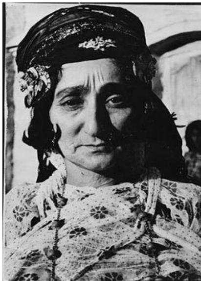
حهپسهخانی نهقیب (۱۸۹۱-۱۹۵۳)

له سییهکان و چلهکانی سهدهی بیستههدا ههپسهخانی نهقیب رۆل و کاریگههیهکی باشی بهسهه شاری سلیمانی به گشتی و پینشخستنی ژناتی شارهکه به تاییهتی، ههبووه، بهلام له پهناجاندا چالاکای نامینیت، چونکه له سالی ۱۹۵۳ دا کۆچی دوایی دهکات. ئهو ژنانهی که له سلیمانی و لهسهردهمی ههپسهخاندای چالاکن و کاری ریکخراوهی دهکهن، ناوهستن و له فورم و قالبیکی تردا، درپژه به تیکۆشان دههه.