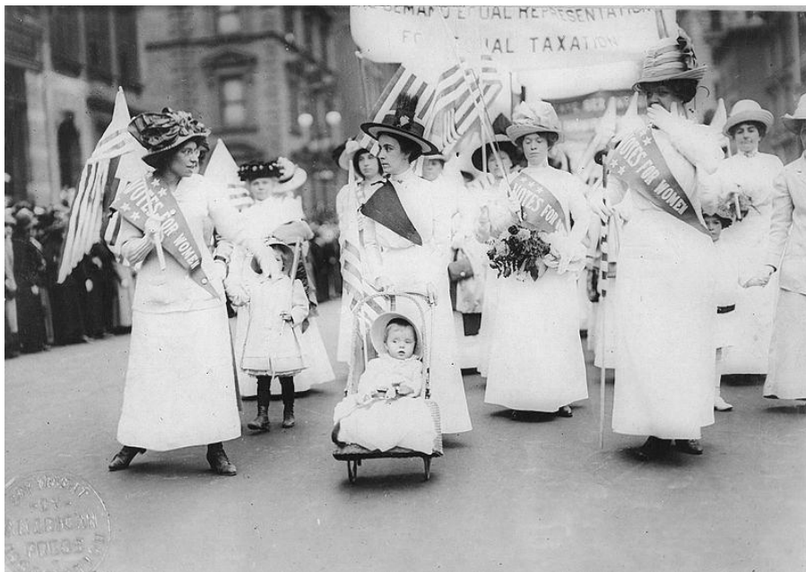
که نهه قالیکی فیمینیستهکانی شاری نیۆرک بۆ مافی دهنگدان له ۱۲ ی نیاری ۱۹۱۲

مافیکی دهستووری و بچهسیپت، چونکه ژنان ههر له ۱۸۲۰ هوه دهستیان به تیکۆشانی بیوجان کردبوو ^ .