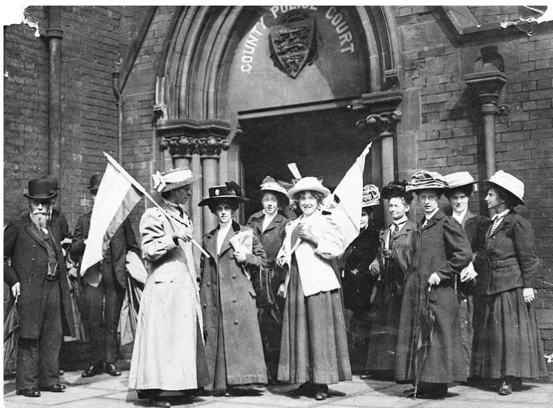
خۆپیشاندانی ژنانی بهریتانیا له ساڵی ۱۹۱۱ بۆ مافی دهنگان

له نیوان ههر دوو شهڕی جیهانی یهکهم و دووهم، بزوتنهوهی ژنان بۆ داخوازی مافی دهنگان له ولاتانی ئهوروپا بهرهممی هینا و ژنان ئهوه مافهیان به دهست هینا. له دوای شهڕی جیهانی دووهمیشهوه بهردهوامی بهم بزوتنهوهیه درا و ئهوه مافه بهره بهره له ههموو ولاتانی ئهوروپا به دهست دههات.