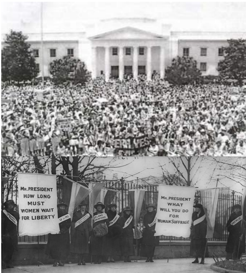
ژنانی نهمریکا خۆپیشاندانی سالی ۱۹۱۷ لهبهردهم کۆشکی سپی، له بانهری لای چهپ نووسراوه جهنابی سهروک دهبن ژنان چهندی تر چاوهری بکهن تا نازاد بن. له بانهری لای راست نووسراوه جهنابی سهروک چی دهکهیت بۆ مافی دهنگدانی ژنان.

هموو ئهو مافانهی له کۆتایی سهدی نۆزده و چارهکی سهرهتای سهدی بیستم بهدهستهاتن، به دستکھوتی خهباتی شهپۆلی یهکهمی فیمینیستهکان دادهنریت. ههلبهته شهپۆلهکانی دواتریش دستکھوتی گهرهیان بهدهست هینا، بهلام ئهوانهی که پیشهنگهکان له سهرهتاکانی بزوتنهوهی ژنان بۆ یهکسانی ئهنجامیان دا، بهردی بناغهی هموو ئهو دستکھوتانهیه که دواتر بهدهست هاتن.