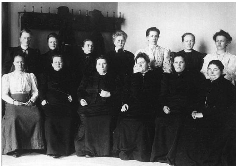
سیانزه له ۱۹ نه‌ندام په‌رله‌مانی ژن له په‌رله‌مانی فینلندا سالی ۱۹۰۷

له ئەوروپادا؛ له دهیهی یهکهمی سهدهی بیستهمدا، باکووری ئەوروپا پێش بهشهکانی دیکهی، ئەم مافهیان بۆ ژنان پهسهند کرد. له نیو ولاتانی باکووری ئەوروپاشدا ولاتی فینلندا بوو به پێشهنگ و دهستپێشخهر بۆ پیادهکردنی ئەم مافه و له ۱۹۰۷دا ژن چوونه پهڕلهمانهوه. دواهدوای ئەم نهرویز له ۱۹۱۳ و دانیمارک له ۱۹۱۵، ئەلمانیای و بهریتانیای له ۱۹۱۸، سوید له ۱۹۲۱ مافی خۆپالاوتن و دهنگدانیان بۆ ژن پهژراند. ۶