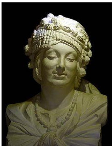
وینه ی پهیکه ی مهستوره ی ئهردهلانی

دهبیت بلین سوپاس بۆ مهستوره ی ئهردهلان که نهیهیشت خۆری سهدهی نۆزدهیهم به بی رووناکي پینووسی ژن ئاوا ببیت و بهرهمگهلیکی پینشکesh کردین که تا میژووی ئهدهبی کوردی ههیه شانازی پتوه بکات و میژووی ژنیش بهو بهرهمانه شاگهشکه بیت.