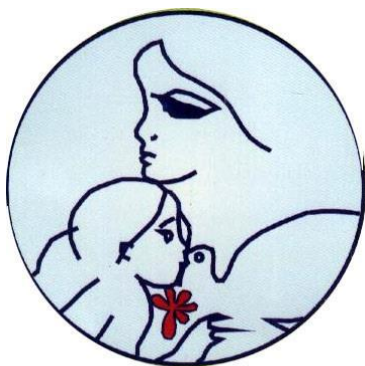
كۆمهڵه ئه ی ئافره تانی كوردستان / عراق

(كۆمهڵهی ئافرهتانی كوردستان/عێراق) بووه و هاوتەریب کاریان كردوووه بۆ بەدهستەئێنانی مافهكانی ئافرهتان و بههیزکردنهوهی پێگهی ژن لهناو كۆمهڵدا. یهكهمین گۆڤاری ژنان له سلیمانی سالی ١٩٥٢ له لایهن ئافرهتانی شیوعیهوه بهناوی (ئافرهتی ئازاد) به زمانی كوردی دهرچوووه. ٢٥