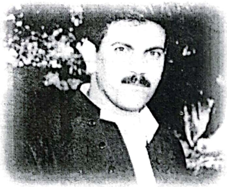
١٨ ئاراس ئیلنجاغی

شوون هه لگرتن له کوندا پیشهیهکی متمانه دارو جیگه ی باوهر بووه ، زور له بلیمه تانی کورد به بیر تیژی و سهرنجی وورد هه ولیان داوه ئه م