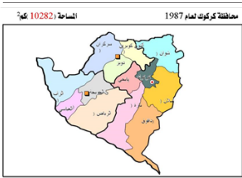
نەخشەى ژمارە ۳ كركوك ۱۹۸۷