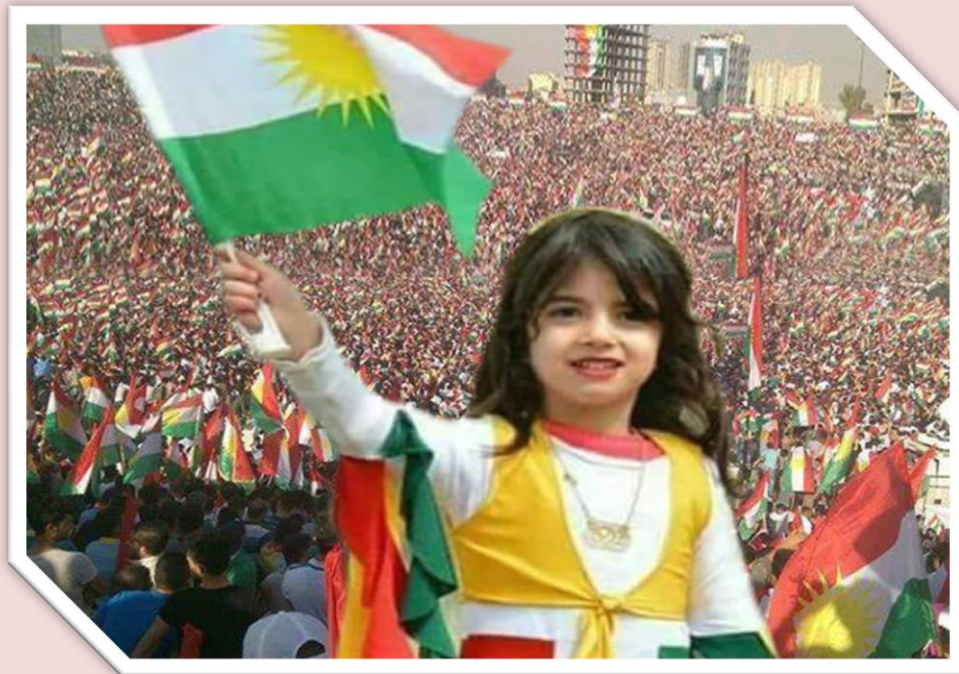
بژی کورد و کوردستان. به‌ئێ بۆ سه‌ربه‌خۆیی کوردستان