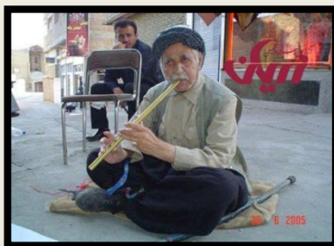
دېمانەيەكى بلاونەكراۋى ھونەرەند قالە مەرە