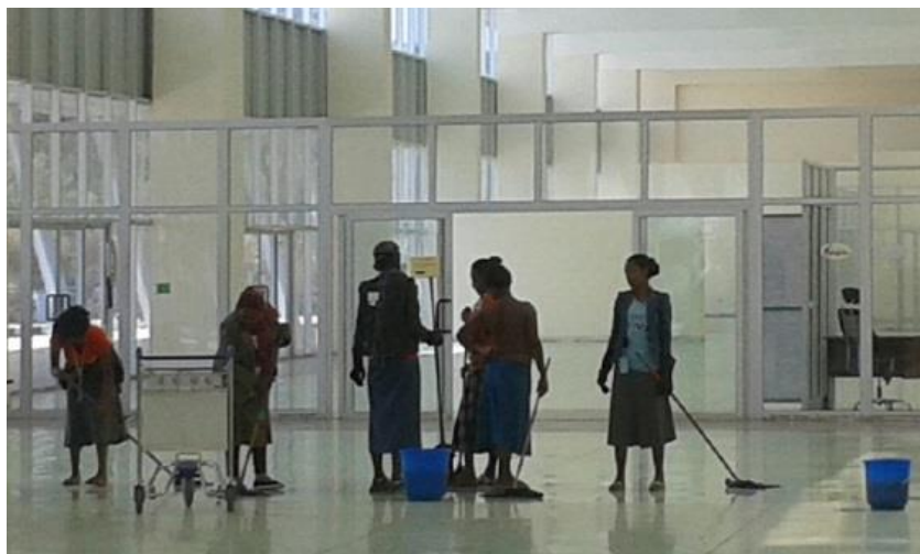
ژنانی کارگر له فرۆکه‌خانه‌ی به‌هردار