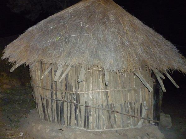
مائی میمکہ کہی سیراج ٹہ حمہ د عہلی