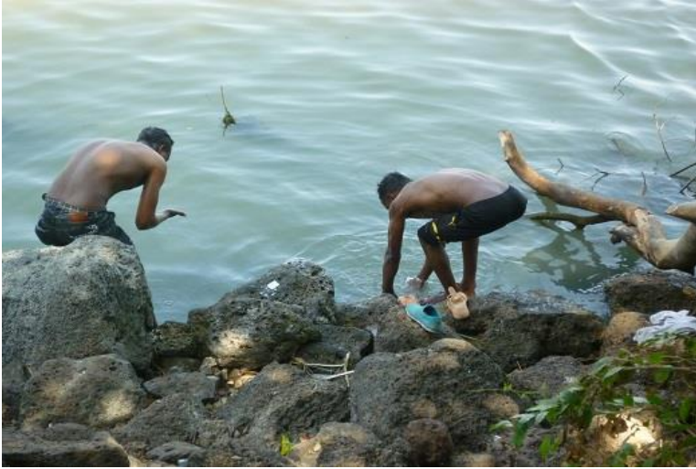
هه‌ژارانی شاری به‌هردار، له که‌نار زه‌ریاچه‌ی تانا، خۆیان و جله‌کانیان ده‌شۆن