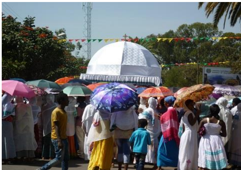
جه‌ژنی تیمکته له به‌هردار