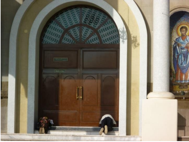
کرنۆشبردن و ماچکردنی زهوی و دیواری کلێسهیهک له ئەدیس ئەبابا