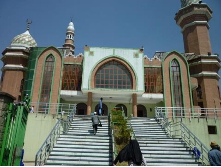
مزگهوتی ئەننووور (النور) لە ئەدیس ئەبابا