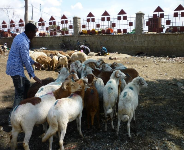
بازاری نازھل و جامبازان له ئەدیس ئەبابا