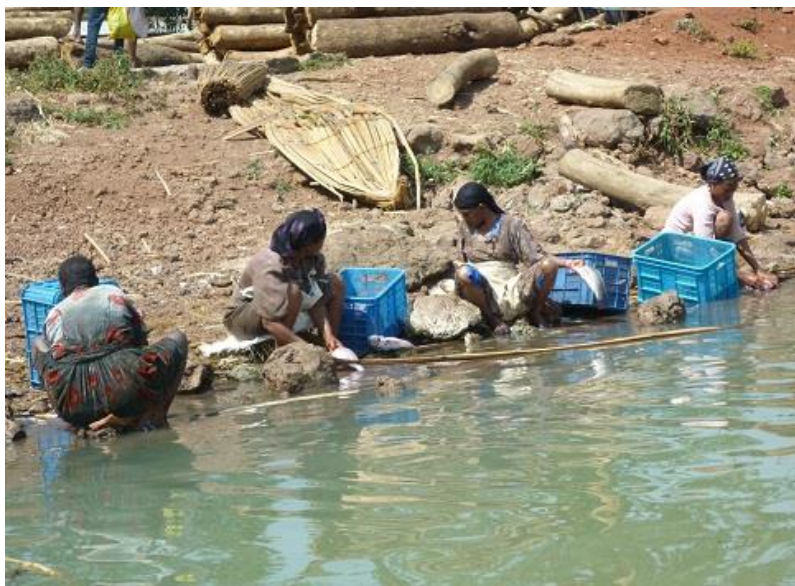
ژنه ماسی پاكه ره كانی به هردار