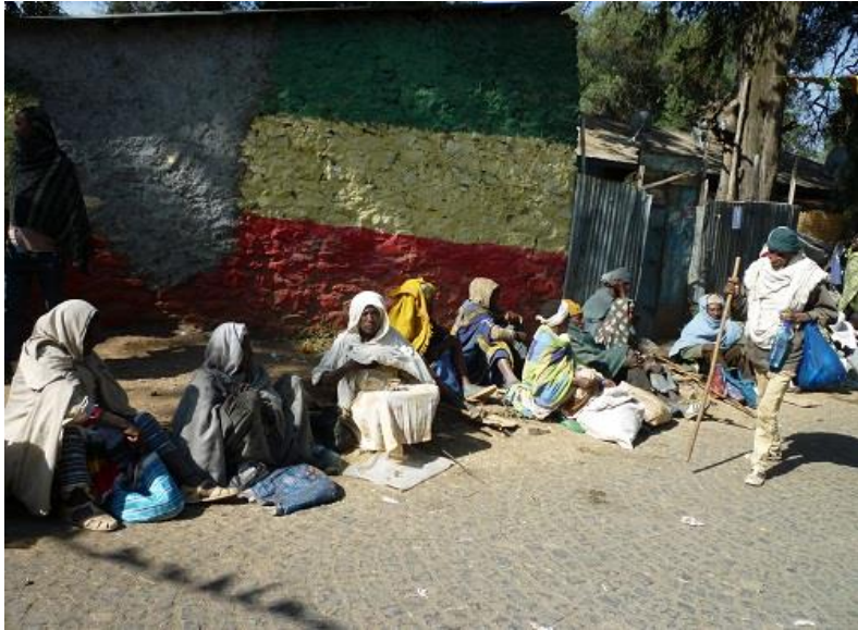
ده رۆزه که رانی گوندەر