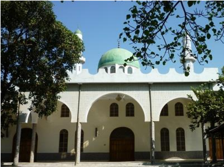
مزگه‌وتی سه‌لام یا سه‌لامه‌ت له شاری به‌هردار