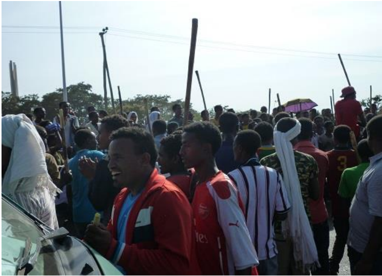
ٹاھہ ننگیرانی جھڑنی تیمکھت له گوندھر