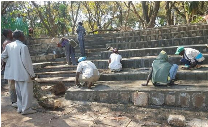
کارگران و چاودیرانیان له به‌هردار