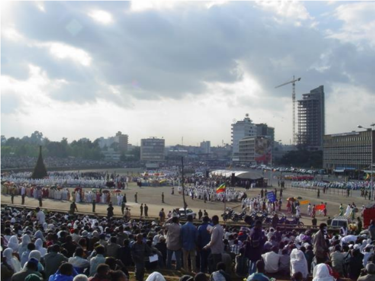
مهیدانی میسکال له ئەدیس ئەبابا