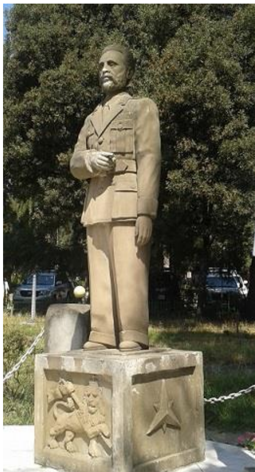
پهیکه‌ری هایلا سیلاسی له ئەدیس ئەبابا