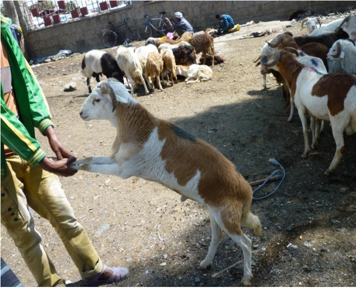
بازاری نازھل و جامبازان له ئەدیس ئەبابا