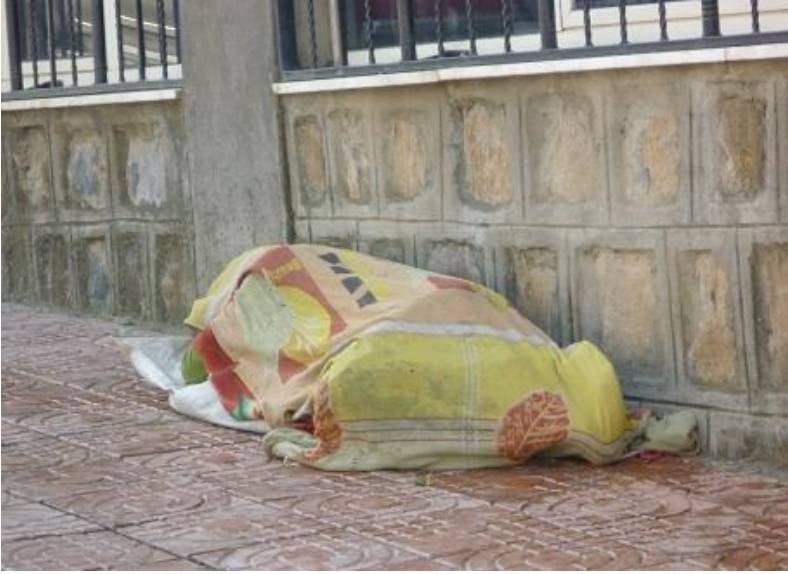
هه ژاریکی بئ مال له گوندەر