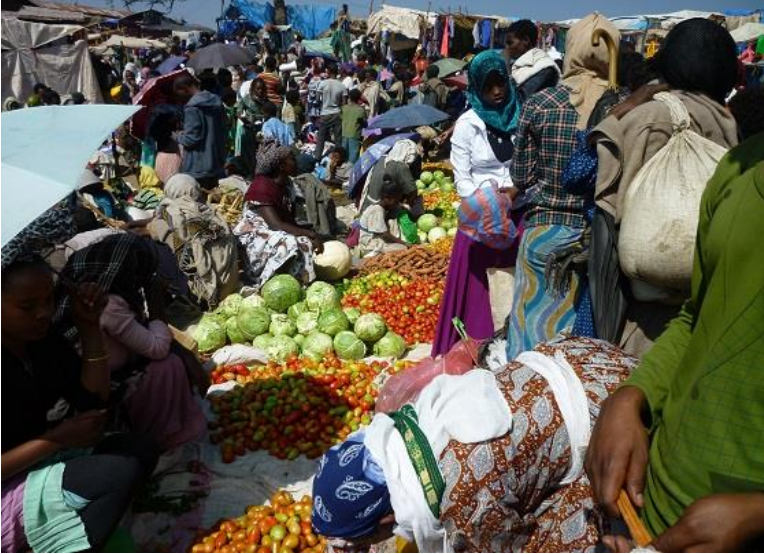
شهمه بازاره کهی لالیبیلا