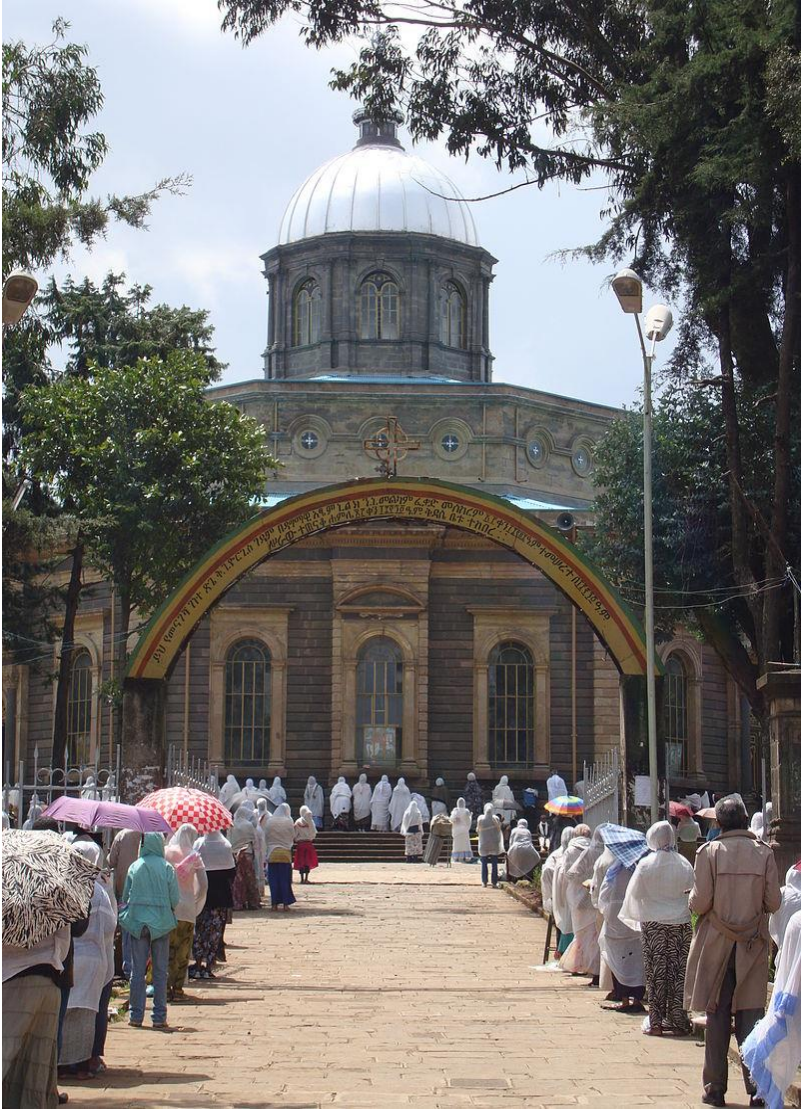
كاتدرالی سهینت جورج له ئەدیس ئەبابا