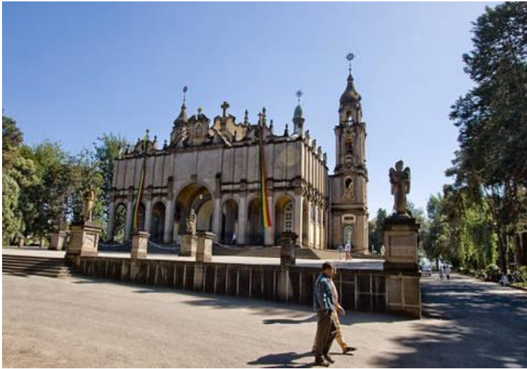
كاتدرالی سەینت جۆرج لە ئەدیس ئەبابا