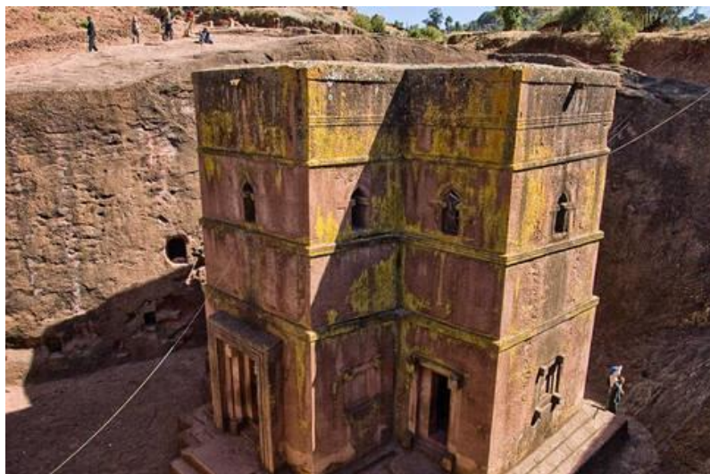
که نیسه ی سه ینت جورج له لالیبئلا