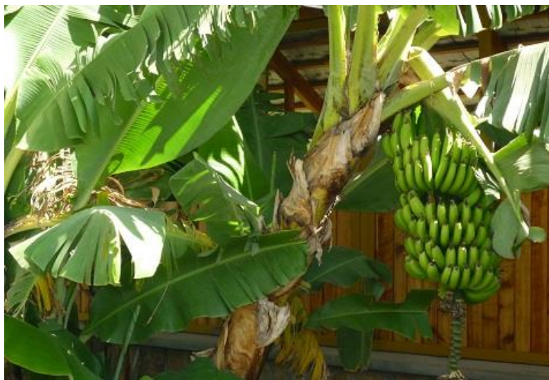
داری موز له بهردار