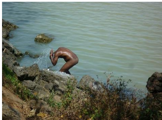
هه‌ژاریکی شاری به‌هردار، له‌که‌نار زه‌ریاچه‌ی تانا، خۆی و جله‌کانی ده‌شۆری