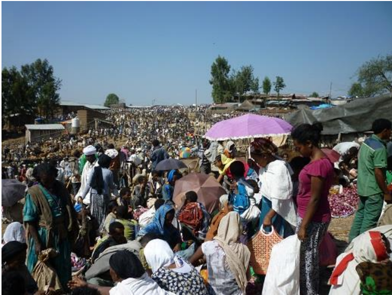
شہمہ بازارہ کہی لالیبیللا