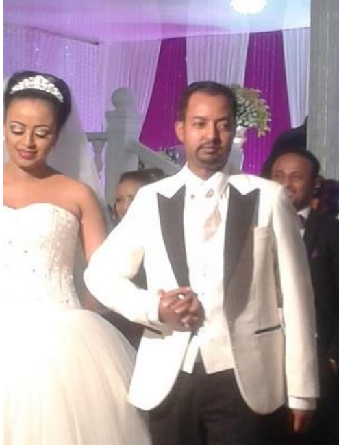
بووک و زاواکهی ئەدیس ئەبابا