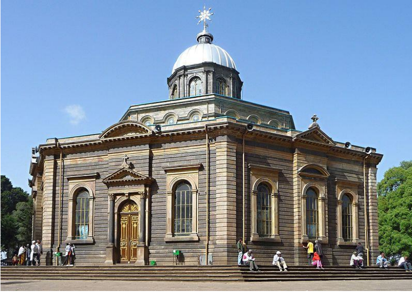
كاتدرالی سهینت جورج له ئەدیس ئەبابا