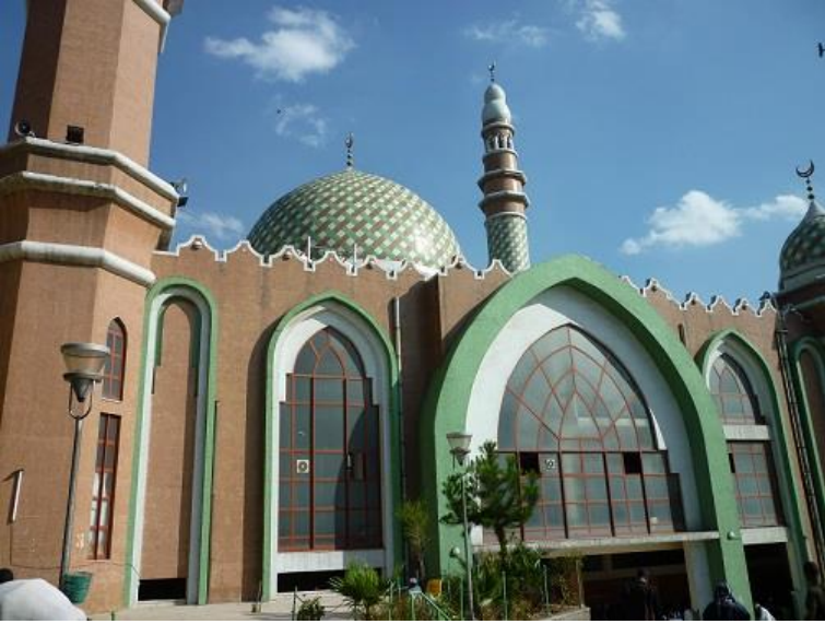
مزگهوتی ئەننووور (النور) لە ئەدیس ئەبابا