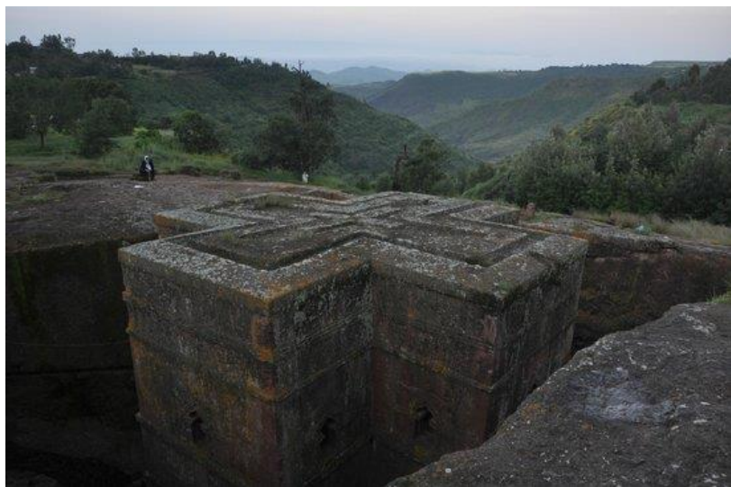
که نیسه ی سه ینت جورج له لالیبئلا