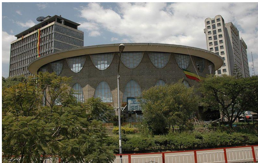
بانکی بازرگانی ئیسیوپیا له ئەدیس ئەبابا