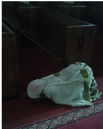
ژنیك له کلێسهدا له ئەدیس ئەبابا، کړنۆش دهبا و