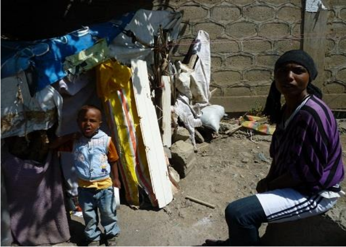
ئە و ژنه هه ژاره ی نێو کولبە که ی نزیک هوتیله که مان له