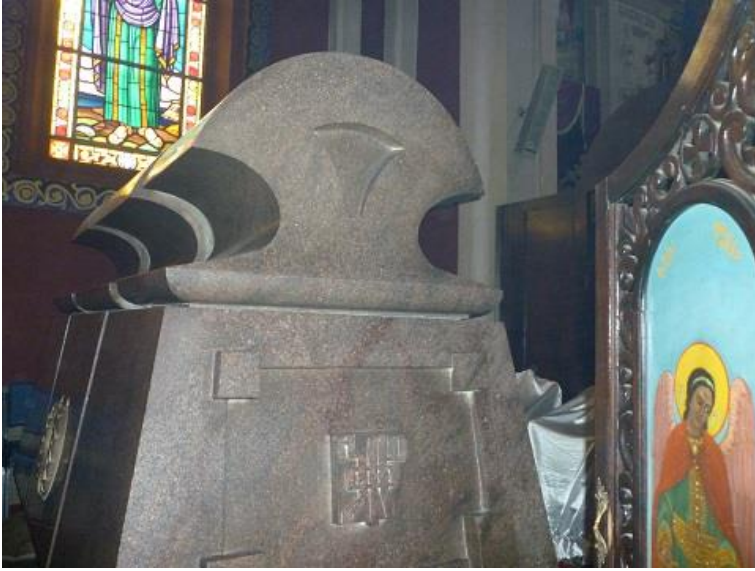
گۆپى ھايلا سيلاسى له كاتدرالى ئەديس ئەبابا