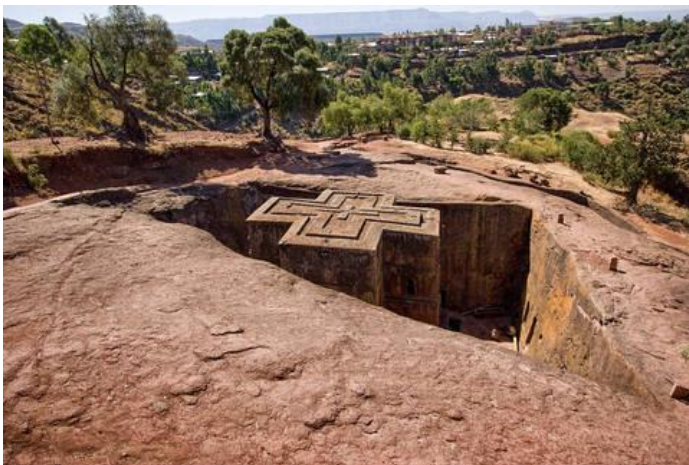
که‌نیسه‌ی سه‌ینت جورج له لالیبیلا