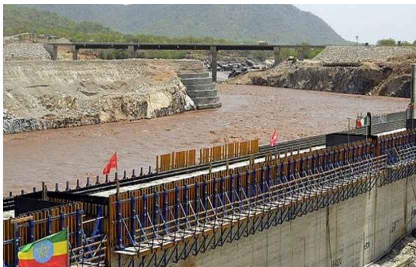
به‌نداوه مه‌زنه‌کە‌ی رابوون