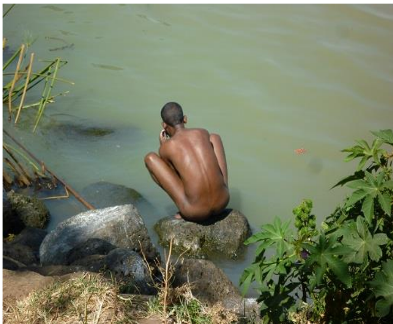
هه‌ژاریکی شاری به‌هردار، له‌که‌نار زه‌ریاچه‌ی تانا، خۆی و جله‌کانی ده‌شوا