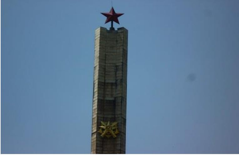
شوینہ وار و پاشماوہی ریژیمہ سۆسیالیستیہ کہی ئیسیووپیا له ئه دیس ئه بابا