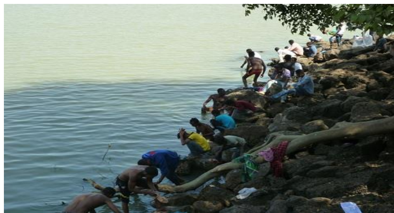
هه‌ژارانی شاری به‌هردار، له که‌نار زه‌ریاچه‌ی تانا، خۆیان و ج‌له‌کانیان ده‌شۆن