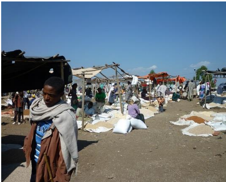
شهممه بازاره که ی لالیبیلا