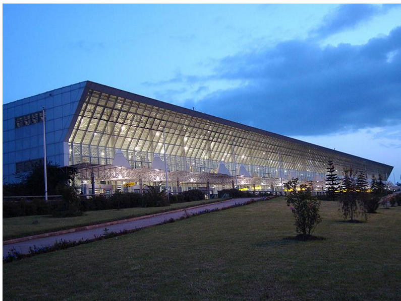
فېۋكەخانەى بۆلى لە ئەدىس ئەبابا