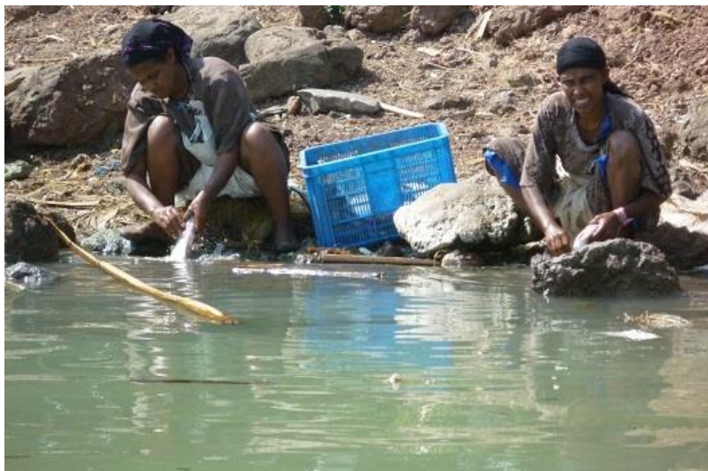
ژنه ماسی پاكه ره كانی به هردار