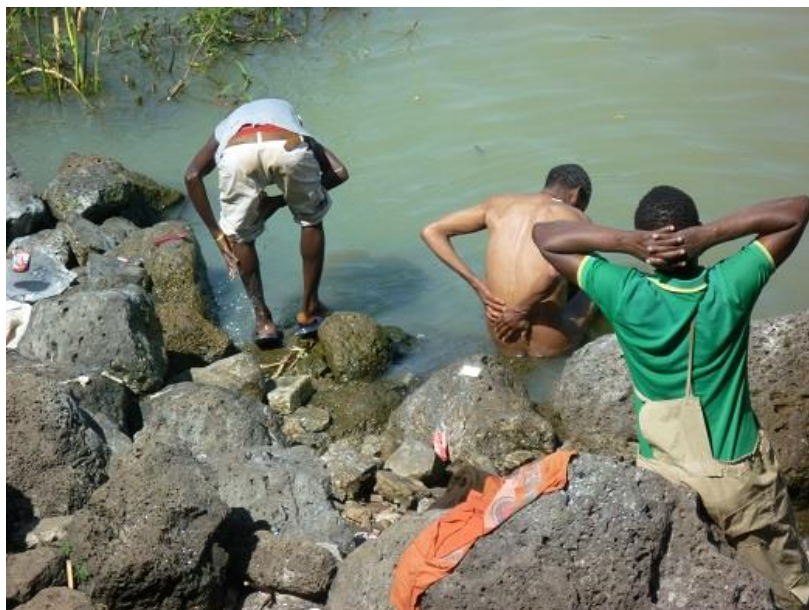
هه‌ژارانی شاری به‌هردار، له که‌نار زه‌ریاچه‌ی تانا، خۆیان و ج‌له‌کانیان ده‌شۆن