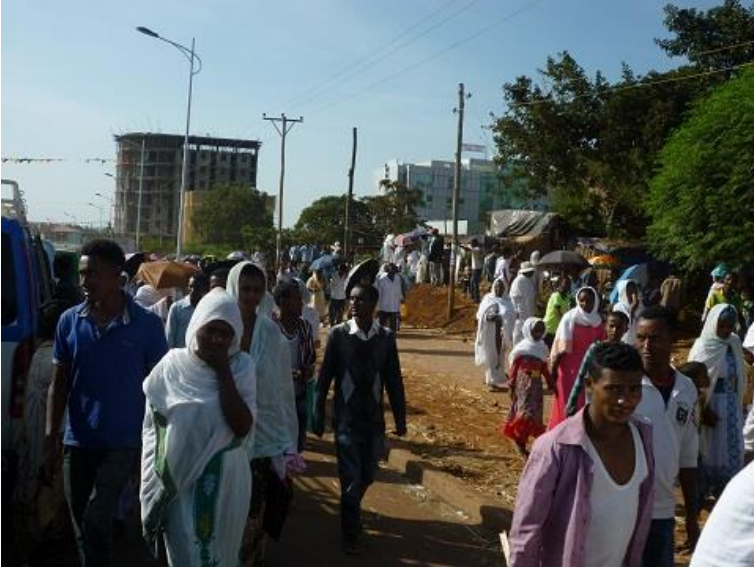
ٹاھہ ننگیرانی جھڑنی تیمکھت له گوندھر