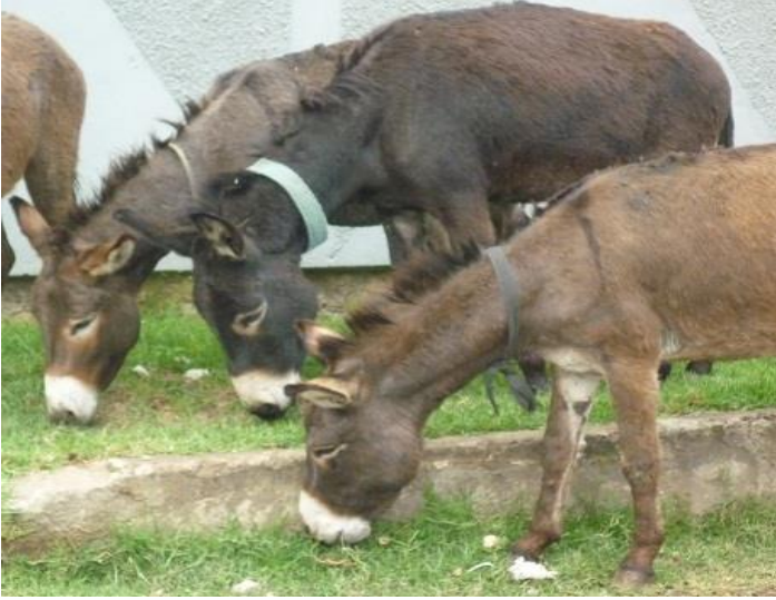
که رگه لی ئە دیس ئە بابا