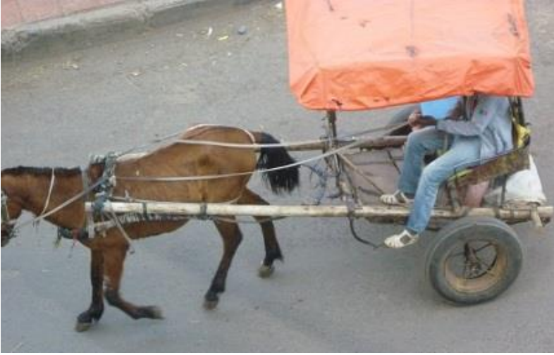
عەرەبانه و ئەسپ لە باژێری گۆندەر