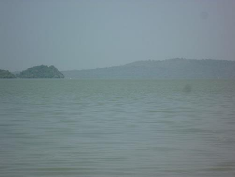
زهريآچهي تانا و سه رچاوهي نيلي شين له بهردار