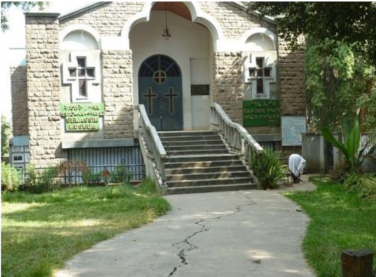
موزه خانه ی هایل سیلاسی له ئه ديس ئه بابا