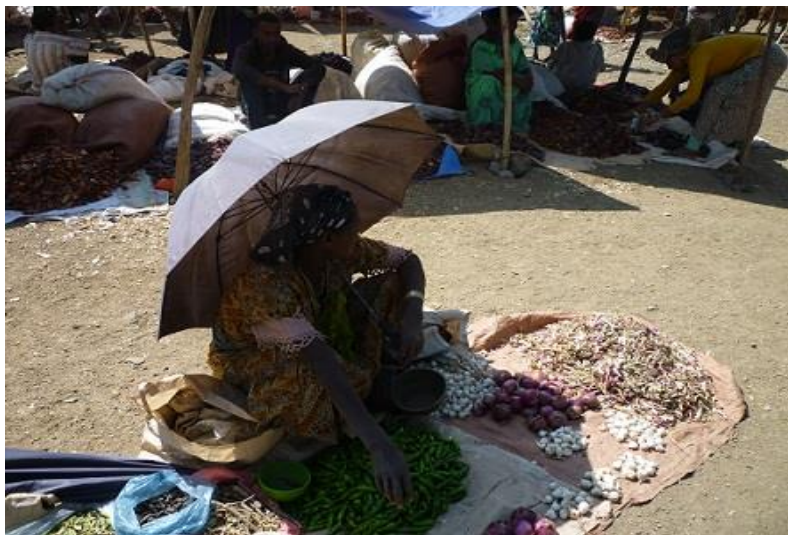
شہمہ بازارہ کہی لالیبیللا