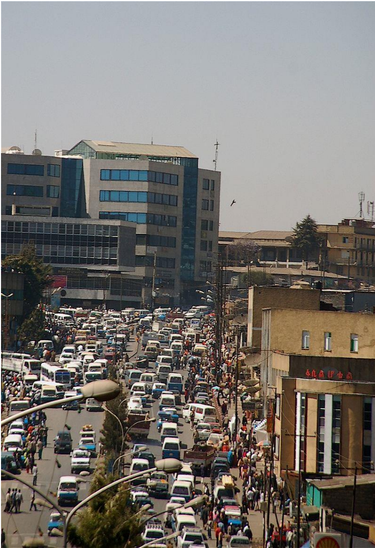
شہ قامیک لہ نیوہندی شاری ٹہدیس ٹہبابادا