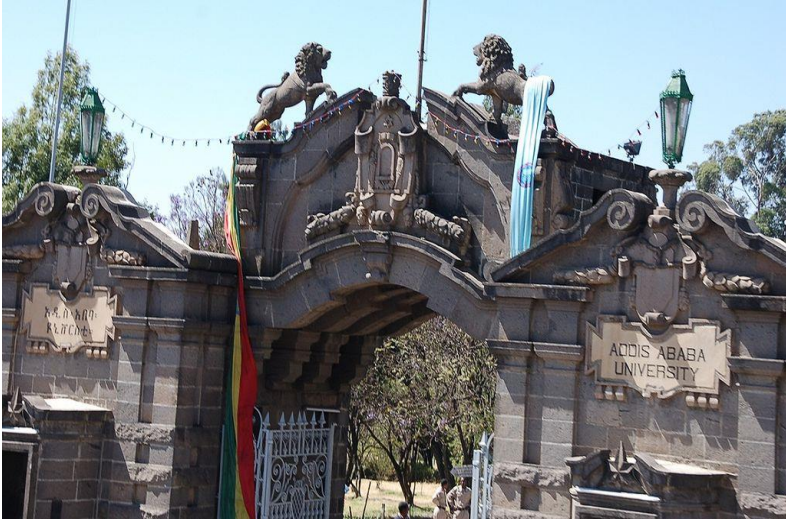
زانستگه‌ی ئەدیس ئەبابا