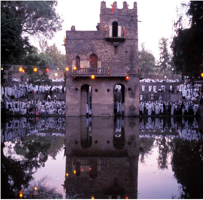
مه‌له‌کردنی نیو هه‌سیلی فاسیلیدس له جه‌ژنی تیمکه‌تدا له گۆنده‌ر