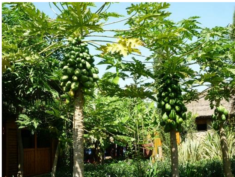
داری پایا له بهردار