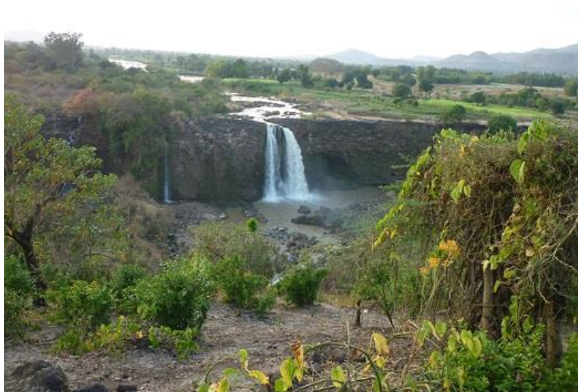
تاڦگه‌کە‌ی سه‌ر نیلی شین له به‌ه‌ردار