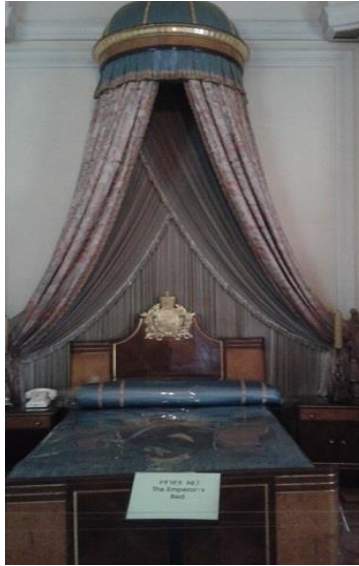
تهختی خهوتنی هایلا سیلاسی له مۆزهخانهی ئەدیس ئەبابا