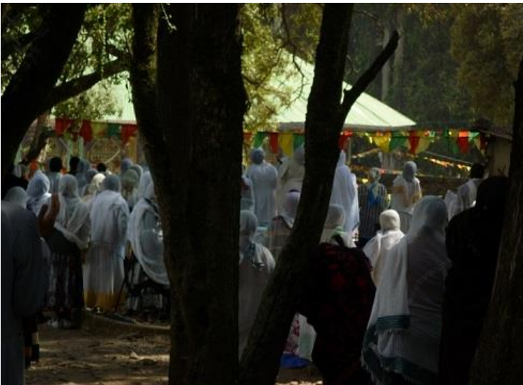
جهڙني تيمڪهت له بهردار