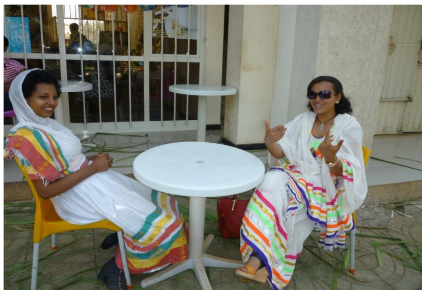
بی‌زا و مه‌سیره‌ت، دوو خوشکه‌که‌ی شاری به‌هردار