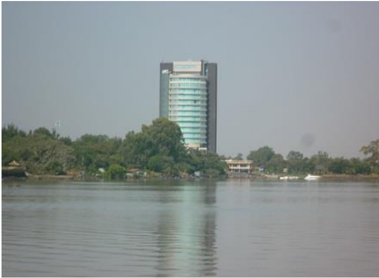
زهريآچهي تانا و هوتيلنيک له بهردار