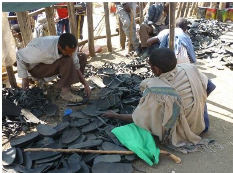
کارگە ی کەوش دروستکردنی شهمه بازاره‌کە ی لالییلا