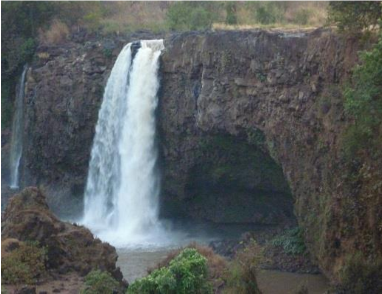
تاڦگه‌کە‌ی سه‌ر نیلی شین له به‌ه‌ردار