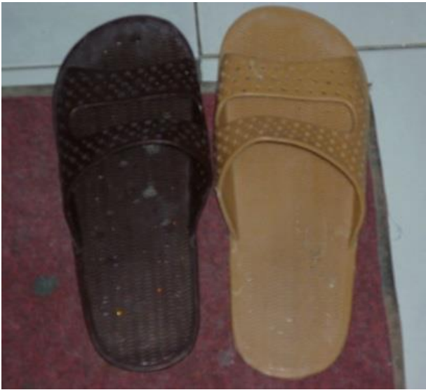
جووتە سه‌رپێیه‌کانی هۆتێله‌که‌ی گۆندەر