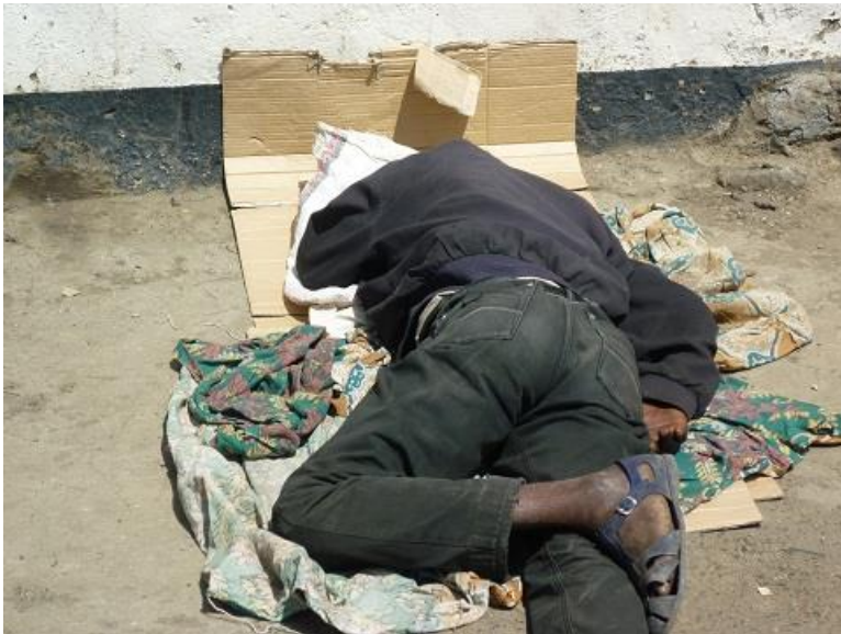
هەزارێک لە ئەدیس ئەبابا