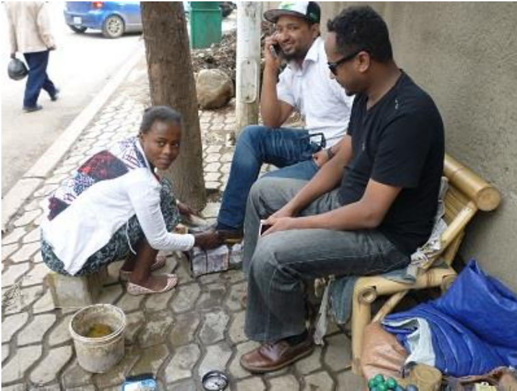
كچىكى كەوش بۇياغكەر له ئەديس ئەبابا