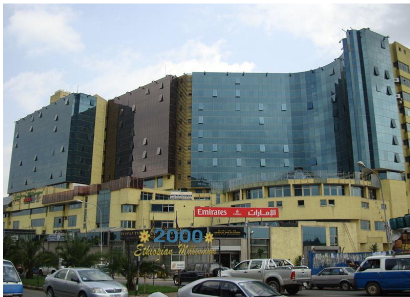
بازاری دیمبل له ئەدیس ئەبابا