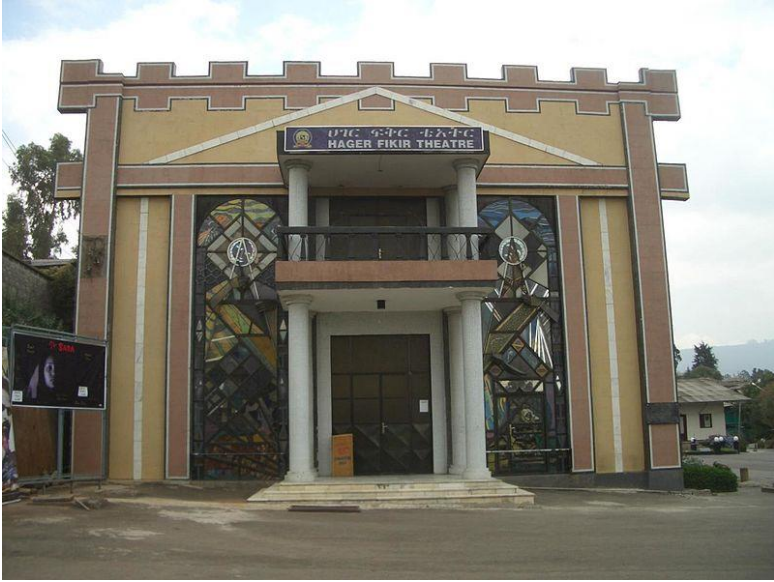
شانۆی هاجەر فیکیر له ئەدیس ئەبابا