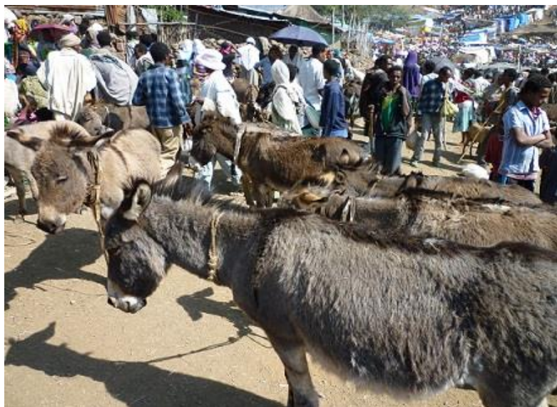
شهمه بازاره‌کە ی لالییلا