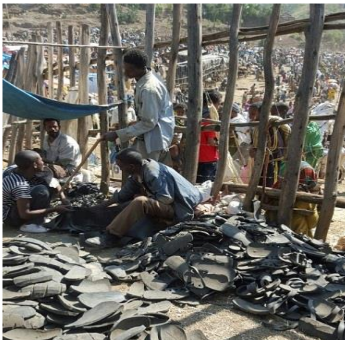
کارگهی کهوش دروستکردنی شه‌مه‌بازاره‌که‌ی لالیبیلا