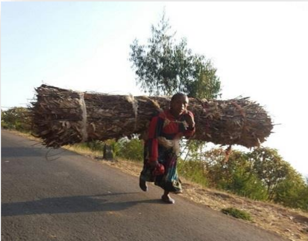
کچه دارکیشیک له چپای ئینتوتۆوه دیته خوارهوه به ره و نیو