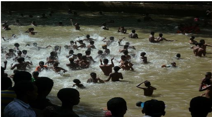
مه‌له‌کردنی نیو هه‌سیلی فاسیلیدس له جه‌ژنی تیمکه‌تدا له گۆنده‌ر