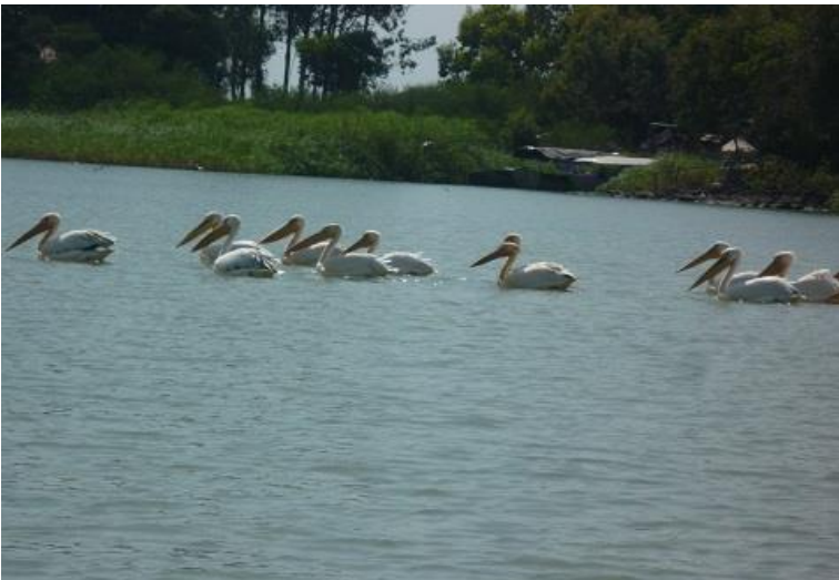
كهلك (سه قاقوش، په ليكان) هكاني نيو زهريآچهي تانا له بهردار