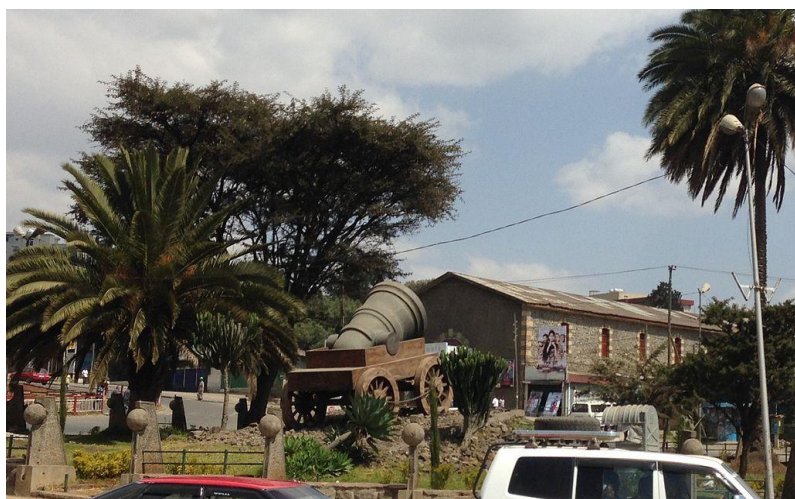
مەيدانى تىۋدرۆس و تۆپى سىياستۆپۆل لە ئەدىس ئەبابا