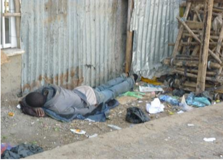
هه‌ژاریک له ئه‌دیس ئه‌بابا