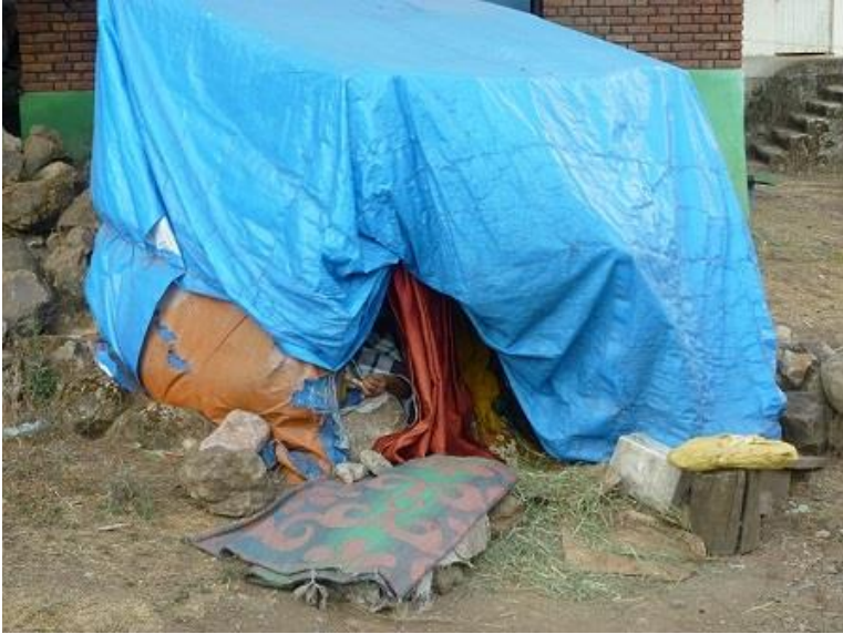
ماله هه ژاريك له ئه ديس ئه بابا