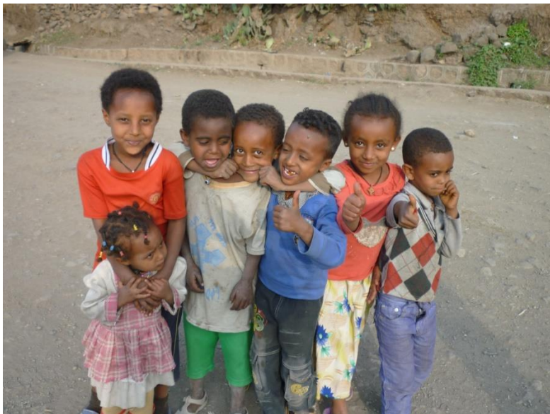
كۆمهلىك زارۆك له باژىرى لالبيىلا