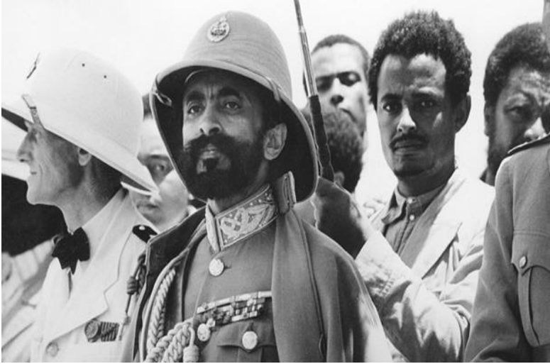
هايلا سيلاسی، ئيمپراتوری پيشووتری ئيسیووپیا