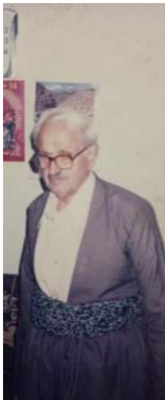
پهشید هۆرامی و دایکم، شارا موحه مه د ئه مین بیاره یی