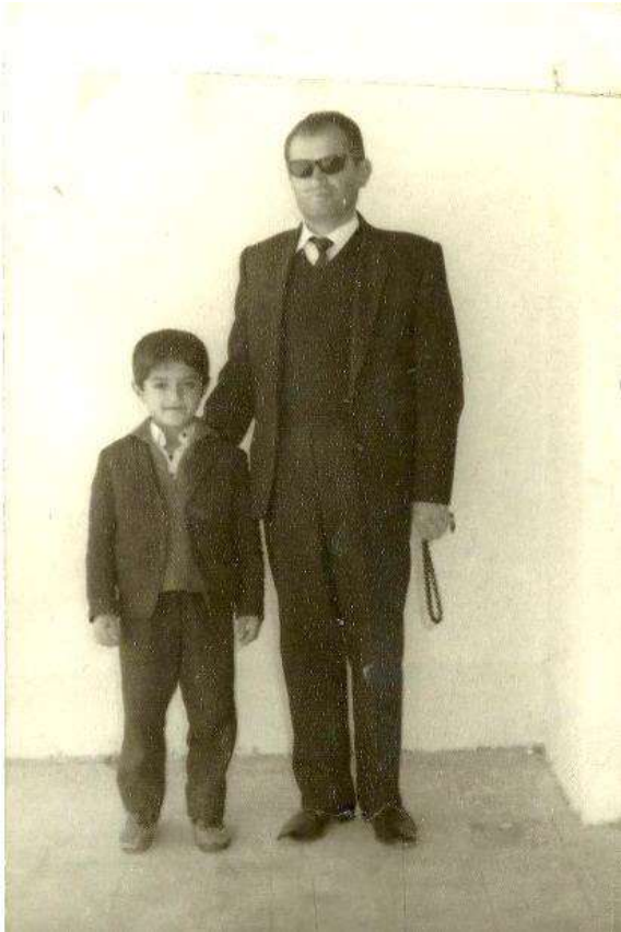
وینہی باوکم و ہاورپی برام.