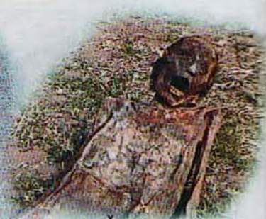
شپىرى و ئەبلەقبوون به روخسارىه وه دياره