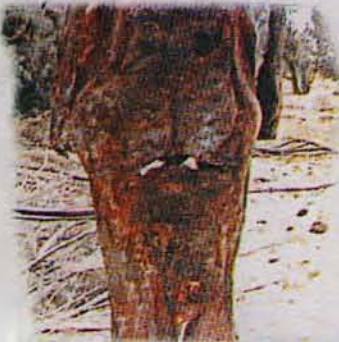
ناوقه ده كه دريژ بووه