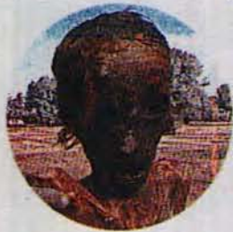
مۆمياي هاوه لاني شه ممه كه خوا غه زه بي ليگر توون و به راستي كر دووني به مهيموون و به راز .. له فهله ستين دۆزراونه ته وه .