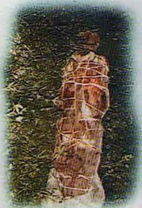
مۆمياكه به پيچراوه يي