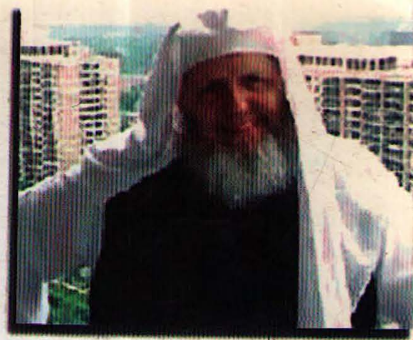
قەشەى ئەمريكى يوسف ئەستيس له مەسيحيهتەو بەرەو ئيسلام .

يانزهى سيبتييمبەر ئەر رۆژه بوو كەبە گویرهى زۆرىك لە ليكۆلەرەوان ميژووى ئەر سەردەمەى كرد بە دووبەشەو .. هيندە رووداويكى كاريگەر بوو .. هەندى واي بۆ دەچوون كە ئەر كارەساتە كۆتايى بە بلابوونەوئەى ئيسلام بهينيت له جيهاندا .. بەلام موسلمان بووني بە ليشاوى خەلكانيكى زۆر لەولاتە يەكگرتووەكانى ئەمەريكائەوروپا پيچەوانەى ئەر رايە ئەسەلينييت .. موسلمانبووني يوسف ئەستيس نمونەيهكى زيندووى ئەر بوارەيه .