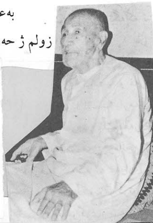
١- ئەف مسرە عا ژ شیعرا خودی لێخوشبو نالەندەهاتیە وەرگرتن