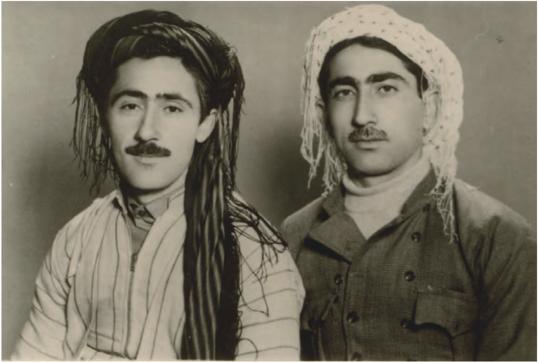
کاک ئەمیر قازی - شەھید سلیمانی موعینی