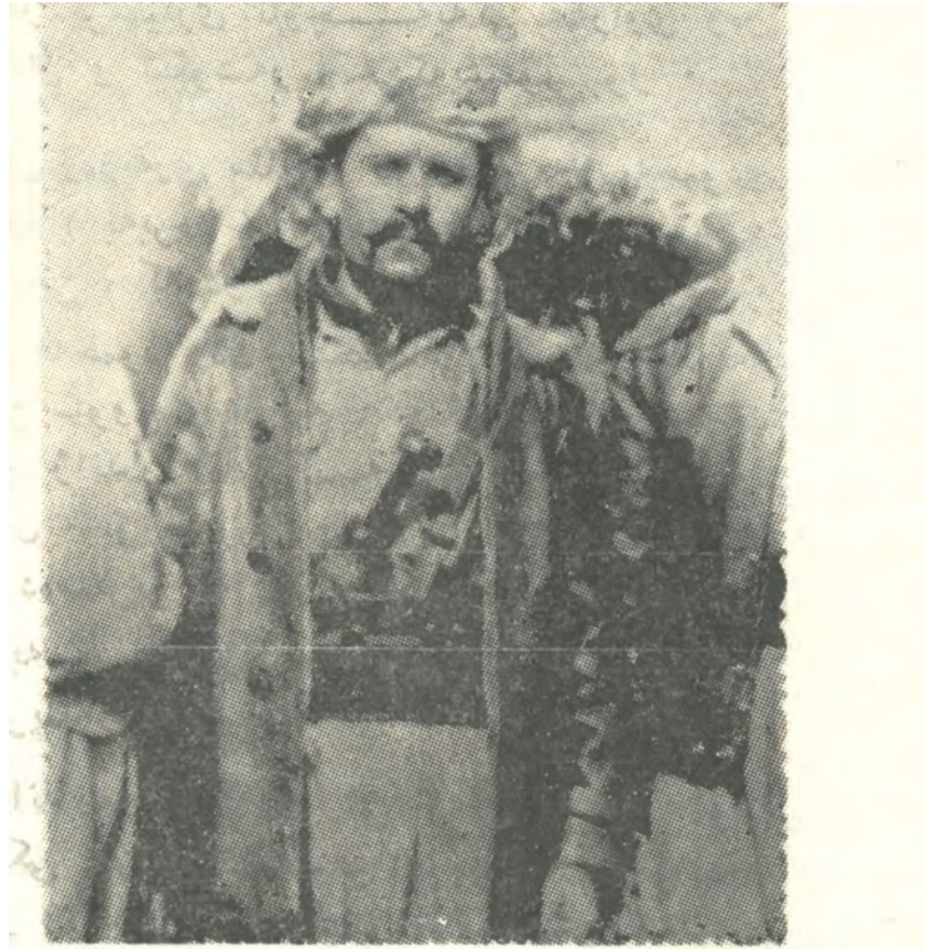
مهلامه حمودی ئەحمەد زاده مهشهور به زهنگه نه