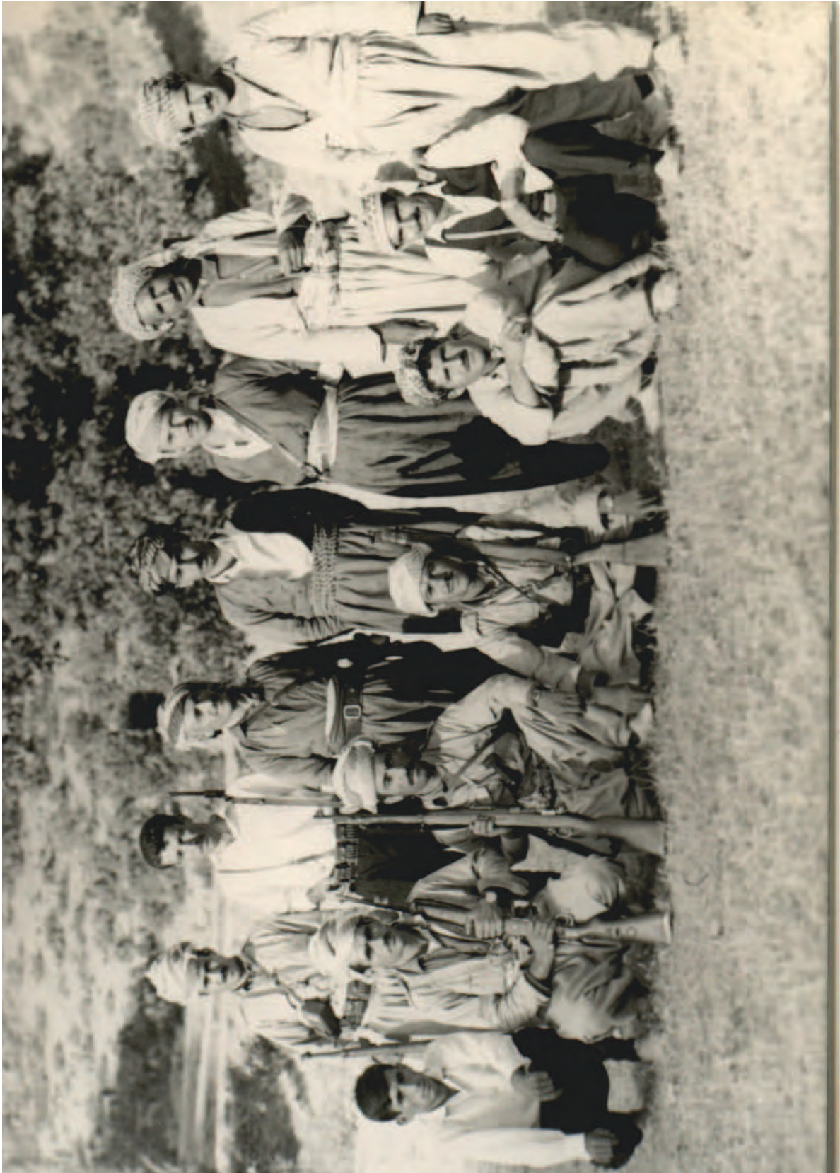
کاک ته حمه د- کاک ته میری- مه لاره شید و...

محهمه د خزری (قهره قشلاقی) له ۱۹۶۷ د له خه لان- ناوچه ی باله ک.