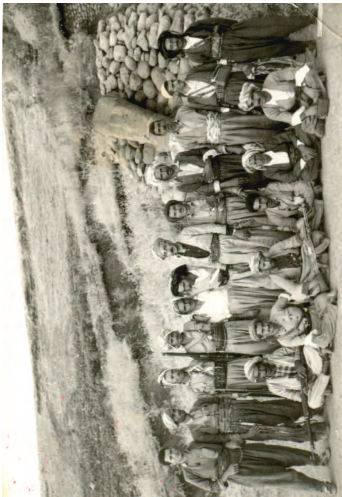
سەر پووتی قه اخی عه بدوللای موعینی یه