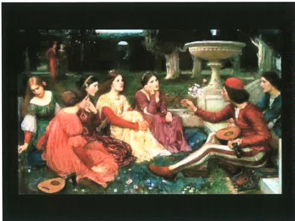
پیکر له رسمه‌کانی که بو دیکامپرون کیشراون