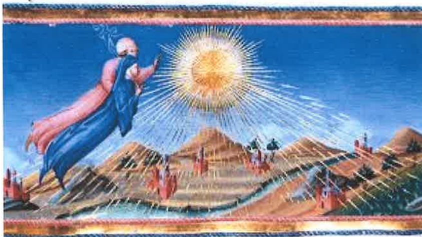
دانته و دلبرمکھی له " بههشت"ی کومیدیایدا