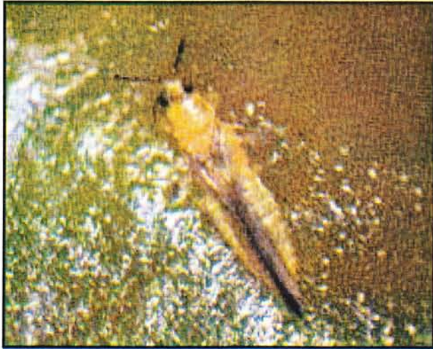
Scirtothrips dorsalis له (Nippon Soad Co.) وهرگیراوه