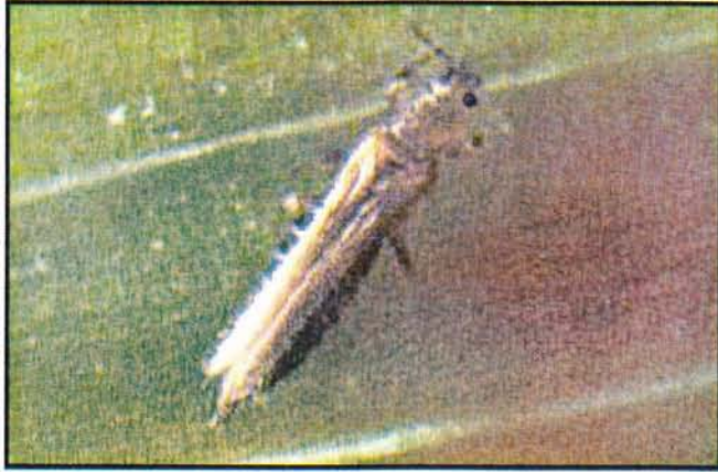
Thrips tabaci Onion Thrips