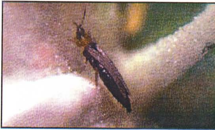
Frankliniella intonsa Flower Thrips