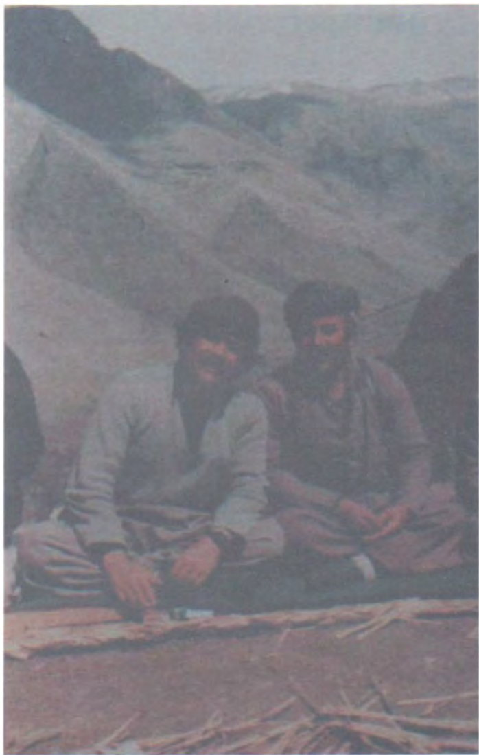
لهگه ل شیزکو بینکاس