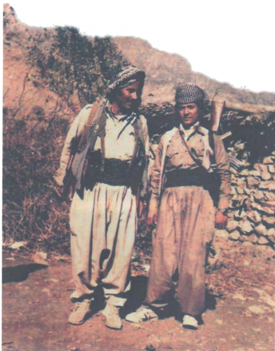
یه‌که‌م پوژی هاوسه‌رگیریمان سالی ۱۹۸۰