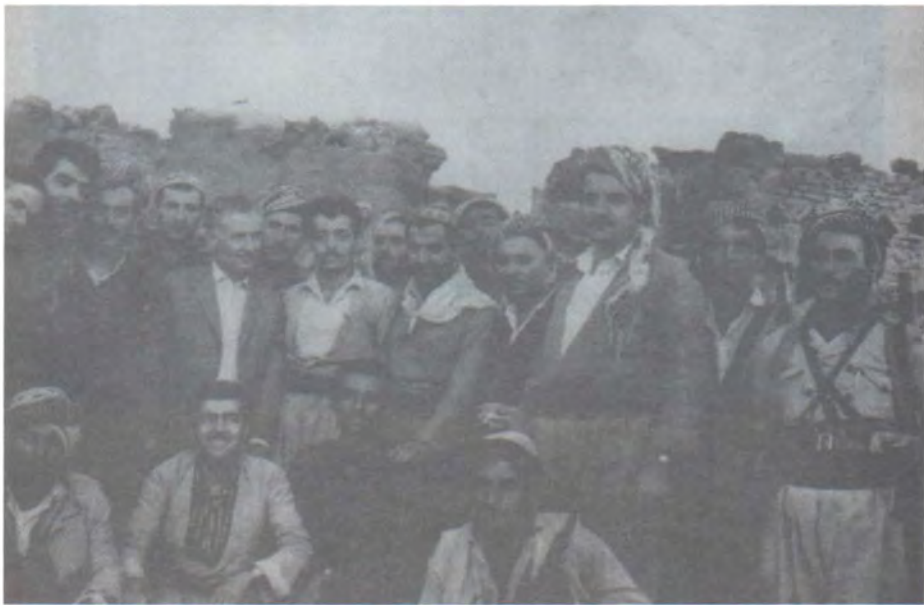
سالی ۱۹۶۷ کونفرانسی تیمار له قهره داغ