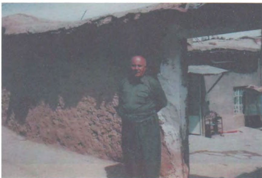
يەكەم بىنگە بۇ ئىشوكارى كۆمەلە لە چەمچەمال