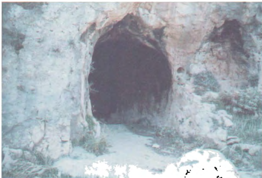
ئەشكەوتى دوو كۈنى چەمى رەزان يەكەم مقەرى پىشمەرگە