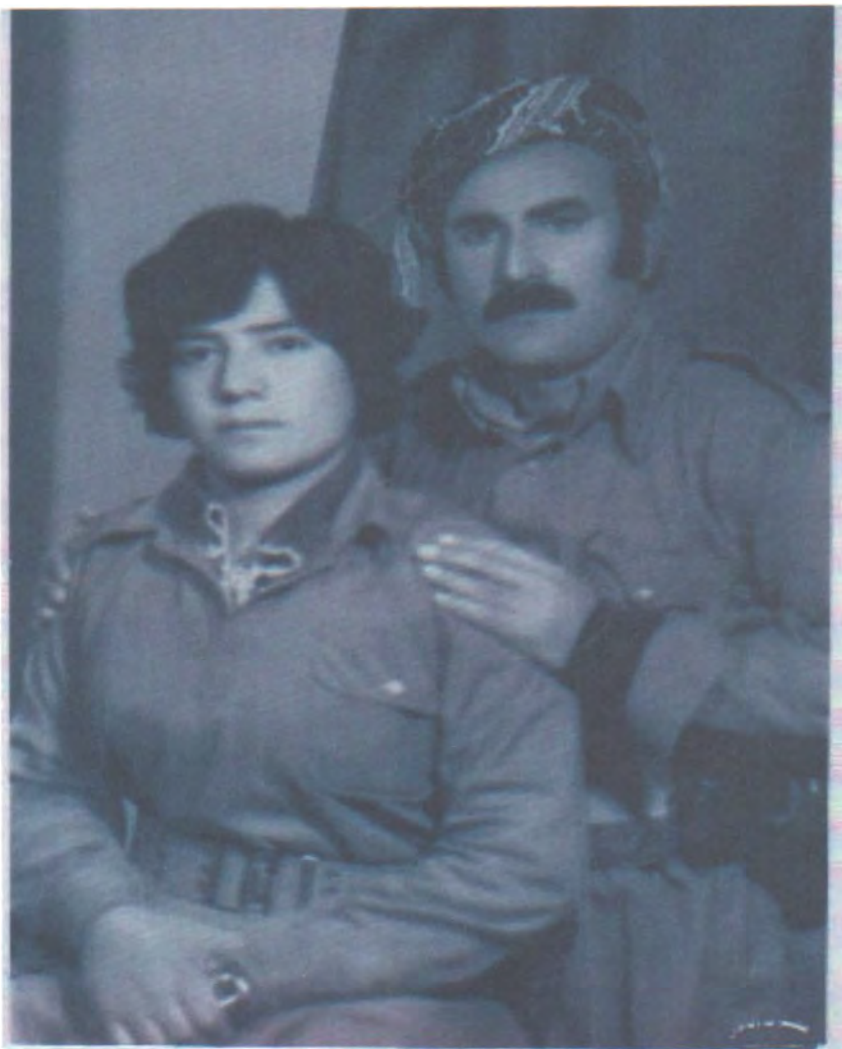
بۆكان سالى ۱۹۸۰