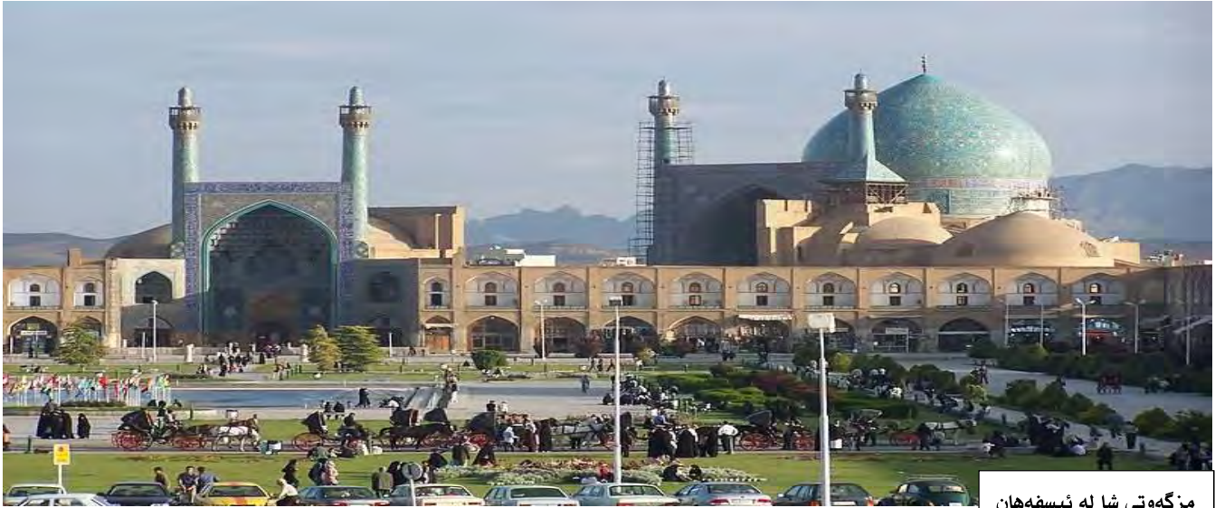
مزگوتى شا له ئىسفهان

بوو هەندىك جار دەيانووت رپاكارى دەكات. ئەو زۆر له پىش سەردەمى خۇيەو دەزىا و شىوازى ژيانى ئەو له گەل خەلكانى دىكەى ئەو زەمانە جىاوازى هەبوو بۇيە كە نىگەران دەبوو دەيگوت: خۇزگە دەمزانى من كېم؟ لەم جىهانەدا بە دواى چىدا دەگەرېم؟