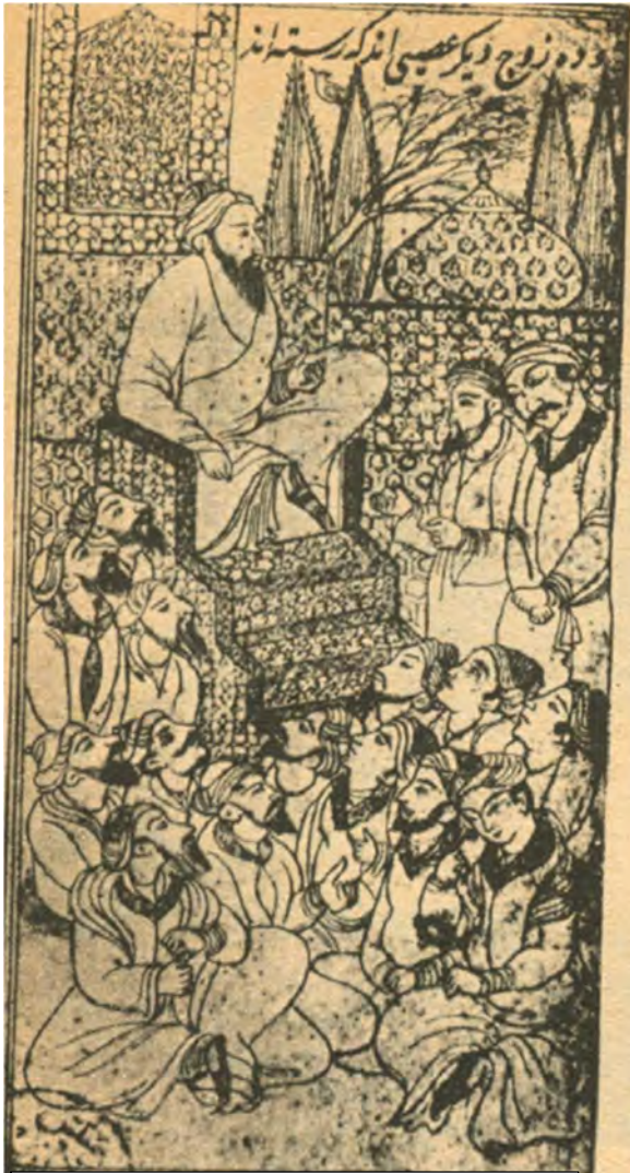
ئىبن سينا لە كاتى وائە وتتەو. ( ئەم نەقاشىيە دەگەرپتەو بۇ سەدەى حەفدەى زايىنى لە ئىران)

له سەردەمى رېنسانس لە ئەوروپا زۆر بەناوبانگ بوو. زەكەرياي رازى كىتابى زۆرى لە بارەى پزىشكىيەو نووسىيەوتەو كە بەناوبانگترين كىتابەكانى برىتى بوون لە: مەوسوعەى پزىشكى (الهاوى)، كىتابىك لە بارەى نەخۇشى ئاۋلە(الجدرى) و چەندىن كىتابى دىكەى بەنرخ.