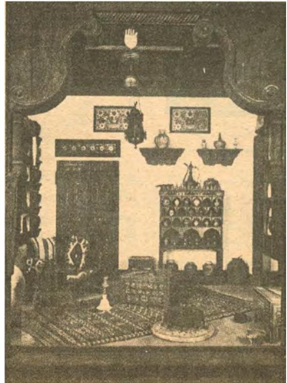
دەرمانخانەى يەكپك لە پزىشكە عەربەكان.