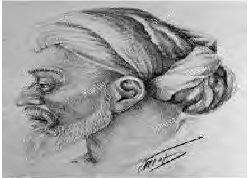
سىماى ئىبن سينا له رووى پېكهاتهى كهاللهسەرى.

ئىبن سينا لايهتى خوئ له بارودوخيكى ناوادا بهسهبردوو، و ئەم بارودوخه جياوازهش بووه هوى ئەوى بابتهكان له ديدگايهكى نوپوه بهررسى بكات.