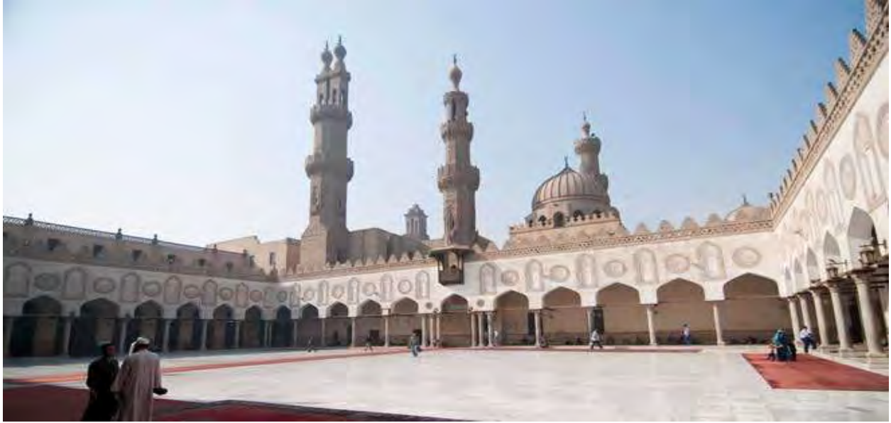
زانكۆى ئەزھەر، كۆنترىن زانكۆى موسلمانان لە سالى ۹۷۰ كۆچى بونىياد نراوه.

نيزامىكدا و بە تايبەت ئىسلام كە ھەموو مەسائىلەكان بەيەكەوھ پەيوەستن، ئەگەر بەشيك گومانى لەسەر دروست ببىت زۆر بە خىرايى ھەموو سيستەمەكە دەكەويته ژىر گومانەوھ؛ ئەوھش ئەو خالە بوو كە ئىبن سينا و زانايانى دىكەى ئەو كاتە سرنجيان دابوو.