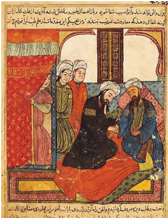
پزىشك له كاتى چاره سه ركردنى نه خو ش.

بيگومان بىروباوه رى ئىبن سينا له بارهى هه نديك له نه خو شيه كانى ئه مرؤ سه رسوره ينه رن بو ئيمه و هه نديكي شيان هه لهن، به لام بو ئه و كاته له پيشكه وتوتيرين چاره سه رى پزىشكى بوون. ئىبن سينا ده رمانى نوپى بو چاره سه رى بو ن ناخوشى دۇزيه وه. ناويان لى نابوو سولتانى پزىشكان و له پاش مه رگيشى پزىشكانى ناوچهى ئيسلامى به هوى پشت به ستن به بهرهمه كانى ئىبن سينا توانيان پيشكه تنى بهرچاو به ده ست بيئن.