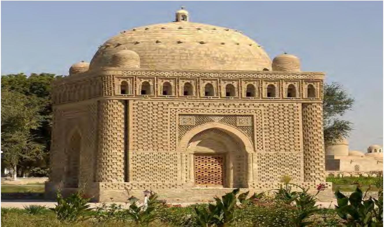
قەبرى يەكېك لە پادشاكانى ساسانى لە بوخارا.

بە تىپەربوونى كات ئىرانىيەكان و رۆمىيەكان پىگە گرنگەكانى خەلافەتيان گرتە دەست، ئىستا عەرەبەكان تەنھا جەنگاوەرانىكى ئازا بوون كە بە تىپەربوونى كات ئەوەشيان لە دەستدەدا. عەشیرەتە عەرەبەكان دەستيان كرد بە جەنگ و ئاژاوه بەرامبەر يەكتر و ئاشوبيان دژى دەسەلاتى خەلافەتیش دەگىپرا. ھەر لەبەر ئەوەش بوو كە عەباسىيەكان وردە وردە فەرماندەيى سوپايان دەدايە دەست بەردەكان، كە زۆر جار ئەو بەردانە شوانە جەنگاوەرە توركەكان بوون، ئەوانىش بەرە بەرە دەسەلاتيان و دەستەيىنا و لە كۆتادا دەسەلاتى بەرپۆەبەرى خەلافەت كەوتە ئەستۆى توركەكان، و خەلىفەكانى عەباسى تەنھا بە ناو فەرمانرەوا بوون.