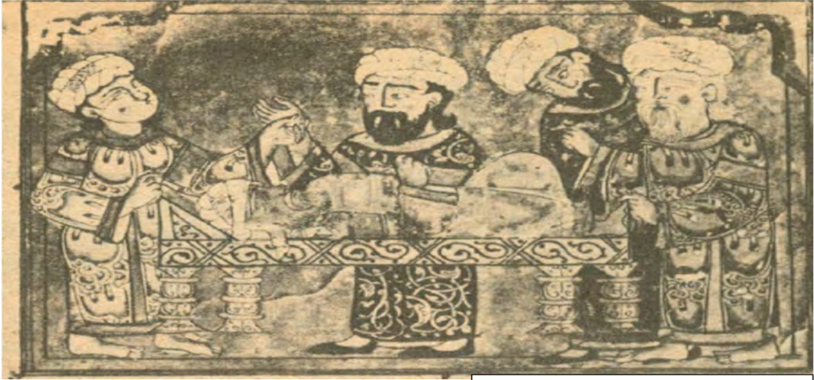
پزىشكىكى عەرب لە كاتى چارەسەركردنى نەخۇش.