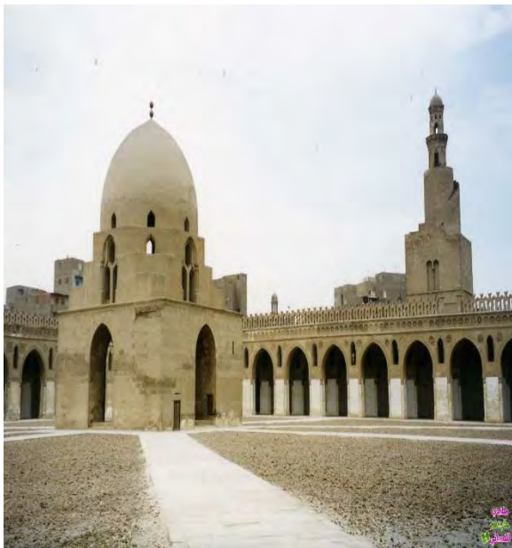
مژگەوتى ئىبن تولىن له مىسر، كۆنترين پەرستگا له مىسر.

عەرەبەكانى سەرەتاي خەلافەت بۇ ئىدارە كرنى حكومەت پەپرەويان له نيزامى جۆراوجۆرى حوكمپرانى دەكرد.