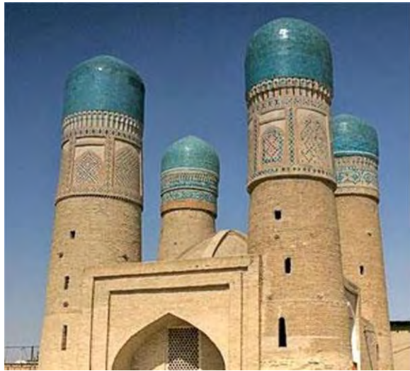
مزگەوتىكى شىن لە بوخارا.

خەلكەكانىشى كە ئىمە ئىستا پىيان دەلئىن يۇنانىيەكان زىاتر شويىنكەوتەي ئايىنى مەسىحيەت و لە مەزەھى ئورتۇدۇكس بوون. ناوچەكانى ئىمپراتورىيەتى شىكستخواردووى ئىرانىش كەوتبوو پۇژھەلاتى خەلافەتى ئىسلامى، كە دانىشتوانەكەي شويىنكەوتەي ئايىنى زەدەشتى بوون.