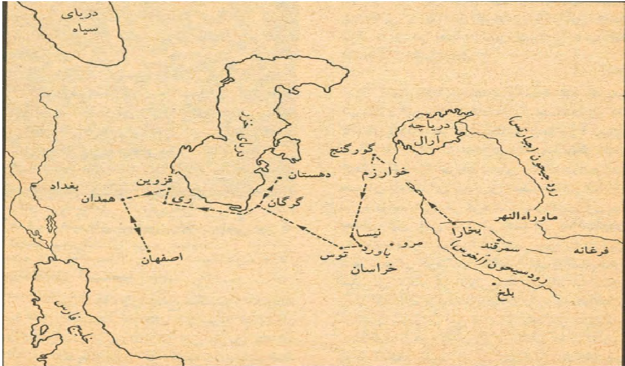
ناراستەى سەفەرەكانى ئىبن سينا

تەمەنى ۱۸ سالىدا شارهزايى لە زانستەكانى مەنتىق(لوجيك)، بىرگارى، زانست، پزىشكى و شەرىعەتى ئىسلامى بە تەواوى بەدەستەيىنا و ھەر لەو تەمەنەشدا بوو كە دەستى كرد بە موتالاکردنى فەلسەفە.