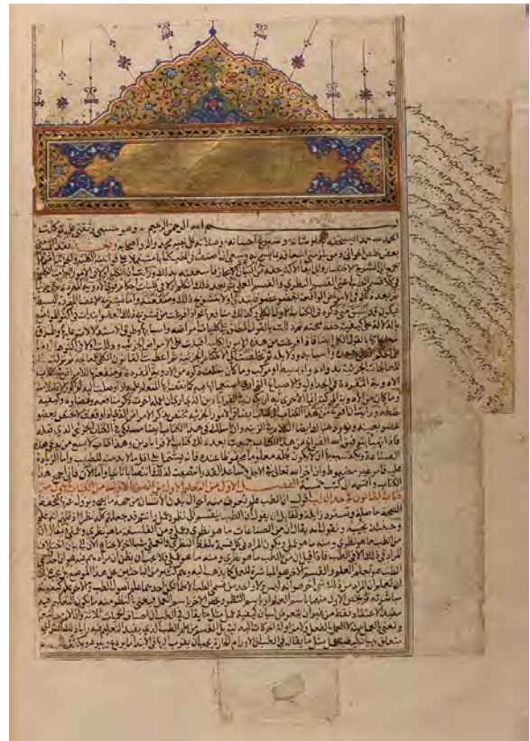
كتيبي (القانون في الطب)