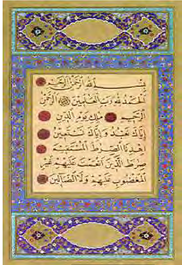
لاپەرەپەك لە قورئانى پىرۆز

بە پىي تىپەربوونى كات زۆرىك لەم رىواپەتەتەنە لە لايان زۆرىنەوھ پەسەند كران و لە كتيبان بە ناوى فەرموودە كۆكرانەوھ. يەككە لە گرنگترىن كتيبەكانى ھەديت ياخود فەرموودە كتيپى كەسيك بوو لە ئەھلى بوخارا بە ناوى سەھىحى بوخارى كە چەند سال بەرلەدايك بوونى ئىبن سينا نوسرابۆوھ. ئەم فەرموودانە چەندىن سونەتيان ھىناپە بوون كە شويئكەوتوانى ئەم سونەتەتەنە ناويان لىنرا سونى. لە گەل ئەمەشدا ھىشتا موسلمانەكان دوچارى ھەندى بارودۇخ ياخود مەسائل دەبوونەوھ كە قورئان و فەرمودە بە تەنھايى وەلامگۆى ئەو بابەتەنە نەبوون. رەوشىكى دىكە لەم بواردەا پرسىيار كوردن بوو لە دادوهرىك(قازى)، بەلام ئەوھش ئاسان نەبوو چونكە