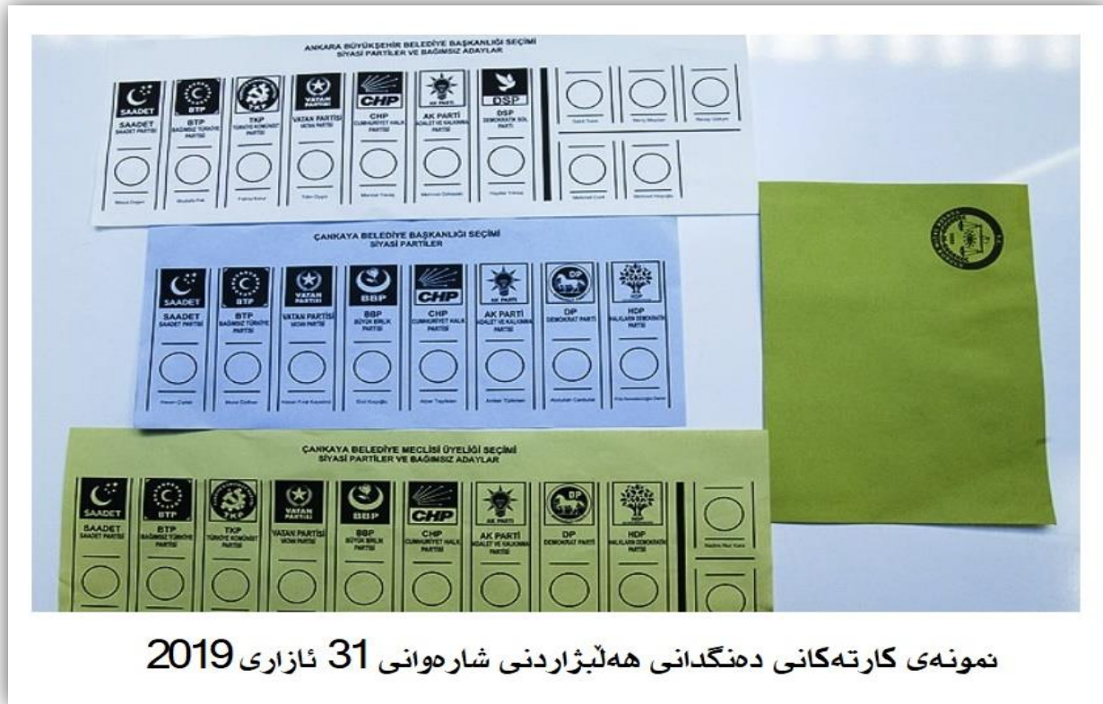
نمونه‌ی کارته‌کانی دهنگدانی هه‌لبژاردنی شارهوانی 31 نازاری 2019