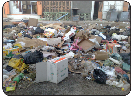
ناو بازارو مالانی که لار