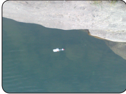
بازاری خانه قین