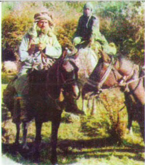
کەسێ دڵ فراوان و زیندوو بیټ تا دهگاته ئاوات دهبیټ ماندوو بیټ