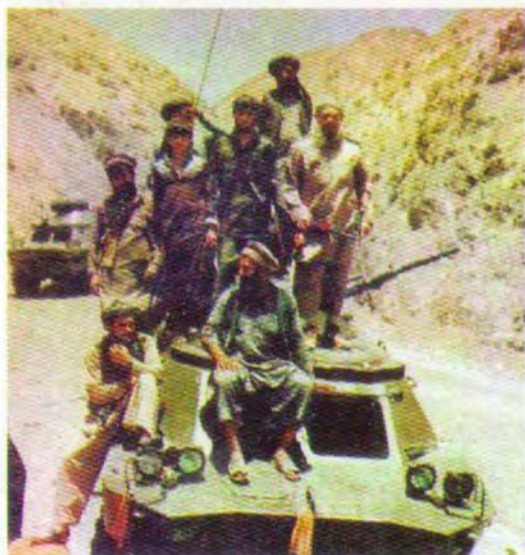
شهید له گهڵ پۆلیک له موجاهیدین له ئهفغان