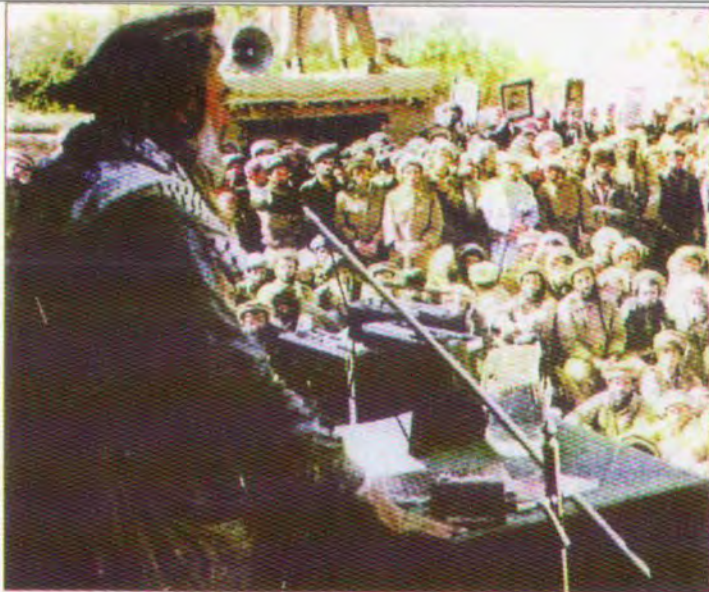
سروشستیکی به هیزو ئیرادهی به هیز