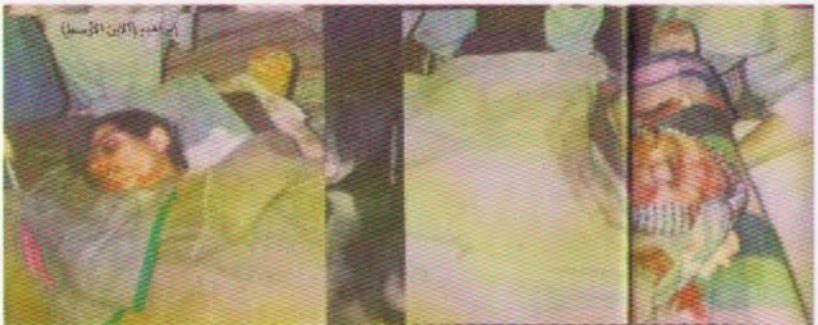
"شهیدان نوری چاوو وزه‌ی به‌رده‌وامی گیادمان" (م. عثمان عبدالعزیز)