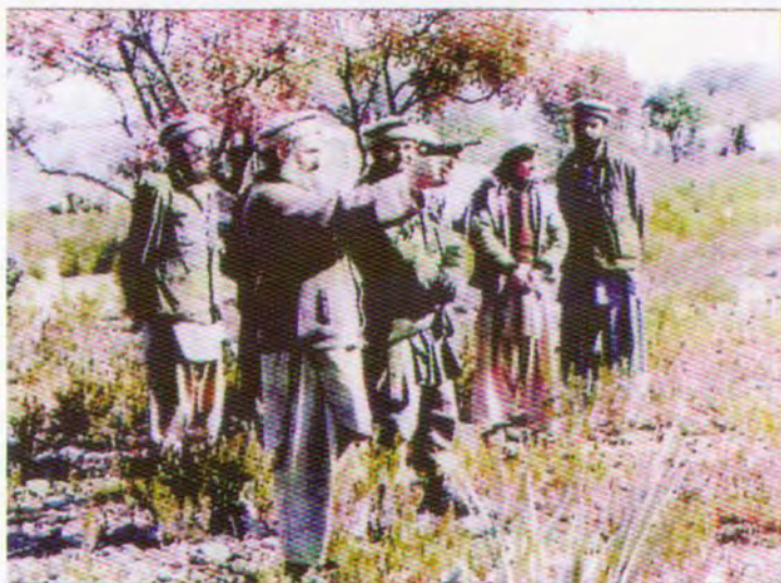
آلا این قوه الرمي، آلا این قوه الرمي، آلا این قوه الرمي،