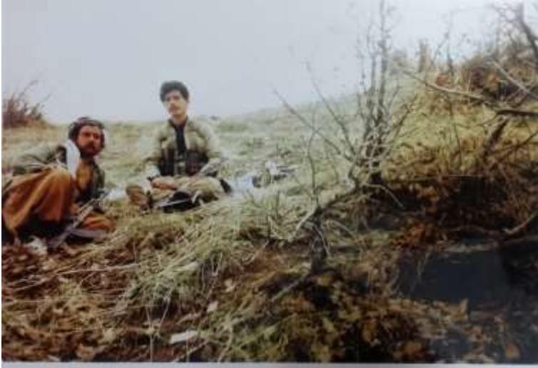
چناروک .. پیشمہرگہی پارتیزانی .. بورہان شہوگیری و ٹاشتی سابیر میرہ .