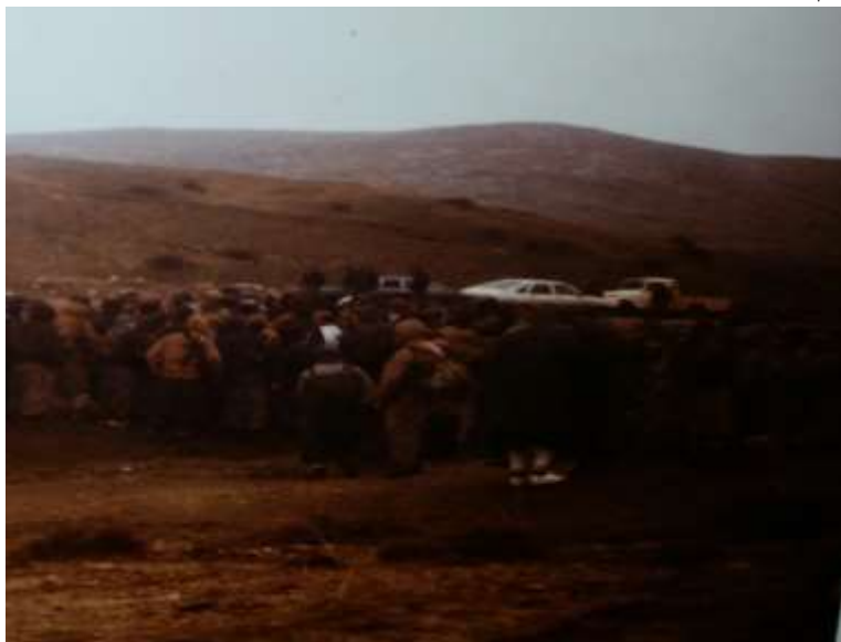
کوبوونه وهی پیشمه رگه کانی قوئی ماموستا چه تو، نزیک گورستانی ده پویش خدر .. ئه رشیفی عه بدولواحد ئیدریس .