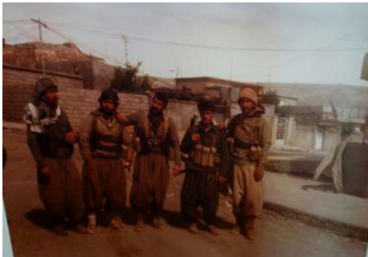
پوځی نازادکردنی شاری کویه .. ئه رشیفی عه بدولواحد ئیدریس .