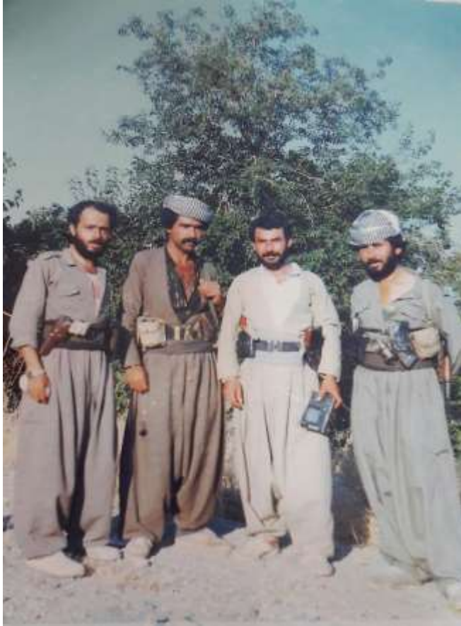
شهید جه عفر حه مه ده رویش و ژماره یک پیشمه رگه

به عسی له پټککه وتی بیستی نازار، له گه په کی ئه منه کان- که رکوک شه هید ده بی ۲۰۳ .