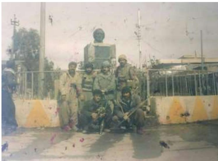
پۆژی ئازادکردنی شاری كۆیه .. ئەرشيفى عەبدولواحيّد ئيدريس .