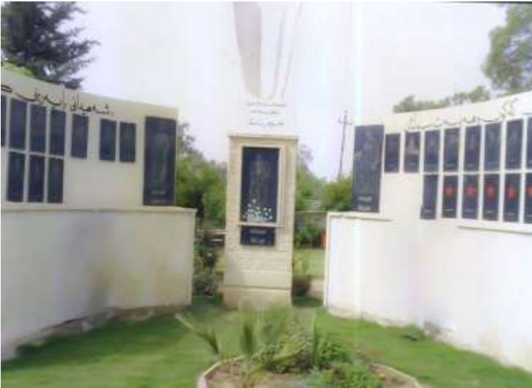
پارکی شہہیدانی راپہ پینی کویہ