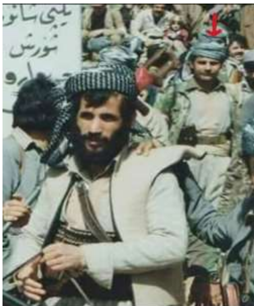
شهید مامه‌پیشه، شهید جه‌وه‌ر ناسکه