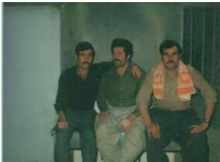
وینه‌ی زیندان (۱۹۷۹).. شه‌هید جه‌وه‌ر ناسکه، شه‌هید سوره