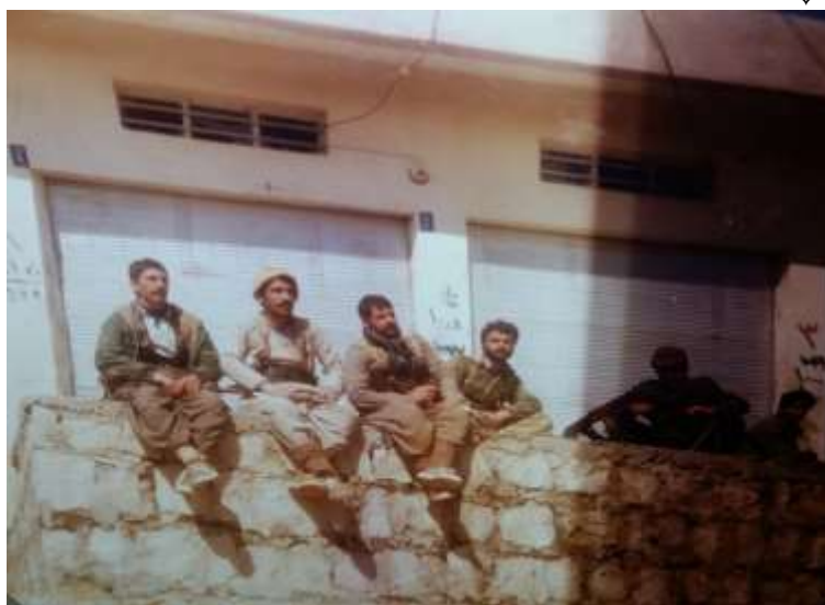
پۆژی ئازادکردنی شاری كۆیه .. ئەرشيفى عەبدولواحيّد ئيدريس .