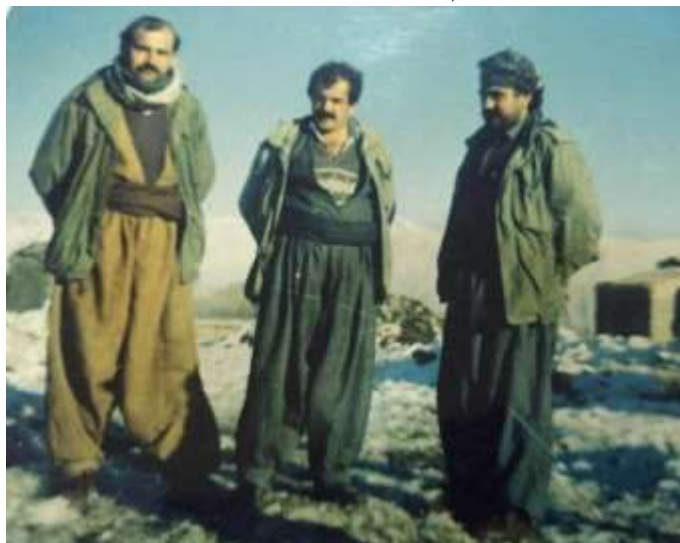
شه‌هید ته‌حسین کاوانی، تو‌فیق کانی وه‌تمانی، شه‌هید جه‌وه‌ر ناسکه .