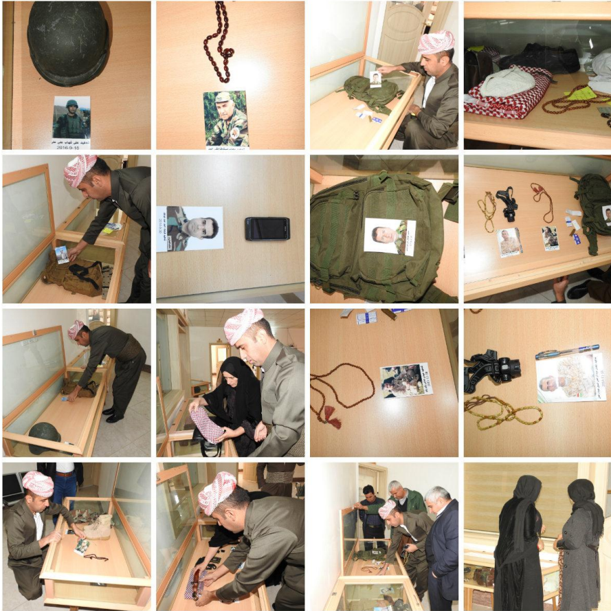
دوا یادگاری شهیدان