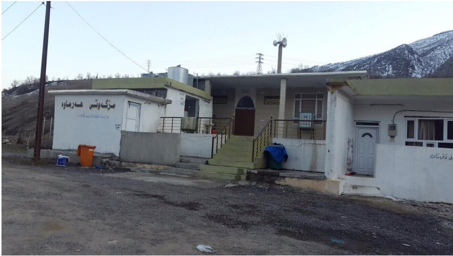
مزگەوتی ھەرماوہ ئەو مزگەوہتەیی شەھیدی زێرو پارەیی بۆ کۆدەکردەوہ