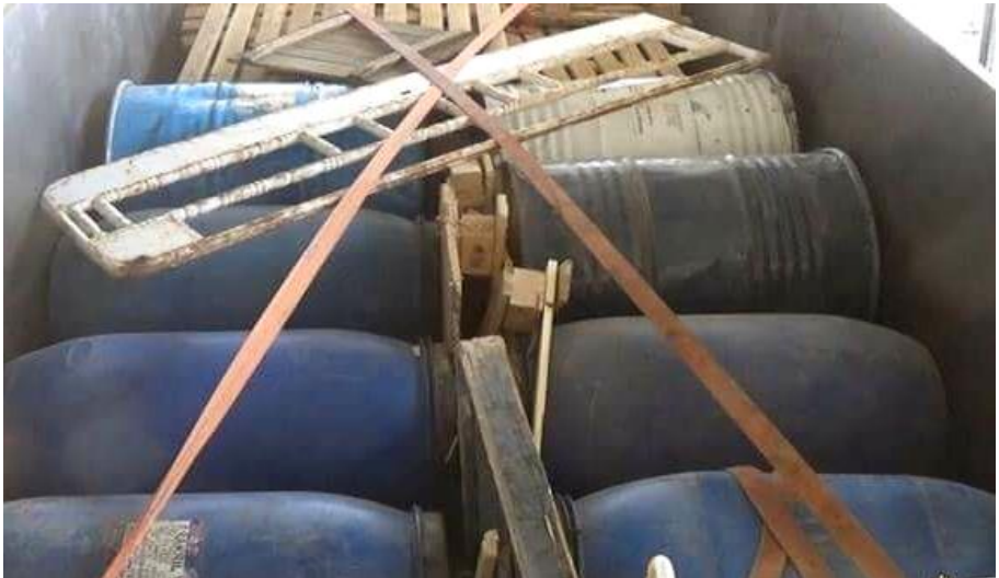
ئەو قەلاپە پر لە ( تی ئین تی) یهیی داعش ناردی بەمەبەستی تەقاندنەوه و کردەوهی خۆکوژی