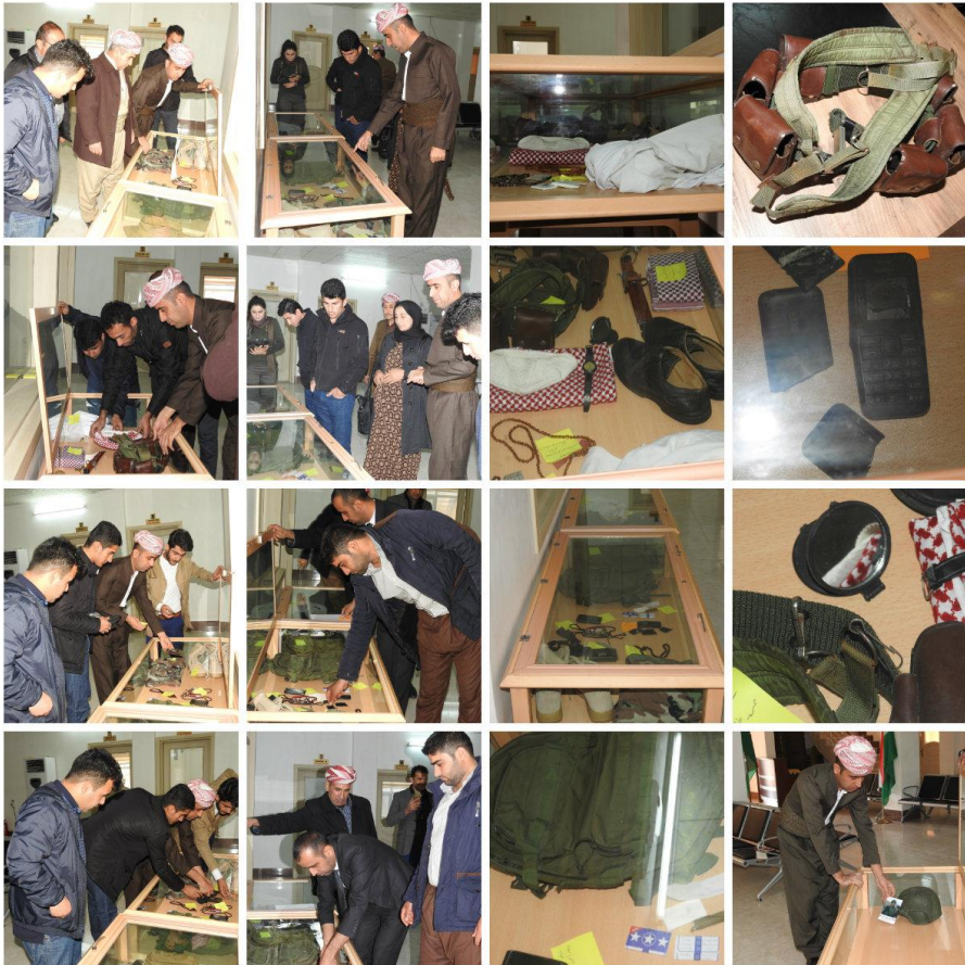
کهل و په‌لی شه‌هیدان، له‌کاتی شه‌هیدبوونیان ئەم کهل و په‌لانه‌یان له لا بووه