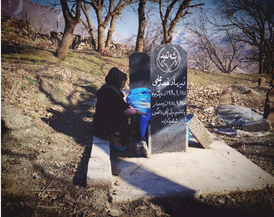
بەفرین لە سەر گۆری شەهیدی هاوسەری

رۆخسارم عاجزى و خەمبارى و شەكەتى پێوە دیار نەبیت، چونکە ئەو وشانەم دیتەووە یاد کە دوا شەو شەهید وتی: (کە مردم زوو زوو وەرە سەر قەبرم من بیرت دەکەم ...) . بویه وا هەست دەکەم کە دەمیینت!