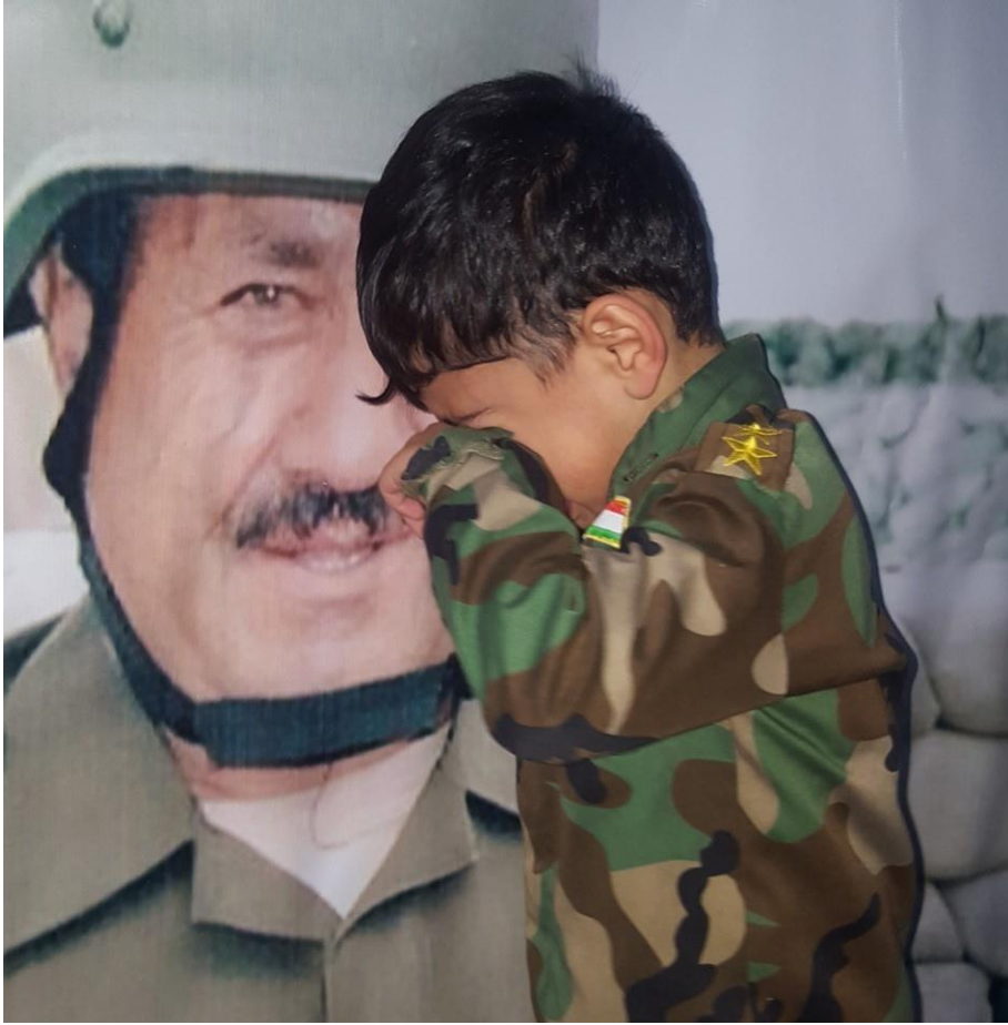
لیهات له گهل وینهی باوکی شهیدی