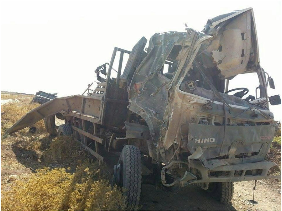
ئەو هیئوویەیی شەھیدان بەرگریهکی قارەمانانەیی تێدا ئەنجامدا