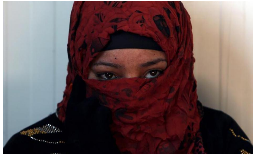
A Sunni Muslim woman who fled the Islamic State's strongholds of Hawija and Shirqat rests in a refugee center in Makhmour, south of Mosul, Iraq on February 14, 2016.

The extremist armed group Islamic State should urgently release Yezidi women and girls they abducted in 2014, Human Rights Watch said today, following new research with recent escapees who were raped and traded between members before they fled. Islamic State (also known as ISIS) also routinely imposes abusive restrictions on other Iraqi women and girls and severely limits their freedom of movement and access to health care and education in areas under its control, Human Rights Watch said today.