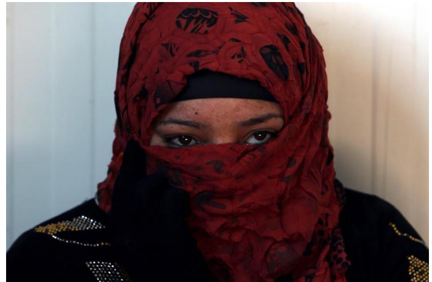
نافره تپکی موسلمانی سوونه زرگاریوی دهستی رنکخراوی (دهولهتی الاسلامی) له حوتجه و شرگات، له کامی ئاواره کان- مخموری باکوری موسل- عیراق- ۱۴ شوباتی ۲۰۱۶

هیومان رایتس وچ له راپورتی نیسانی ۲۰۱۶ ده لیت: ده بیت گروپی تووندروهی دهولهتی ئیسلامی (داعش) دهستبه جی ئه و ژن و کچه یه زیدیه وهی نازاد بکات که له سالی ۲۰۱۴ فراندوونی.