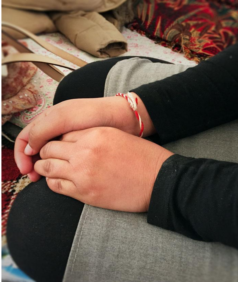
نور، ۱۶ سالان، دەئیت: چە کدارانی داعش لە ماو ی دوومانگی دیلی دا چەندین جار دەستدریژیان کردە سەرم، دووچاری حالەتی دەروونی بووم و چارەسەری بووم...

بەو ی لەکوی دەیانەوی بژین لە ولاتی خۆیاندا. دەبیت هێزە ئەمنیەکانی حکومەتی هەریمی کوردستان پاپەند بن بەفەرمانی سەرۆکایەتی و کۆتایی بەیپن بە سەپاندنی رێشوێنی تووند لەسەر ئەو هاوولاتیانە ی لە ناوچەکانی ژێر کۆنترۆلی داعش هەلھاتوون".