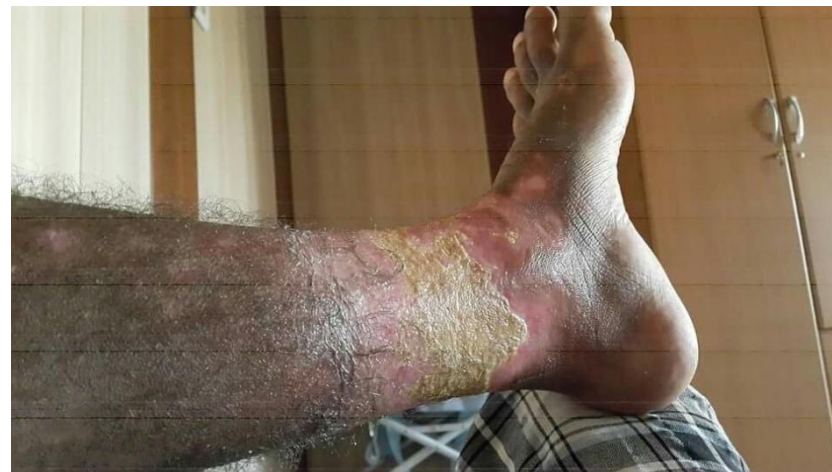
Photo taken on November 3 of blisters on the leg of a victim formed after exposure to the chemical substance contained in projectiles fired on the town of Qayyarah on September 21, 2016.

The initial skin burns as well as the blisters that usually follow within a day have been described as excruciatingly painful by those exposed to blister agents Ward said. In addition to these immediate effects, exposure to blister agents can have more long-term consequences. These include an increased occurrence of cancers of the respiratory system, chronic conjunctivitis, and several chronic skin conditions such as skin ulceration, scar formation, and cutaneous cancers.