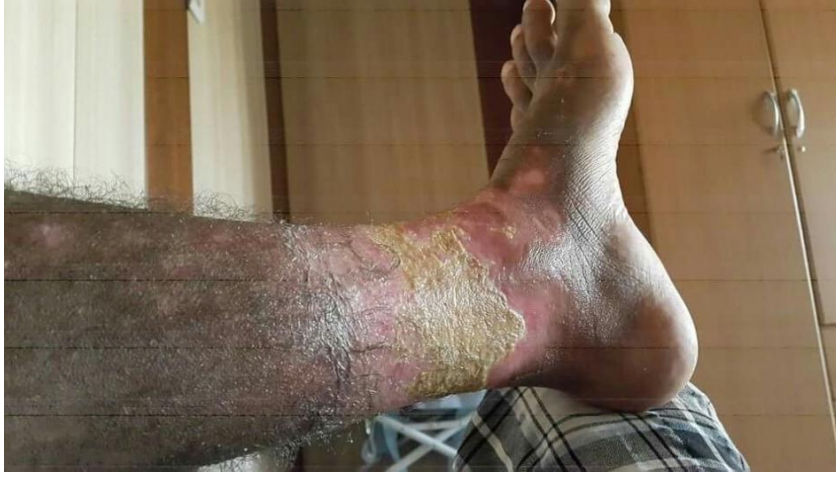
صورة التقطت في ٣ نوفمبر/تشرين الثاني لبتور على قدم أحد الضحايا بعد تعرضه لمادة كيميائية في مقذوفات أصابت بلدة القيارة في ٢١ سبتمبر/أيلول ٢٠١٦

ينتهك استخدام المواد المنفطة للبتور أو غيرها من المواد الكيميائية السامة التي تنتج تأثيرات مشابهة في هذه الهجمات "اتفاقية حظر الأسلحة الكيميائية" لعام ١٩٩٣. تحظر الاتفاقية التي انضم إليها العراق عام ٢٠٠٩، استخدام أي شخص تحت أي ظرف من الظروف للخصائص السامة للمواد الكيميائية لإحداث الوفاة أو إصابة المقاتلين أو المدنيين. هذا الاستخدام هو جريمة حرب بموجب "نظام روما الأساسي للمحكمة الجنائية الدولية" والقوانين العرفية للحرب. استخدام الأسلحة المحرمة بقصد جنائي عمدا أو عشوائيا هو جريمة حرب.