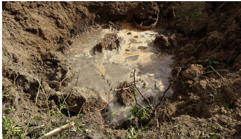
Remnant of a weapon that struck the town of Qayyarah on September 21, 2016 and photographed that day. The chemical agent inside has been diluted with water by local residents.

carried out the attacks. The residents based this on the fact that Iraqi forces were fully in control of the town of Qayyarah at the time, with ISIS carrying out attacks on the city, targeting military positions. They believed that ISIS was trying to force the town's population to flee toward them, based on reports that ISIS had tried to compel civilians to retreat with them in other areas, then target opposing forces entering the area. Human Rights Watch could not confirm this allegation.