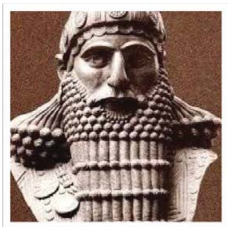
نه بوخوزنه سر