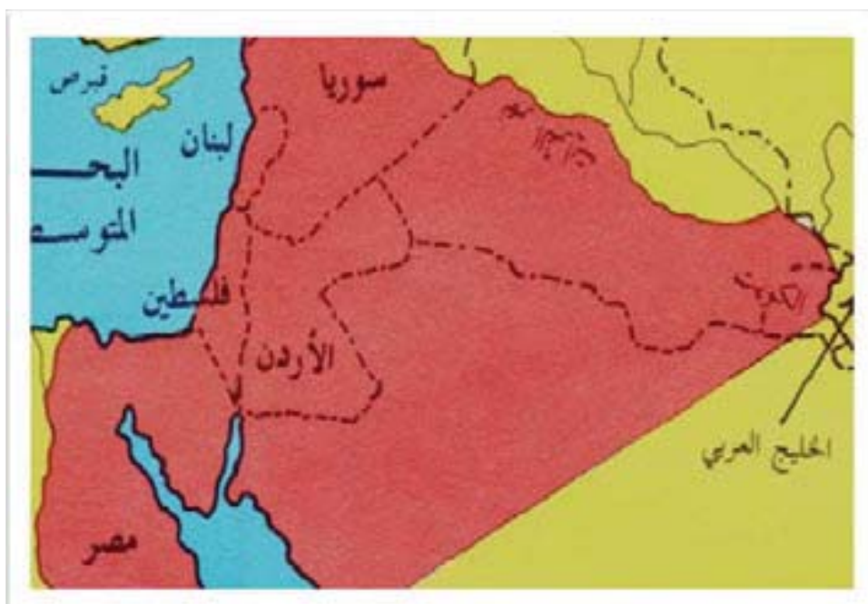
نه خشه ی ئیسرائیلی گه وره