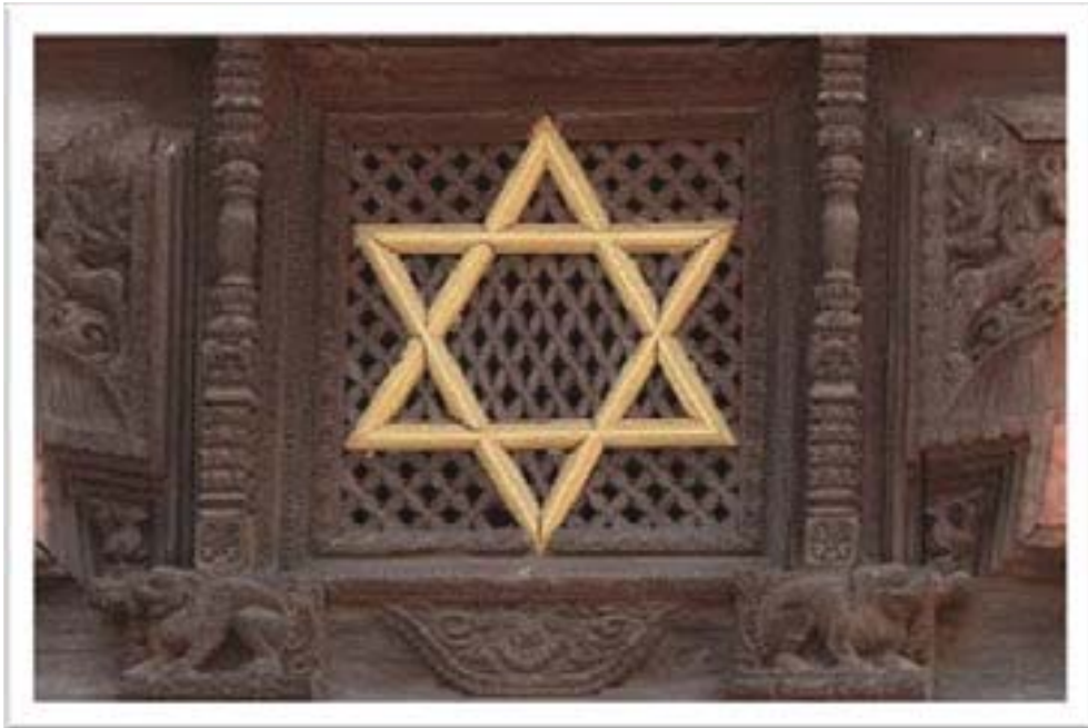
نُه و نُه ستیره شه ش گوشه‌ی له لایهن پیغه مبه‌ر داووده‌وه به‌کار هینراوه