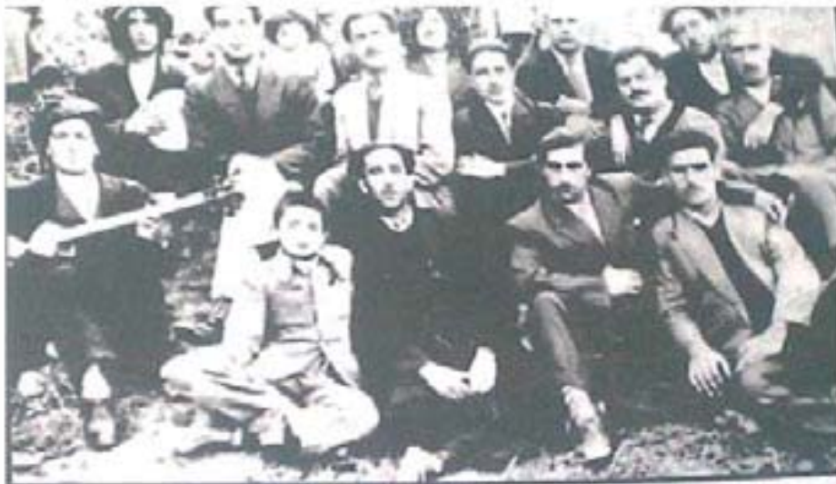
تولقی یهودی مقیم سقز که با استقلال اسرائیل از این شهر کوچ کردند به اسمی دزد بورد (سحق) و میره که با تار و شرب نشسته اند بهمداد جمعی از کارمندان ادارات در سال ۱۳۳۸ شمسی در سلطون