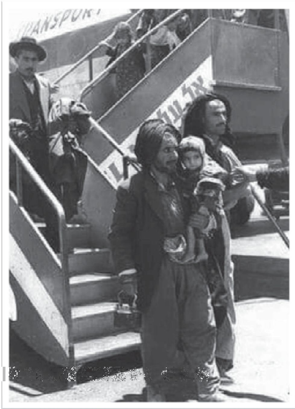
وینہی ئەو جووانەهی حکومەتی عێراقی لە کوردستانەوه دەریکردن بۆ ئیسرائیل. سالی ۱۹۵۱