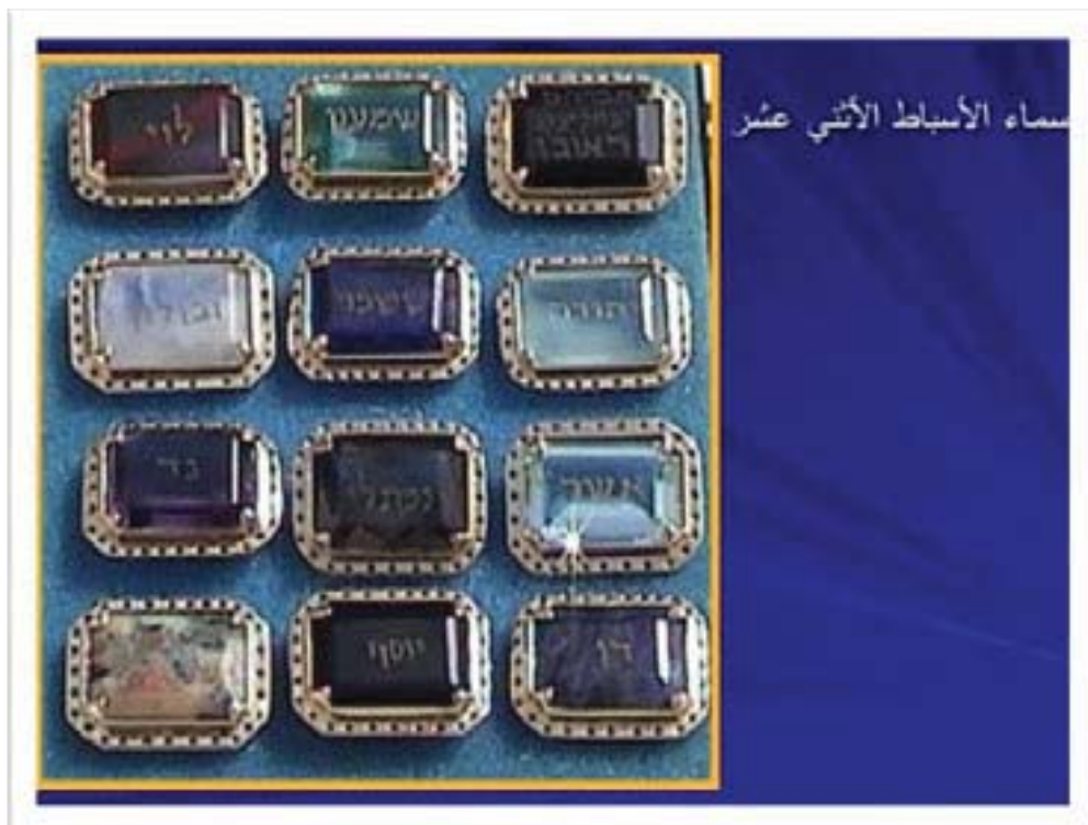
ناوی دوازده تیره‌که‌ی جووله‌که