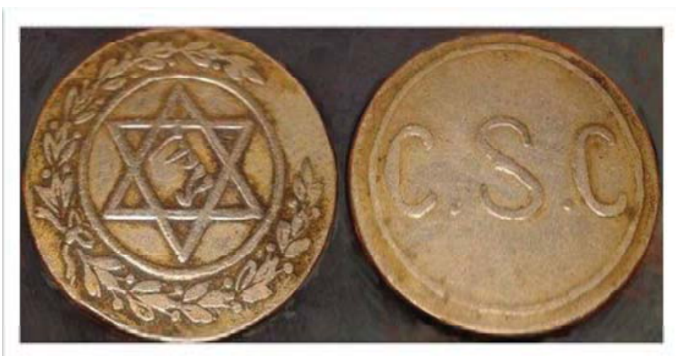
پیروز راگرتنی نه ستیره‌ی شه‌ش گوشه