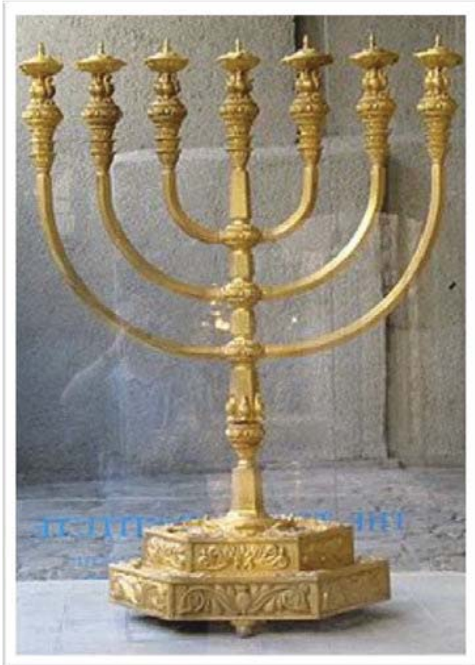
مؤدانی جوولہ کہ