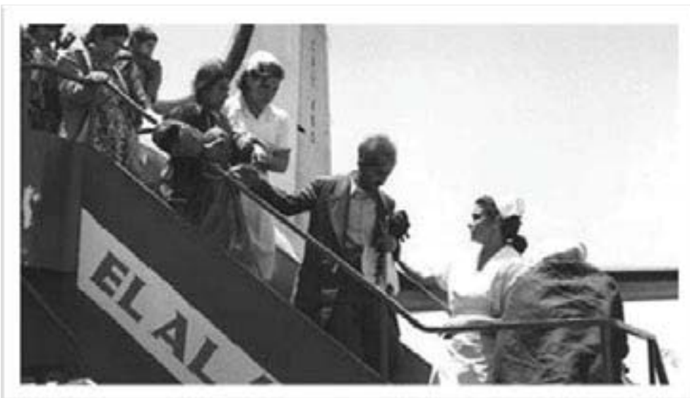
جووله‌کە‌ی کورد فرۆکه‌خانە‌ی قودس - ۱۹۴۹