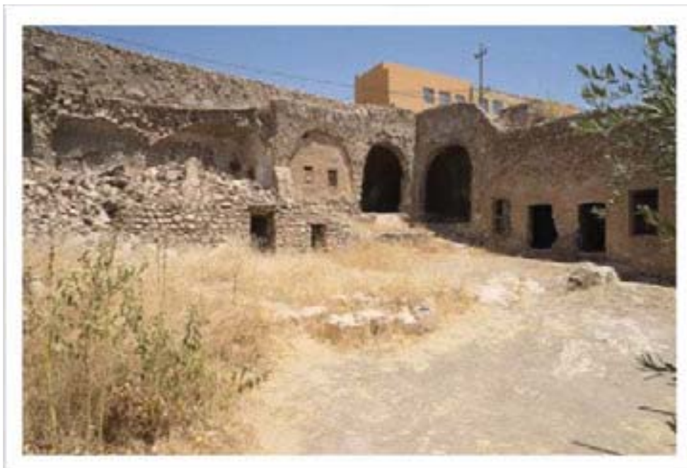
خویندنگای نه لیس، کرکوک