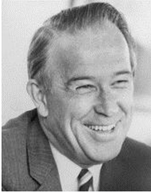
Henry M. Jackson

له سیستهمی ئیمه دا بۆ تاک، جاکسون مافی خوڤیه تی ئه مه په تکاته وه، به لام پیموایه که گه ل ده یه وئ ئیمه هه مان رپچکه ی حالچارز بگرینه بهر، ئه گه ر بتوانین له ماوه ی ۱۹۷۵-۱۹۷۶ رپچکه وین ئه وا ده رفه تی زیاترمان له بهر ده ستدا ده بی بۆ پیاده کردنی سیاسه ته کانمان له ۱۹۸۰. نیکسون هه میشه باسی له په یوه ندییه باشه کانی ده کرد له گه ل بریژنیف، نه ک له بهر ئه وه ی هه ندیک نه ستی له سه ر سوڤیه ت هه بووبه لکو بۆ پوخاندنی ناحه زانی بوو له ناوه وه، ئه مه ش به ریزلینانیان ده بوو له ده ره وه. به لام له م پوه وه فۆرد زۆر هه ستیارتیتر بوو.