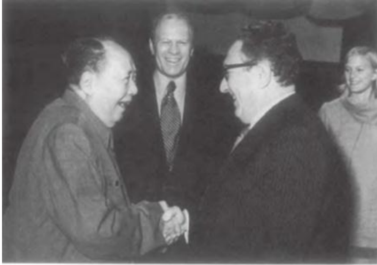
Mao Dzedong ماو تسي تونگ