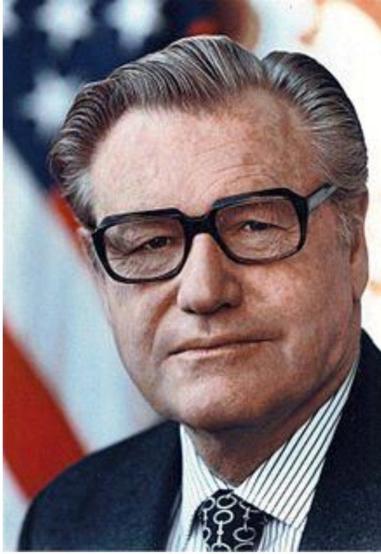
Nelson Aldrich Rockefeller

ئەزمونى پوكفلر لە پۆستەكەى، لاوازىي دەرخست، ئەو لە ۱۹۷۴ وەكو جىگرى سەرۆك دامەزرا بەلام تا ۱۹ى كانونى يەكەم كۆنگرېس پىگەى نەدا سوپىدى ياسايى بخوا بۆ ئەوئەى لە ھەلمەتى ھەلبژاردنەكانى دوور خەنەوئە كە لە نۆقەمبەر ئەنجام درا. ناوئە ناوئەش باسيان لە سەرمايەكانى دەكرد، پۆكفلەر دەيزانى كە پۆستى جىگرى ھىچ دەسەلاتىكى ئەوتۆى نىيە، كاتىكىش ھەولى دا لە شوپىن سىناتۆر جىمىس ئالىن پۆستى سەرۆكى ئەنجومەنى پىران بگريئە دەست، ئەندامە خاوەن ئەزمونەكان سوريوون لەسەر پازى نەبوون گوايە جىگرى سەرۆك پىرەوى دەنگدان تىك دەداو بۆى نابى لە گفوگۆكان بەشدار بى، دواتر فەرمانبەرانى كۆشكى سپيش پۆلى پۆكفلەر ريان سنوردار دەكرد لەو ئەنجومەنى بەناوى ( ئەنجومەنى ناوئەخۆ) كە فۆرد دايمەزاندبوو.