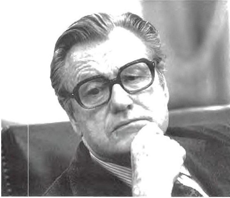
نيلسون روكفلر، نائب رئيس الولايات المتحدة

به تېپەر بوونى كاتهكان زياتر شاره زاييم له تواناكانى پامسفيلد پهيدا كرد، به تاييه تى دواى ئه وهى حكومه تم جيھيشت و ئيتر وهكو ئامانجى هيترشه كانى نه مامه وه . كه سيكى به تواناو كاريگه رو توند بوو، له روى كه سايه تيشه وه سه رنج پاكيش بوو، گه ياشتمه ئه و بپروايه ي كه ئه گهر بگاته سه روكايه تى باشته له وهى وه زيريك يا به رپوه به ريكي گشتى بى چونكه ئه وكات ده بيته سه روكيكي به هيتر. له قوناغيكى ترى ريگادا خاوه نى ئه م جوړه به هرانه ده ستبه ردارى داخوازي ده سولات دهن، ئه وه تا له قوناغيكا كه پامسفيلد سوارچاكي كيبه ركيكى پوستانى سه روكايه تى ده بى به لام ئيستا ده ستبه ردارى بووه، ئايا كاته كه ي گونجاو نيه يا ئه م پوستانى پوستانى خوښ ليبه ردانه، ته نانه ت بو كه سيكى به مورالى وهكو پامسفيلديش؟ ياخود كيبه ر كيبه كه قورسه و ناتوانى به رگه ي شكست بگرئ، ئا له م كاتانه بوو كه پامسفيلد ده ستبه ردارى بيروكه ي سه روكايه تى ده بى كه پيم وايه جيگاي داخه .