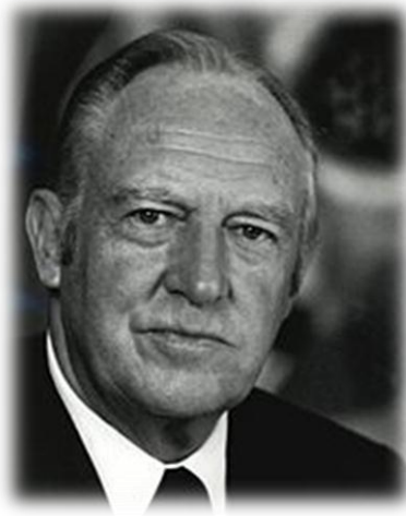
William Pierce Rogers

من ئەمه بۆ ئەوه نالیم تا له توانا و کەسایەتی و پێگەی ئەم پیاوه کەمکەمەوه، بۆ فراوانی هەستەکانیشی نا، بە شیۆهیهک بە سام هەلسوکەوتی دەکرد خەلک شەرمی دەکرد، لە پێگەی کەمکەمەوه، بۆ وهبیرھێنانەوه من شانازی بەو هەولانەوه ناکەم کە نیکسۆن دەیدا بۆ کەمکردنەوهی پێگەی ئەم کەسایەتییه . نیکسۆن سوربوو، خۆی سیاسەتی وەزارەتی دەرەوه دەبا بەرپۆه بۆیە پێویستی بە کەسیک هەبوو کاری دانوستانی بۆ بیا بەرپۆه، کە پیشتر وارن کریستۆفەر لە کۆشکی سپی بەم کارە هەڵدەستا، یان ئەرکی وتەبیژیکێ فەرمی لەبەردەم کۆنگرێس و ھۆکارەکانی ڕاگەیانندن ئەمەشیان وەکو میل لیردی وەزیری بەرگری وابوو بۆ نیکسۆن .