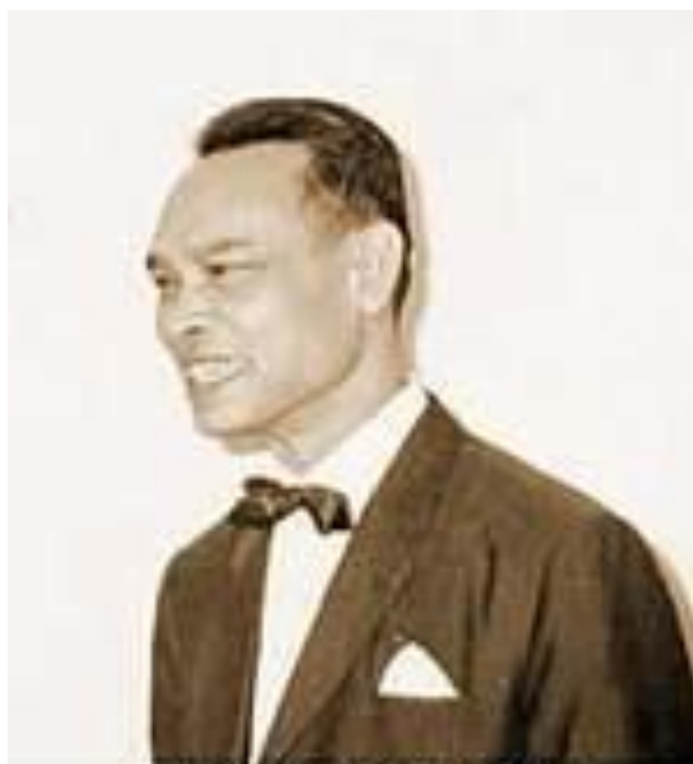
Prince Sisowath Sirik Matak

له ۱۳ی نیسان نیویورک تایمز له مانشیتیکدا دهنووسی: هیندی چینی به بیئ ئهمریکا، ژیانیکی خوشتر بؤ ههموان.