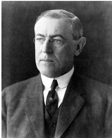
Thomas Woodrow Wilson

ويلسونيزم به و رهفتارانهى، له ئەوروپا جيپه جي دهكرين ئەمريكاي له كيشهى هيندى چينى تيوه گلاند، ئەو گواستينيه وه بۆ ئاسيا . گوايه هه مان شت له و شوينه ديته ئەنجام، كه شهري پارتيزانى لى دهكرى، راسته ئەم شهري نابردرته وه به لام ئەوهيه له ونبوون پزگارى دهبي و به رهو شهريك ده مانبا كه كۆتايى نيه، هه رچه نده دهقى كلاسيكى ويلسونيزم نامان گه يه نيته ئاستيكي هاوسهنگ، ديدى ئەو بۆ مملانيكانمان له گه ل يه كيتى سوڤيهت ديدىكي كاره ساتيه، هه ر ئەمه ش بووه هوى ئەوهى له په يوه نديه كانمان له گه ل سوڤيهت له سهر شهري سارد نيانى نه نوئين .