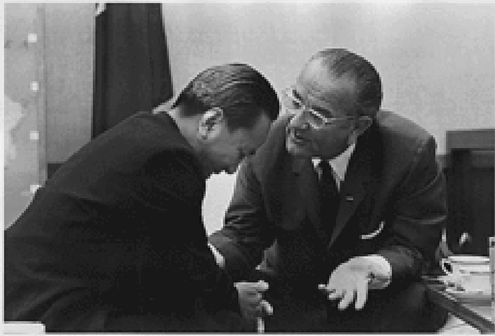
Nguyen Van Thieu & Lyndon B. Johnson

له ۱۹۷۳ او ۱۹۷۴ سه پاندى رېككه و تنه كه بووه مايه ي سه رنج پاكيشان ههروه كو ئوهى شه پ بئ، بيانووه كاني له بيانووه كاني شه پ ده چون، بزوتنه وهى دژ به جهنگ به پيشه كيه كه ي رازى نه بوون كه ده لئ: