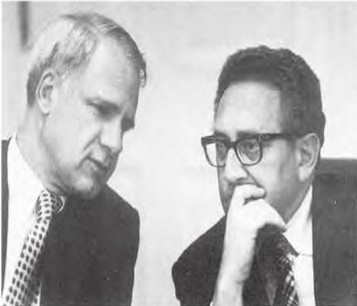
له گهل شلیسنگەر وہزیری بہرگری، لہسەر قیرانی مایاگوز

James R. HYPERLINK " https://en.wikipedia.org/w/index.php?title=James_R_Schlesinger&redirect=no&oldid=۶۰۳۰۴۶۴۹۴ "Schlesinger