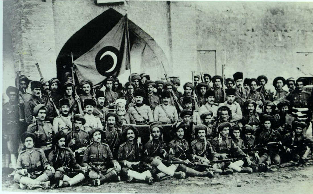
The First Division of the National Army takes oath to serve the Kurdish nation, July 11, 1922, in front of the flag of the government of Shaikh Mahmud