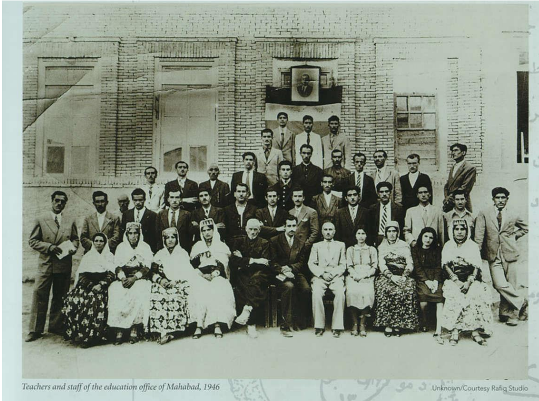
Teachers and staff of the education office of Mahabad, 1946