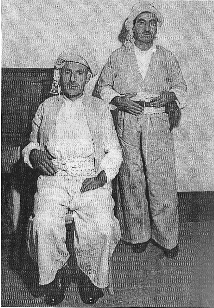
شیخ ئەحمەدی بارزانی و مەلا مستەفا بارزانی بەغدا - کانوونی یەکەمی ١٩٥٨