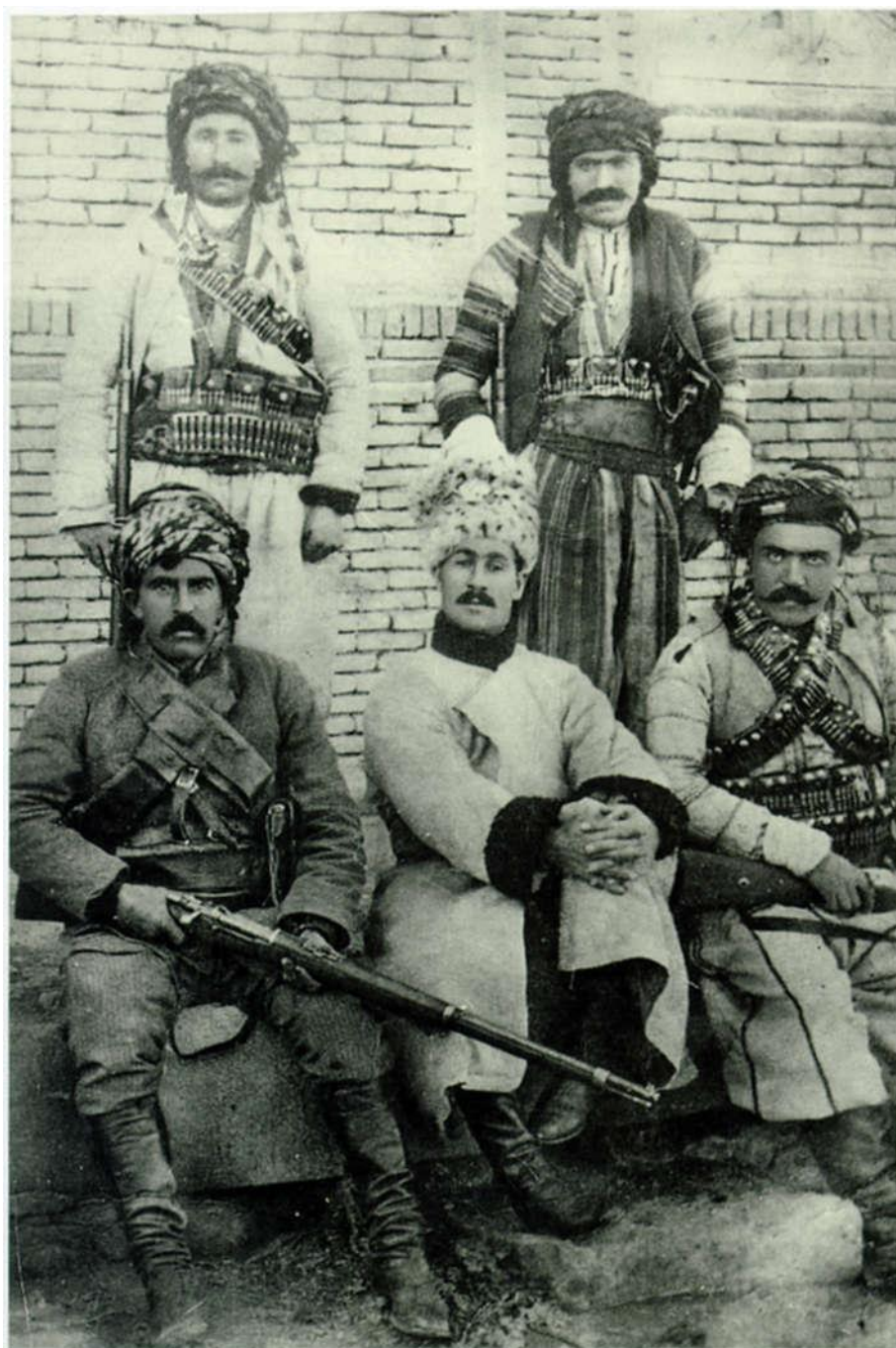
Simko in Sulaimania