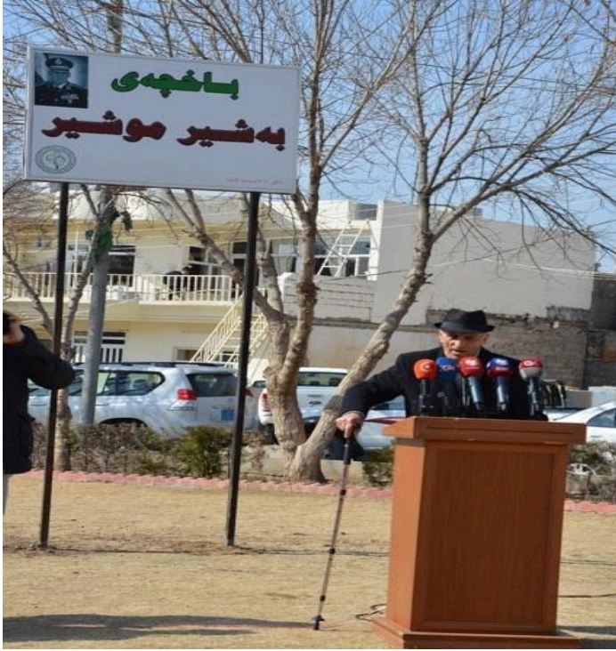
پاركى بەشىر موشىر له سلیمانى

*پرسىيارهكان زۇرن، لهوانه: بۇچى كورد تائىستا قهوارميهكى سىياسى