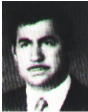
فەرقىيون نۇلى نەمسىن