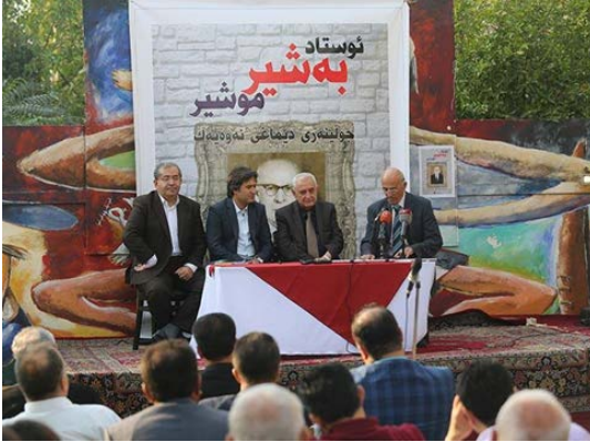
یادی به شیر موشیر له سلیمانانی

به ئی..(به دریزی وه لآمی ئەم پرسیاره مدایه وه). به لآم له بهرئه وهی له فهیسه بوکو هه ئی سه رچاوهی ترا، دورودریژ له سه ر ئەم که سیتییه م نوسیوه، به تایبه به تی کتیبی ئە له کترۆنی (فه لسه فهی به شیر) و کتیبی ئە له کترۆنی (داستانی به شیر موشیر) و پهرتوکی (گه وره پیاو) و