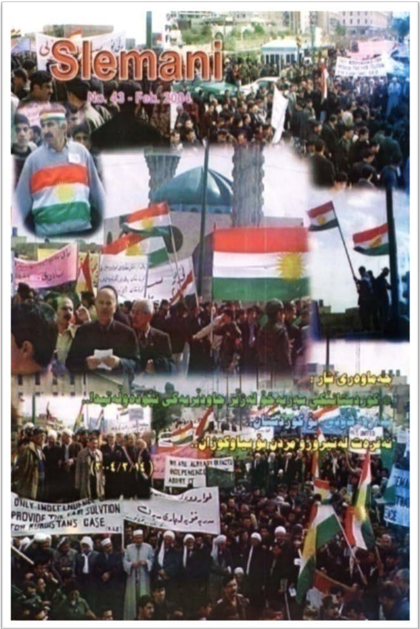
وینه: خۆپیشانی کۆری سهریبه خۆیی کوردستان له سلیمانی. 2004