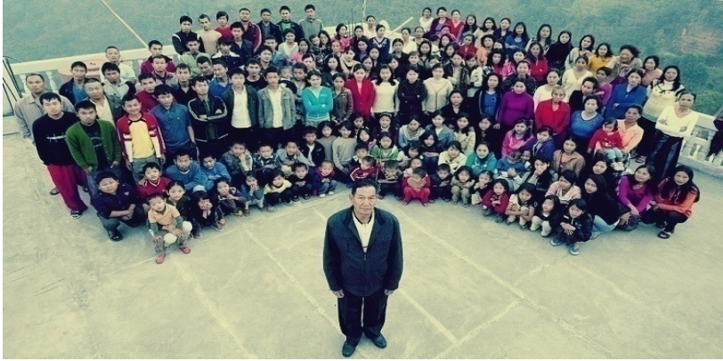
ئەمانە ھەمۆی نەوہی ئەو پیاوہن