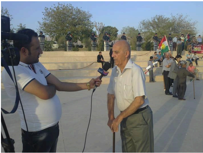
دیمنه نیک له گردبونه وههکی پارکی نازادی

دهنگۆی ئەو جموجولانه بلاوبوهوه. ههندی لایهنی سیاسی، ترسی ئەوهیانبو کازیک یا پاسۆک ریکخرینهوه. ئەو ترسەش بئ هۆ نهبو، له ئەنجامیکی وادا، زهرمهندی گهوره، پارتیو بهپلهی دوهم یهکیتی و بهپلهی سییهمیش ناگرین ئەبو. چونکه بهوه، له لایهین جهماورهوه ئەو کارتی کوردایهتییهی ئەو دو هیزبه