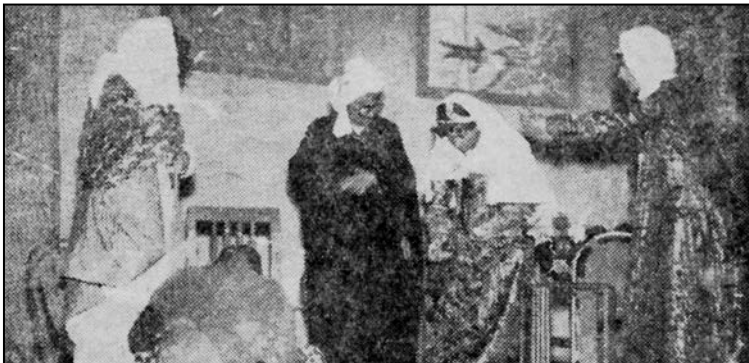
وێنه: دیمه‌نیکی شانۆگه‌ریی ئافره‌تو نوشته

دلداریه‌که‌مان ده‌سپیکردبو، ماله‌که‌یان نزیك دوکانی کاکمبو، له‌خیزانیکی هه‌زاربو، جوانو وریابو، دلداری ئەوکاته‌ش، به‌زۆری بریتیبو له‌وه‌ی له‌دوره‌وه‌ سه‌یری یه‌که‌مان