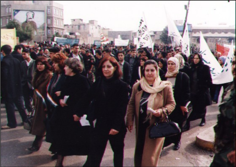
وینە: خۆپیشانی کۆری سەربەخۆیی کوردستان لەسایمانی. 2004