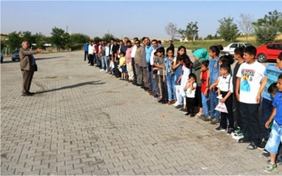
ئەمانەش ھەمۆی نەوہی ئەو پیاوہ کوردەن کە لەشاری نامەدی باکوری کوردستان ئەژی. بەبۆنەھی جەژنەوہ ریزیانگرتوہ بۆئەوہی جەژنە پیرۆزەھی لێیکەن.