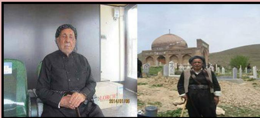
سه‌رچاوه: مائپه‌ری کوردستان و کورد - ریکه‌وتی: ٤ ئه‌پرێلی ٢٠١٥

هه‌وسارپساوی سۆشیال میدیایی و پۆپۆلیسمیکی زان به‌سه‌ر ئەم دنیا مه‌جازیه‌دا له‌بری ده‌رپرینی بیرووای ئازاد و کردنه‌وه‌ی ده‌رگای دیالۆگ به‌رده‌وام خه‌ریکی بلاوکردنه‌وه‌ی ژار و تووی دووبه‌ره‌کایتییه. نه‌گه‌ر خه‌ون و خولیای جیلی رابردوو به‌ئه‌نجام گه‌یشتنی خه‌باتی کورد بوو نه‌وه سه‌رپووته‌کانی سه‌رده‌م خه‌ونی گولی به‌یه‌کتره‌وه ده‌بینن!