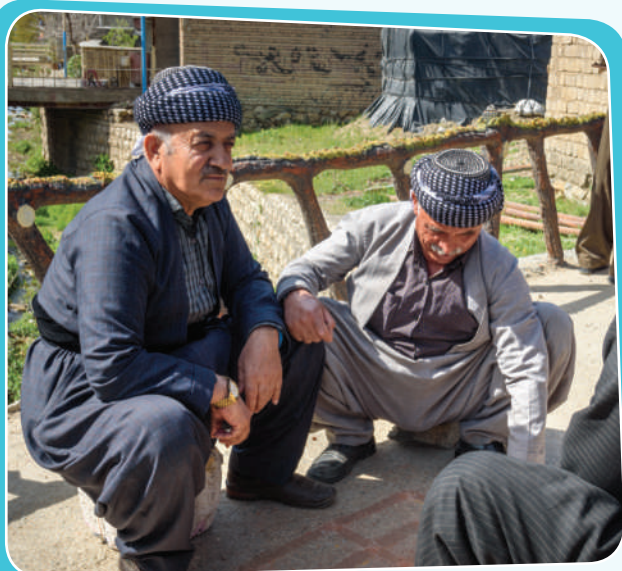
مافی تاییبەتمەندی رۆشنییری