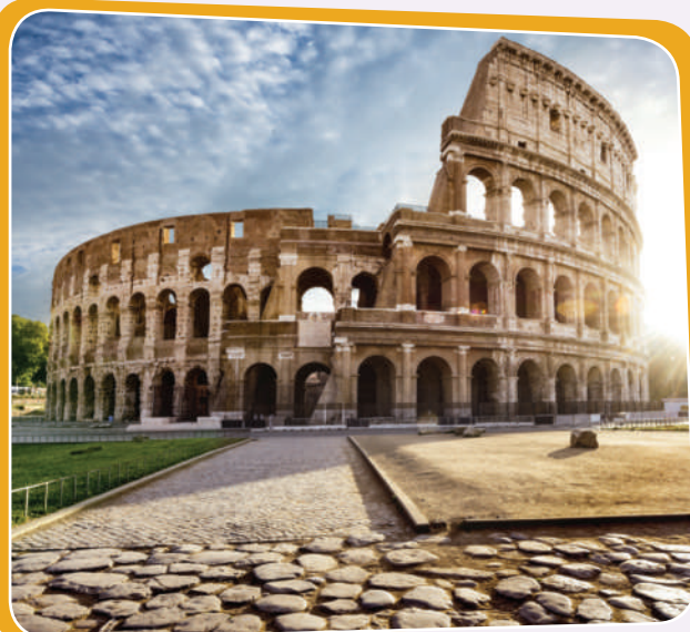
كولسیوم لە ئیتالیا