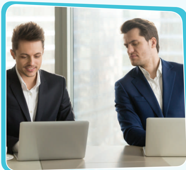
پېشیلکردنى مافی تایبەتمەندى فەرمانبەریتى