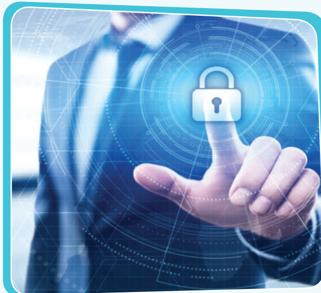
مافی تاییبەتمەندی کەسی