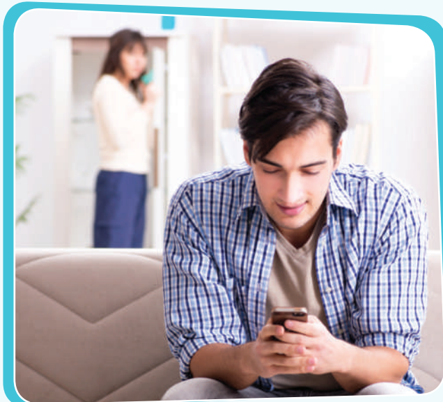
پېشیلکردنى مافی تایبەتمەندى كەسیتى