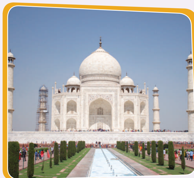
تاج مەھەل لە ھیندستان