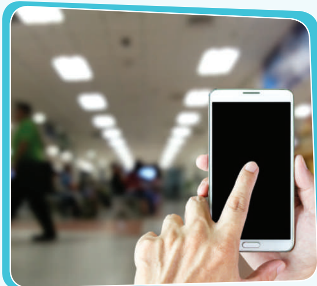
پېشیلکردنى مافی تایبەتمەندى گشتى