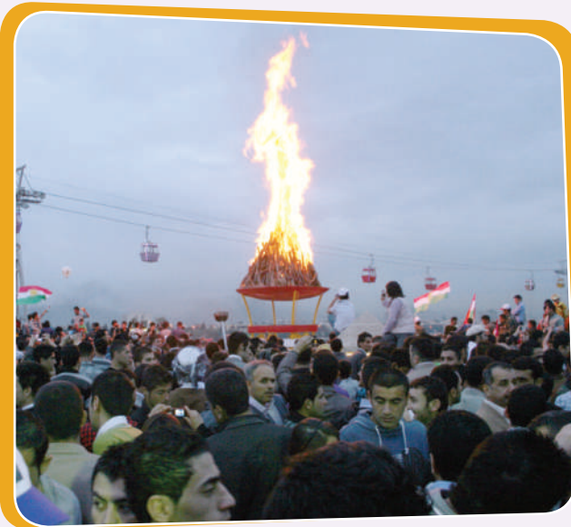
سەرى سالى كوردى