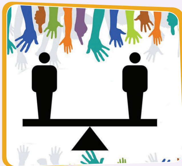
رېزگرتن لە مافەكانى مرۆف