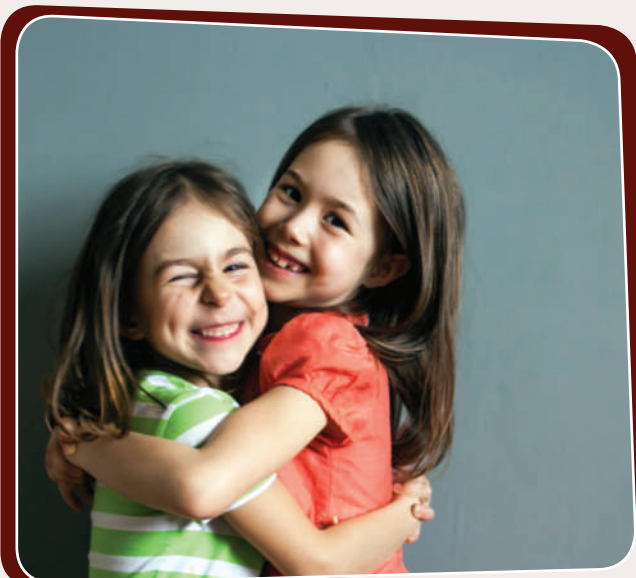
داوای لیڤوردن له یهكتر