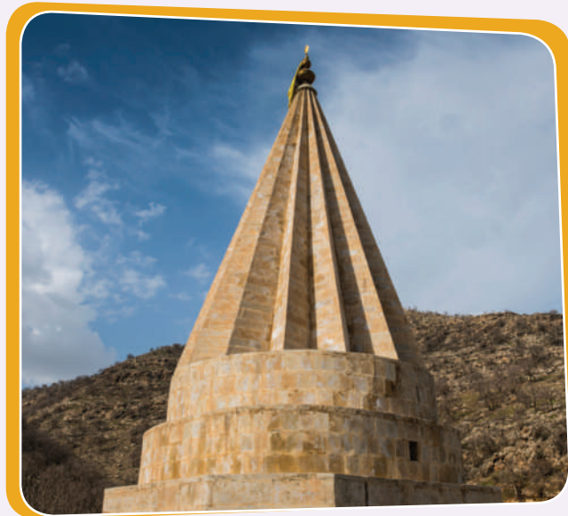
سەرى سالى ئىزىدى

بە سەرئەجدان لەم وینانەى خوارەووە بۆم دەردەكەوێت چەندین جۆرى سالنامە ھەبێ، ئەمەش زانیاریم زیاد دەكات و ئاشنا دەبم بە میژووی چەندین نەتەووە و ئایینزایەك: