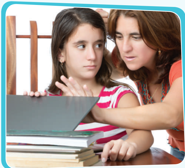
پېشیلکردنى مافی تایبەتمەندى مندالان

بە سەرئەنجام لەم وێنەنەى خوارەوه شارەزای چەند جوړیكى پېشیلکاری دەبم: