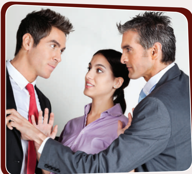
ناوڤژ یوانی و ئامۆژگاریکردن