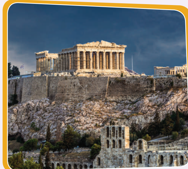
ئەكرۆپولیس لە یۆنان