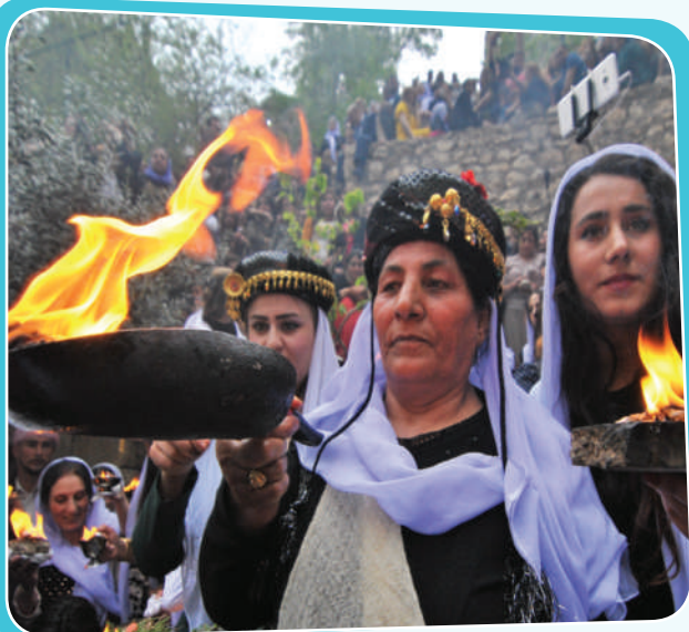
مافی تاییبەتمەندی ئایینی

بە سەرئەجدان لەم وینانەیی خوارووە شارەزای جۆرەکانی تاییبەتمەندی دەبم: