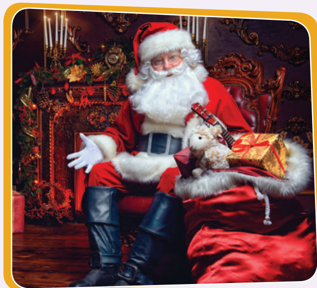
سەرى سالى زایینی