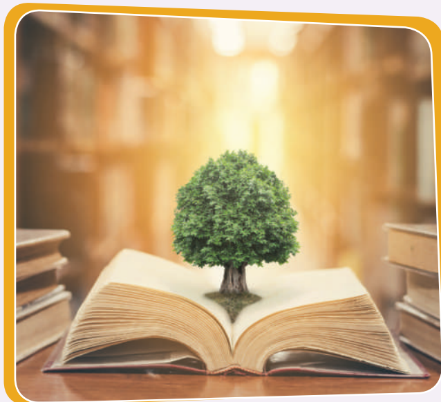
گەشەکردنى كەرتى پەروەردە