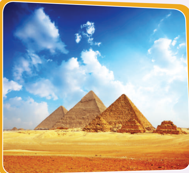
ھەرەمەكان لە میسر

بە سەرنجدان لەم وینانەى خوارەوہ تېبىنى ئەوہ دەكەم، ولاتان دەتوانن لە رېگەى شوینەوار و كولتور ولاتەكەيان بەیەكتر بناسین، بۆیە پئویستە لەسەر ھەر یەكك لە ئیمە گرنگی بە شوینەوارەكانى كوردستان بدات و بیانپاریزیت بۆ ئەوہى ئیمەش ھاوشیوہى ولاتانى تر كوردستان بە جیھان بناسین: