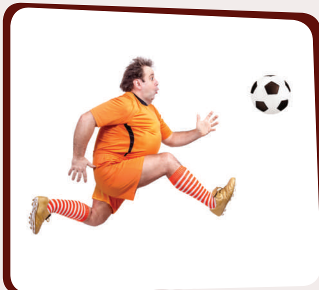
زۆرخواردن و قەلەوى

كاتيک تيمىكى وەرزشى ئاستى خراپە و ياريزانهكان وەكو پيوسست يارىي ناكەن، ئيمە نابيت يەكسەر بلتین ياريزانهكان خراپن، بەلكو دەبیت بو ھۆكاری خراپى ئاستى وەرزشوانهكان بگەرین. دواى بينينى ئەم وینانەى خوارووە پيويستە لەسەرمان مامەلە لەگەل راستى كيشەكە بگەين نەوہك نيشانەكانى: