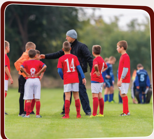
نەبوونى راھينەرى باش