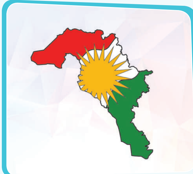
مافی تاییبەتمەندی ھەریمی