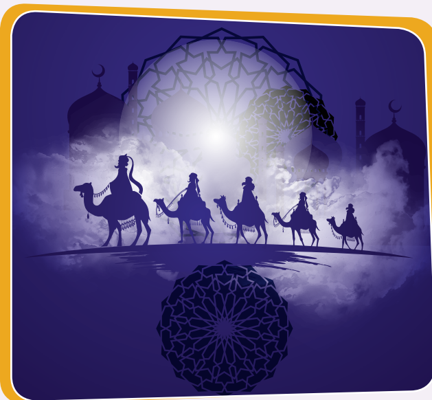
سەرى سالى كۆچى