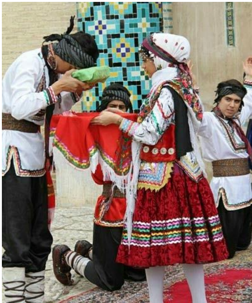
کوردەمکانی لای خۆراسان، لە دواڕۆژی دەوڵەتی خۆرەهەلاتی کوردستاندا. / نووسینی عارف باوەجانی