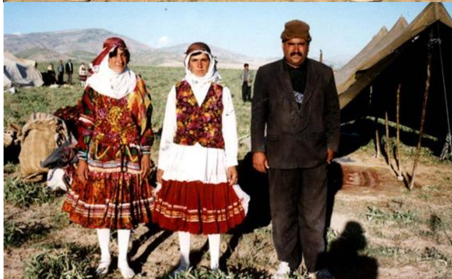
کوردهکانی لای خۆراسان، له دواڕۆژی دموکراتی خۆرهلانی کوردستاندا. / نووسینی عارف باوهجانی