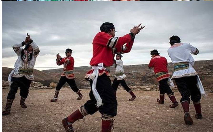
کوردهمکانی لای خۆراسان، له دواڕۆژی دهمولغتی خۆرهلای کوردستاندا. / نووسینی عارف باوهجانی