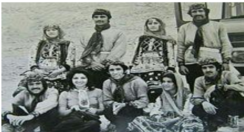
کوردهکانی لای خۆراسان، له دواڕۆژی دهولێتی خۆرهلای کوردستاندا. / نووسینی عارف باوهجانی