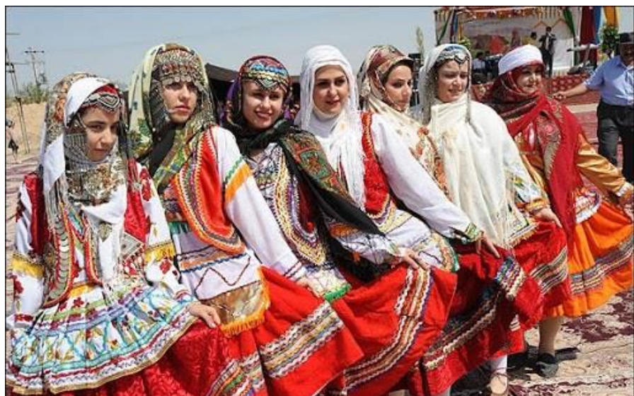
كوردەمكەنى لای خۆراسان، لە دواڕۆژی دەوڵەتی خۆرەهەڵاتی كوردستاندا. / نووسینی عارف باوەجانی