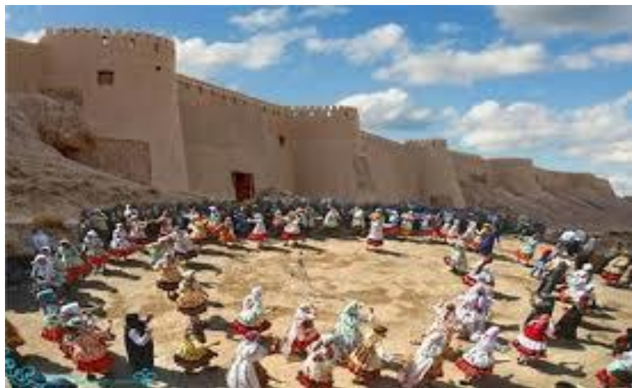
کوردهمکانی لای خۆراسان، له دواڕۆژی دهمولغتی خۆرهلآتی کوردستاندا. / نووسینی عارف باوهجانی