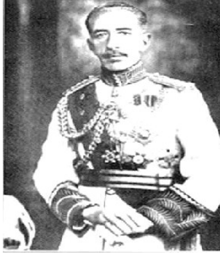
المئک فيصل الاول

مهليک فهيسه لى يه کهم ناوى (فهيسه لى کوپى حوسه ينى کوپى حوسه نى هاشمى) يه و له شارى تايى و له ۲۰ ئيارى ۱۸۸۳ له دايک بووه ، له گه ل سى براى تريدا له ئاميزى شهريف حوسه ينى باوکیاندا په روه رده بوون، کاتيک ته مه نى ده گاته هه شت سال و به هوى ناکوکى نيوان باوکى و يه کيک له مامه کانيه وه روده که نه ئه سته نبول و له وى ماوه يه که ده ميئنه وه ، له ئه سته نبول ده خريته بهر خوئيندن و پاشان له گه ل کچه مامى ( شهريف ناصر) له سالى ۱۹۰۵ ژيانى هاوسه رى پيک دىنى و دوايى له سالى ۱۹۰۹ له گه ل نه ندامانى ترى خيزانه که يدا ده گه پيئنه وه بو حيجاز ئه مه ش دواى ئه وهى باوکى ده بيت به شه ريفى مه ککه له برى مامى واته ( شهريف عه بدولا ) ، کاتيکيش فهيسه ل له ژير فرمانره وايه تى باوکى دا کارى ده کرد، توانى ليها تووى خوى بسه لميئى به تاييه ت له سه ر کوت کردنى ياخى بونه کانى عه سير و ناوچه کانى ترى دورگه ي عه رب، ئه مه ش بوو به مايه ي ئه وهى تا باوکى وه ک نوينه رى خه لکى جده له ئه نجومه نى نيرواوانى