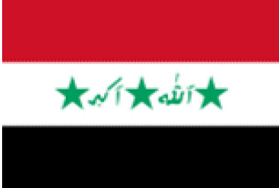
نألاى عىراق ۱۹۹۱ - ۲۰۰۸