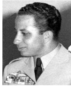
مہ ٹیک فہیسیہ ٹی دوہم