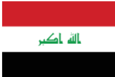
نألاى عىراق (كأئى) ۲۰۰۸ - ۲۰۰۹