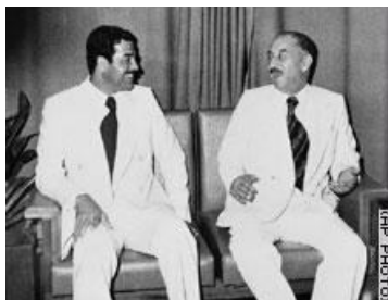
نه حمەد حەسەن بەکر و سەدام حوسەین