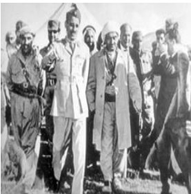
عہدوئترہ حمان عارف و بارزانی