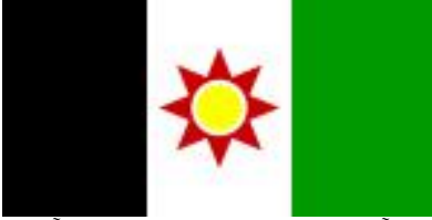
نألاى عىراق - سئردمى دةسەلأئى عئبدولكئريم فاسم - ۱۹۵۸ - ۱۹۶۳