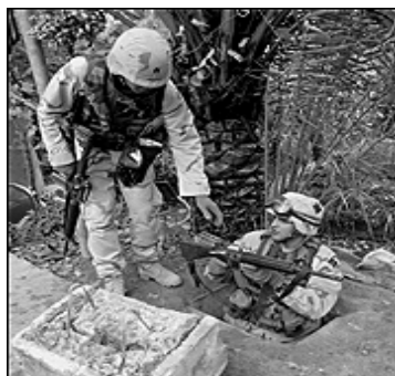
نه و جیگه‌ی سەدام خۆی تیا حەشاردابوو