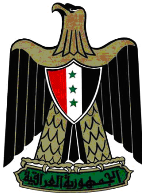
شعار الجمهورية العراقية