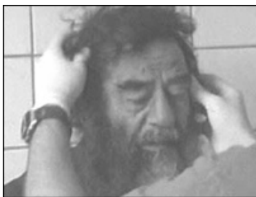
سەدام حوسەین پاش دەستگیر کردنی له کانونی دوهمی ۲۰۰۳