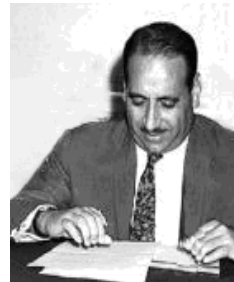
عہدوئسہ لام عارف