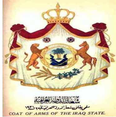
دروشمی شانشینى عیراق - سێردەمی ئاشایەتی -