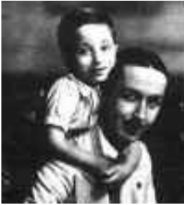
عہدوئنیلاہ و فہیسیہ ٹی دوہم