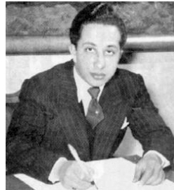
مہ ٹیک فہیسیہ ٹی دوہم