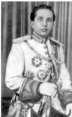
المک فیسعل الثانی

فهیسه لی دووهم له بهر به یانی ۲ی مارس ۱۹۳۵ له دایک بووه، له ته مه نی ۴ سالیدا مه لیک غازی باوکی به کاره ساتی ئۆتۆمبیل تیا ده چیت، فهیسه لی دووهمیش له بهر ئه وهی که ته مه نی له و کاته دا چوار سال بوه و ته مه نی یاسایی پاشایه تی نه بووه خالی واته (عه بدولئلا ه) ده کریته سه رپه رشتیار (وه سی) به سه ریه وه، ئه مه ش له سه ر وه سی تی مه لیک غازی ههروهک هاوسه ره که ی له بهردهم ئه نجومه نی وه زیرانی ئه و کاته دا باسی لیه کرد بووه .. فهیسه لی دووهم له بهریتانیا و له گه ل حوسینی کوپی ته لال که نه وه ی مامه کانی بووه له ئوردون پیکه وه ده خوینن و په یوه ندیه کی به تین له نیوانیاندا دروست ده بیت، تا ئه وه ی له ۲ی مارس ۱۹۵۳ کاتیک مه لیک فهیسه لی دووهم ته مه نی یاسایی ته واو ده کات ، به ره سمی کاروباری ولات ده گریته ده ست و ده بیت به مه لیکی فیعلی عیراق، به لام پیش ئه و به رواه خالی مه لیک فهیسه ل کاروباری ولاتی به ریوه ده برد