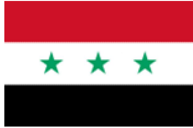
نألاى عىراق ۱۹۶۳ - ۱۹۹۱