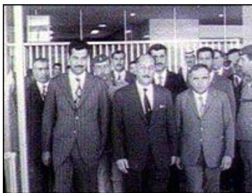
نه حمەد حەسەن بەکر و سەدام حوسەین