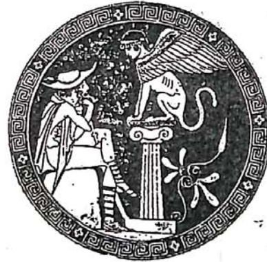
Cedipe et le sphinx, peinture de vassel.

زىاد كەين كە توپزىنەوەى ميژووى كۆنى سيستەمى پاشايەتى رووكارەكەى لەو جۆرەيە كە لەوانەيە ولامى ئەو پرسىارەمان بو دەستەبەر بكات. بەگوپرەى راشەى زۆر سەرنج راکيش، گەرچى خودى فرىزر پروايەكى ئەوتۆى پى نيه، يەكەمىن پاشاكان بيانى گەلىك بوون كەپاش ماوئەكى كورتى دەسلات لەلايەن رەعەتەكانى خويانەو لەبەردەم ئەو خواوئەندەدا كە نوپنەرى ئەوان لەسەر زەوى بوون بەئەنجام گەياندى رى و رەسمىكى شكۆدار لەجەژن و هەلپەركيدا دەكرانە قوربانى. هيشتا لەمروماندا دەتوانين كاردانەوەى ئەم ميژووو سەرەتايەى پاشايەتى لەنيو ئەفسانەكانى مەسىحيدا ببينين.