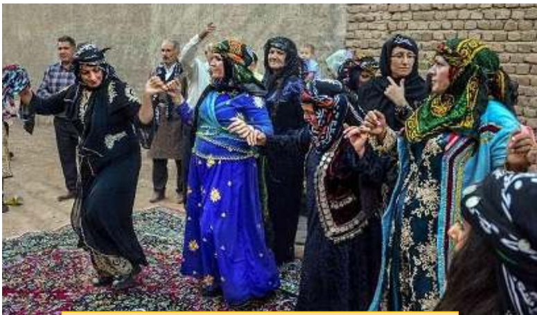
وینهی ههلبه پیکهی ژنانی لۆر له خۆرمۆوه (خرم آباد)