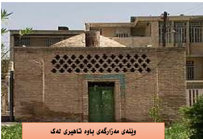
وینە ی مەزارگە ی باوہ تاهیری ئەک

لەو باوہردام، دژوارترین بەش لە ویژەدا، بەشی ئاوازنانان و