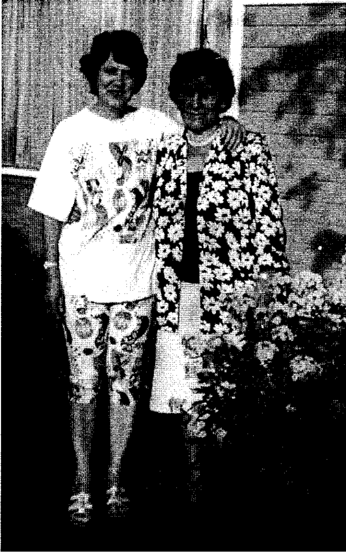
نووسەر و وەرگیپ له هۆڵه‌ندا سالی - ۱۹۹۶ -