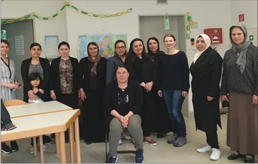
مجموعة ناجيات إيزيديات في كورس اللغة الألمانية في مدينة فرايبورك جنوب ألمانيا