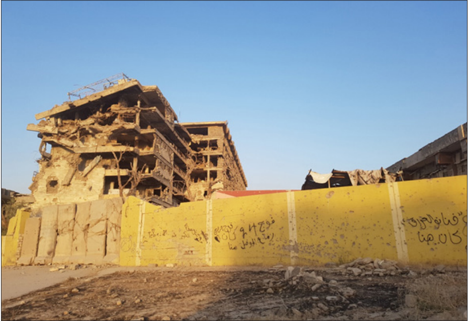
بناية استخدمها داعش لحجز وبيع النساء - في الموصل بالقرب من فندق نينوى أوبروي