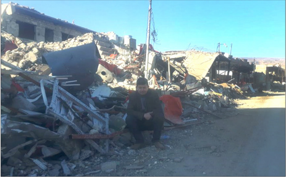
موثق هذه القصة في سنجار المنكوبة