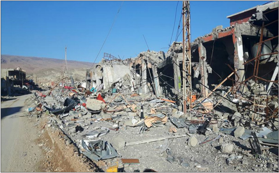
مدينة سنجار المنكوبة (مدمرة بنسبة 85%)