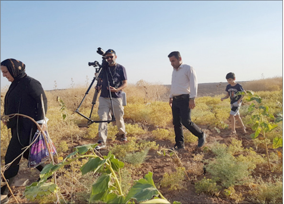
التصوير في أماكن متفرقة