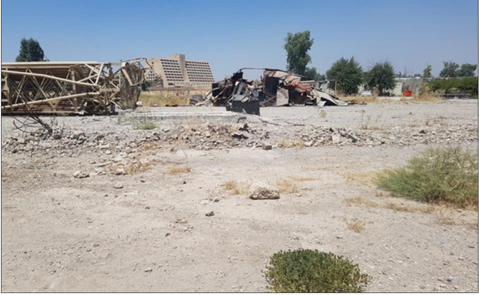
أنقاض قاعة كالاكسي (استخدمها داعش كأكبر معتقل للسبأيا) دُمرت أثناء تحرير الموصل