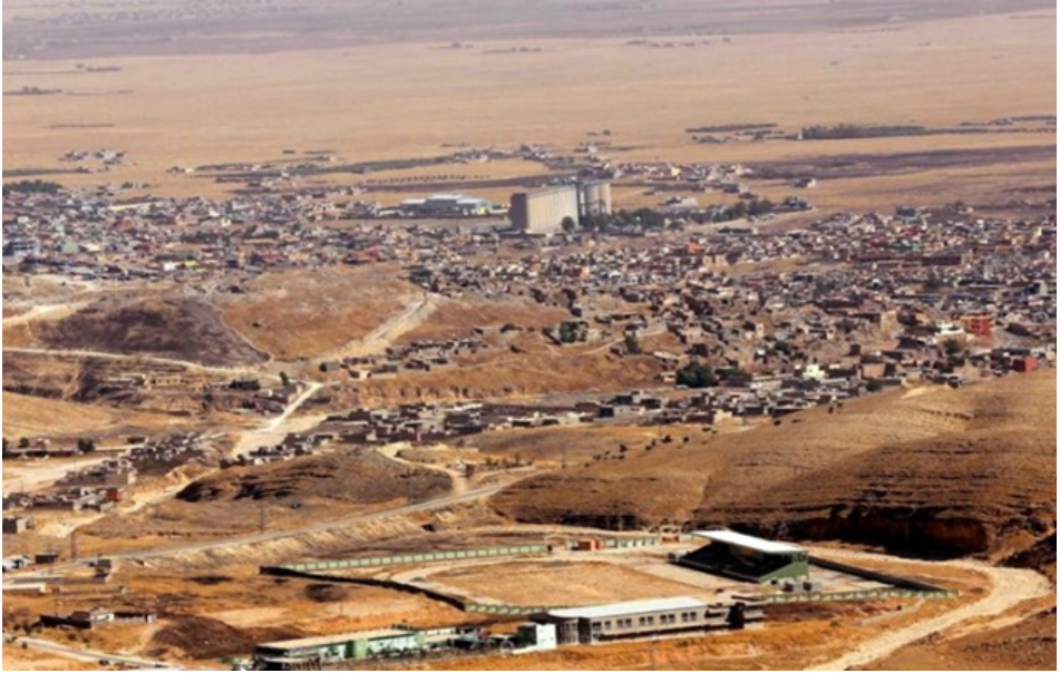
منظر عام لمركز قضاء سنجار

الأهل والأقارب والأصدقاء بمراسم عيد صوم أربعينية الصيف للإيزيديين 18 ، اصطدنا بعدم صحة المعلومات والأخبار التي كانت ترد إلى زوجي وشقيقه قائد من خلال الموبايل بأن كل شيء على ما يرام، ووقفنا على مغادرة التركمان الشيعة من أهالي تلعفر، والذين نزحوا إلى سنجار يغادرونها إلى ربيعة وإلى كوردستان للتوجه نحو النجف وكربلاء والوضع كان مقلقاً جداً وغير مستقر، وقلّة من أهالي سنجار أيضاً غادروها.