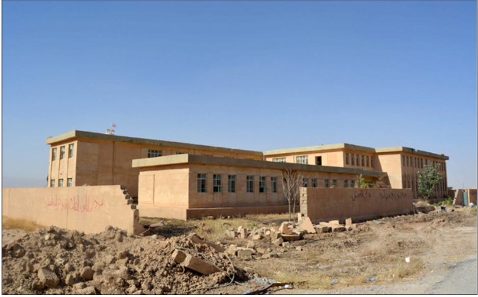
مدرسة ثانوية كوجو التي أصبحت متحفاً تضم صور شهداء كوجو