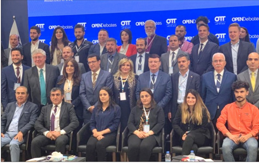
في مؤتمر عن جينوسايد الإيزيدية بالجامعة الأمريكية - دهوك