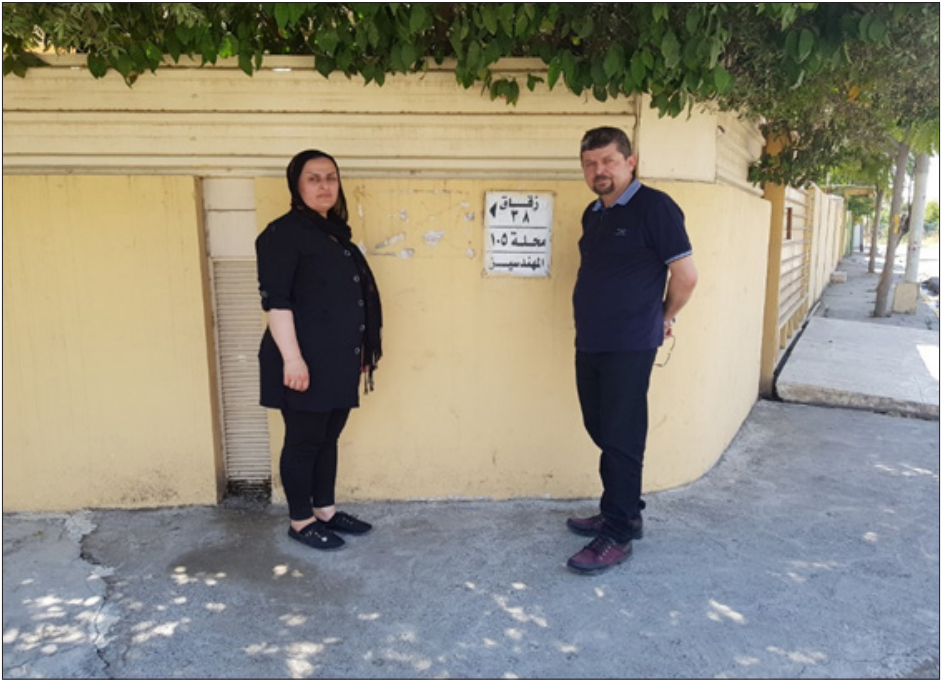
أمام دار كان داعش يستخدمها كسوق لبيع النساء - حي المهندسين في الموصل