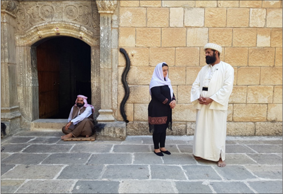
في معبد لالش المقدس