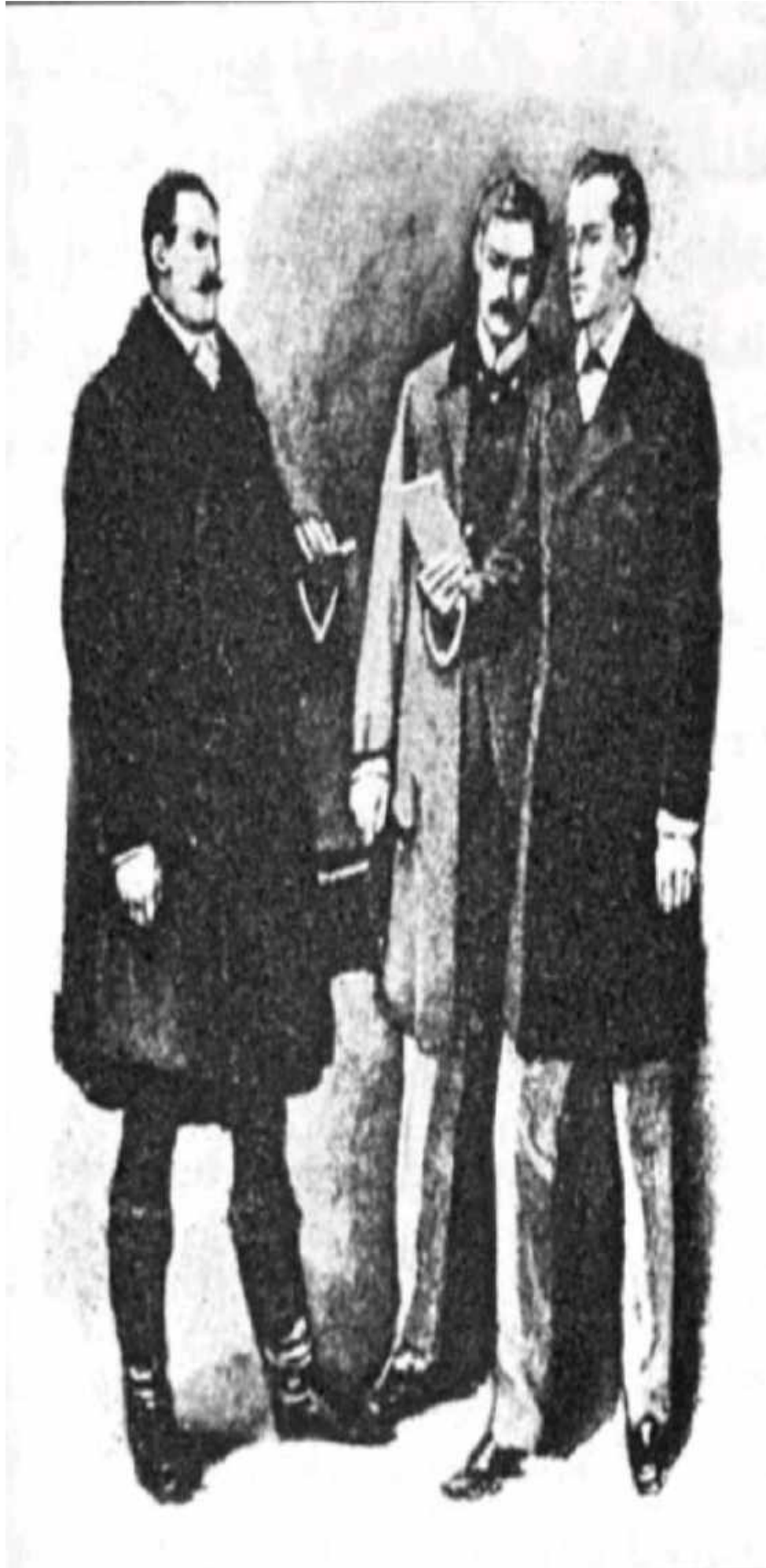
پاشاکه نئلقهیکى زمرودى لهشیوهی مار لهپهنجهی دهرهیناو خستیه دهستی شیرلۆکهوه.