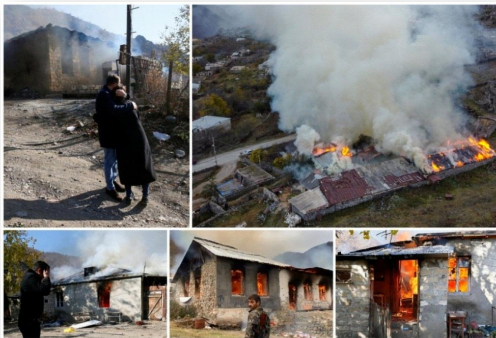
ھاۋلاتيانى ئەرمەنى بەر لەجىھىشتنى ناۋچەكانى مالەكانى ئاگر تىبەردەدەن

لەئىستايدا بەشىكى زۆر لەھاۋلاتيانى نىشتەجىي ناۋچەكانى (ئاگدام و كىبجار و لاچىن)، كە بەپىي ناۋەرۆكى رىككەتتنامەكە، برىاردرا ئەرمىنيا رادەستى ئازەربايجانيانان بىكاتوۋە، سەرومالى خۇيان بەجىدەھىلن و رودەكەنە ئەرمىنيا، لەگەل بەجىھىشتنى ناۋچەكەشياندا، ئاگر لەمال و شوئىنەكانيان بەردەدەن، بۇ ئەۋەي دۋاي خۇيان ئازەرىيەكان سود لەشوئىنەكانيان ۋەرنەگرن.