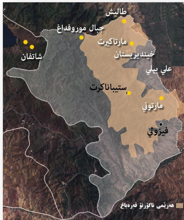
نەخشەى جوگرافى ھەرىمى ناگۆرنۆ قەرەباغ

جاريكى دىكە لەسالى ۲۰۱۶ شەر و ئالۆزىي گەورە لەنيوان ھەردولادا لەسەر قەرەباغ رويداىەو، بەوھۆيەشەو ۱۱۰ كەس لەھەردولا كوژران. سەرئەنجام كۆمەلگەى نيودەولەتى دەستپوھردانى گرد بۇ راگرتنى جەنگەكە.