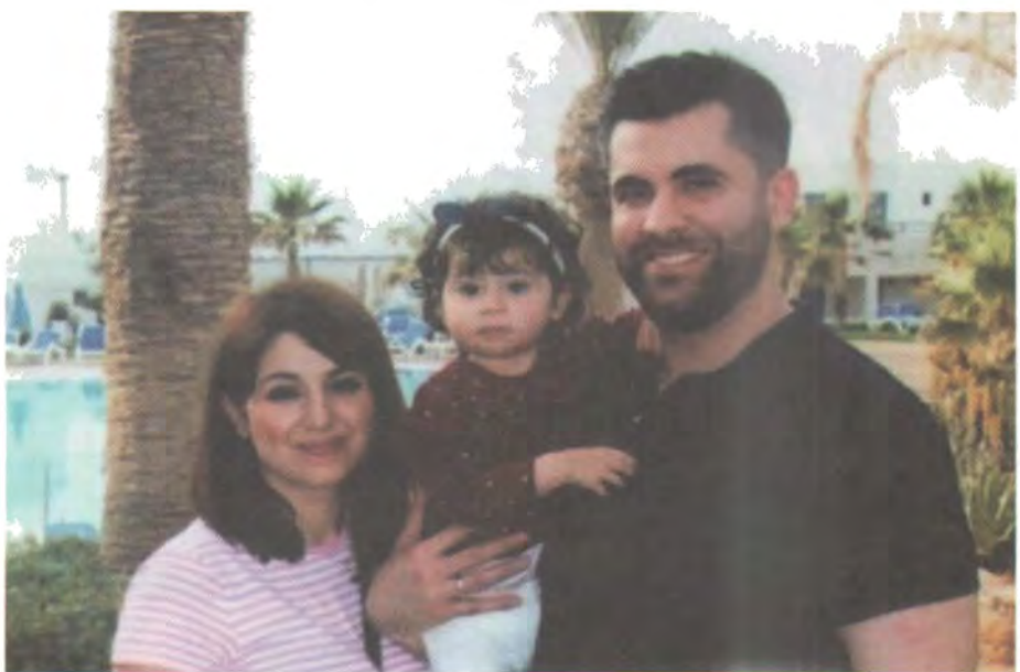
كىۋانى كورم و لاقا مەھمەد قادرى ھاۋزىنى و ياراي كچيان