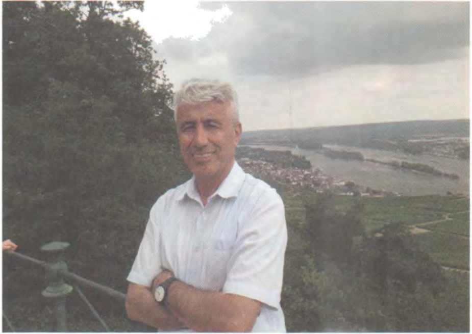
ناسوی برام- فرانکفورت ۲۰۱۶