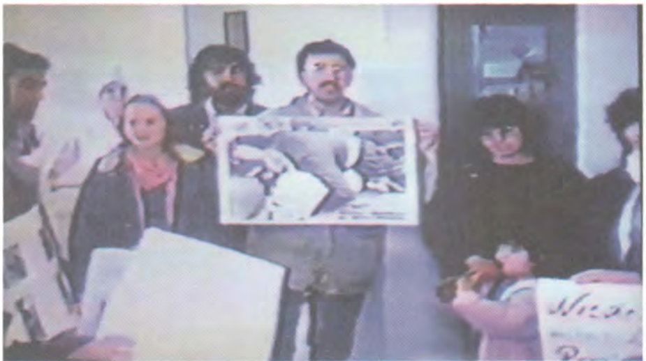
۱۹۸۸ ئەلمانیا، ئەبتكەى حىزبى لىبرالى ۋەزىرى دەرەۋى ئەلمانىا دىتېرت گىشەر، نارەزايى بەرامبەر بۆمبارانى كېمياۋىي ھەئەبجە. ئەراستەۋە: كىۋانى «۴» سالى كورم، پەيمان، نووسەر، شىخ باھىر، بارىاراي ھاۋىرتى