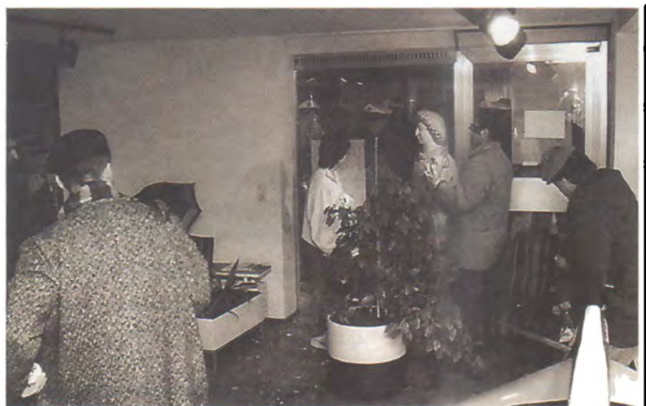
نه‌ئمانیا فرانکفورت، نووسینگهی هیتلی فرۆکه‌وانی عیراق- نیوه‌زی ۱۹۸۸/۲/۲۳ له‌راسته‌وه: نه‌وزاد قه‌ه‌تان، په‌یمان، موه‌ه‌قه «پشتی له کامیرایه»