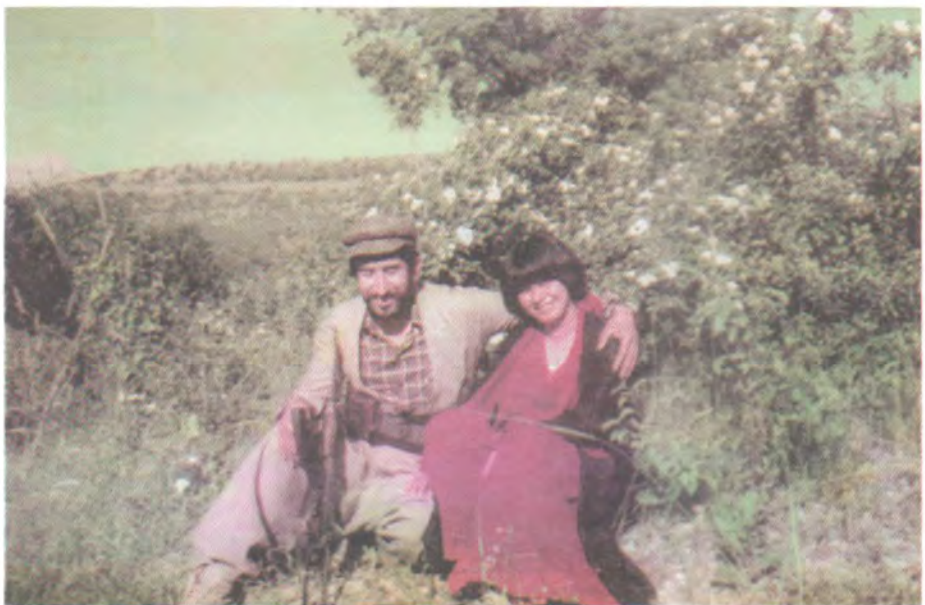
هاوینی ۱۹۸۴، گوندی شوکن له شاریاژر، له‌گه‌ن هاوژنی ینشووم په‌یمان مسته‌فا کونجرینی