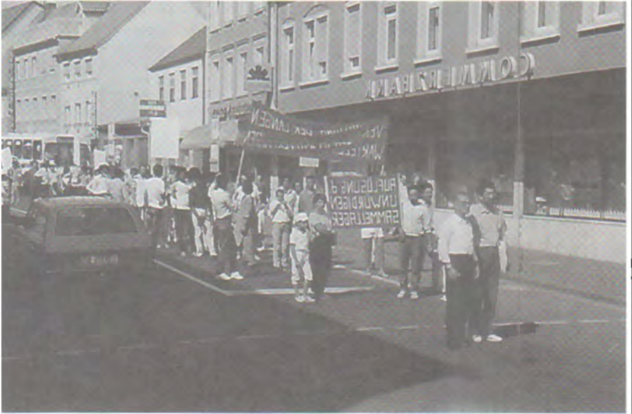
۱۹۸۶ ئەلمانیا، Schweinfurt، خۆپیشاندن بۆ ماھى پەنابەران. ئەراستەوھ يەكەم