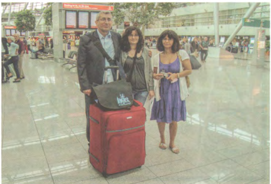
نەئمانیا- فرۆكەخانەى دۆسلدۆرف ۲۰۰۹. ئەگەن پەيمان و كەنىي كچم دا