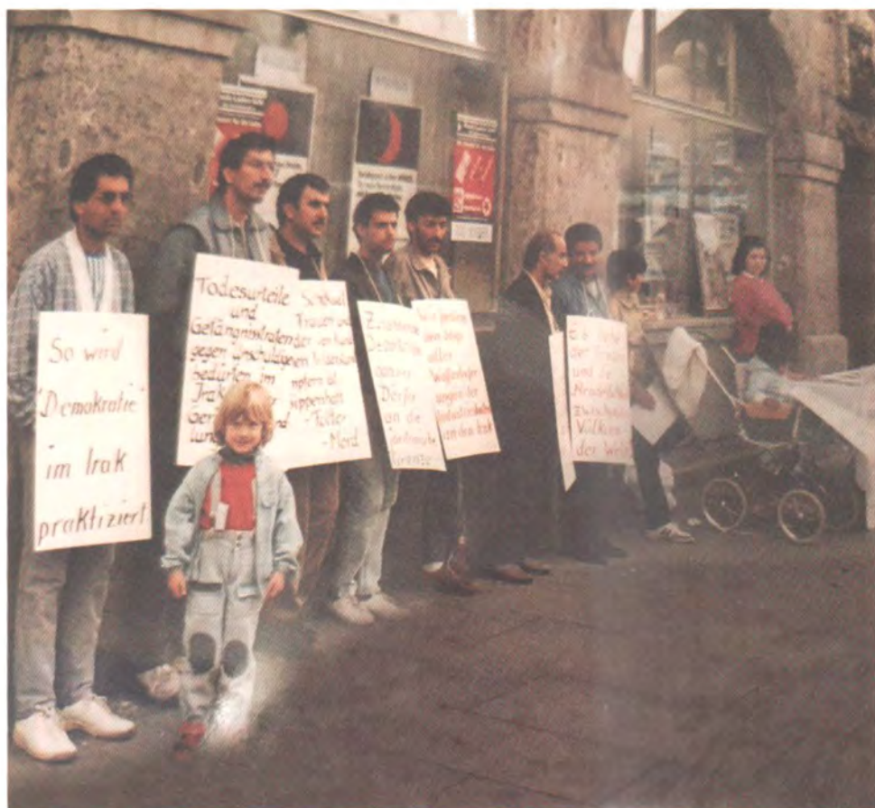
۱۹۸۶ نهمانیا، ناوهرستی شاری Schweinfurt نه چه په وه: دنیر نه سهههه که رکوکی، نووسهه، ملازم سهکو دزیی