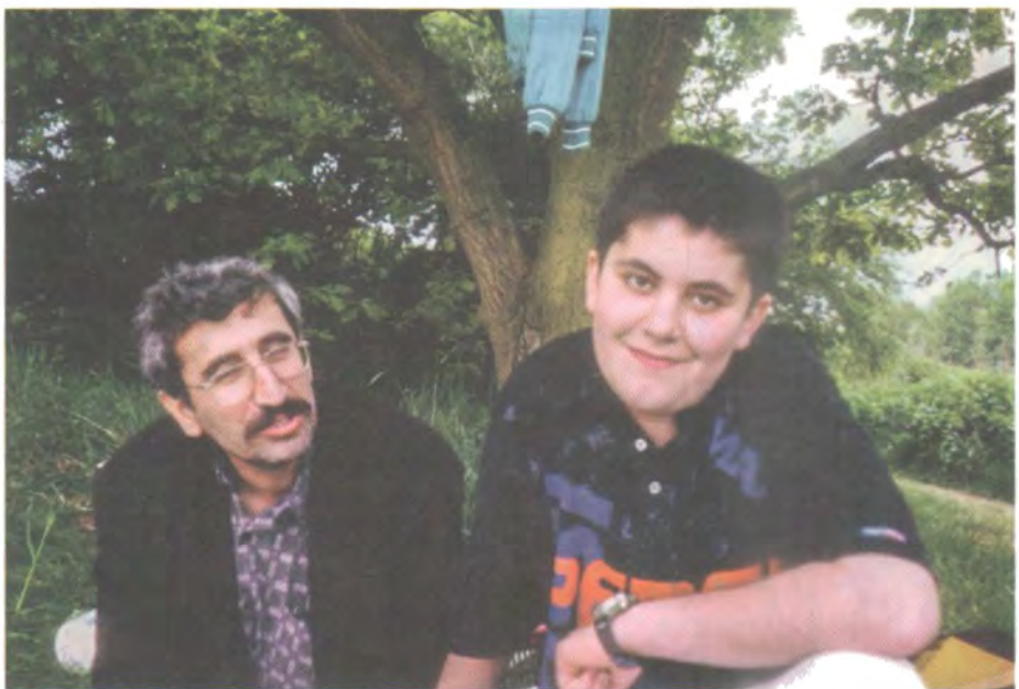
نەئمانیا- ۱۹۹۶ نووسەر ئەگەن کیتوانی کوریدا