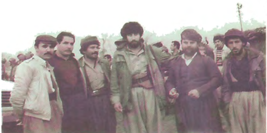
به هاری ۱۹۸۴ سینه ک له راسته وه: نه ناسراو، بورهانی مه ته فا کونجیرینی، نووسهر، سن یشمه رگه ی نه ناسراو