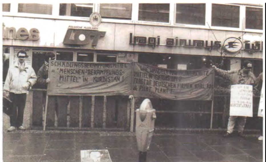
نه‌ئمانیا فرانکفورت، به‌ردهم نووسینگهی هیتلی فرۆکه‌وانی عیراق- ۱۹۸۸/۲/۲۳ سن چالاکوان به دروشمه‌کانیانهوه راوستاون