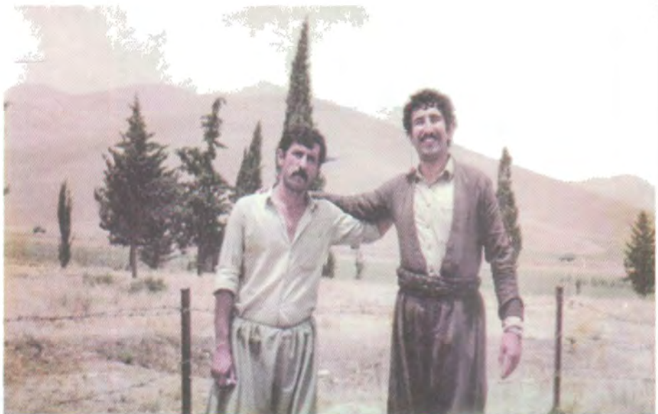
هاوینی ۱۹۸۴ له‌گه‌ن پشکو نه‌جمه‌دین