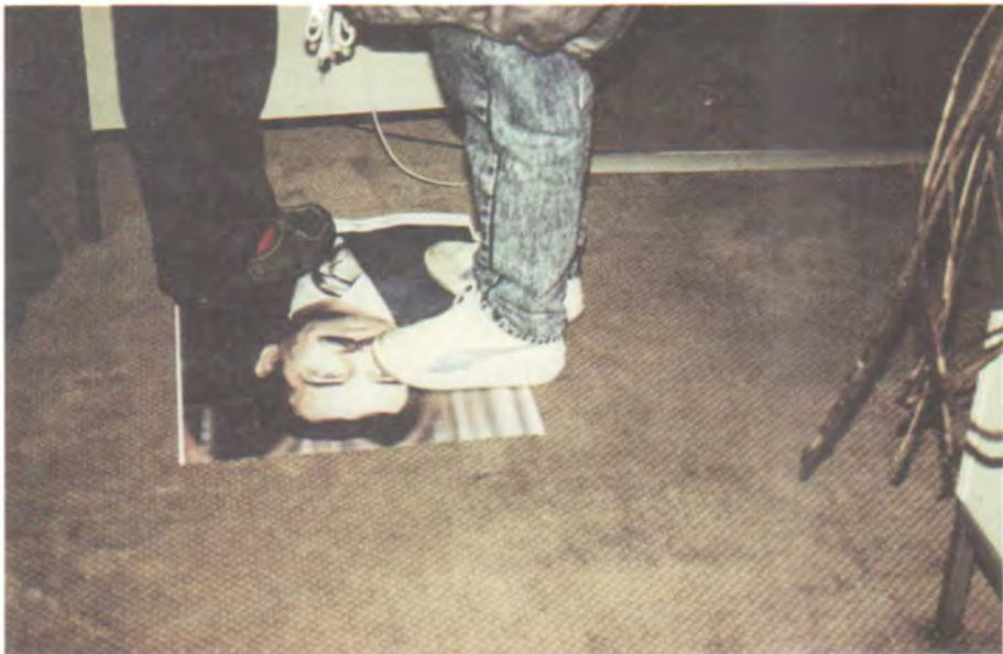
نه‌ئمانیا فرانکفورت، نووسینگه‌ی هیللی فرۆکه‌وانی عیراق- پینشیه‌یه‌وه‌پۆی رۆژی ۱۹۸۸/۳/۲۲ په‌یمان و که‌سینگی تر له‌سه‌ر وئته‌ی سه‌دام حسین راوه‌ستاوان