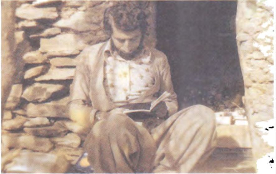
گوندى چۆنگراوى يېتەلەن - مانگى ۱۰ى ۱۹۷۹ ئەبەردەم زوورە تارىك و كۆمۈمكەي ناومان نابوو نەخۇشخانەى شۆرش