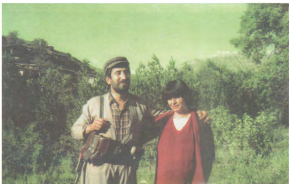
هاوینی ۱۹۸۴، گوندى شوکن له شاربازېر، لهگه‌ن پهمان مسته‌ها کونجرینى