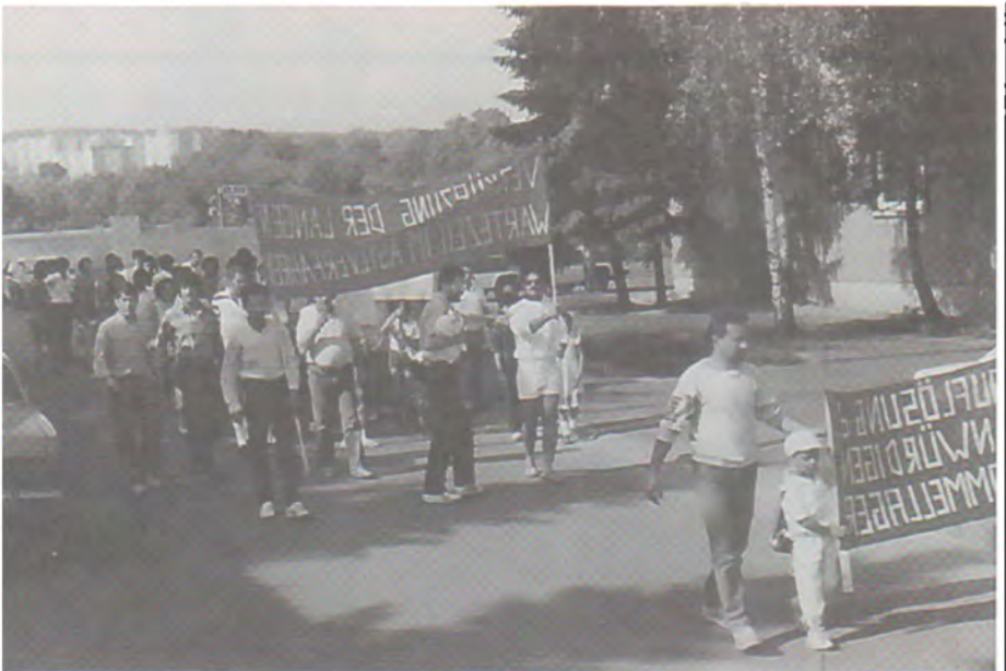
۱۹۸۶ ئەلمانیا، Schweinfurt، خۆپیشاندن بۆ ماھى پەنابەران. ئەناوئراستدا نووسەر كۆمەنیک بلاكراوى بەدەستەویە