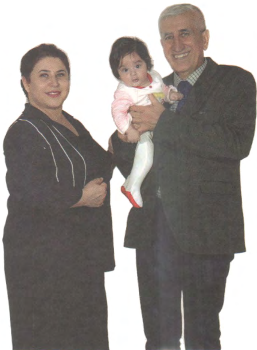
نهگه ن «كه تان» ى كچم و «داليا فوناد سراف» ى هاوژنم