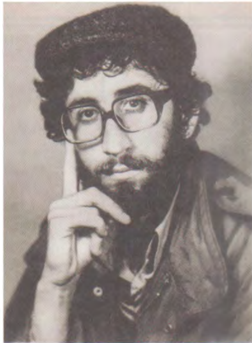
سەردەشت - ناوەرەستى مانگى ۳ى ۱۹۸۰ نووسەر بۆ ئەگەرى شەھىدبوون وەك پۆستەر