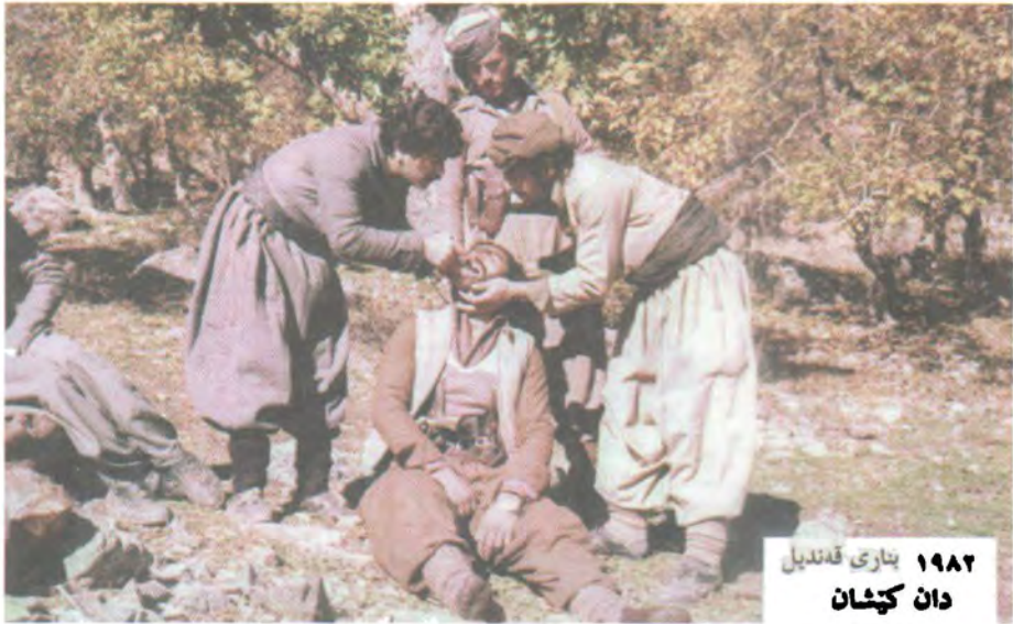
۱۹۸۲ بناری قندیل دان کپشان

له چه پوهه: د. هسان له کاتی ددان هه لکیشانی پشمه رگه یه کدا