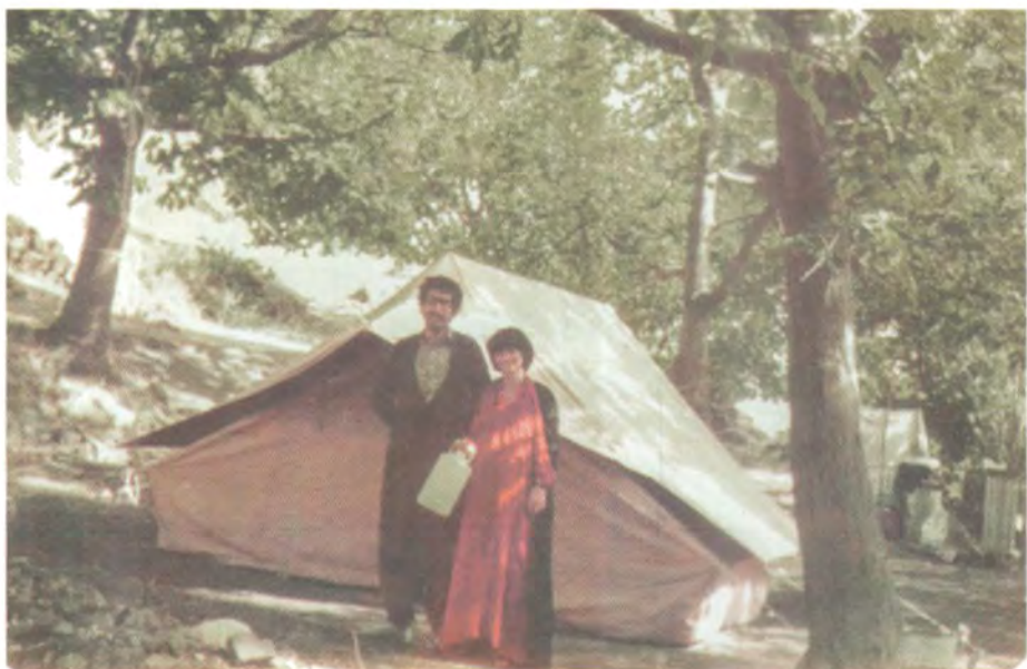
لهگه‌ن « پهمان » نه بهردم رشماله که مان له گوندى گورگه یه‌رى شاربازېر، هاوینی ۱۹۸۴