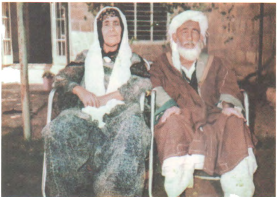
دایک و باوکی نووسەر