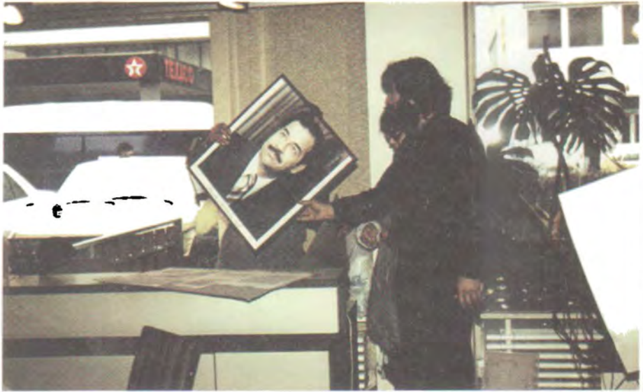
نه‌ئمانیا فرانکفورت، نووسینگه‌ی هیللی فرۆکه‌وانی عیراق- ۱۹۸۸/۳/۲۲ شیخ باهیر که‌رکۆکی و په‌یمان و که‌سینگی تر وئته‌ی سه‌دام حسین لێ‌ده‌که‌نه‌وه