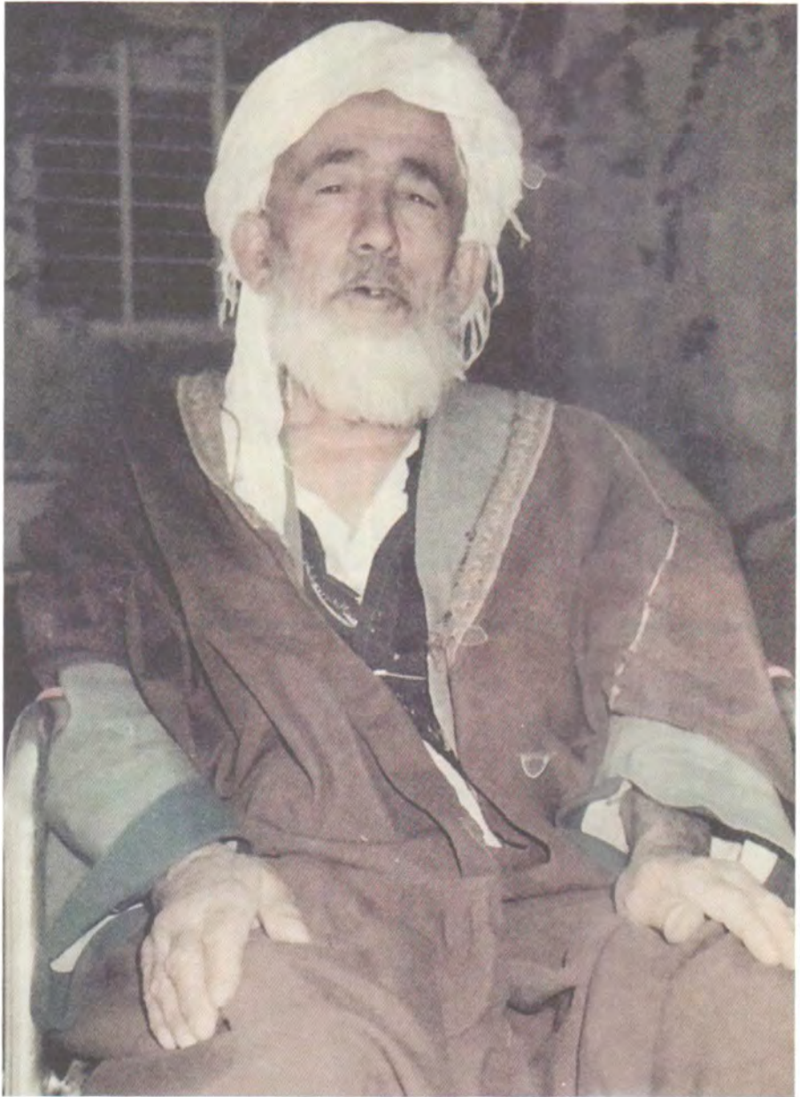
باوگم - سلیمانی ، مالی خوزمان ۱۹۸۷