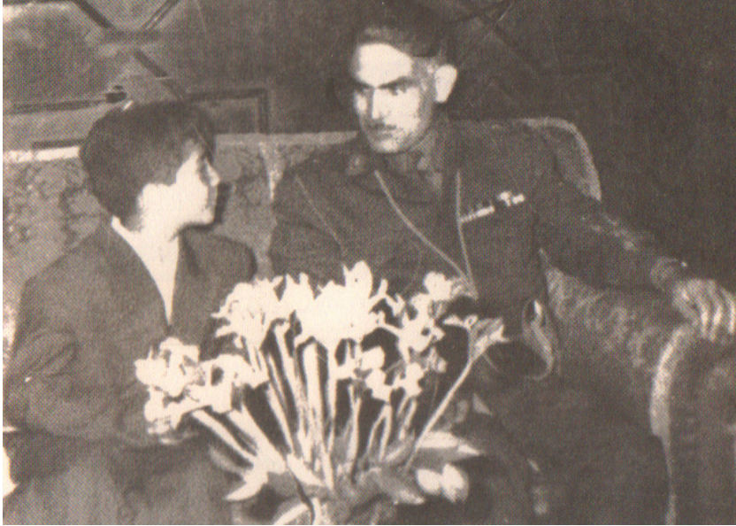
Ebdilkerîm Qasim û Mesûd Barzanî – 1959

etkar û li jêr ferman û destûra bavê xwe bû. Însanekî pir hişyar e. Dilê apê min Mela Mîstefa pir bi Mesûd xweş bû. Mesûd li ba bavê xwe pir nazdar, delalî û hezkirî bû. Mesûd pir miqate û agahdarê arşîv û nivîsar û belge-name û tiştên din ên bavê xwe bû. Mesûd wek bawermendî girêdayî bavê xwe bû û bi serkirdatî û serokatiya bavê xwe sersam bû, ne tenê wek bav û kur, lewma qet guhê min lê nebûye ew bavê xwe rexne bike û bêje filan tişt an li filan cihê bavê min xeletî kir. Hertim bi hikmet û lojîk û aqilmendî qala mezinahiya bavê xwe dike.”