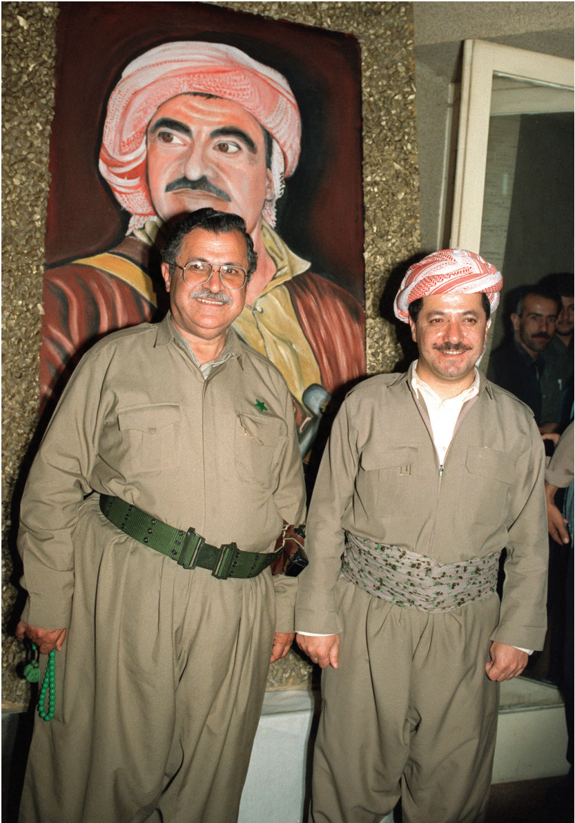
Mesûd Barzanî û Celal Talebanî