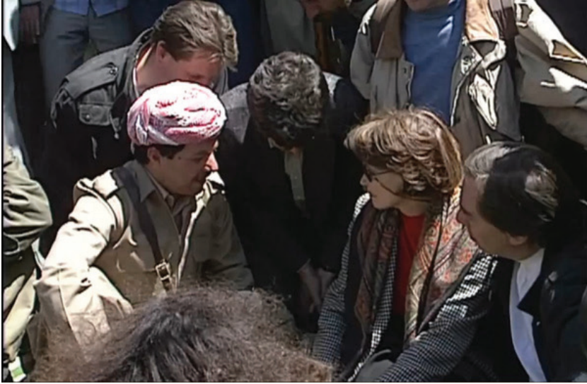
Danielle Mitterrand û Mesûd Barzanî sala 1991 li Hacı Omeranê

riya Navdewletî bi dû xwe de anî ku “navçeya dijîfirînê” li ser hêla 36an çêkir.