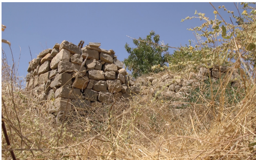
Paşmaya dibîstana gundê Nîpaxiye ku Mesûd Barzanî xwendina seretayî lê xilas kir