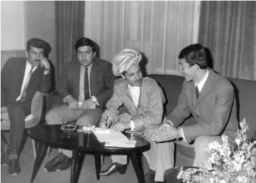
Mesûd Barzanî di dema gihiştina bi Peymana Adara 1970 – Bexda