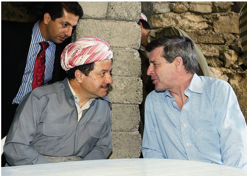
Paul Bremer, Mesûd Barzanî,

end bikin û diviyabû hîlbijartineke nû hebûya û piştî hîlbijartinê jî pêgeha Barzanî bihêz dibû, mîna berî hîlbijartinê. Di encamê de amerîkiyan hemû hewldanên xwe kirin, ji wan jî pesndan û tew pêkan e hinek gefên kêm jî kiribûna, lê wî [Barzanî] ew pesndan û gefên hindik jî piştguh û feramoş kirin û her li ser daxwazên xwe rijd bû.”