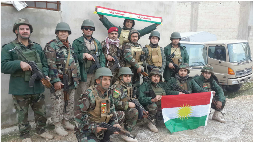
Refek pêşmerge piştî şikandina DAIŞê û rizgarkirina Kobanî li Rojavayê Kurdistanê

Barzanî ku serokê Herêma Kurdistanê bû, wek Fermandarê Hêzên Çekdar ên Herêma Kurdistanê vegeriya senger û çeperên şer û ji bo