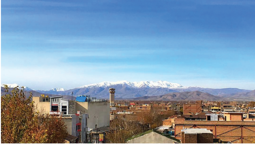
Bajarê Nexede – Rojhilatê Kurdistanê

û moralên wan mirovan bilind kir ku em ê îlem vegerin. Ev nayê wateya ku em ê dev jê berdin. Ji ber vê morala Kak Mesûd bilind bû û tevgerêke bi quwet kir ji bo ku dîsa şoreşê li Kurdistanê bide destpêkirin, her çiqasî şikestî û têkçûneke mezin bi ser miletê me de hatibû jî.”