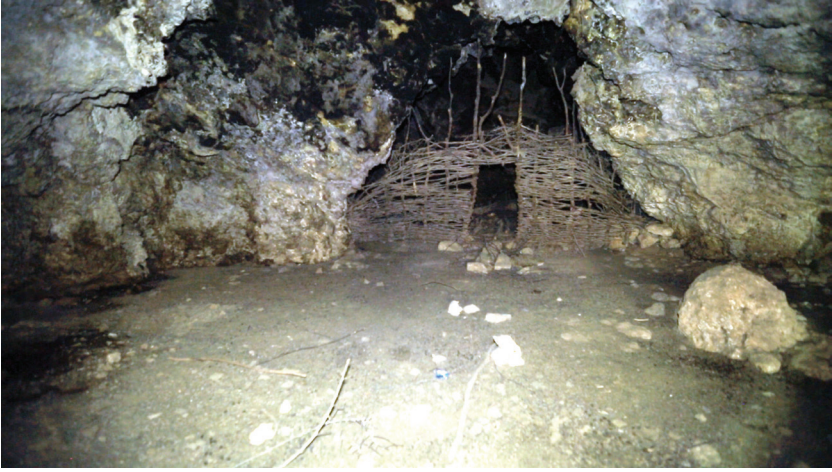
Şikefta ku Mesûd Barzanî û malbata xwe di salên 1961-1962an de tê de dijîyan