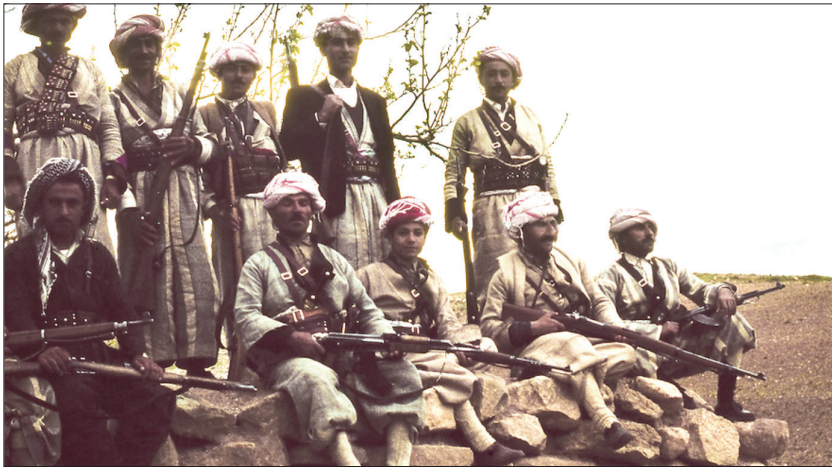
Mesûd Barzanî bi refek pêşmerge re – Şoreşa Îlonê 1962

çavnebarî û hesûdiya wê dikir. Pêşmerge mûm bûn dişewitûn ji bo ku mirovên din li ber ronahiya pêşmergeyan bijîn. Pêşmerge dimirin da ku mirovên din bijîn. Ne mumkin bû pêşmerge herin gundekî bi zorê nanekî werbigirin. Ne mumkin bû pêşmerge sîleyekê li dîlekê bidin ku di şer de hatibû girtin. Lewra jî pêşmerge ewqasî li ba milletê Kurd hezkirî bûn. Xelkê bi serê pêşmergeyan sond dixwar û xelkê şanazî dikir ku kurekî wan an xizmekî wan pêşmerge ye. Evqasî heybeta pêşmergeyan hebû.”