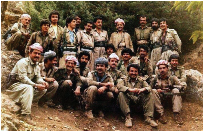
Mesûd Barzanî di nav refek pêşmerge de li devera Nêrwe û rêkan Gundê Kanî Sarkê 1986

Di dema mabûna wî de li wê deverê ku bêtirî salekê domand, bi dehan çalakiyên din li dijî artêşa Iraqê hatin encamdan, ku ji bilî bilindkirina moralên xelkê di nav bajaran de, di heman demê de destkeftên mezin ên leşkerî hebûn di destgirtina bi ser cografîyayeke berfireh de, herwiha çekên zêde yên cuda cuda ji çekên sivîk bigire heta top û çekên dijî firokeyan ketin destê pêşmergeyan.