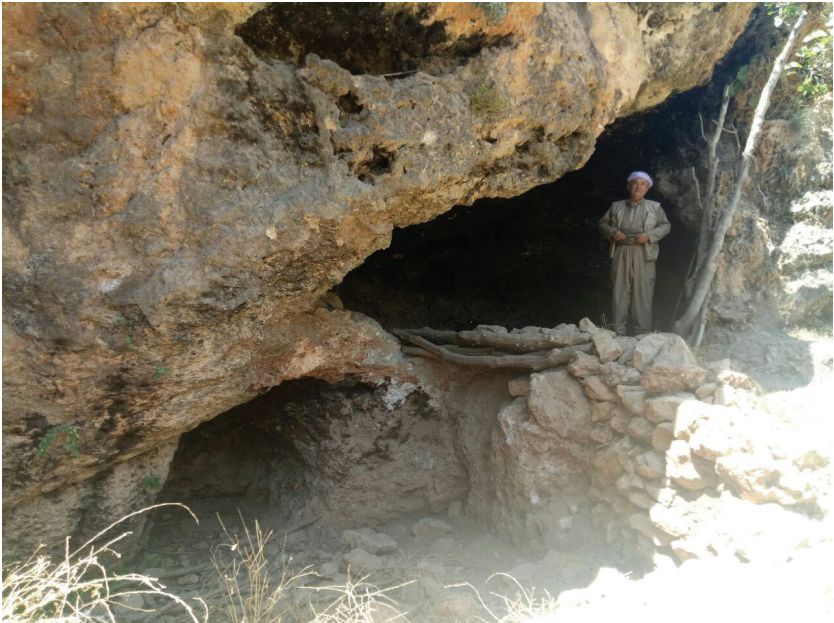
Şikefta [Geliyê Geloke], Mesûd Barzanî tê de deşt bi karê siyâsî kir û biryar da bibe pêşmerge