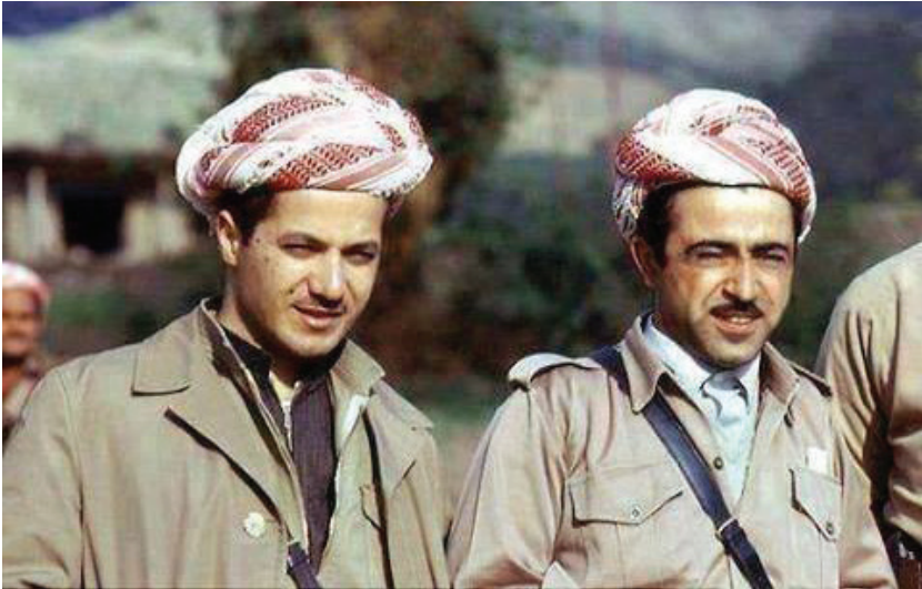
İdrîs Barzanî û Mesûd Barzanî