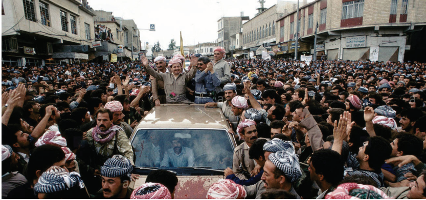
Serhildana bihara 1991

Barzanî serketina serhildanê wek destpêkirina qonaxeke nû ji bo gelê Kurdistanê pênase dikir û di wan gotarên ku ji bo xelkên serhildêr dida behsa pêwîstiya encamdana hîlbijartinan dikir ji bo ku bi wê rêyê Kurdistan ji qonaxa rewatiya şoreşgerî derbasî qonaxa sazî û dezgehan bibe.