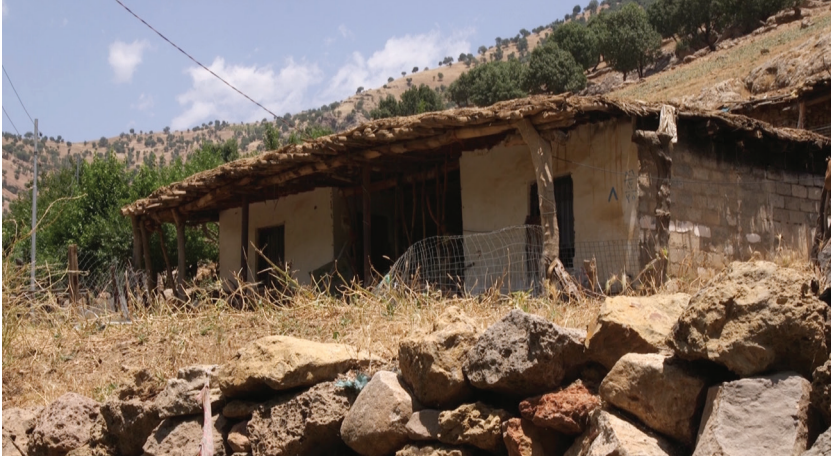
Gundê [Dêrê] – xaniyê ku Mesûd Barzanî jiyana hevseriyê tê de pêk ani

ha Barzanî hatin vir, xênî li vir ava kirin. Barzanî bi roj bêtir diçû derveyî gund û bi piyan diçû. Bi şevan jî li dîwanxaneyê pêşwaziya xelkê dikir. Lê Kak Îdrîs û Kak Mesûd kêr dihatin dîwanxaneyê. Dewama wan li Qesrê bû. Her roj diçûn Qesrê û li wir pêşwaziya xelkê dikirin û kar û barên hizbî dikirin. Êvaran jî gava dihatin hemû tiştên xwe dibirin ba Barzanî û wî biryar li ser wan dida. Paşê bersivdan û karên sibeyê ji wan re diyar dikir. Barzanî diçû dîwanxaneyê û ew jî heta derengî şevê bi kar dadiketin. Çimkî diviyabû dotira rojê bersiva xelkê bidin. Ewên ku karê wan jî xelas nedibû, li Qesrê mêvanxaneyêke taybet ji bo pêşwazîkirina pêşmerge û hevvelatiyan hebû. Bîst û çar demjimêran vekirî bû û xwarin û razan tê de belaş bûn. Xelk diçûn li wir diman heta roja dîtir an her çend rojan ku karê wan bi paş biketa.”