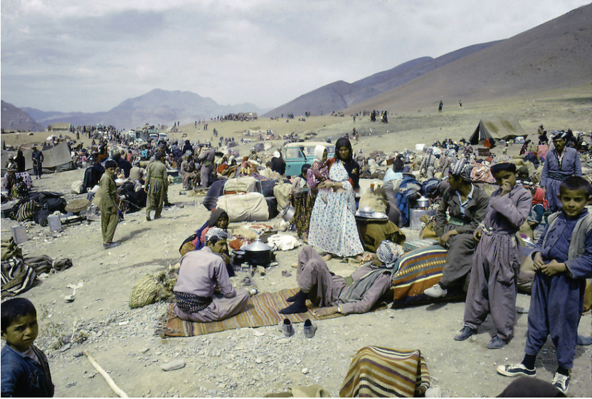
Koçberbûna bi hezaran malbatên Kurd piştî şikeştina Şoreşa Îlonê 1975

veguhaştin bajarên Îranê û ji sînorên Başûrê Kurdiştanê dûr xistin. Piştî 6ê adarê, Mela Mîstefa Barzanî li Tehranê bi şahê Îranê re dicive. Piştî vegera wî, bi serkirdên siyasî û leşkerî yê şoreşê re dicive û biryara dubare xwe birêkxistin û berdewamkirina şoreşê didin.