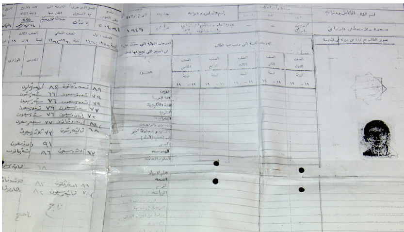
Encamên ezmûnên sala 1959an ên Mesûd Barzanî li dibistana [Navendî ya Xerbiye]

Şêx Ebdilwahid Barzanî dibêje: “Qasî min Mesûd dîtiye, pir îta-