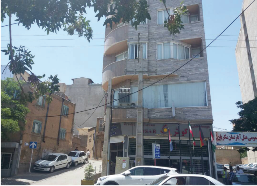
Taxa Ermeniyani li Mehabadê [Dîbiştana Sultanî 1946] cihê jidayikbûna Mesûd Barzanî ku niha bûye hotêl

Di nav rojên xweş ên Komara Demokrat a Kurdistanê li Mehabadê, di roja 16ê tebaxa sala 1946an de, di heman roja damezrandina Partiya Demokrat a Kurdistanê [PDK] de ku bavê wî Mîstefa Barzanî dibe damezrîner û serokê wê, kak Mesûd Barzanî li taxa ermeniyani a bajarê Mehabadê li [Xwendîngeha Sultanî] ku malbata Barzanî tê de niştecih bûn, tê ser rûyê dinyayê.