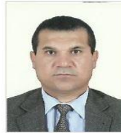
الديمقراطية الزائفة في الشرق الأوسط – شاخوان خالد

الديمقراطية هي شكل من أشكال الحكم في الدولة وفرد، يشارك فيها جميع المواطنين، والتي تمكن المواطنين من الممارسة الحرة والتساوية.