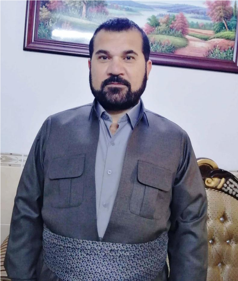
نه‌ورۆزی ٢٠٢١ هه‌ولێر- باشووری کوردستان