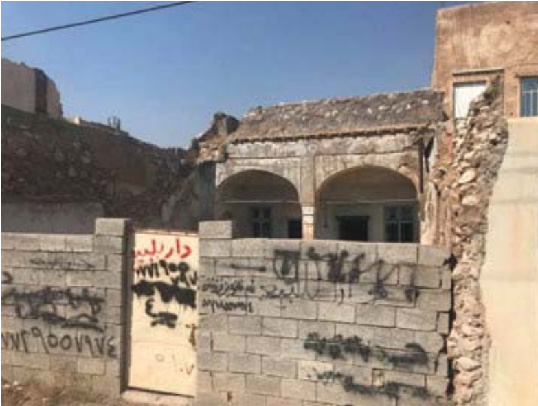
وینەى ئەو خانووەى تێیدا دەژیاین لە کەرکوک پێش ئەو هی هەلبێیین، لە سەرەتایی سالانی هەشتاکاندا.