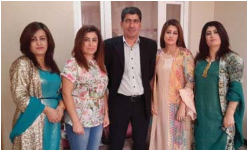
پؤ‌لا (سه‌لمان)، له گه‌ل چوار له كچه‌كاني شه‌هيد عادل.