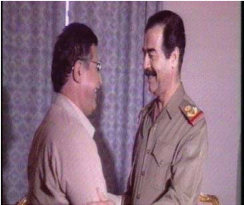
یہ کیٹک لہ وینہ کانی سہ دام حسین و جہ لال تالہ بانی.