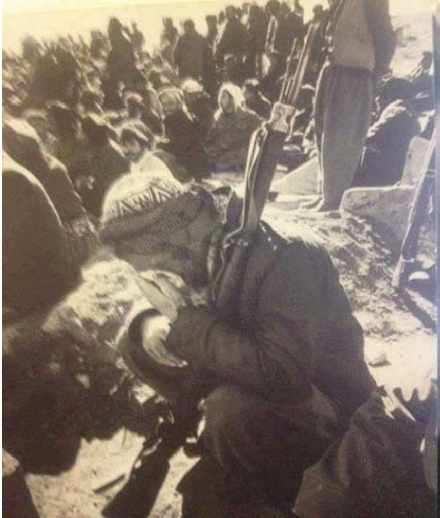
گریانی پیشمه‌رگه‌یه‌ک له ئاشبه‌تالی بزوتنه‌وه‌ی چه‌کداری‌ی کوردستانی عیراق سالی ۱۹۷۵.