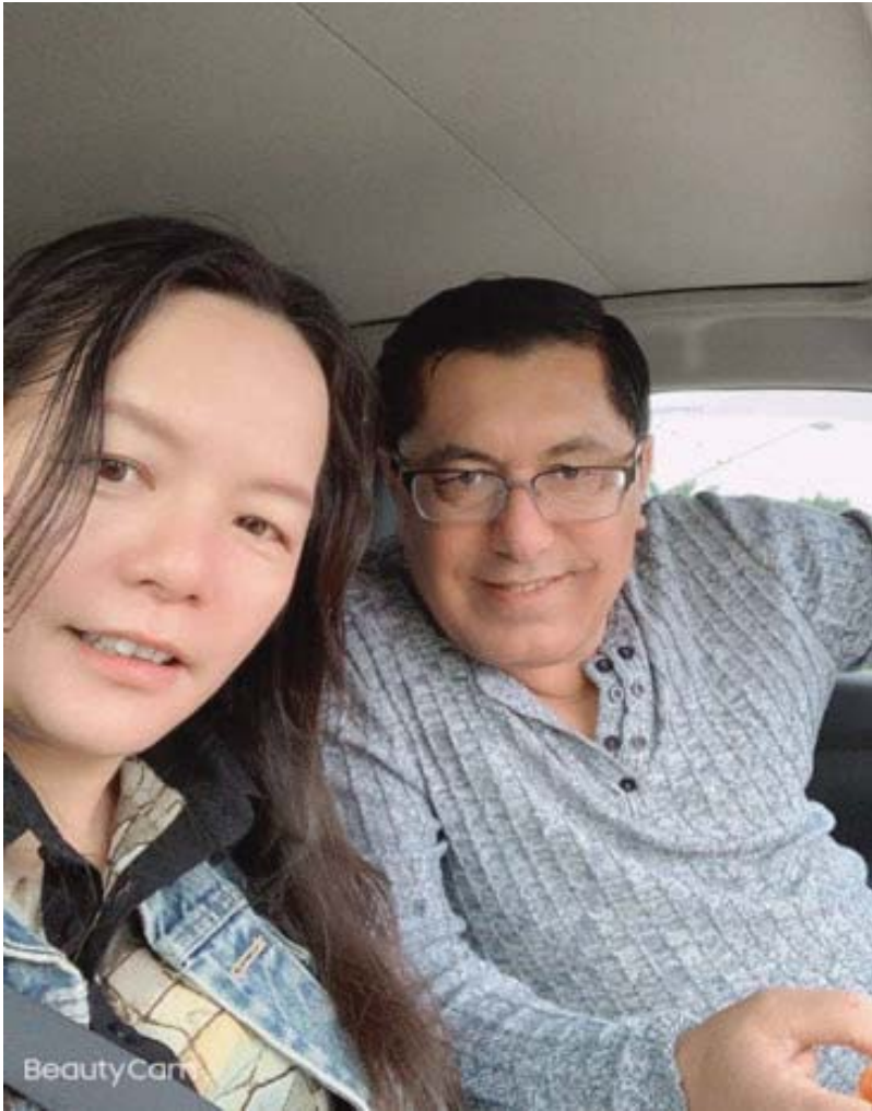
سالی ۲۰۹۲ و دوی پینچ سال له ژیان ئاوابی نهسرین، له گه‌ل جینی هاوسه‌رگیریم کرد.