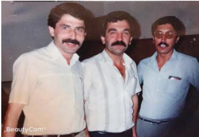
لہ راستہ وہ، من و ہر دوو ہاوری: (جہ بار مستہ فا)، (لہ تیف شیخ عومہر).