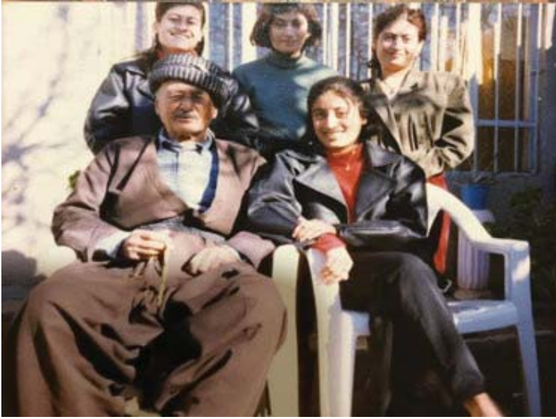
باوكم له گه‌ل چوار له كچه‌كاني شه‌هيد عادل، كو‌تايي نه‌وه‌ده‌كان.