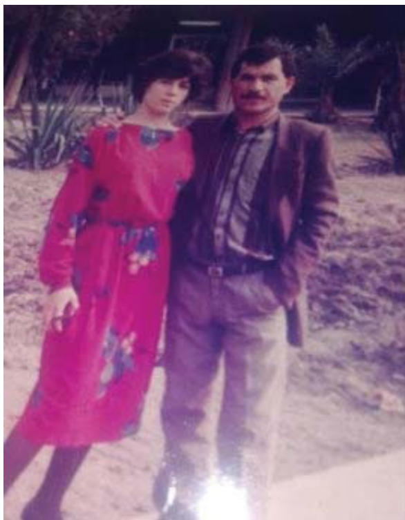
نهجات و چنور سه‌ره‌تایی سالی ۱۹۸۷