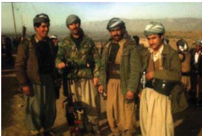
شهید ئیحسان و کومه‌لیک له هاوړیکانی، ناوه‌پراستی هه‌شتاکان.