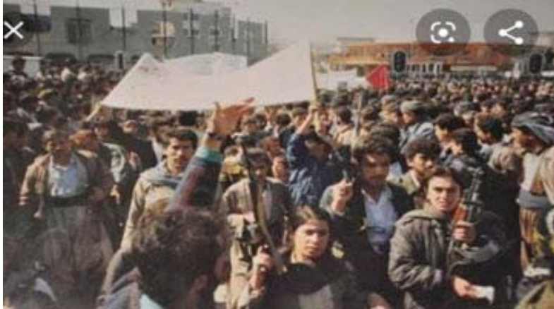
بەردەرکی سەرا، راپەڕینی ئاداری ١٩٩١