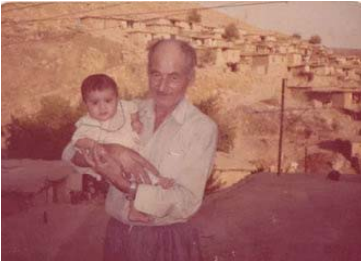
باو کم و ژوانی کچی شهید عادل، سه ره تای سالانی هه شتا کان، قه مچو غه.