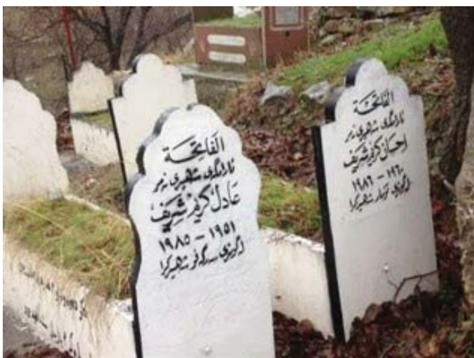
وینه‌ی گوری هه‌ردوو شهید، له گوندی دیلنژه.