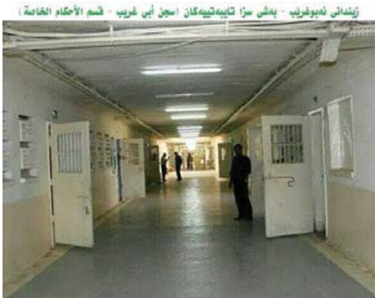
زیندانی ئەبوغریب - بەشی سزا تاییهتییهکان (سجن ايس غریب - قسم الأحكام الخاصة)