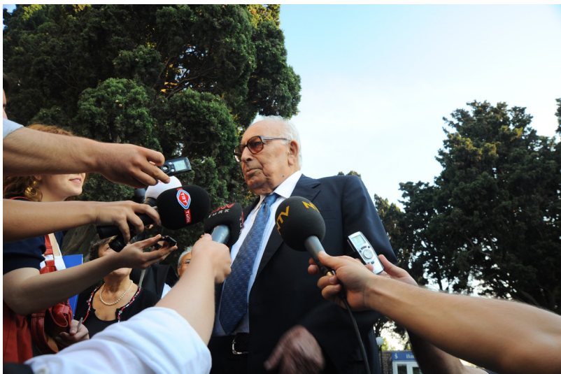
به‌خشیینی دکتوړای شانازی به یاشار کهمال - 29/6/2009