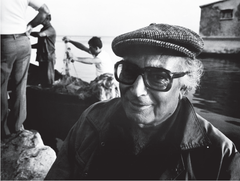
ياشار كه مال - وپنهی نارا گوپله.