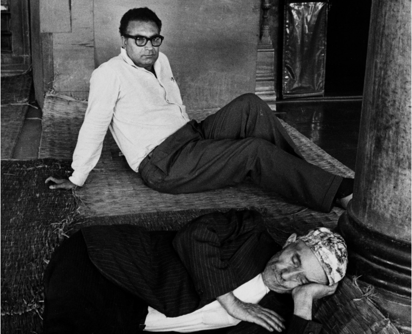
ياشار كه مال - ويتهى ئارا گويله..