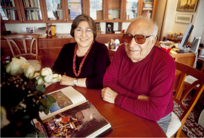
له گه ل خاتوو ناپشه بابان-ی هاوسه ری