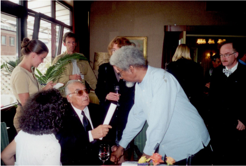
خه لاتی به کیتی نووسه رانی نه رویژ 1997.