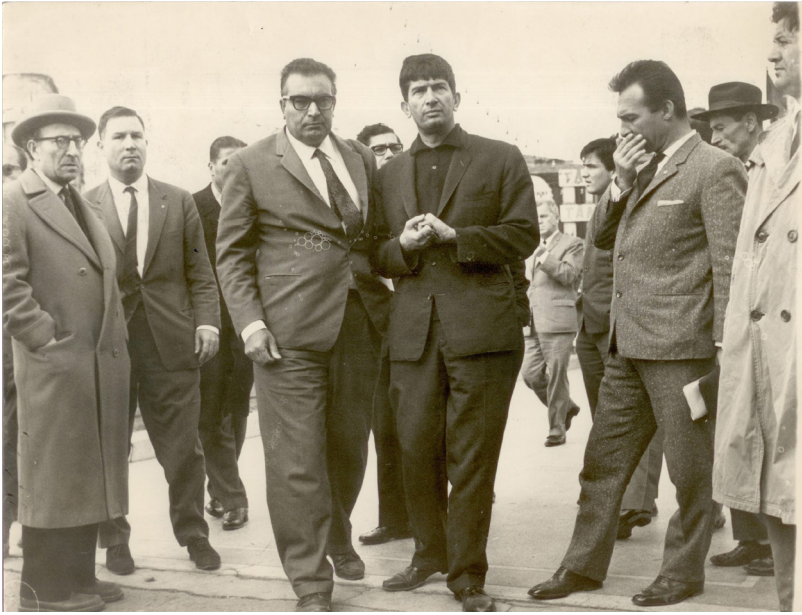
ياشار كه مال سالی 1964 له گه ل كومه نيك نووسه ر و هونه رمه نندا.