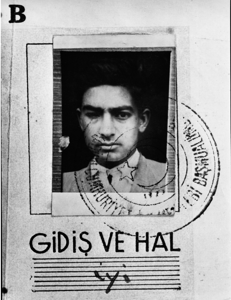
یاشار کهمال - وئنه‌ی سه‌ر ناسنامه