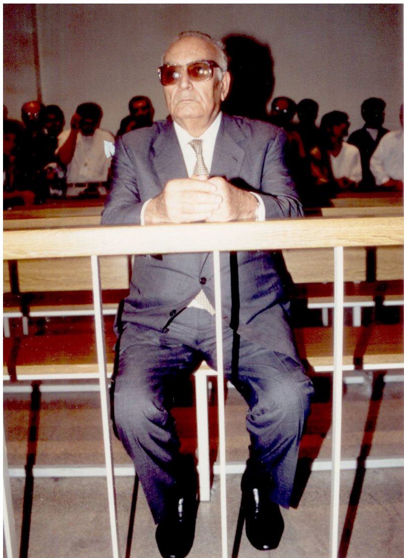
سالی 1995 له بهردهم دادگای ئاسایشی دهوله تدا.