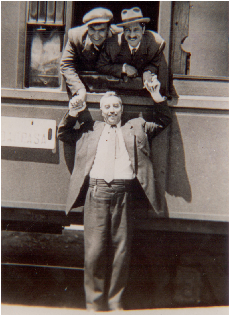
له سالی 1954 له گه شتی روژنامه فانیدا.