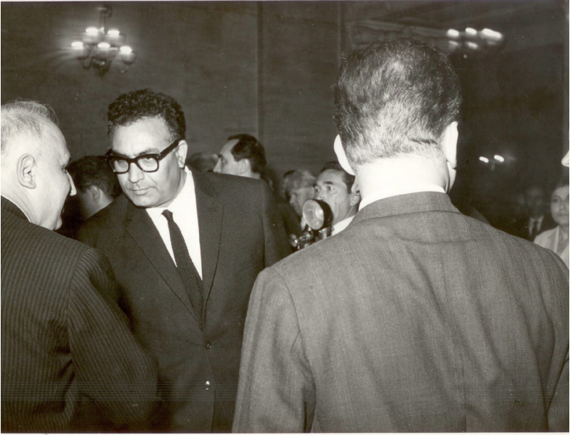
ياشار كهمال لهگه ل سهرۆكى بولگارستان تۆدۆ شيفكوف.