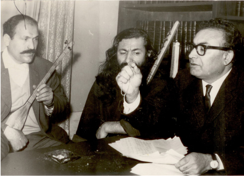
ياشار كه مال له گه ل وه يسهل عاشق - 9/3/1966