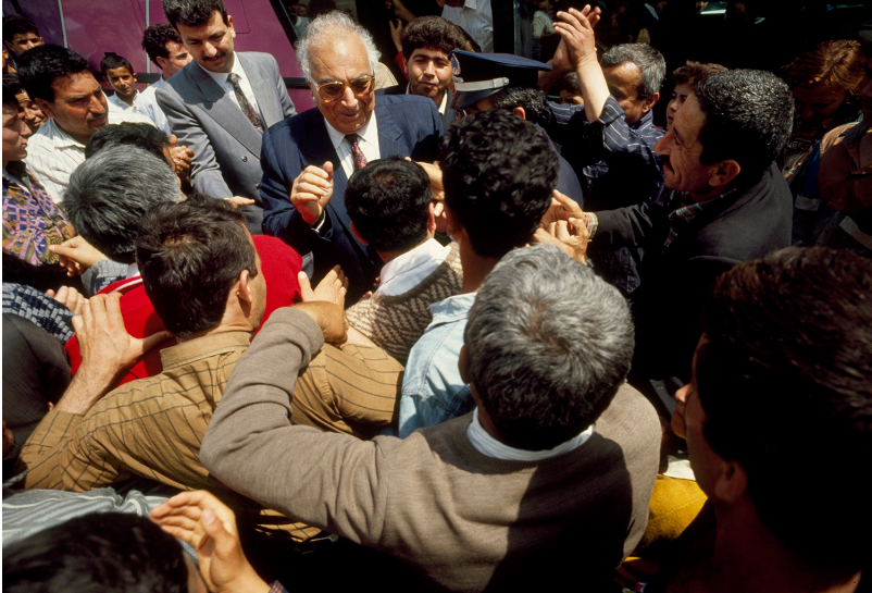
له ټيو خه ټکدا