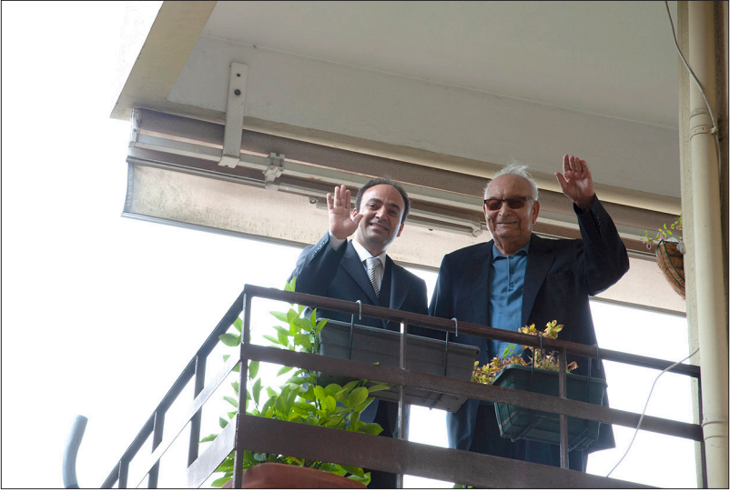
له گه ل ئوسمان بايدهمير، سه روکي شاره واني تامه د.