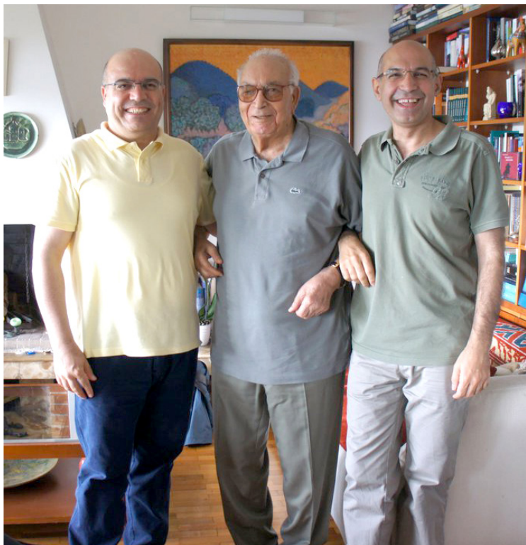
به كړ شوانې، ياشار كهمال، سيروان ره حيم ساڼې 2011.