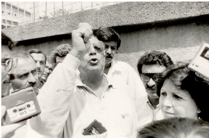
ياشار كه مال - 1987 له بهردهم گرتيگه ي بايرام پاشادا بو پشتگيري بهرخواه داني زندانيان.