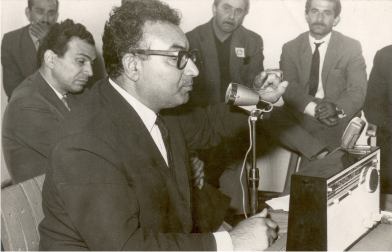
ياشار كه مال سالی 1965 له كۆبوننه وه يه كدا ده ئاخفت.