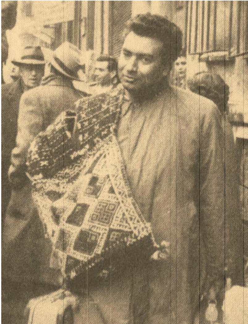
یاشار کهمال - 1963