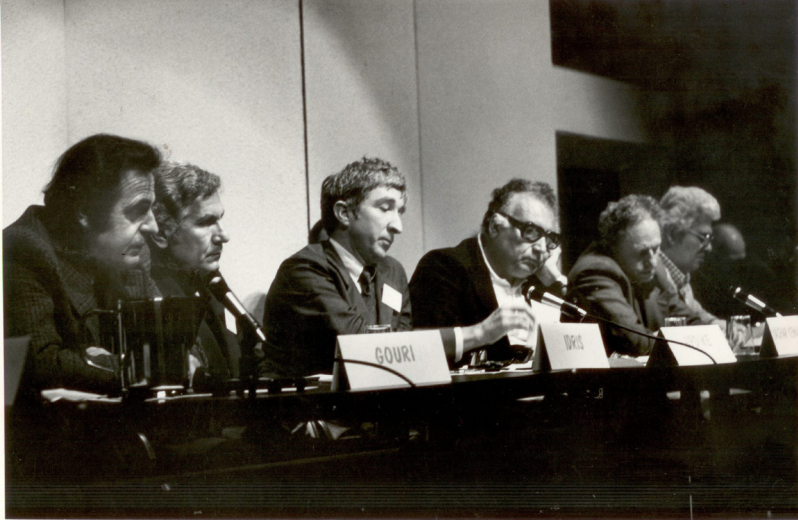
ياشار كهمال له گه ل نووسه رى ئەمهريكايى كورت فۆننگوت له كۆنفرانسېدا.