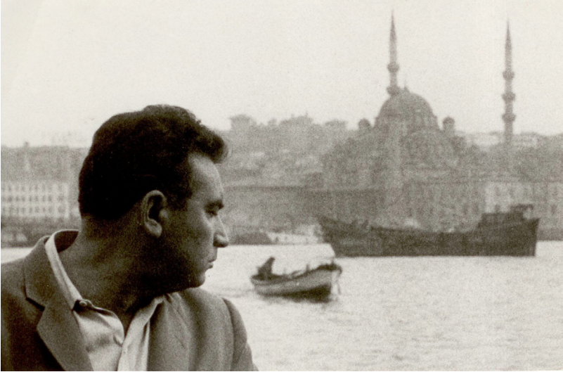
ياشار كه مال سالاني په نجاكان - ئيستانبول.