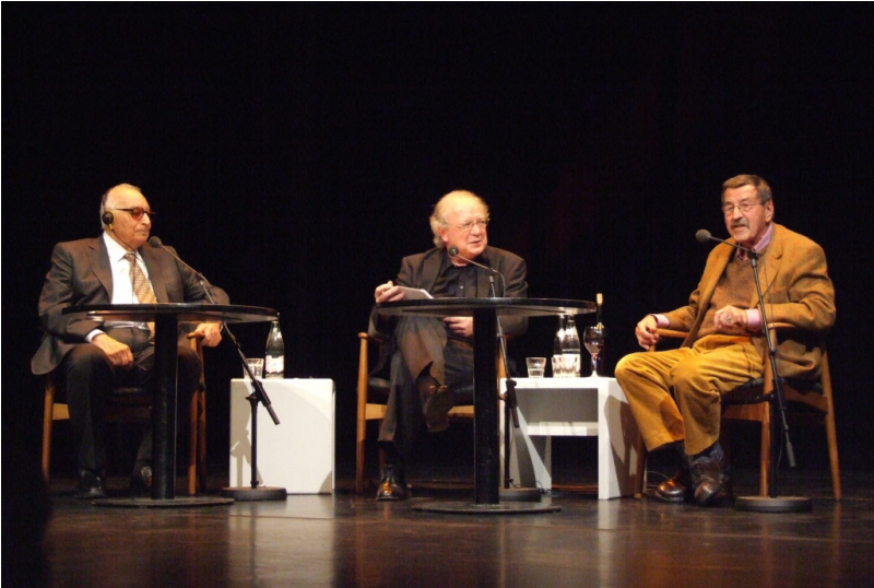
ياشار كه مال و گوینتهر گراس له سه میناریکدا-ئه لمانیا