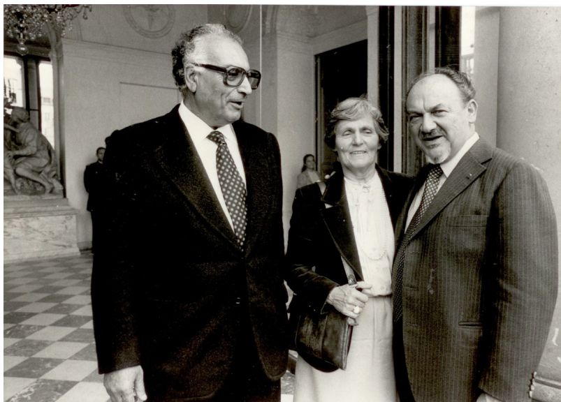
سالی 1984 له گه ل سهرۆکوه زیرانی دانیمارک له پاریس