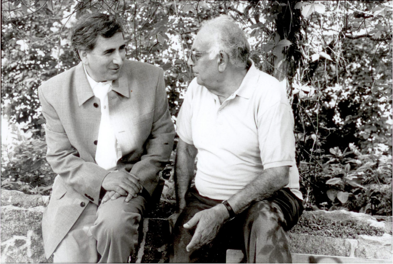
ياشار كه مال و مه مه د ئوزون سالی 1997.