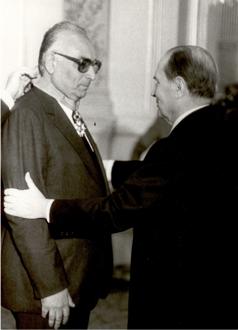
خه لاتی Legion d'Honneur - پيشکه شکردنی له لایه ن سه روکي فهره نسا ف. میتانه وه. سالی 1984