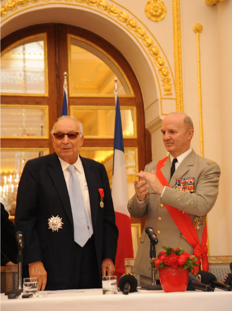
باشار کهمال - سالی 1984 پاریس. فهرانسا . له ناههنگی پیشکه شکر دنی خه لاتی Legion de Honor له لایه ن فرانسوا میتران، سه روکی نهو ده می فهرانساوه.