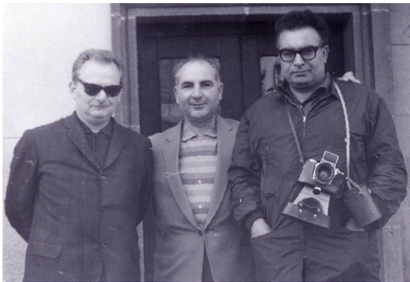
ياشار كه مال سالانی په نجاكان له كاری روژنامه فانیدا.