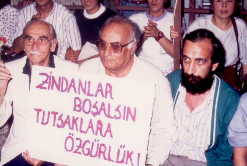
نووسراوی سەر پلاکارتهکه؛ زیندانهکان چۆل بکریڤن، ئازادی بۆ گهراوان.