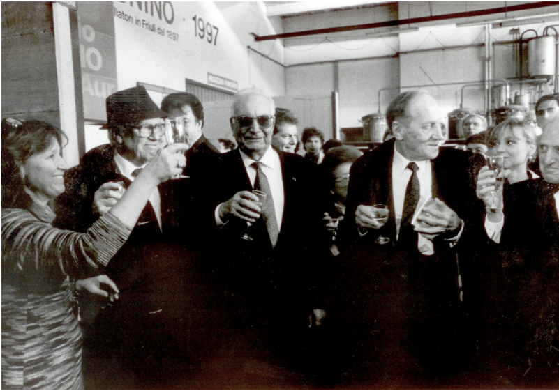
ياشار كه مال - 1997 له كاتي پيشكه شکردنی خه لاتی نازادیی نۆنینه له ولاتی سوید.