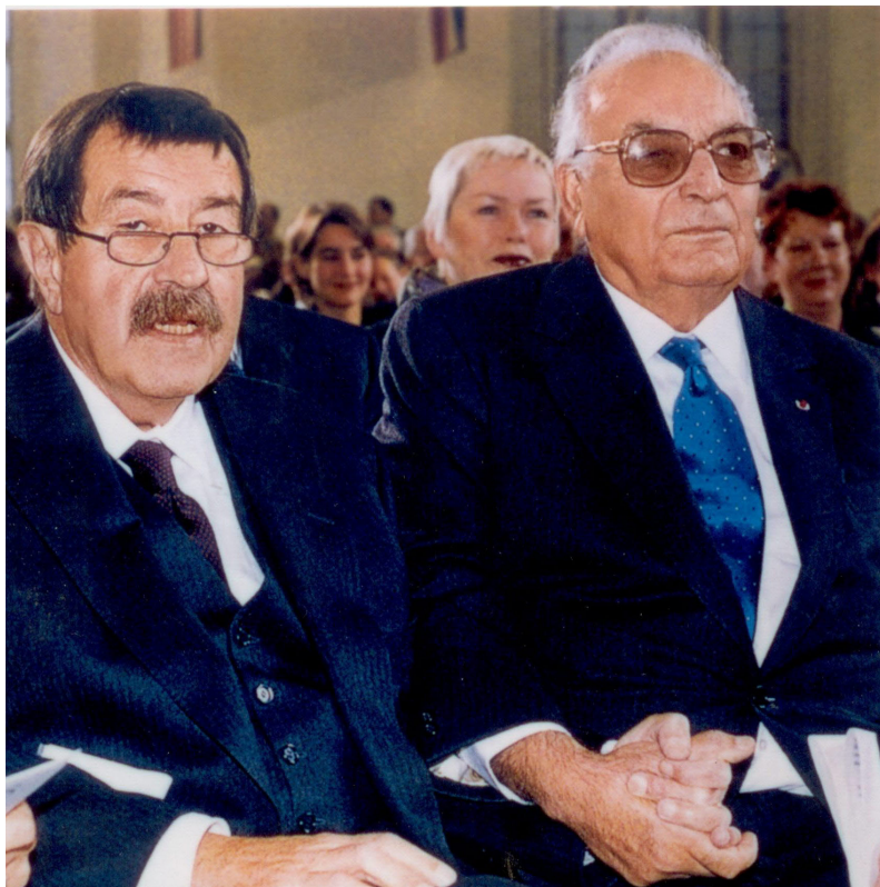
یاشار کهمال - گوینتتهر گراس له که نیسه ی پاول . سالی 1997 شاری فرانکفورت - ئەلمانیا. له ناههنگی پیشکه شکردنی خهلاتی ناشتی کتیبی ئەلمانیادا.