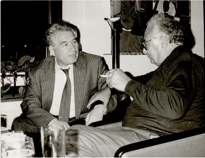
ياشار كه مال له گه ل جه نگیز ئاتیماتوؤف (1928-2008) نووسه ری کیرگیزستانی.