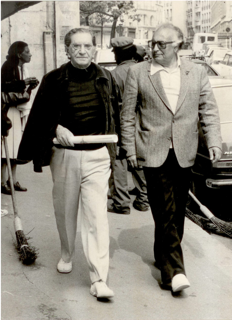
ياشار كه مال له گه ل عابدين دينو. پاریس 1982.