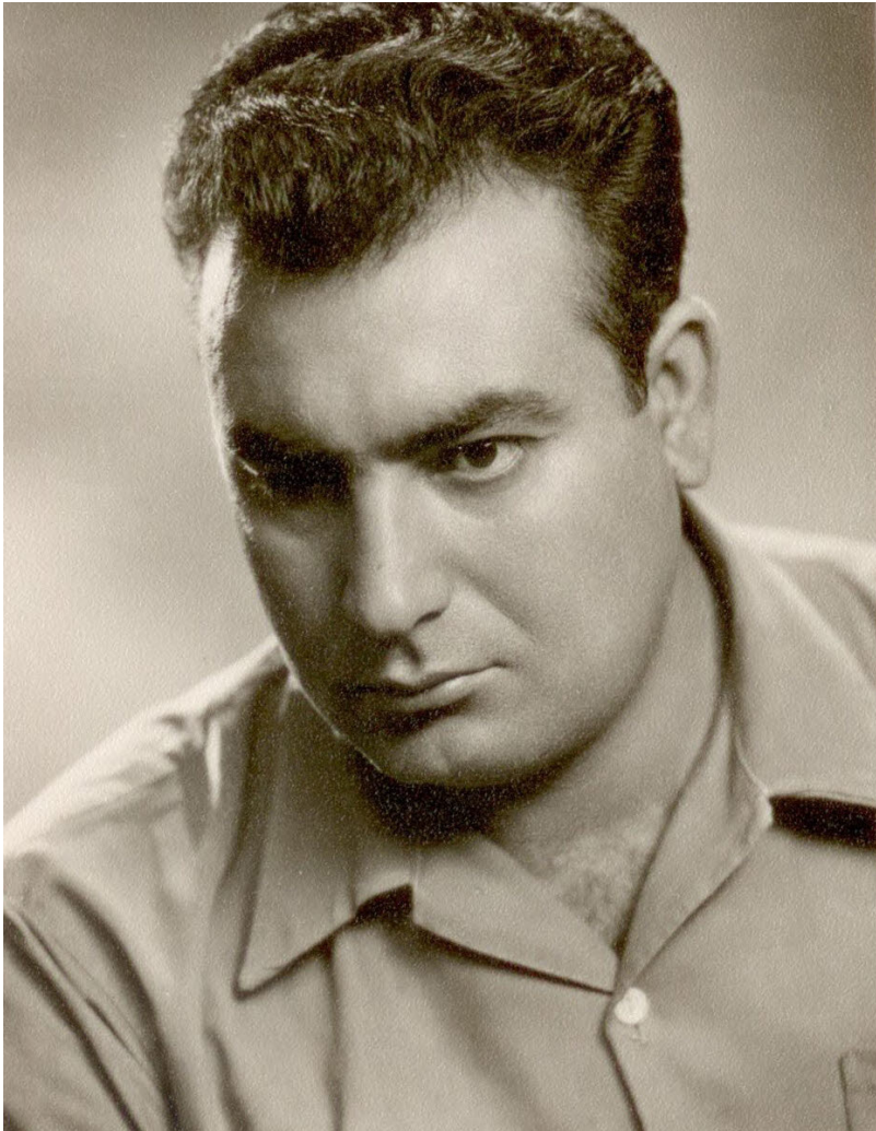
ياشار كەمال لە ستودىيۇ تانزۇ