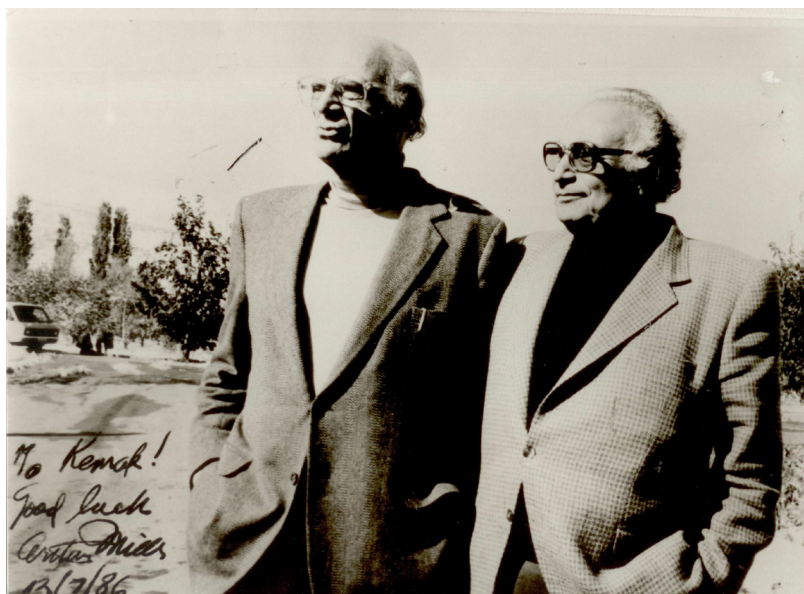
یاشار کهمال له گهټ ټارسه‌ر میلیه‌ر (1915-2005).