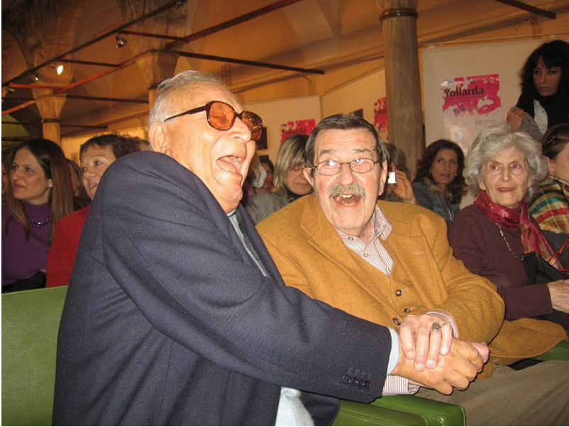
هاورپټيه تيبه كي گزنگ. گراس و ياشار كه مال، پټكه نين له دلوه.