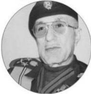
هسين رشيد التكريتي