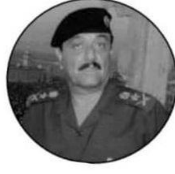
صابر عبدالعزيز الدوري