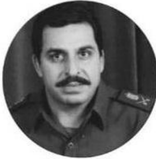
تزار الخزر جي