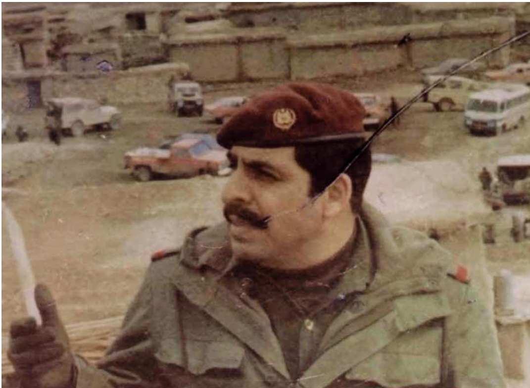
نزار خهزره جی فه رمانده ی فه یله قی به ک له کاتی توانی نه نفالدا