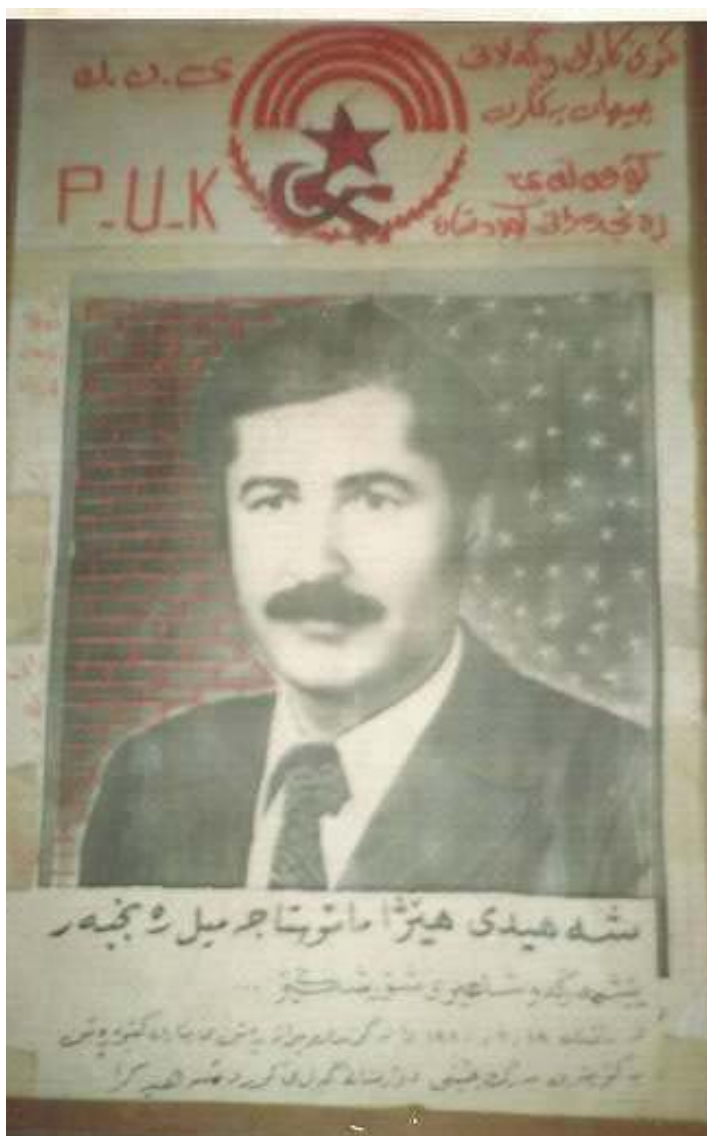
پوستہری گیانپہ ختکردوو جہمیل رنجبہر لہ کاتی راپہرین