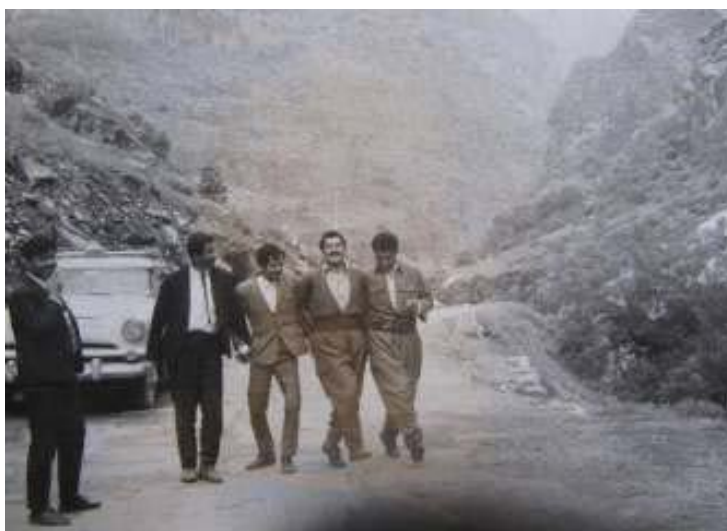
جھمیل رھنجیہ ر لھ گھل چھ نھ ہاورئیہ کی لھ نھوجی لاونتیڈا لھ گھشتیکیان بھوکانی ماران لھ