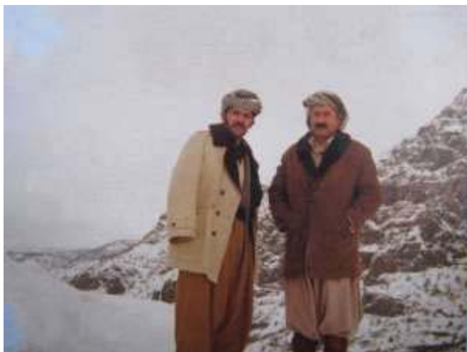
جھمیل رھنجیہ ر و نھرسہ لان بایز سائی ۱۹۸۰