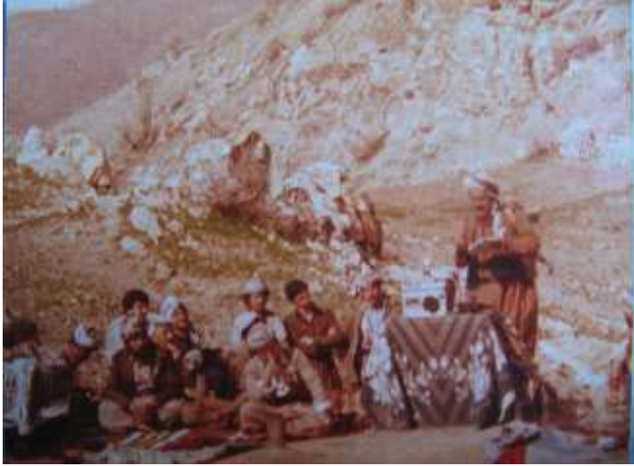
ناهنگی دەرچیوونی خوونی کادیرانی کۆمه ئه‌ی مارکسی – لینیینی کوردستان خپری ناوزه‌نگ سائی ١٩٨٠ چه‌میل ره‌نجبه‌ر و هه‌قشال کویستانی و شه‌هاب عوسمان شیعر بو‌هاوسه‌نگه‌ره‌کانیان ده‌خویننه‌وه.