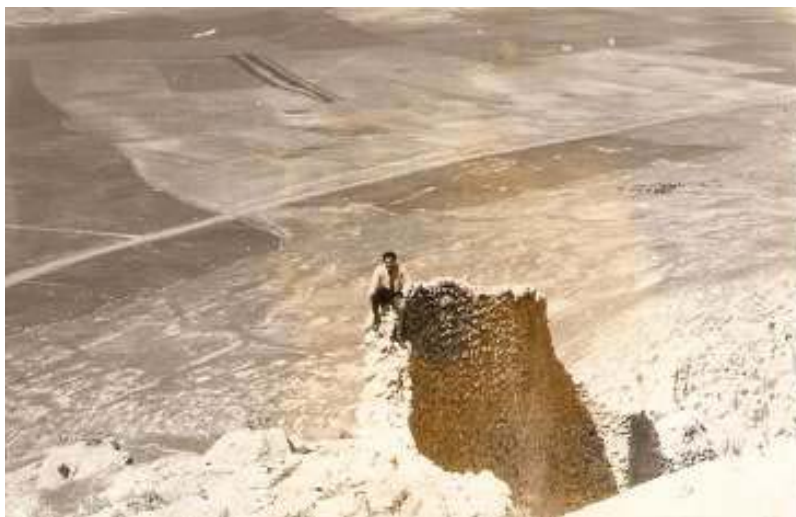
جهمیل رهنجبه ره سه ر لیواری پاشماوهی یه کییک له دیواره شوینه واره دیرینه کانی کوردستان که به دا خوه نازا نریت کوئییه و که ی وینه که چرکینراوه .