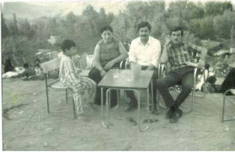
جه میل رهنجبر، سه عادهتی هاوسه ری و وریای برای هاوسه ری رهنجبر. نهم وینهیه نه شه قلاوه گیراوه.