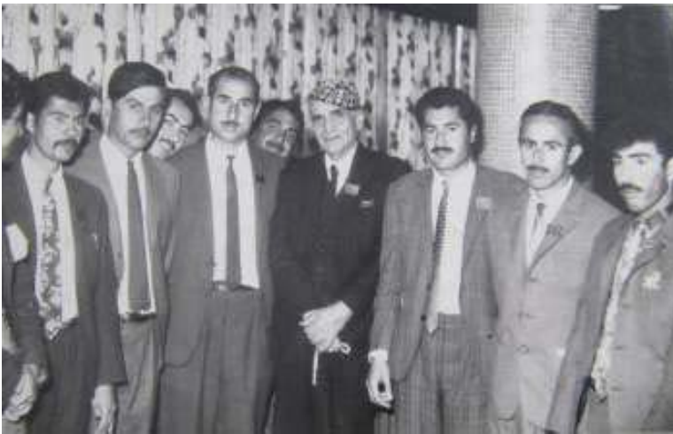
له راسته وه مه جید هیرش، محه مه د هه سه ن مه نگووری، جهمیل رهنجبهه، جهواهیری شاعیر و مدحه ت بیخه و مسته فا رابه، جهوهه کرمانج نه م وینه یه له شاری به غدا له ده یی هه فتاکانی سه ده ی را بردوو گیراوه.