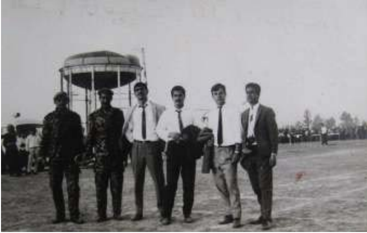
جهمیل رهنجبهه لهگه ئ چه نده هاوړتیه کی له یاریگای (مه لعه ب) ی شاری هه و لیر ده یی هه فتاکانی سه ده ی را بردوو.