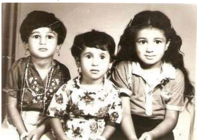
هر سه جگه رگۆشه که ی جهمیل رهنجبه ر بویر و هه ریار و هه ره وه ز پیده چیت له ناوه راستی دهیه ی جهفتاکانی سه دهی رابردوو چرکینرا بیت .