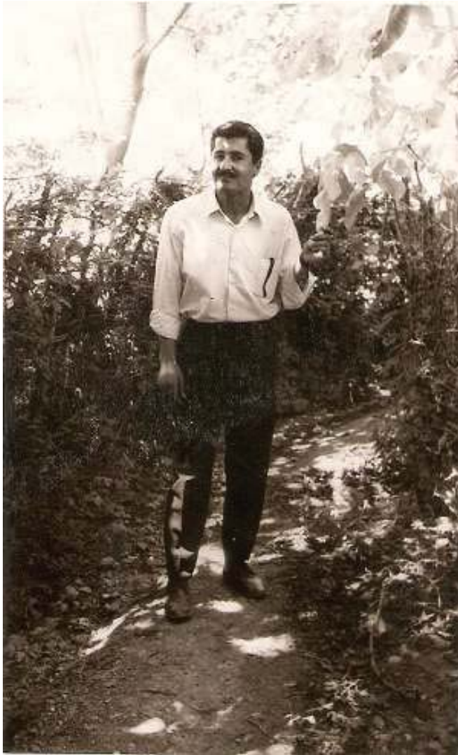
جه میل رهنجبهری شاعیر له په نای سینهری درهخته کانی کوردستان